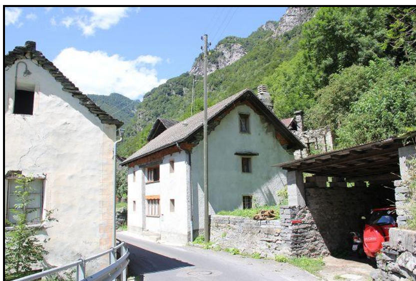
Casa / Haus