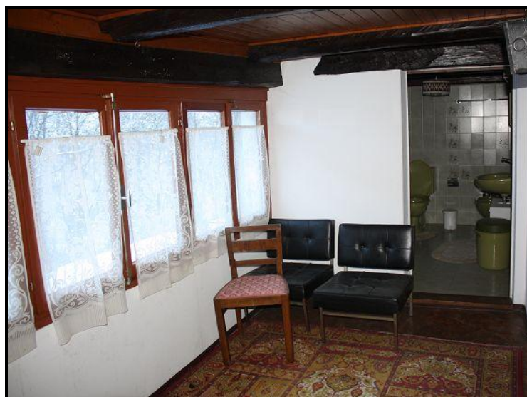
Atrio nel primo piano / Atrio im 1. OG