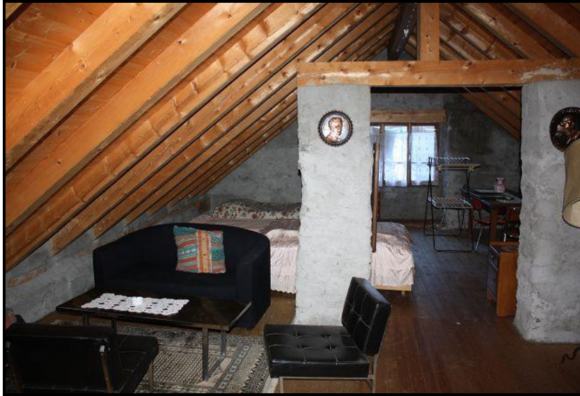
Camera sotto tetto / Dachraum