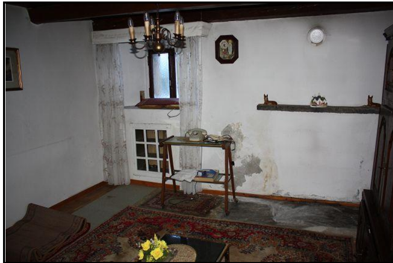
Soggiorno / Wohnraum