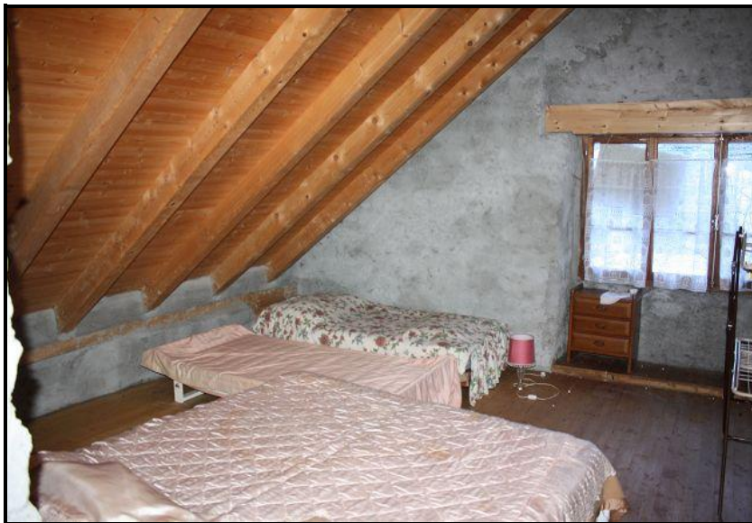
Camera sotto tetto / Dachraum