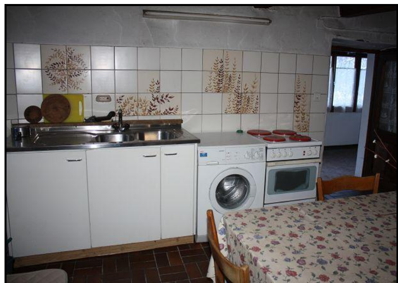
Cucina abitabile / Wohnküche