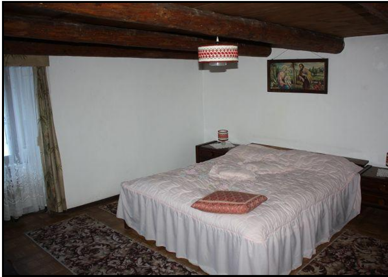
Camera / Zimmer