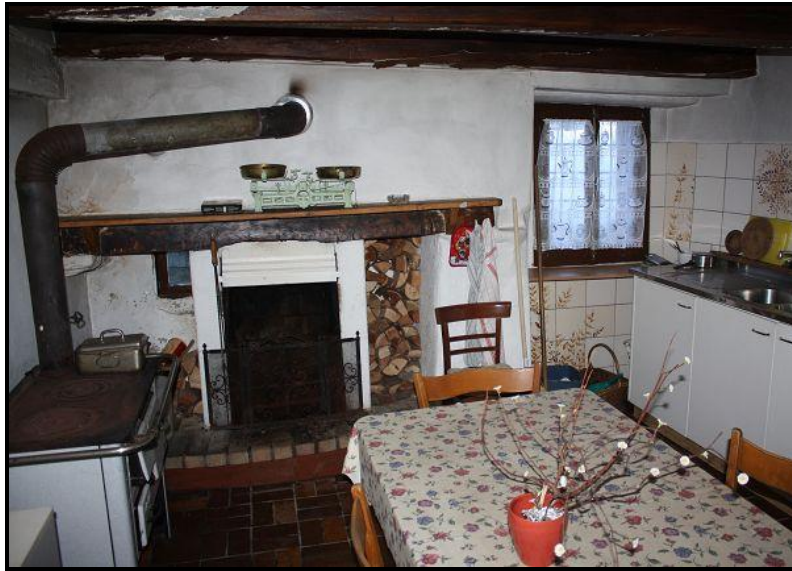
Cucina abitabile / Wohnküche