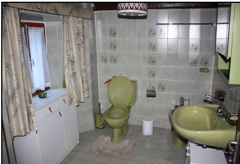
Doccia / WC