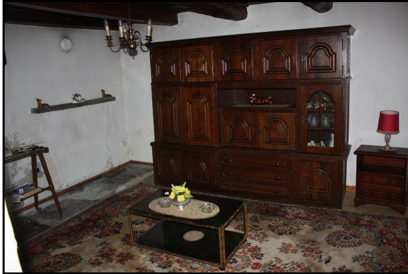
Soggiorno / Wohnraum