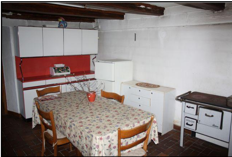
Cucina abitabile / Wohnküche