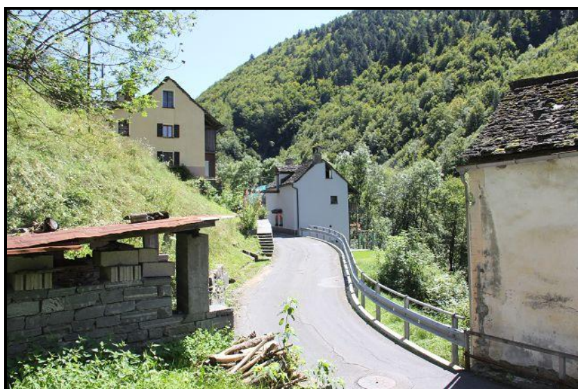
Vista est con giardino sotto / Ostblick mit untenliegendem Garten