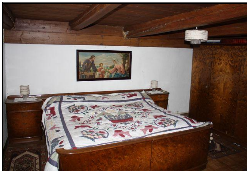
Camera / Zimmer