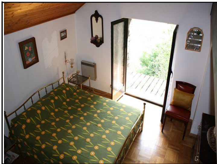
Camera grande / Schlafzimmer