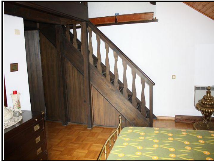
Camera grande / Schlafzimmer