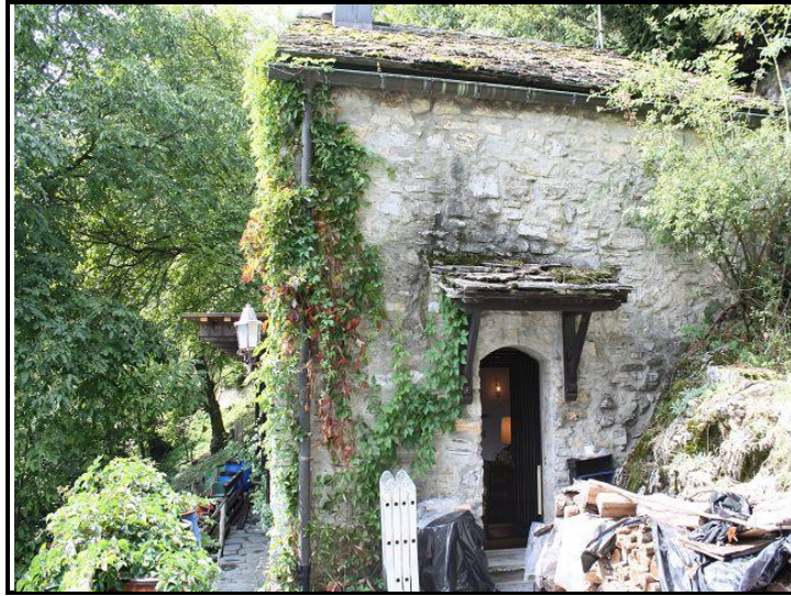
Entrata est / Osteingang