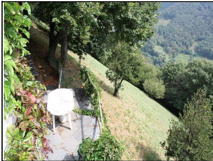
Cortile con prato / Sitzplatz mit Wiesland