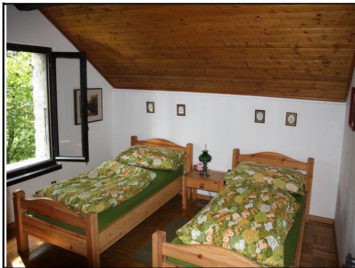
Camera / Zimmer