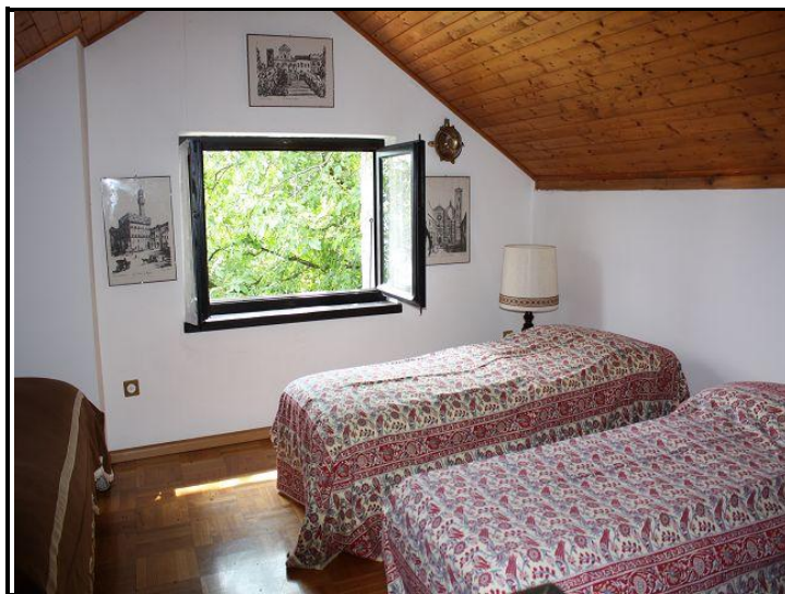
Camera sotto tetto / Mansardezimmer