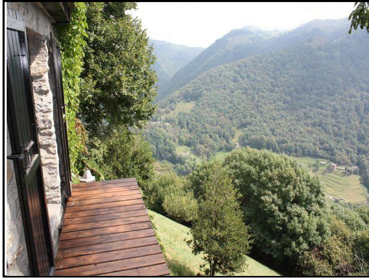
Balcone con vista / Balkon mit Ausblick