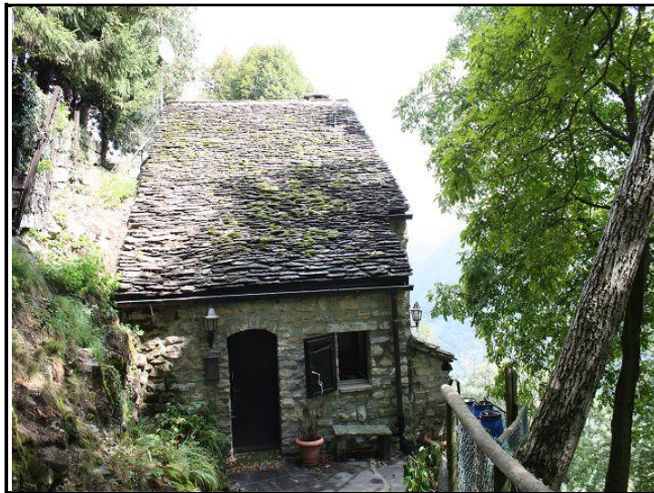
Entrata ovest / Westeingang