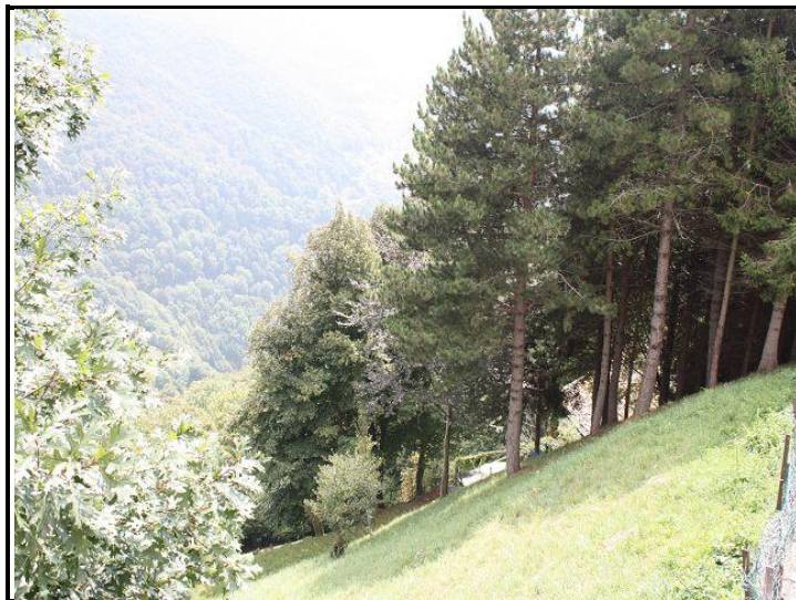
Vista dalla chiesa / Blick von der Kirche aus