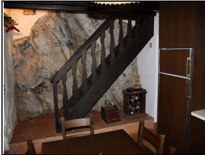
Scala / Treppenaufgang