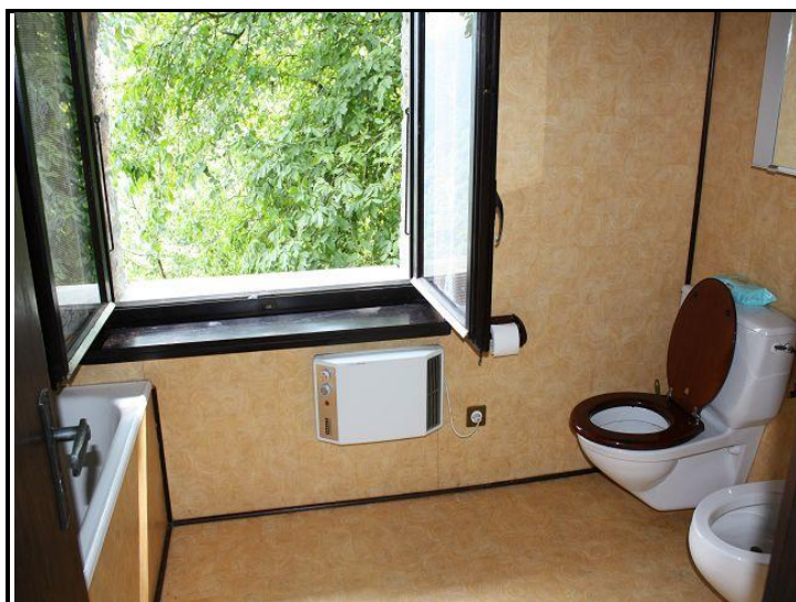
Bagno / Bad