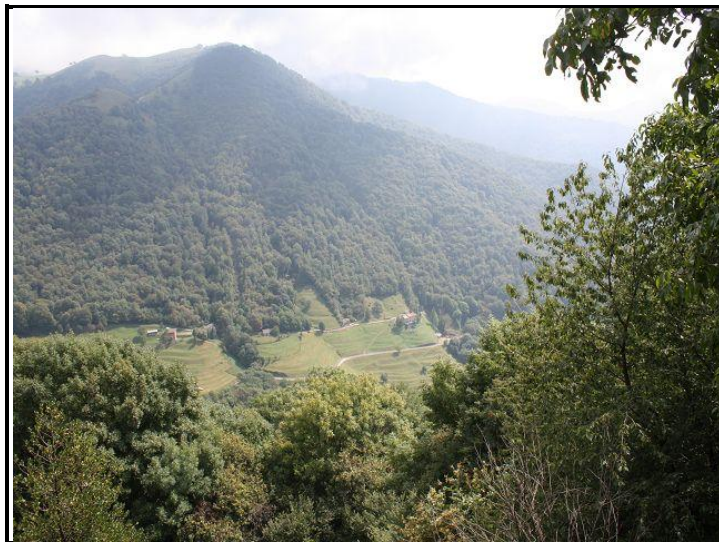
Vista verso sud / Blick nach Süden