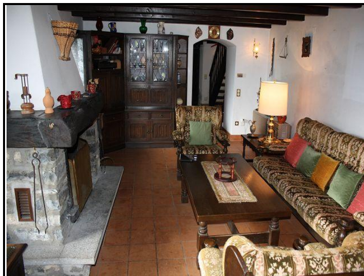
Soggiorno con camino / Wohnraum mit Kamin