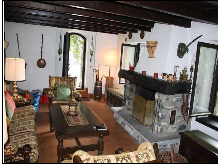
Soggiorno con camino / Wohnraum mit Kamin