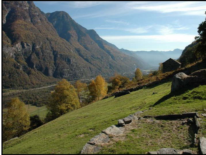
Vista verso sud / Blick nach Süden