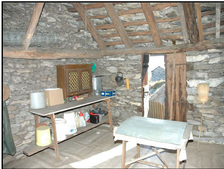
Interno / Dachraum