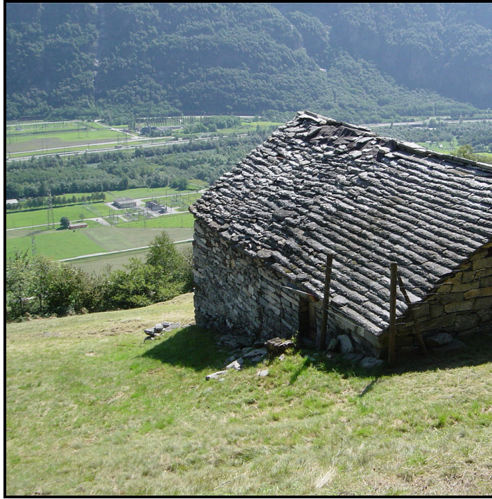
Facciata nord / Nordfassade