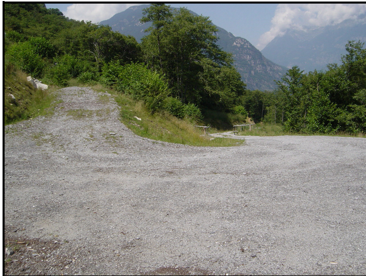
Parcheggio / Parkplatz