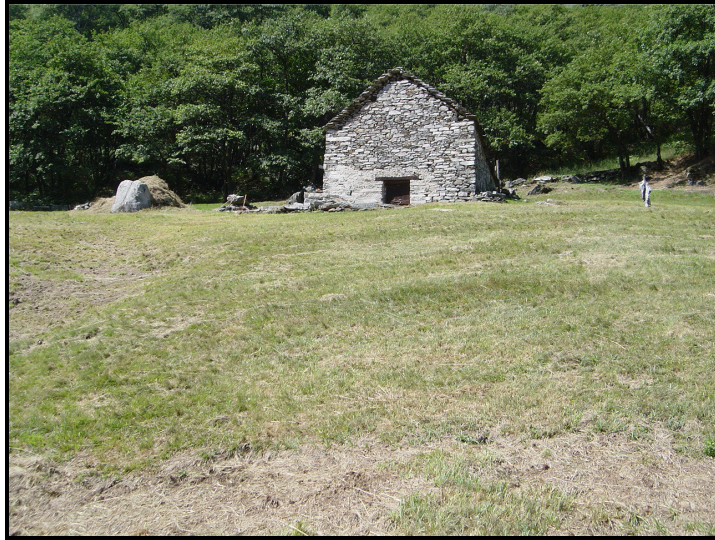
Facciata est / Ostfassade