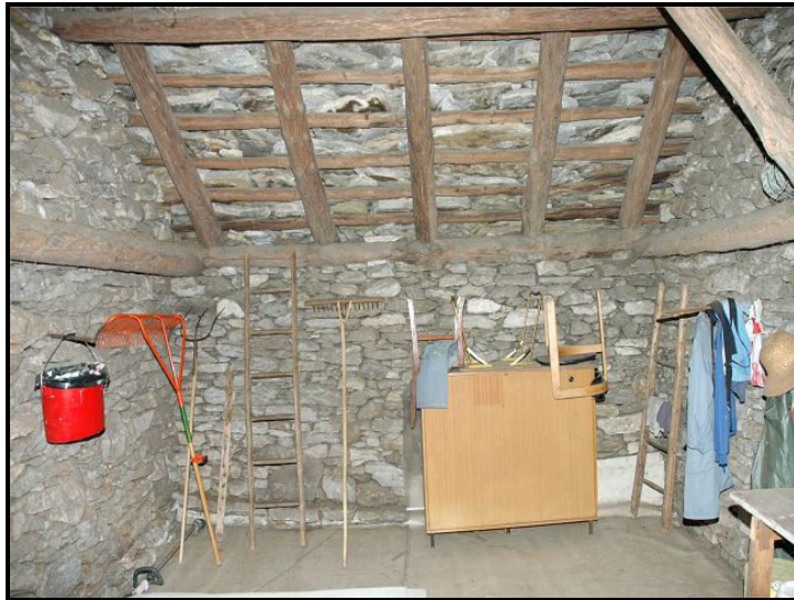
Interno / Dachraum