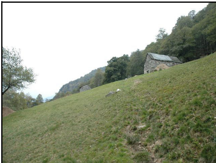
Vista da sotto / Blick von unten