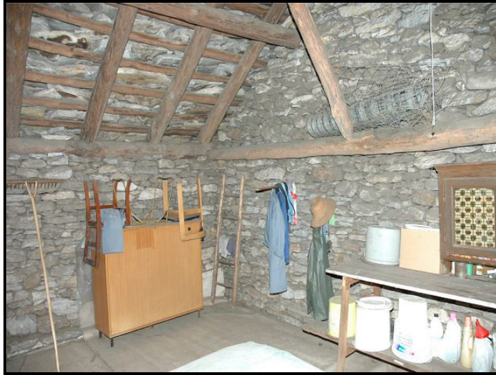
Intero / Dachraum