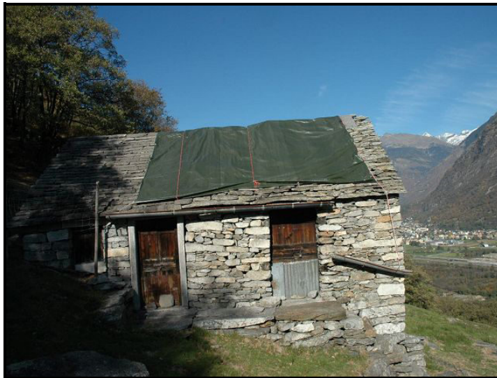
Facciata sud / Südfassade