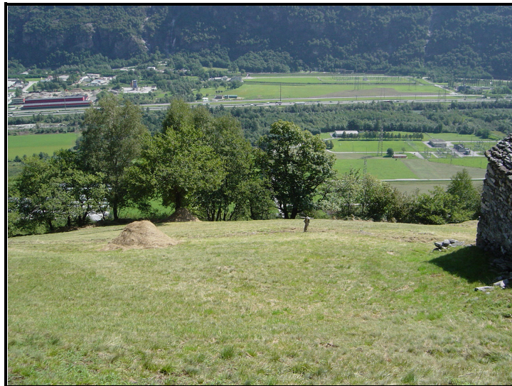
Vista verso Iragna / Blick auf Iragna