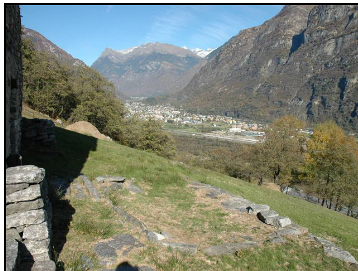
Vista verso Biasca / Blick nach Biasca