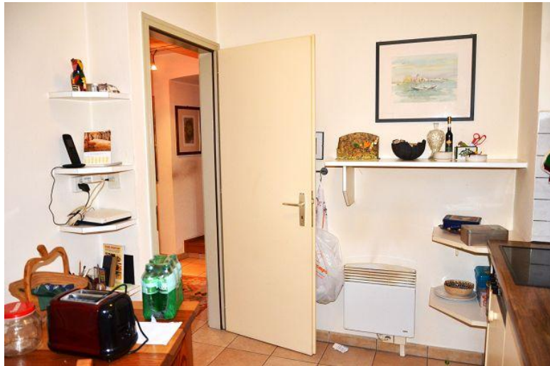
Wohnküche / cucina abitabile