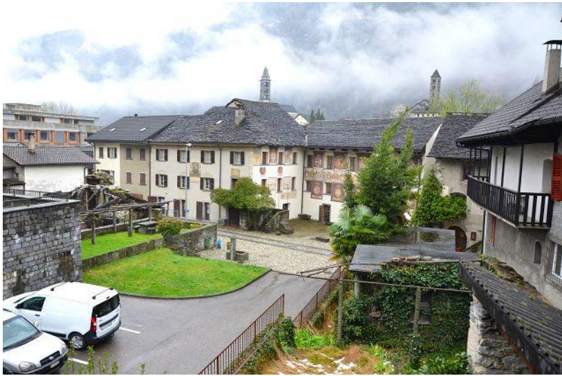
Ausblick / vista