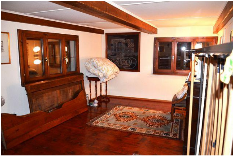
Zimmer / camera