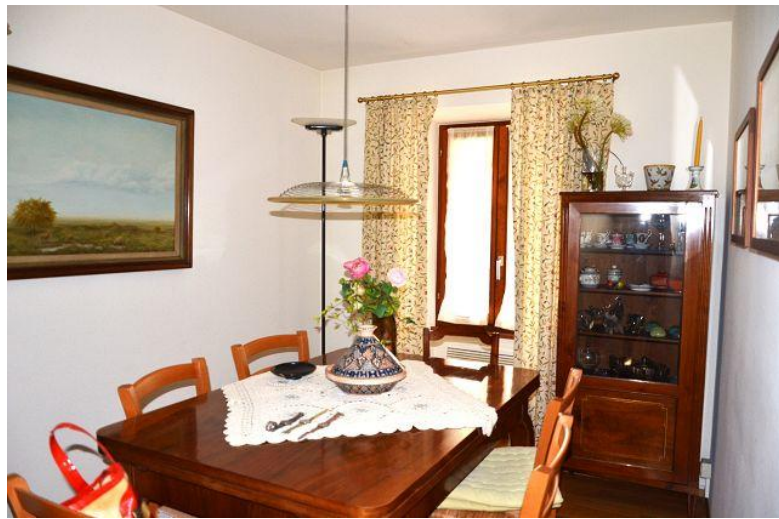
Zimmer / camera