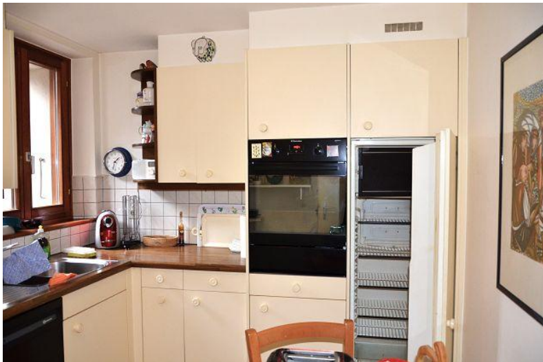
Wohnküche / cucina abitabile