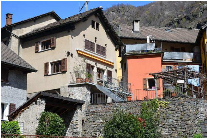
Haus mit Terrasse / casa con terrazza