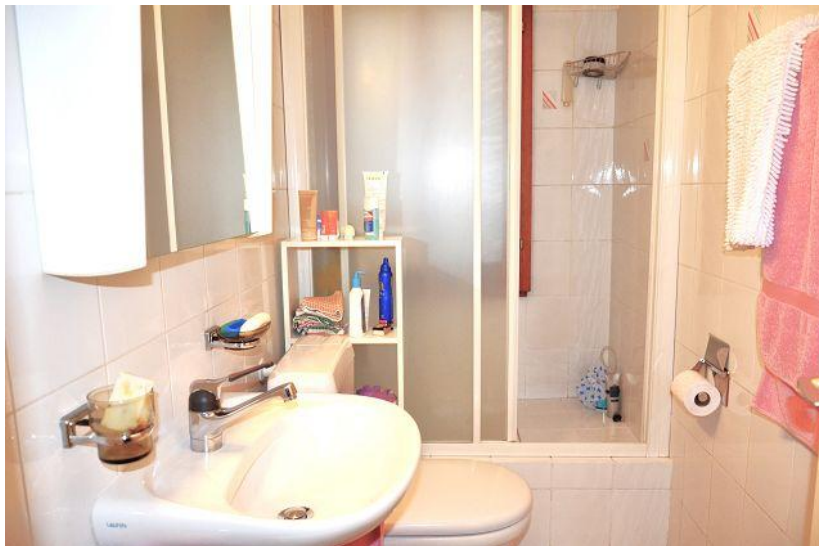
Dusche / doccia