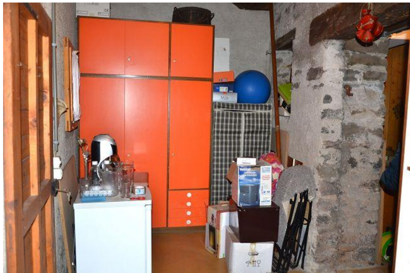
Keller / cantina