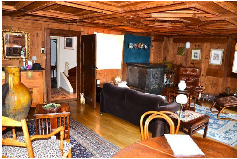
Wohnraum / soggiorno