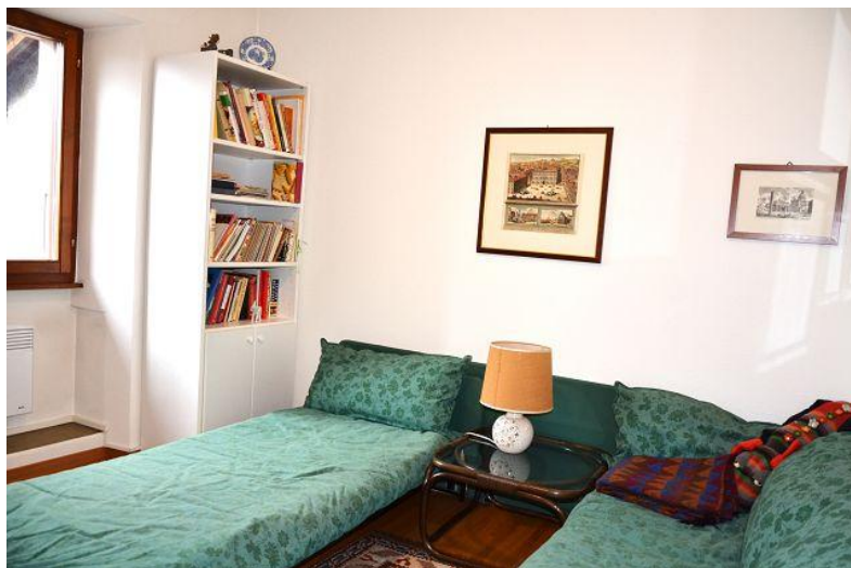
Zimmer / camera