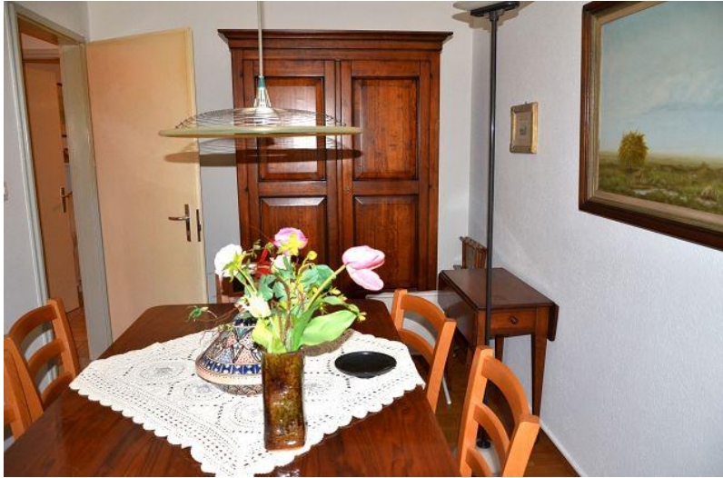
Zimmer / camera