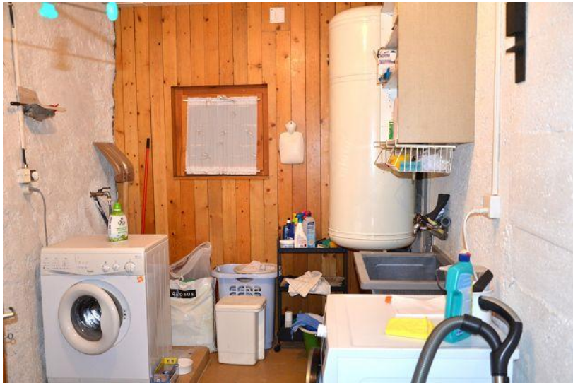
Waschküche / lavanderia