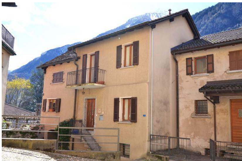
Haus / casa