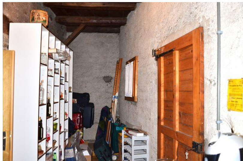
Keller / cantina