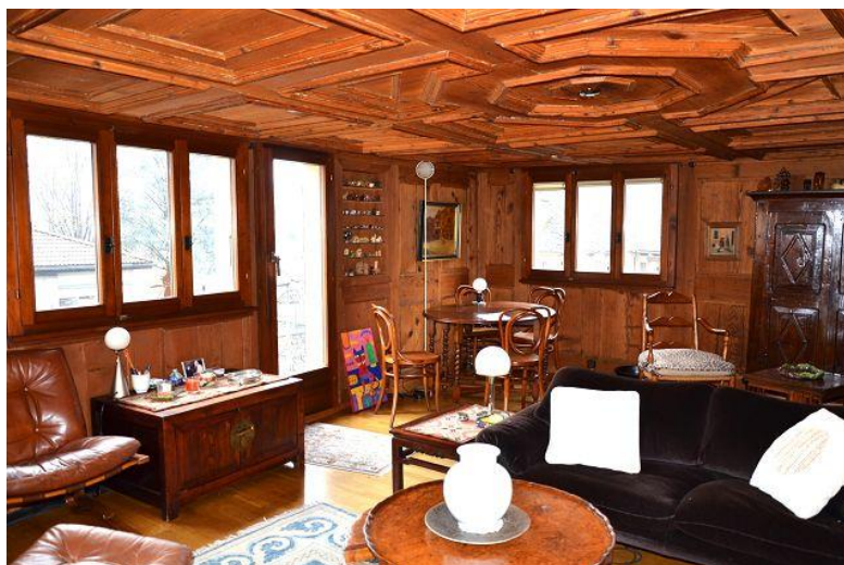
Wohnraum / soggiorno