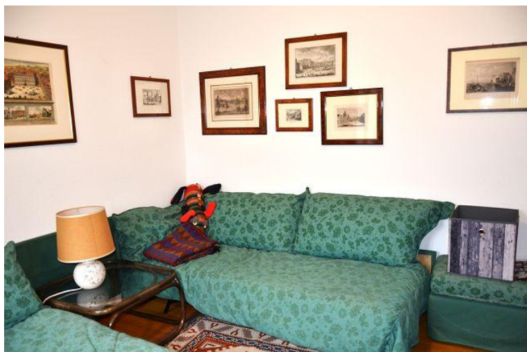
Zimmer / camera