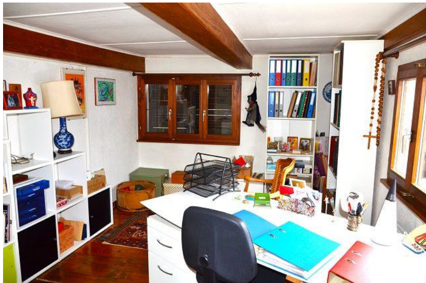
Zimmer / camera