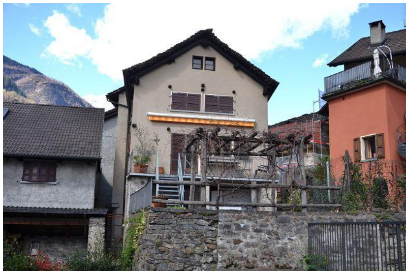
Haus mit Terrasse / casa con terrazza