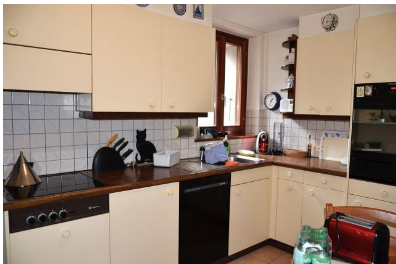
Wohnküche / cucina abitabile