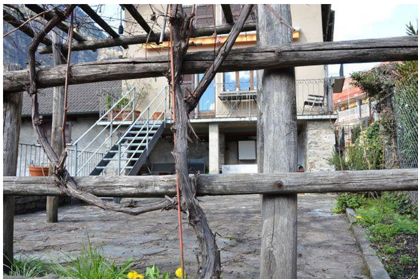
Haus / casa