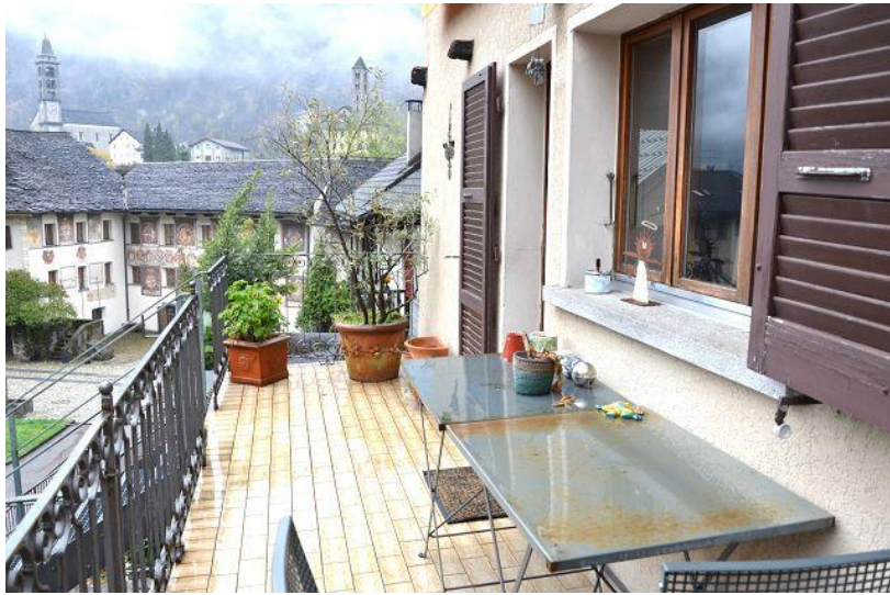
Terrasse / terrazza