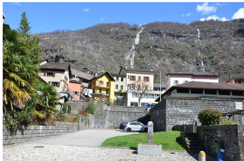
Ausblick / vista