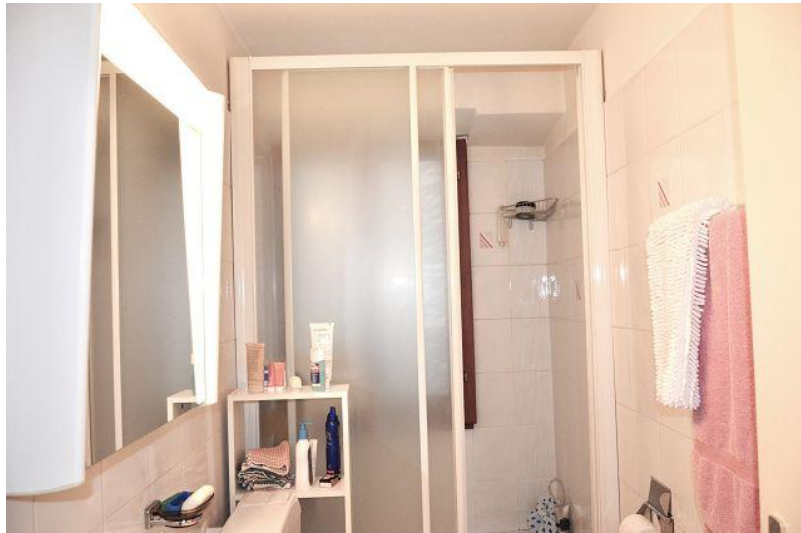
Dusche / doccia