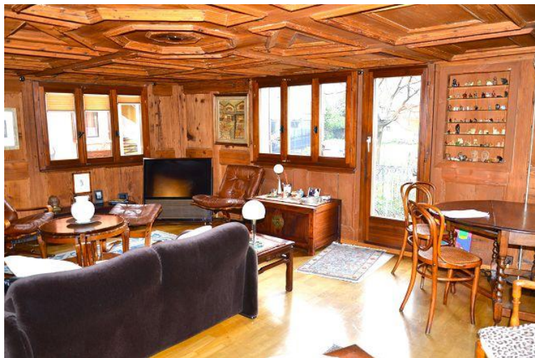
Wohnraum / soggiorno