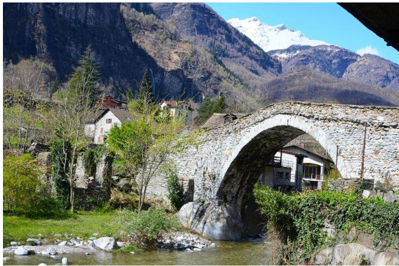
Ausblick / vista