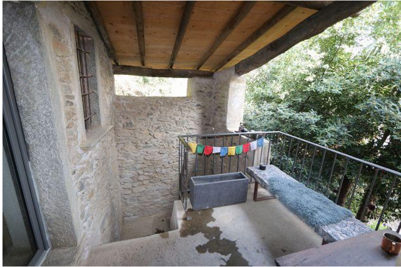
Treppenaufgang / scala