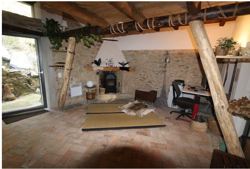
Wohnraum / soggiorno