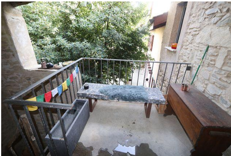
Balkon beim Wohnungseingang / balcone all'accesso