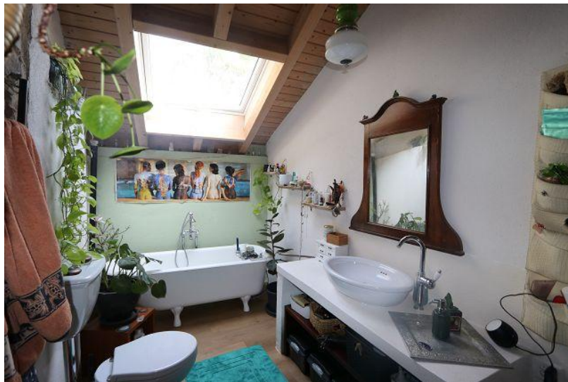
Bad / bagno