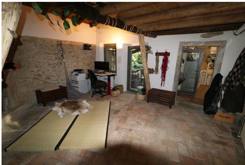
Wohnraum / soggiorno