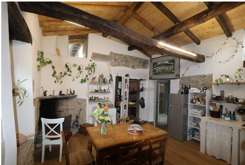
Wohnküche / cucina abitabile