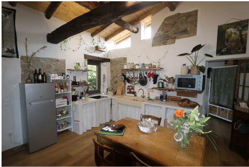
Wohnküche / cucina abitabile