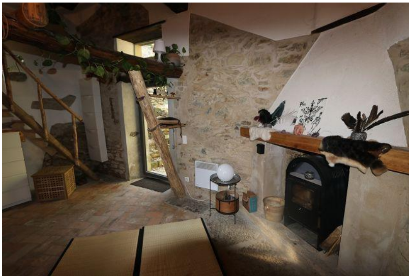
Wohnraum / soggiorno