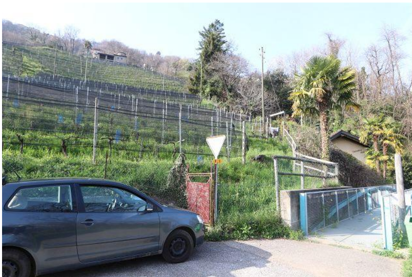
Zugang und Rebberg / accesso e vigna