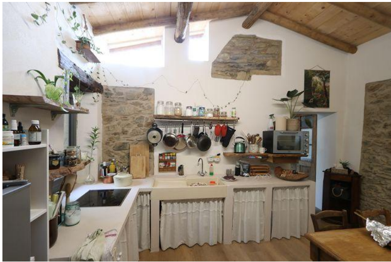
Wohnküche / cucina abitabile