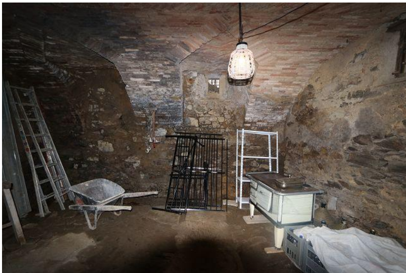
Keller / cantina