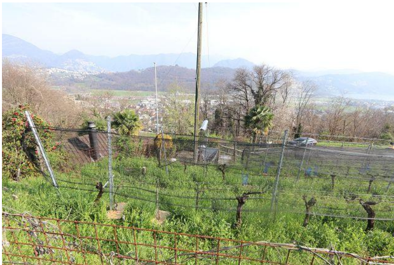
Aussicht mit Seeblick / vista anche sul lago