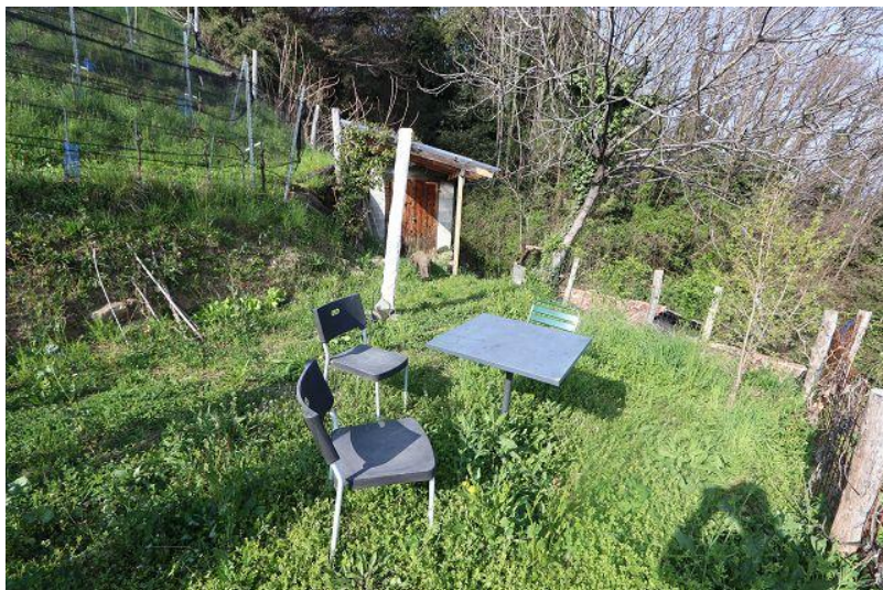
Gartensitzplatz / giardino