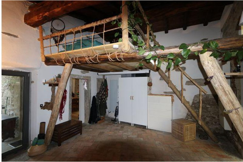
Wohnraum mit Schlafgalerie / soggiorno con sopralalco