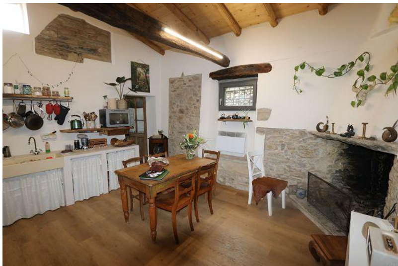
Wohnküche mit Kamin / cucina abitabile con camino