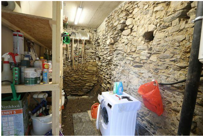
Keller und Waschküche / cantina e lavanderia