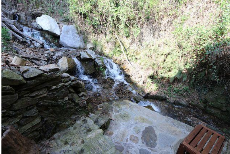
Bach / riale