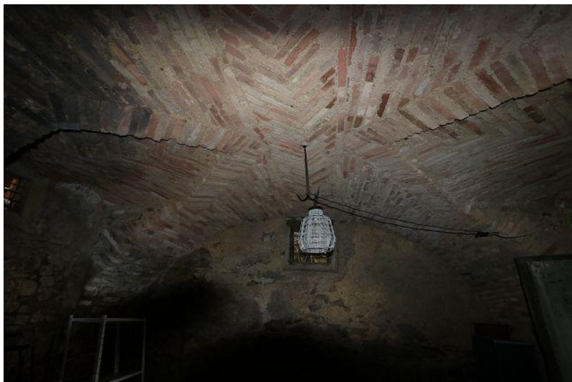
Kellergewölbe / tetto della cantina