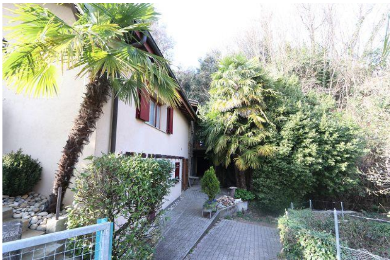
Zugang / accesso