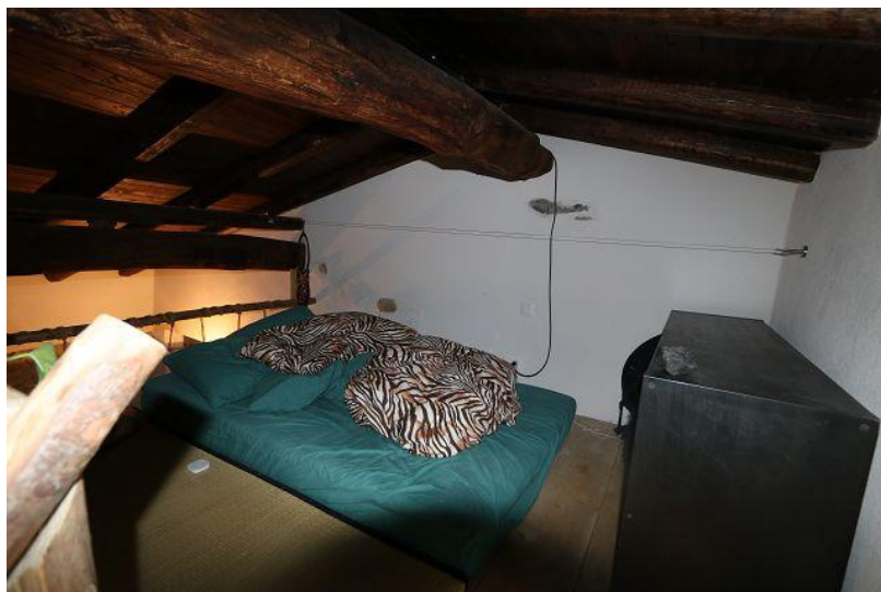
Schlafgalerie / sopralalco