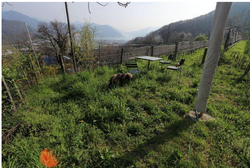
Gartensitzplatz mit Seeblick / giardino con vista lago