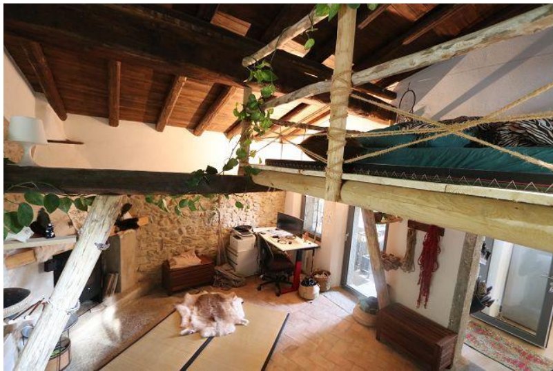
Wohnraum mit Schlafgalerie / soggiorno con sopralalco