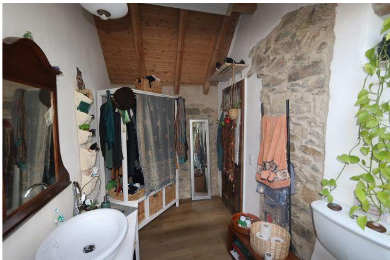
Bad / bagno