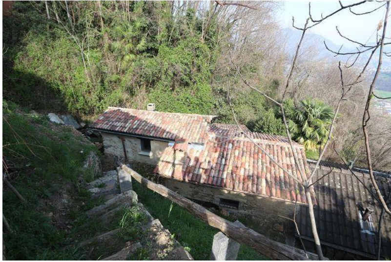
Blick zum Gebäude / vista verso stabile