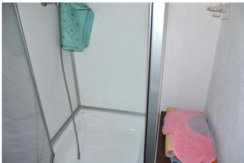
Dusche / doccia