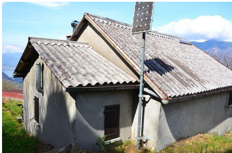
Haus / casa