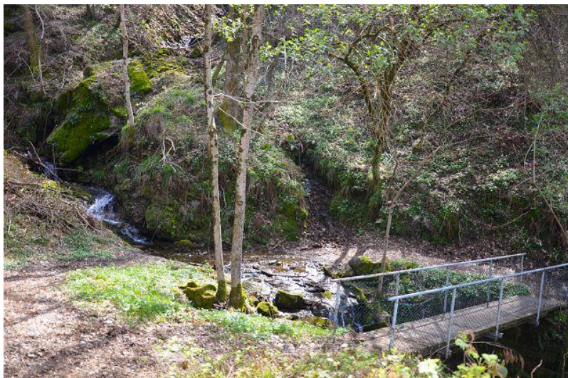
Umgebung / dintorni