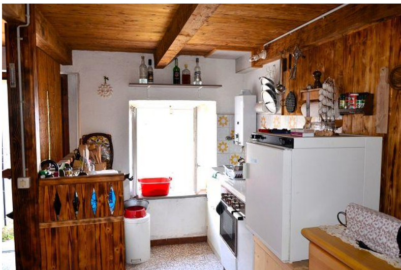
Küche / cucina