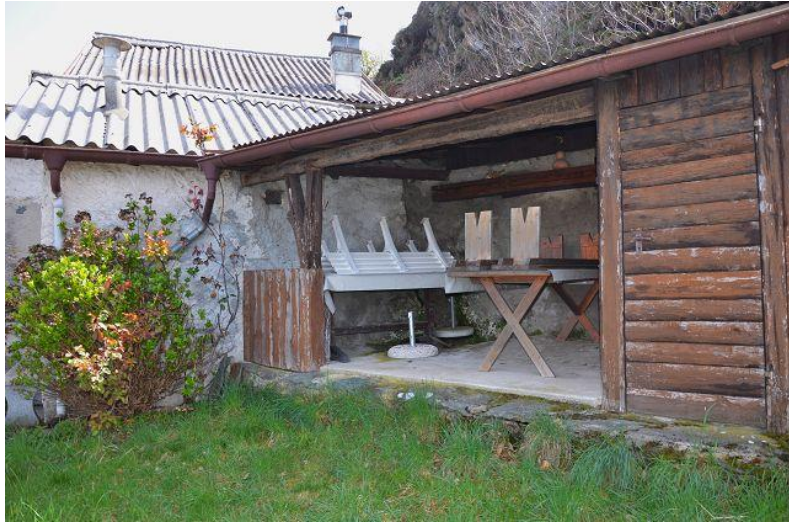
Schuppenhaus / capanna