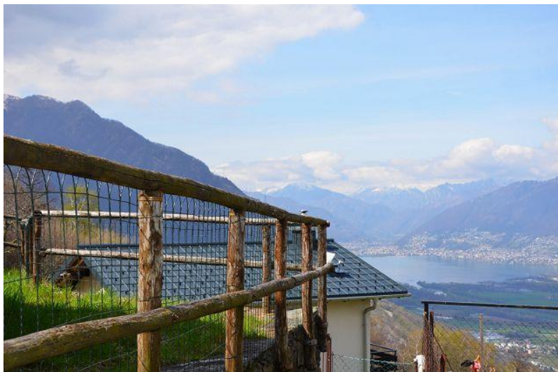
Aussicht / vista