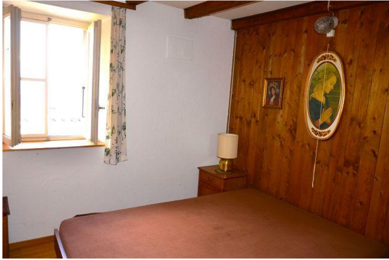
Zimmer / camera