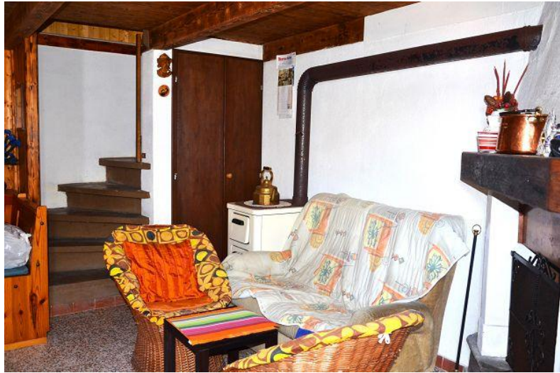
Wohnbereich / soggiorno