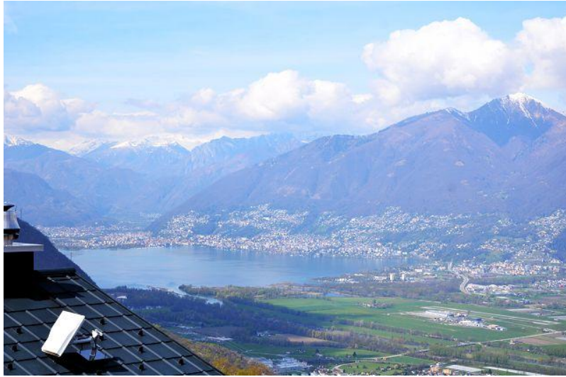
Aussicht / vista