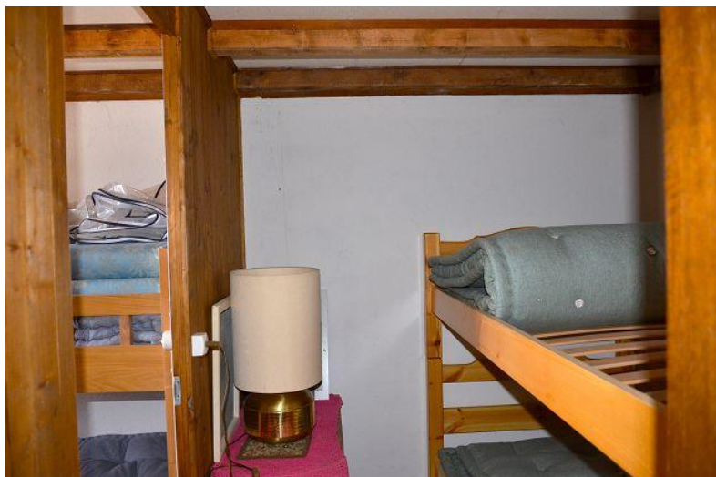
Verbindungszimmer / camera comunicante