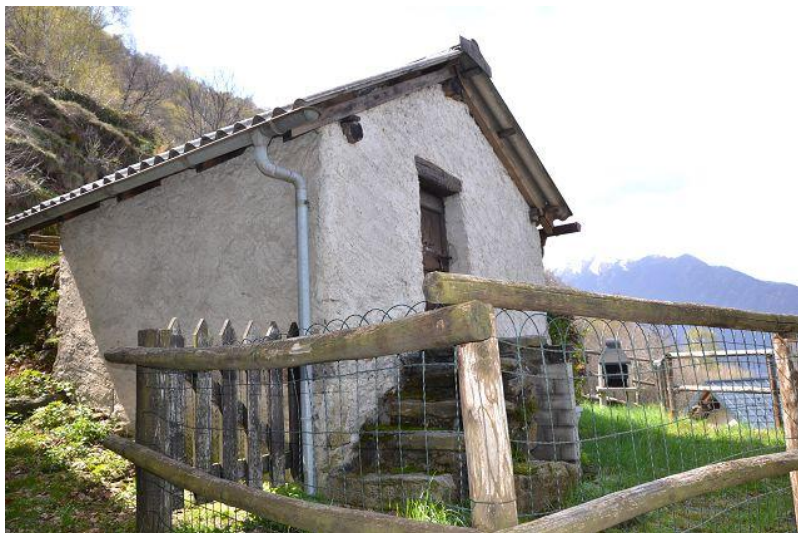
Rustico / rustico