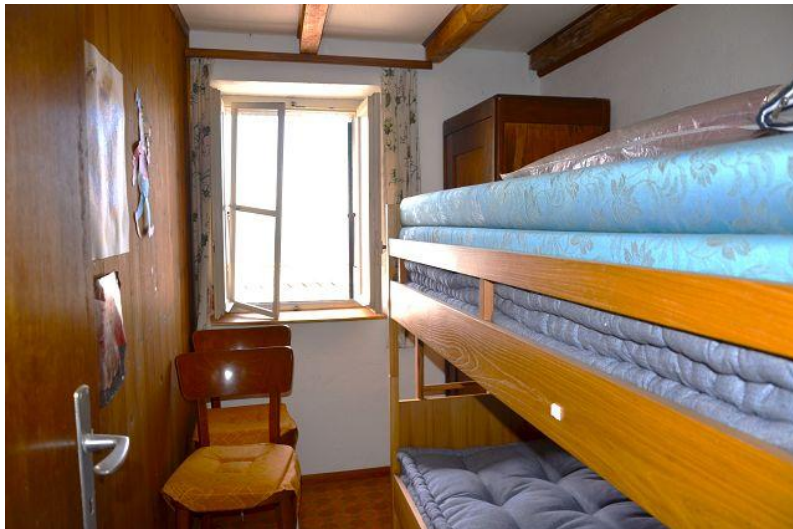
Zimmer / camera