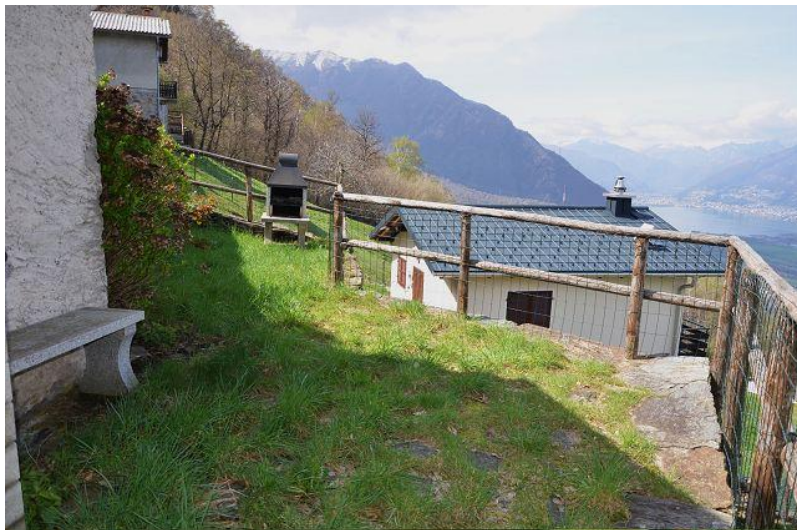
Grundstück und Aussicht / terreno e vista