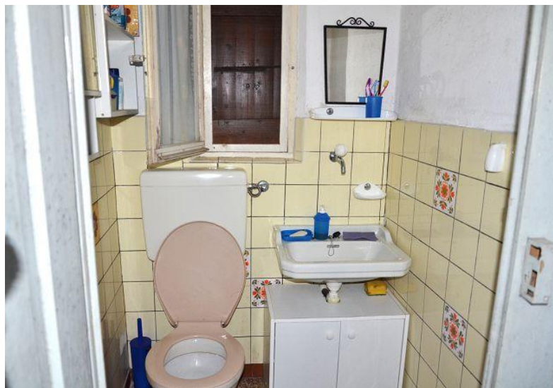
WC und Dusche / WC e doccia