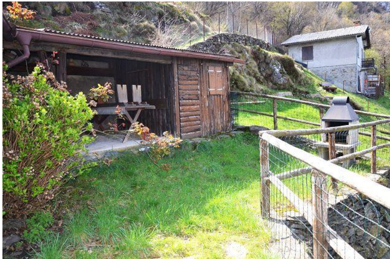
Grundstück und Schuppenhaus / terreno e capanna