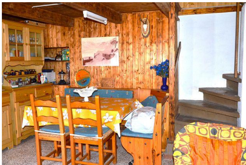
Wohn-, Essbereich / soggiorno – pranzo