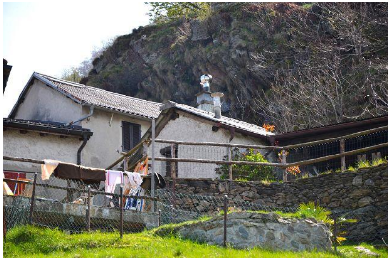
Haus und Rustico / casa e rustico