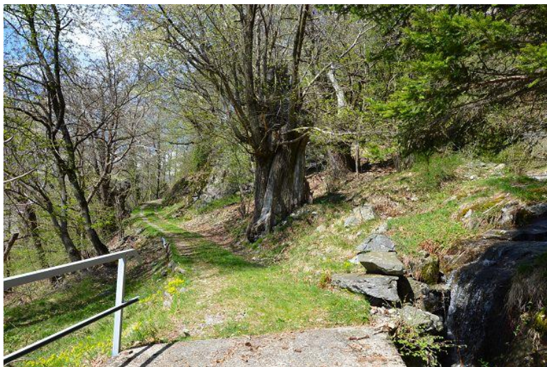
Umgebung / dintorni