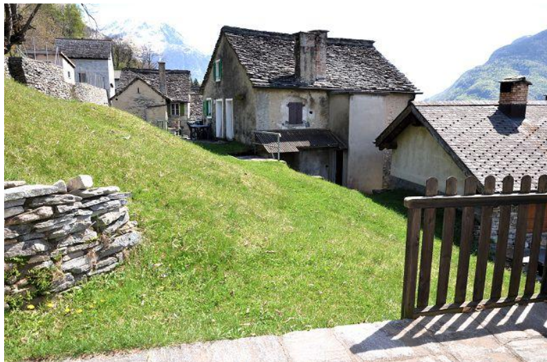
Terrasse und Aussicht / terrazza e vista