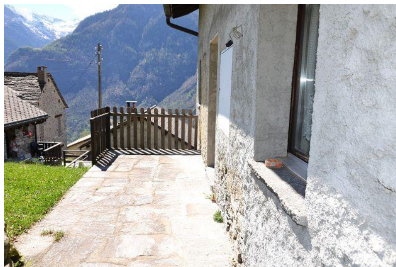
Terrasse / terrazza