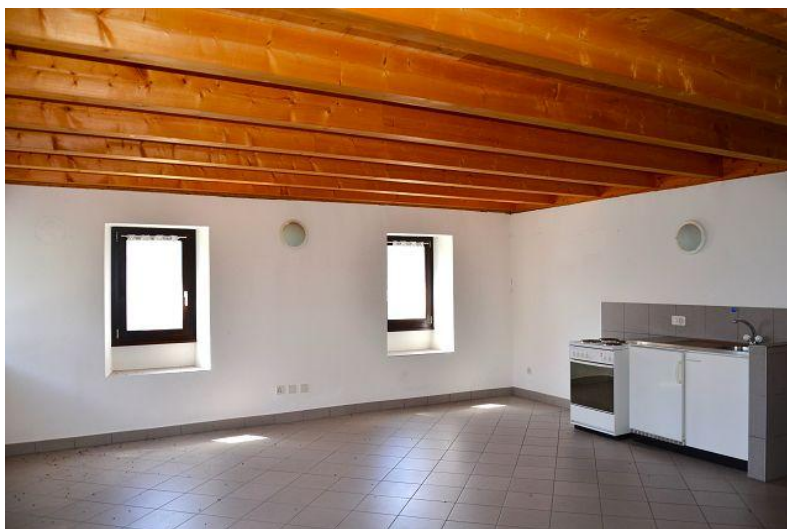
Wohn-, Essbereich – Küche / soggiorno – pranzo – cucina