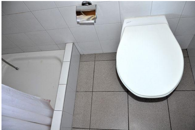
WC und Dusche / WC e doccia