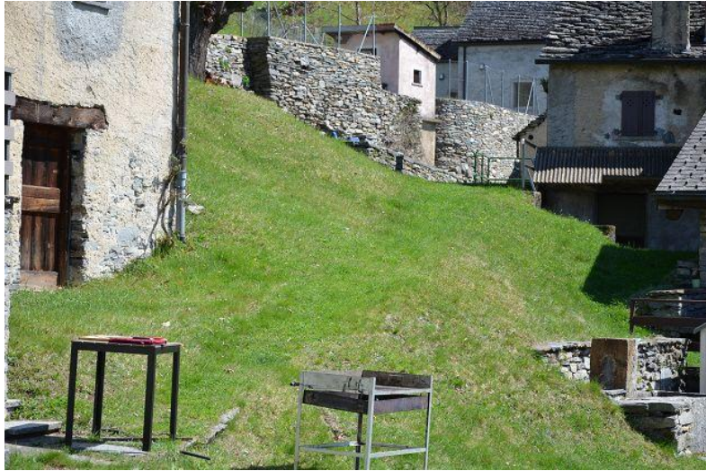
Grundstück / terreno