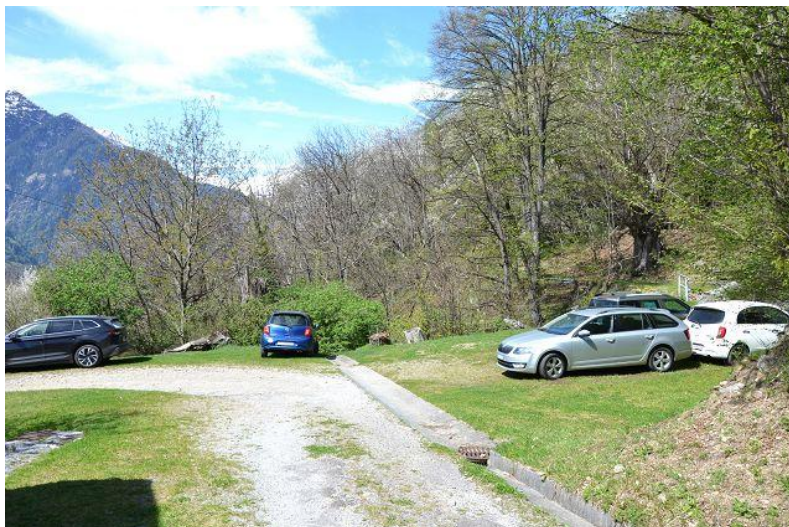
Naheliegender Parkplatz / posteggi vicino