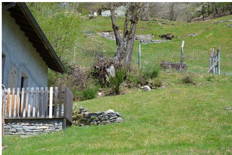
Grundstück / terreno