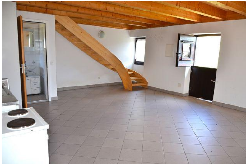
Wohn-, Essbereich – Küche / soggiorno – pranzo - cucina