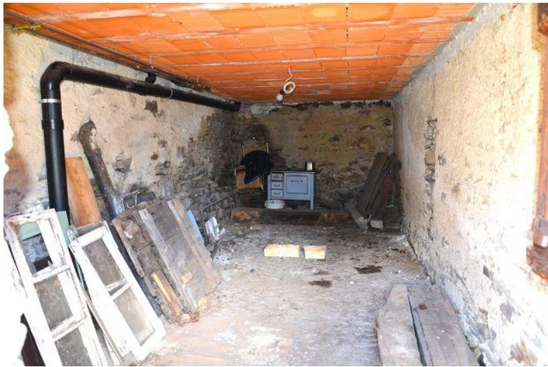
Keller / cantina