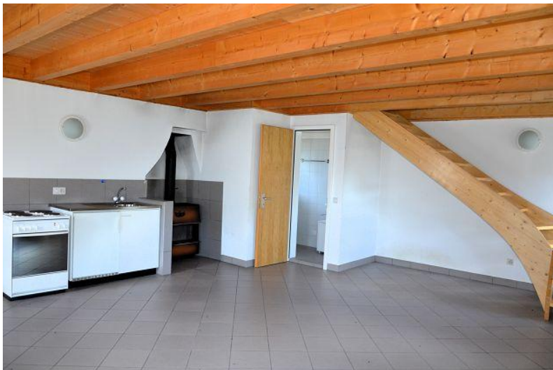
Wohn-, Essbereich – Küche / soggiorno – pranzo - cucina