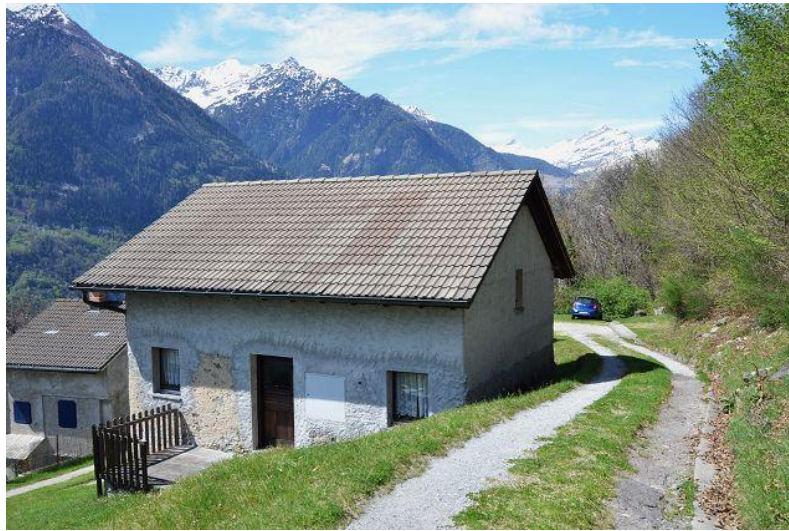
Haus / casa