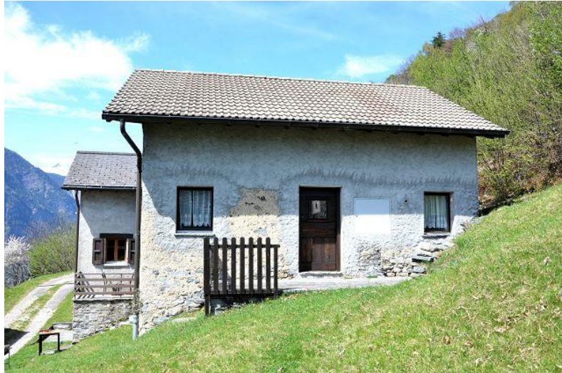
Haus / casa