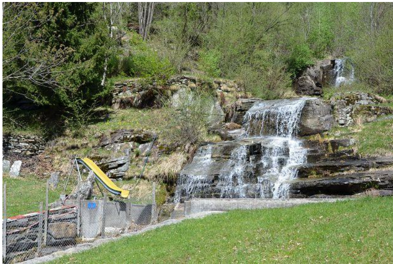
Umgebung / dintorni