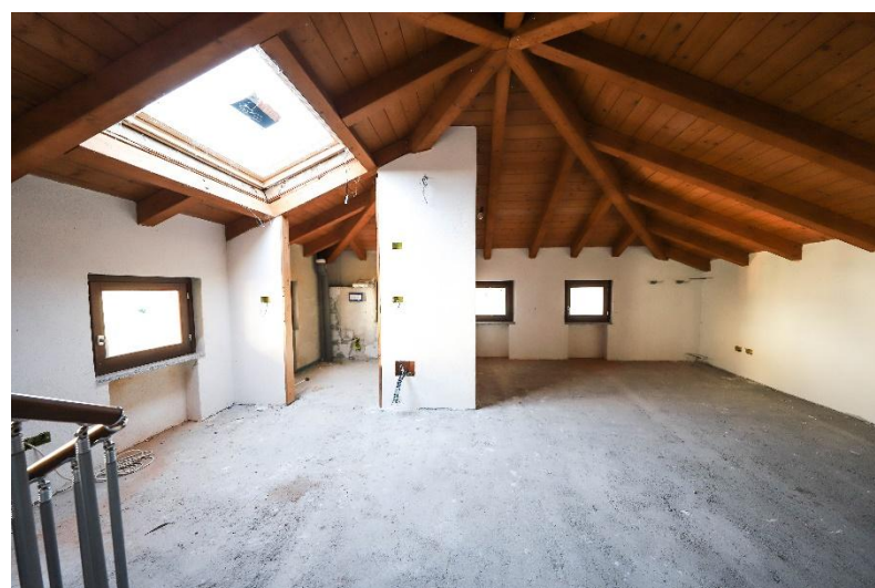
Zimmer 2. OG mit Bad / camera con bagno P2