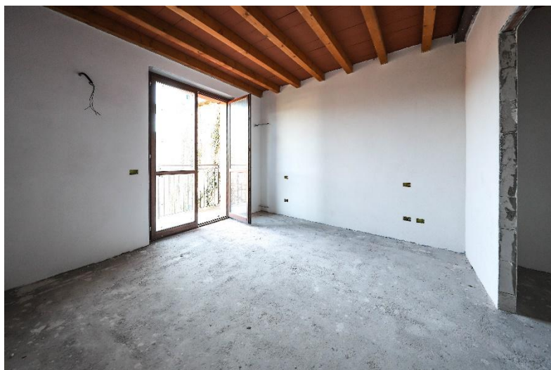
Zimmer 1. OG / camera P1