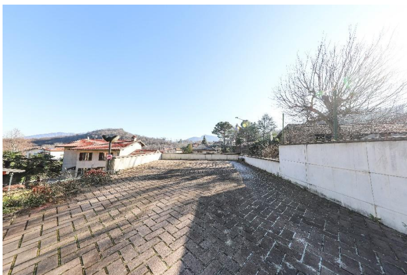
Aussen Parkplätze/ posteggi esterni