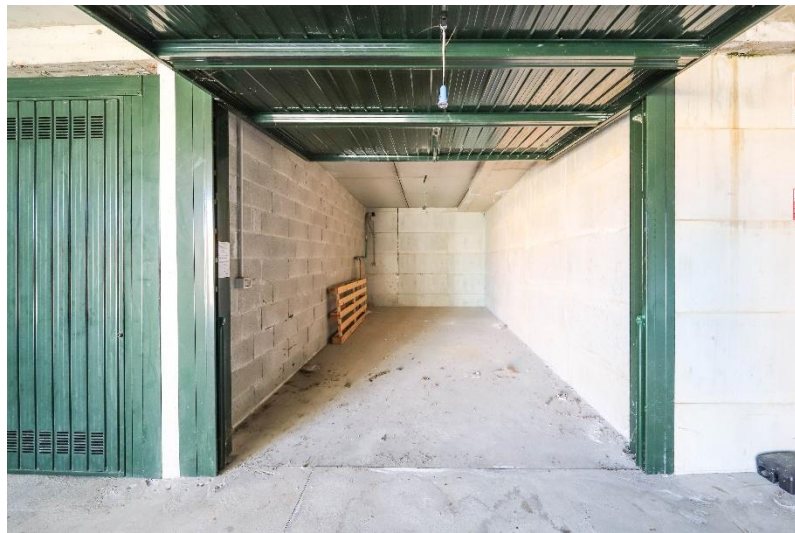
Garage / garage