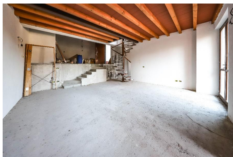
Wohnbereich EG / soggiorno PT