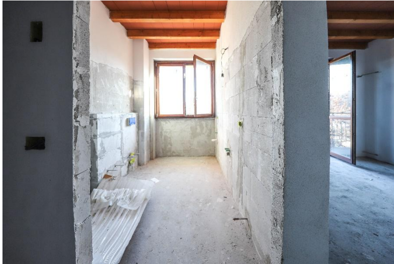
Bad 1. OG / bagno P1