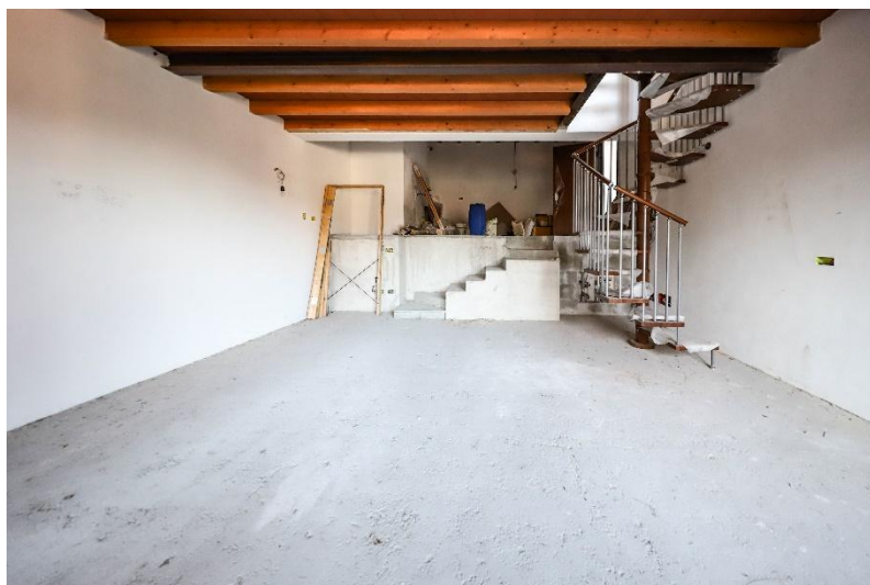
Wohnbereich EG / soggiorno PT