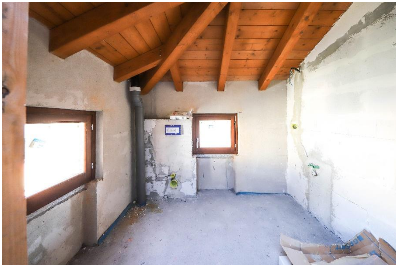
Bad 2. OG / bagno P2