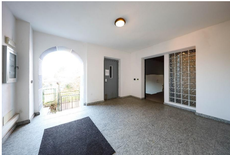
Eingang des Gebäudes / ingresso condominiale