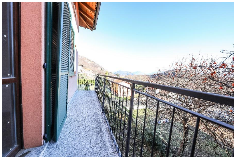
Balkon und Aussicht / balcone e vista