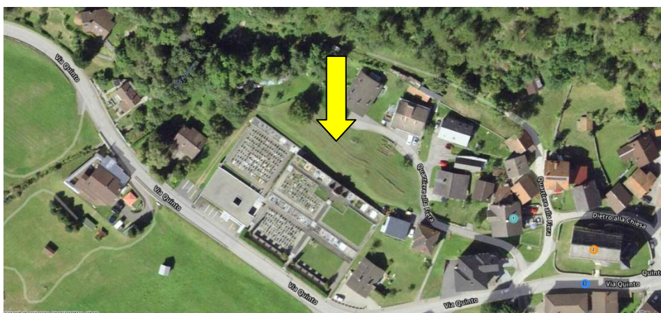
Lage / luogo