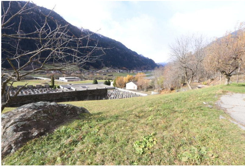
Bauland / terreno edificabile