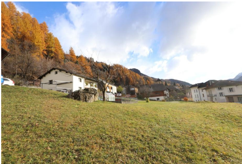
Bauland / terreno edificabile