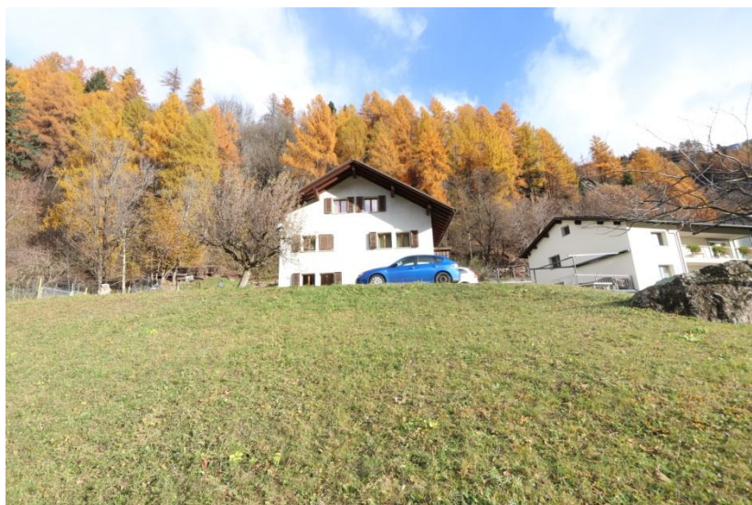
Bauland / terreno edificabile