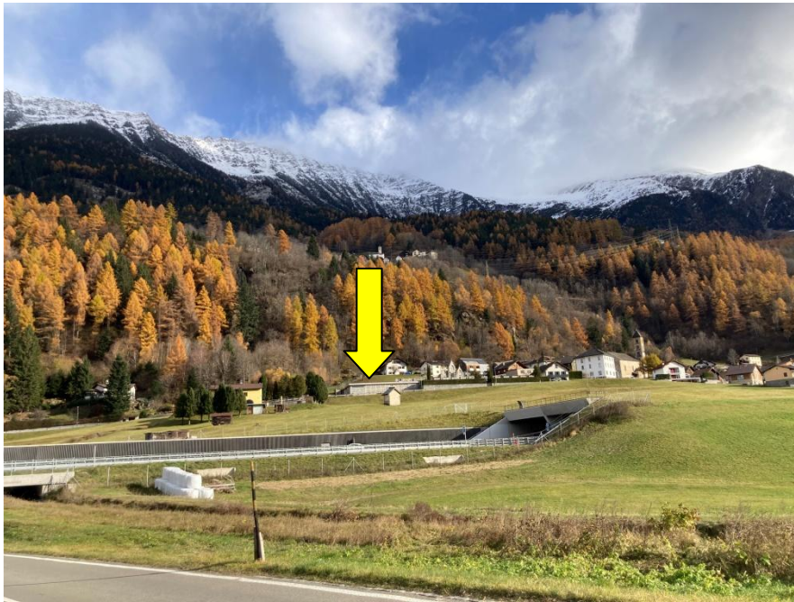
Blick zum Bauland / vista verso il terreno