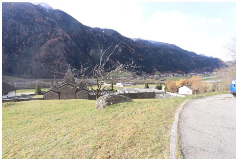
Zufahrt / accesso