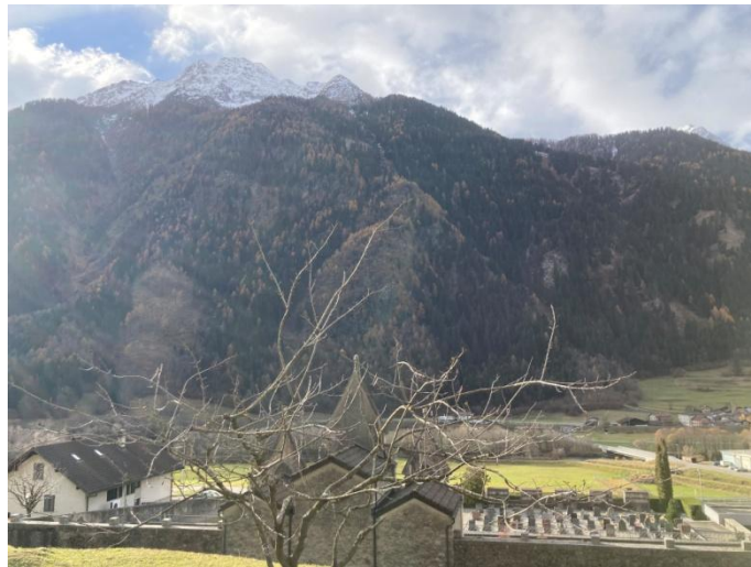
Aussicht / vista