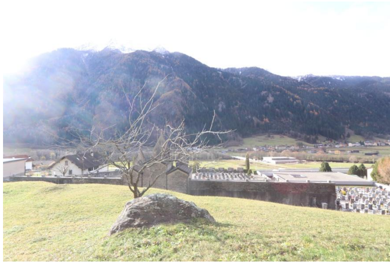
Aussicht / vista