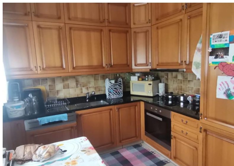
Küche / cucina