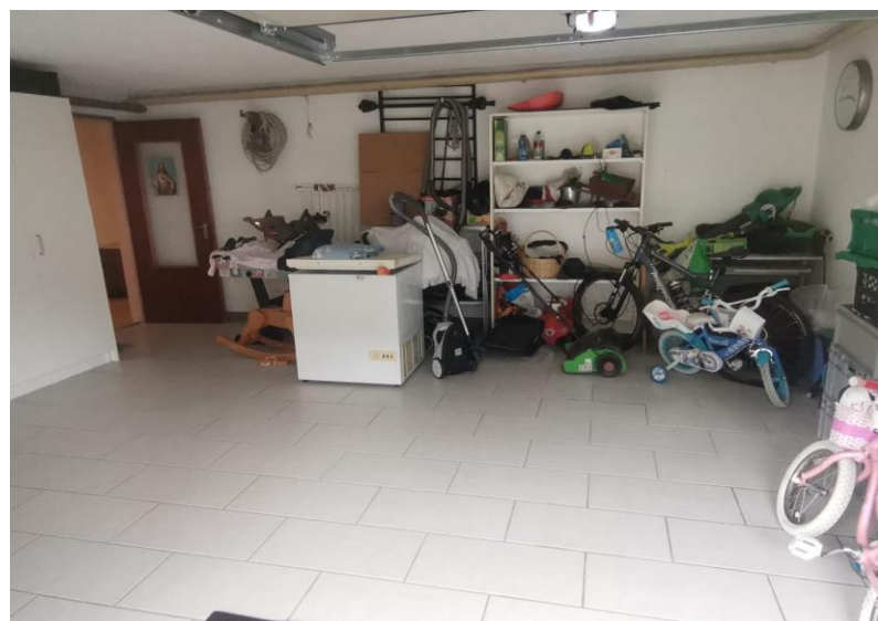
Garage / garage