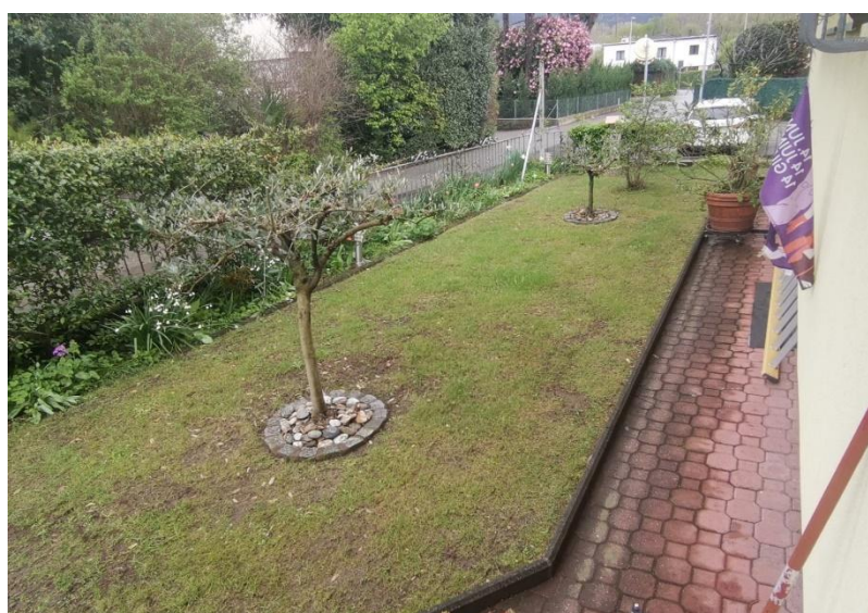
Garten / giardino