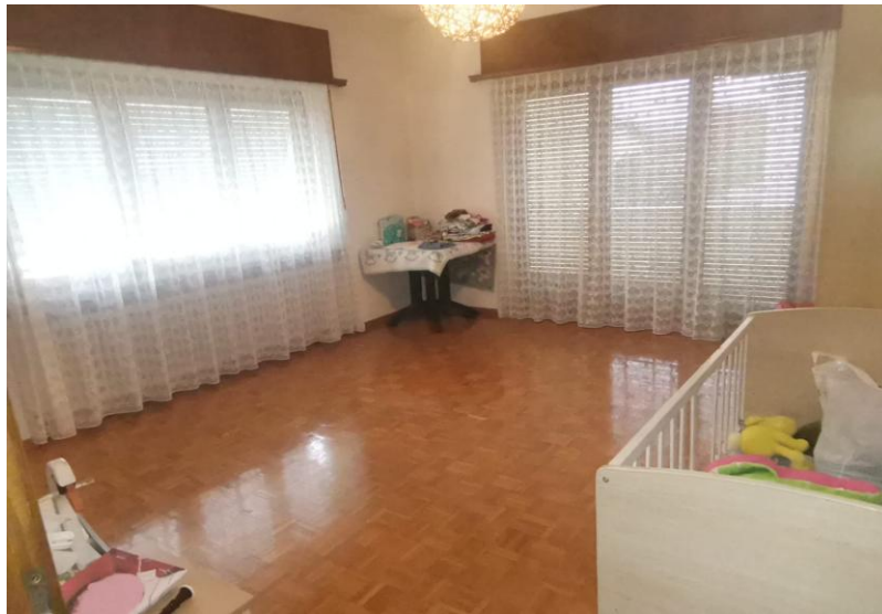
Zimmer / camera