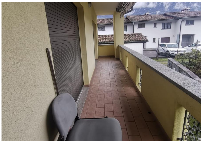
Balkon / balcone