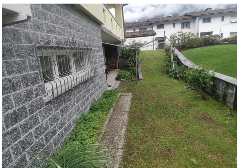
Garten / giardino