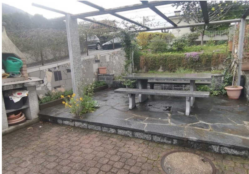
Pergola / pergola