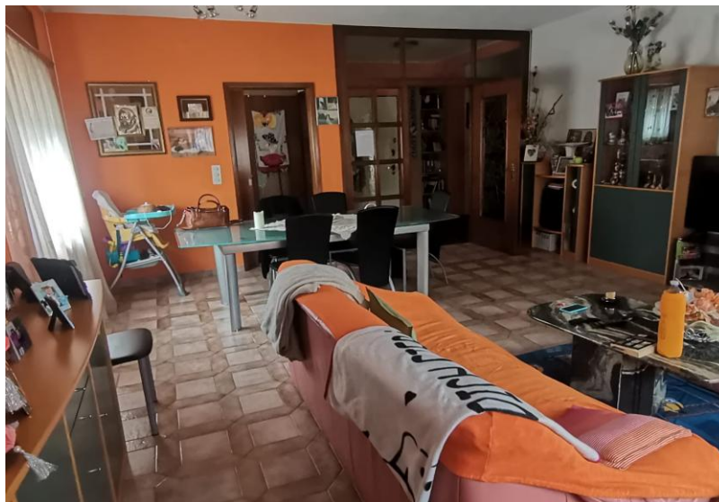
Wohnbereich / soggiorno