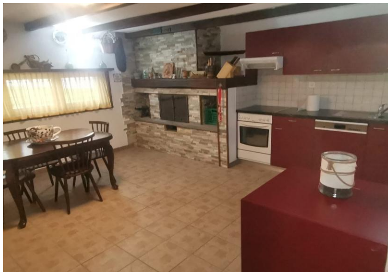
Grotto / grottino