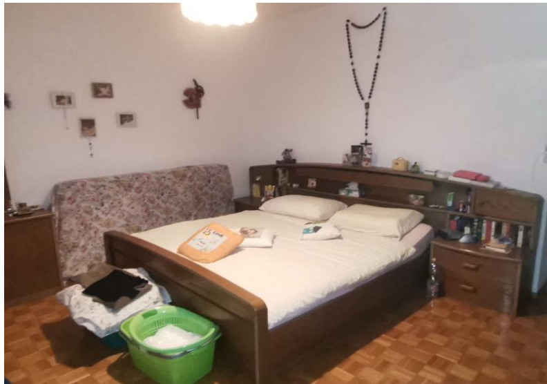
Zimmer / camera