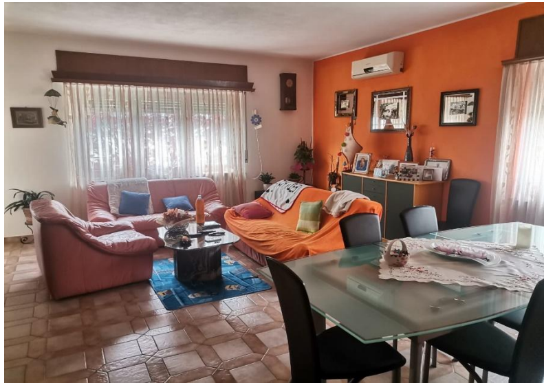
Wohnbereich / soggiorno