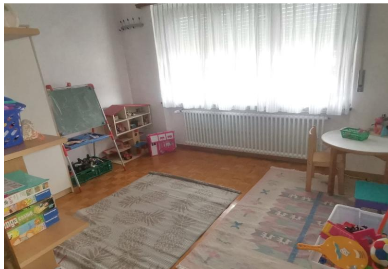
Zimmer / camera