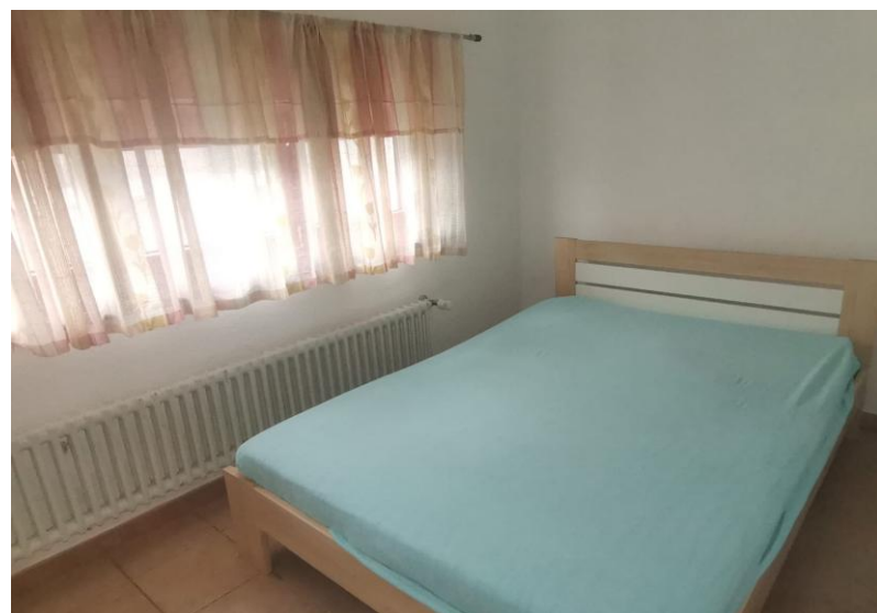
Zimmer / camera