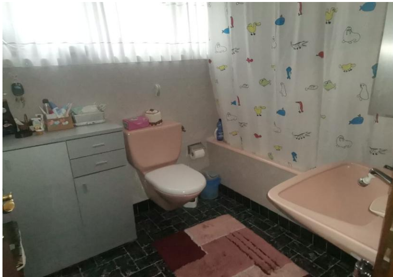
WC und Badewanne / WC e vasca da bagno