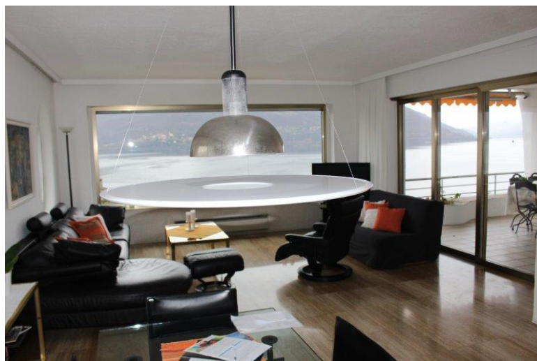
Wohnraum / soggiorno