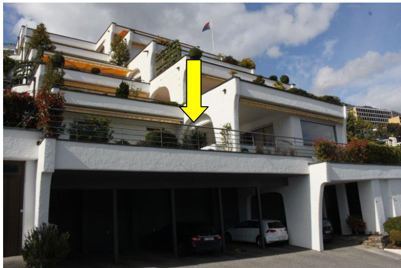
Haus / casa