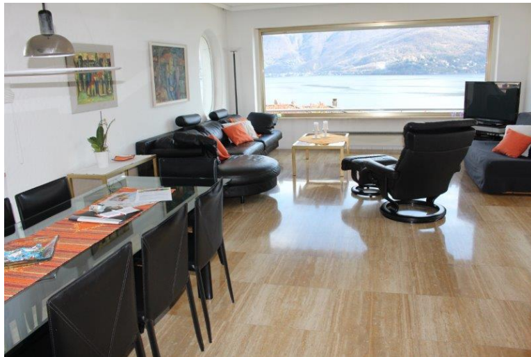
Wohnzimmer / soggiorno