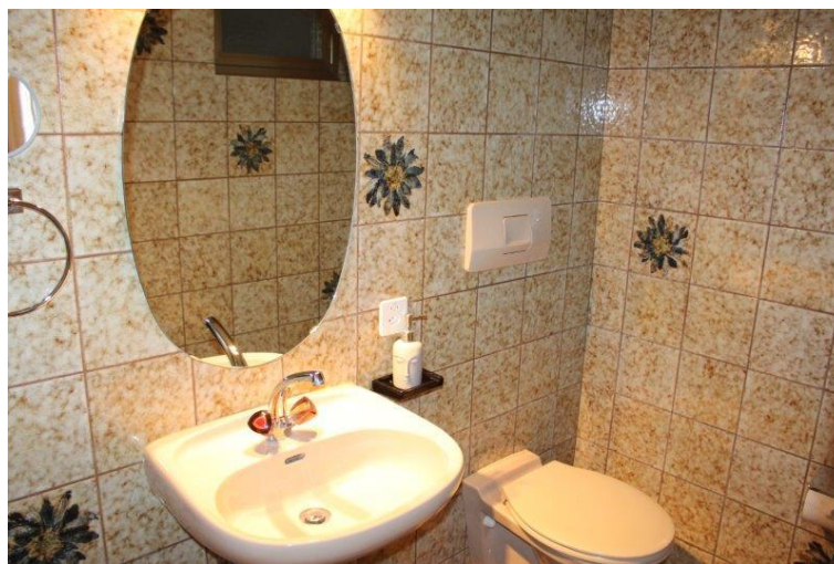
WC / Toilette