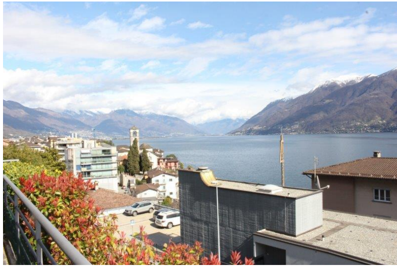
Aussicht / vista