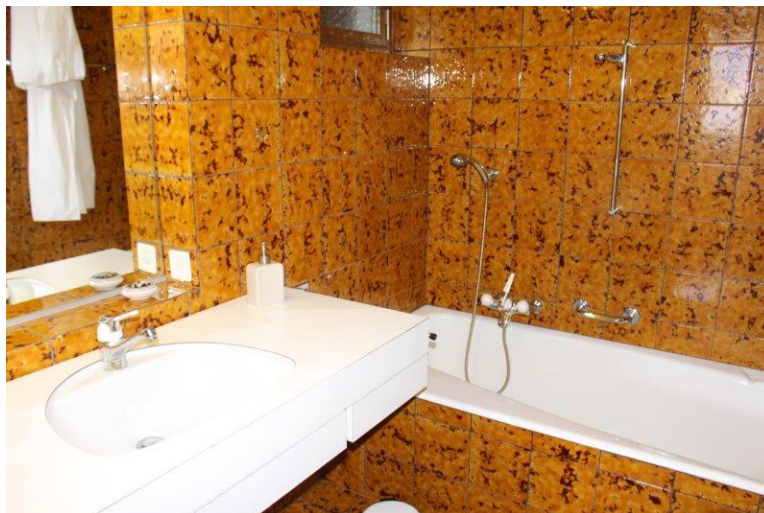
Badezimmer mit Wanne / bagno con vasca