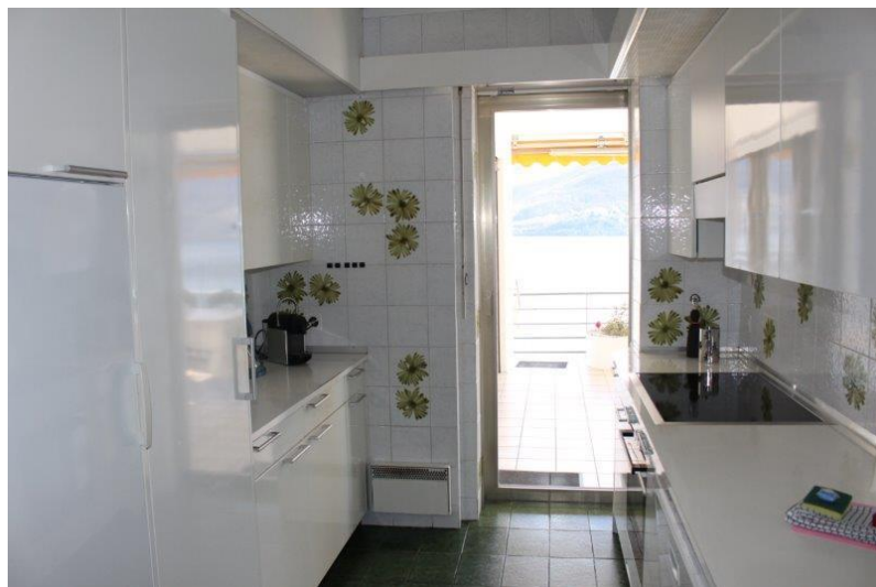
Küche / cucina