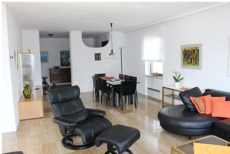
Wohnzimmer / soggiorno