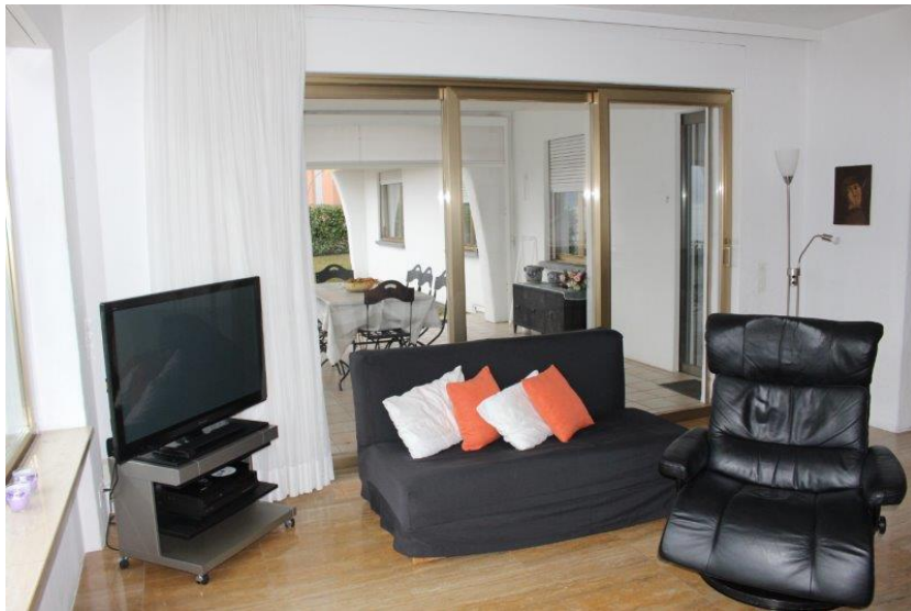
Wohnraum / soggiorno