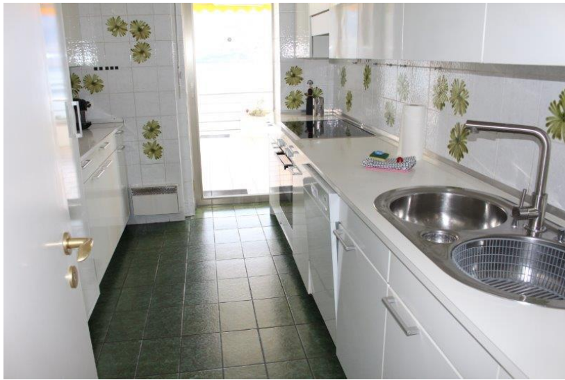
Küche / cucina