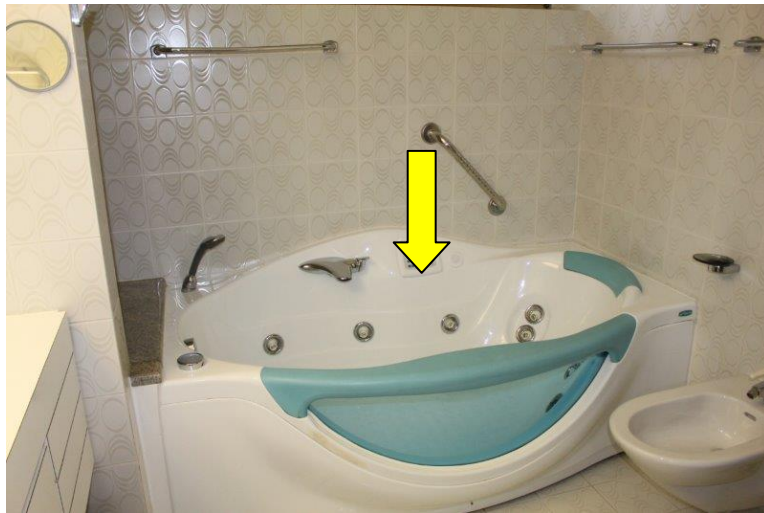
Badezimmer mit Wanne / bagno con vasca