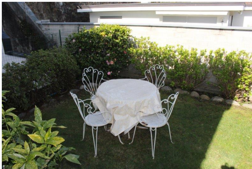
Terrasse / terrazza