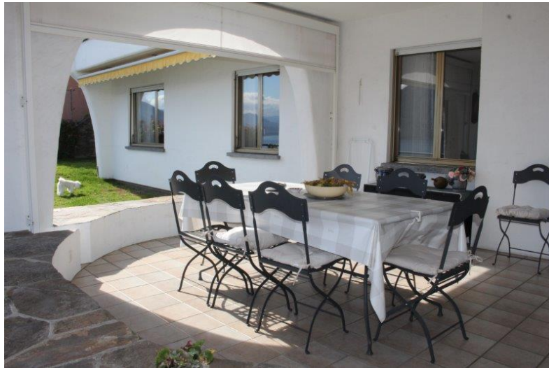
Terrasse / terrazza