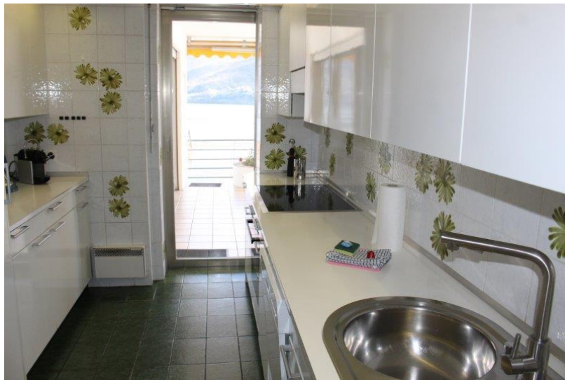
Küche / cucina