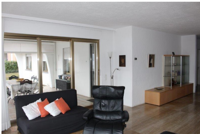
Wohnraum / soggiorno