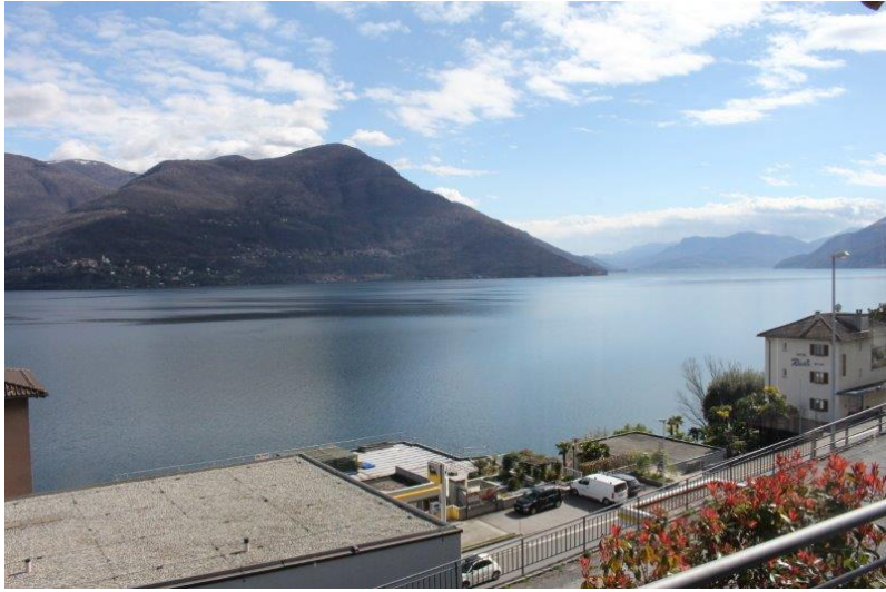
Aussicht / vista