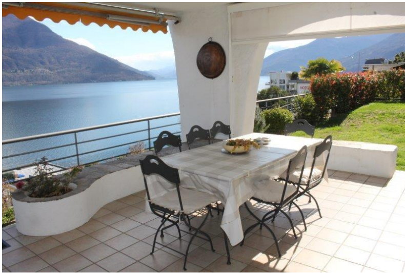
Terrasse / terrazza