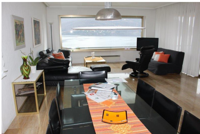
Wohnraum / soggiorno