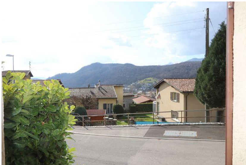
Westblick / vista ovest