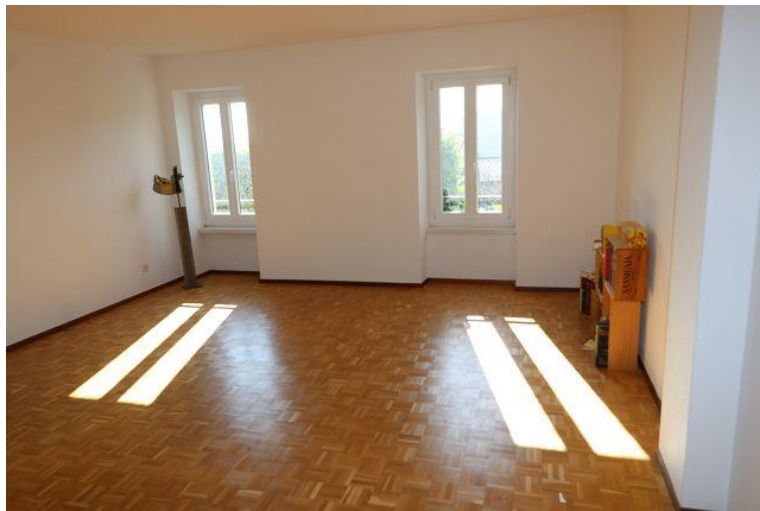
Wohnbereich / soggiorno