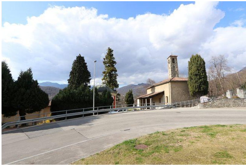
Nordblick / vista nord