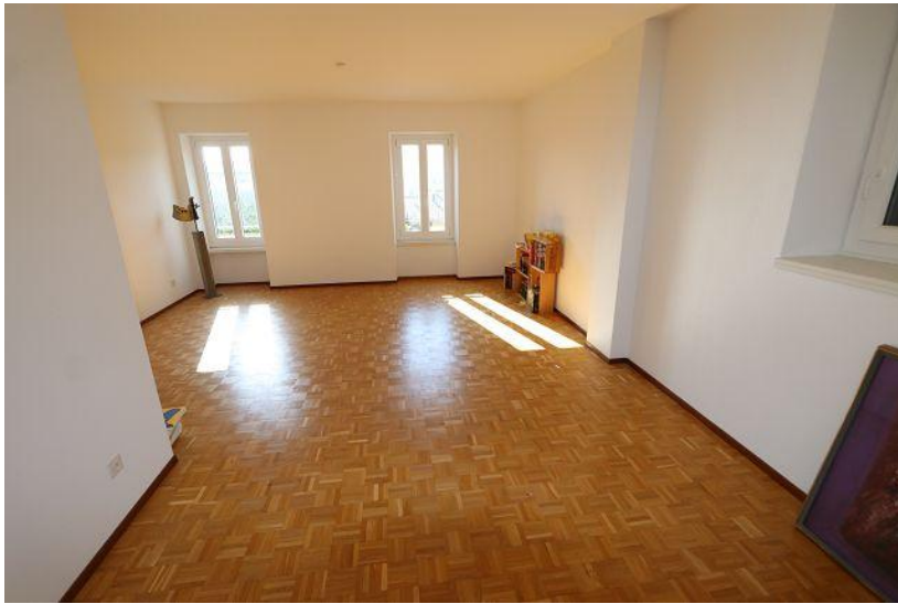
Wohnbereich / soggiorno