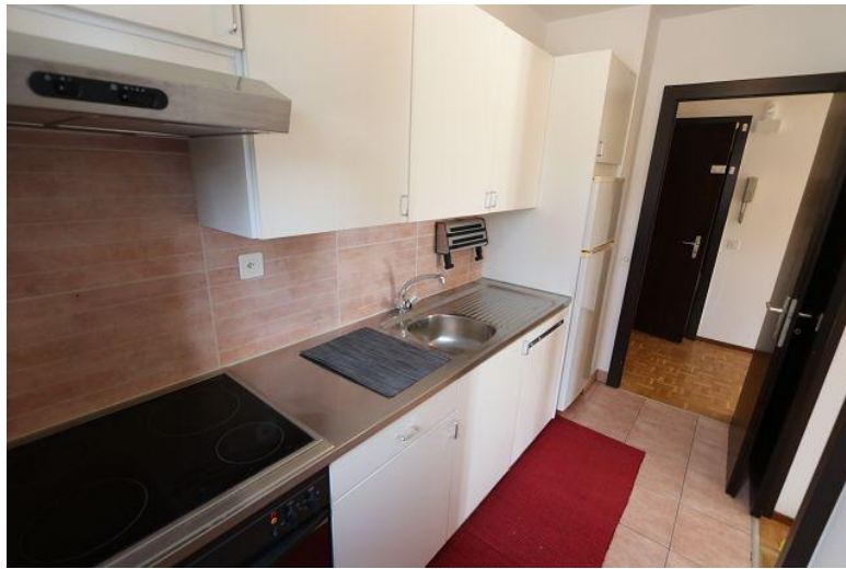
Küche / cucina