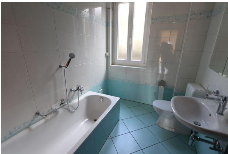
Bad/Dusche/WC / bagno/doccia/WC