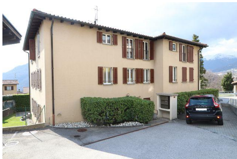
Eingang und Parkplatz / entrata e parcheggio