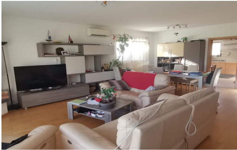
Wohnbereich / soggiorno