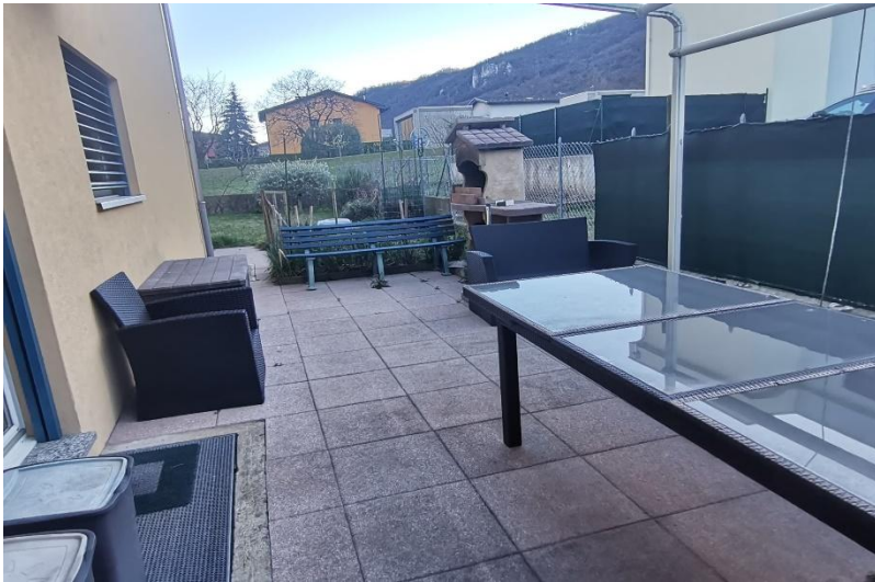
Terrasse / terrazza