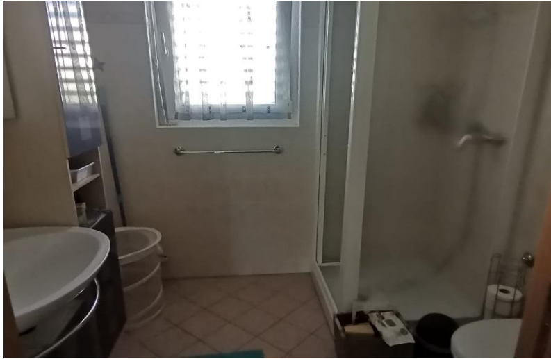
Bad und Dusche / bagno e doccia