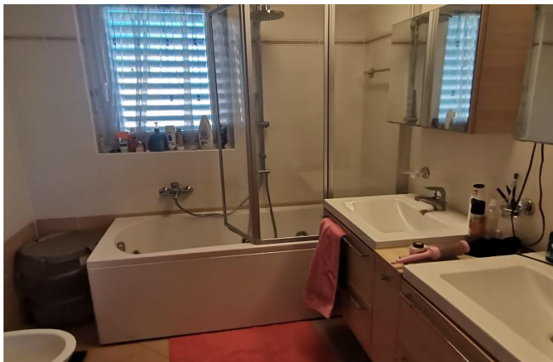
WC und Badewanne / WC con vasca da bagno