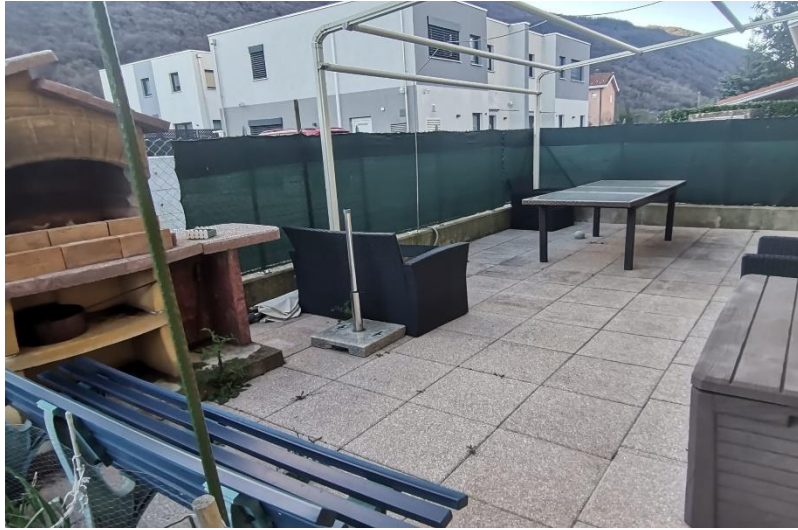
Terrasse / terrazza