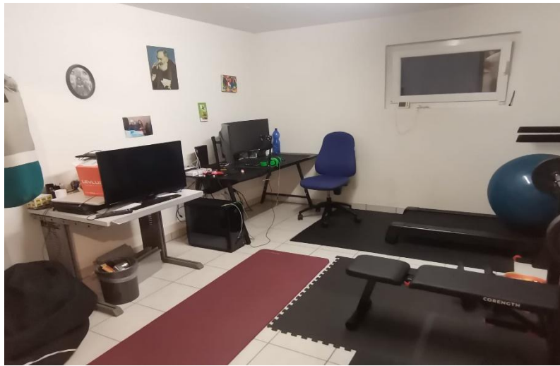
Zimmer / camera