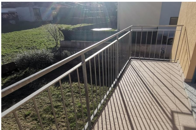
Balkon / balcone