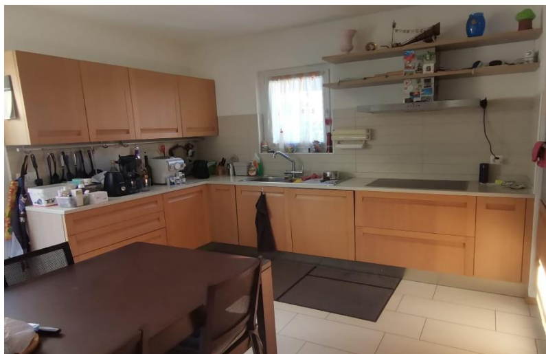
Küche / cucina