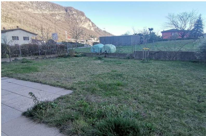
Garten / giardino