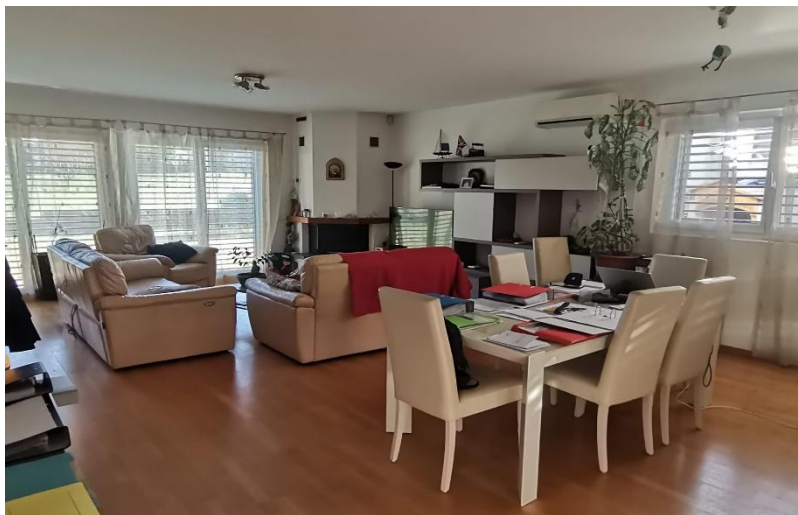
Wohn,- Essbereich / soggiorno – pranzo