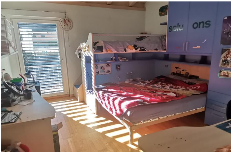
Zimmer / camera