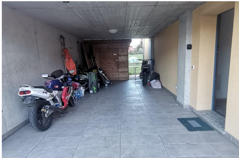
Eingangsbereich / ingresso