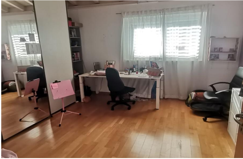
Zimmer / camera