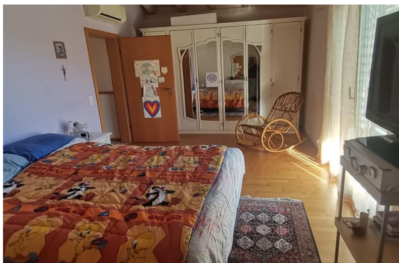
Zimmer / camera