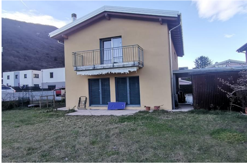
Haus und Garten / casa e giardino