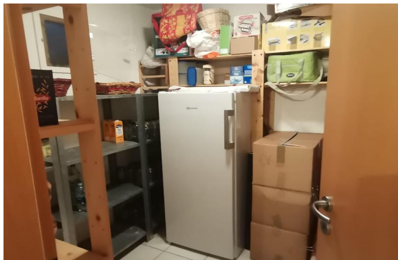
Abstellraum / dispensa