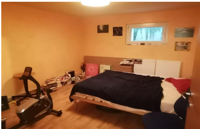
Zimmer / camera