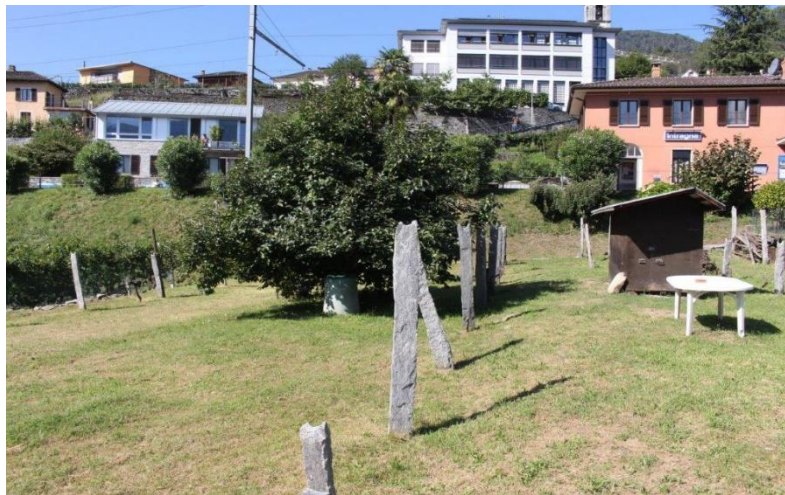
Umgebung / dintorno