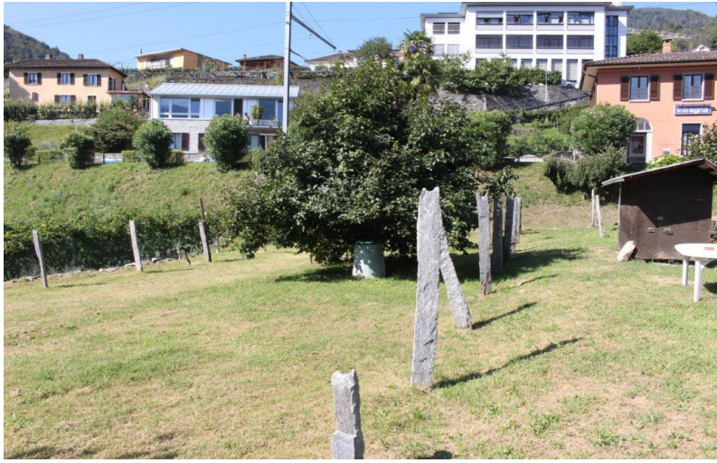
Bauland / terreno edificabile