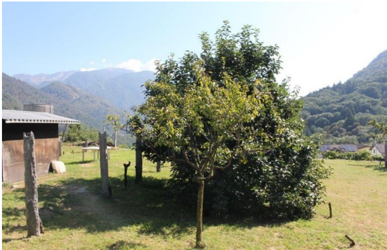
Bauland / terreno edificabile