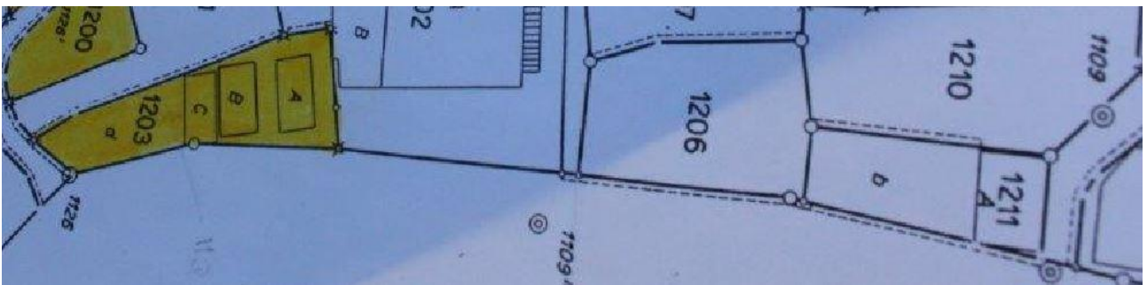
Parzelle der Parkplätze und Garagen/parcella dei postegg