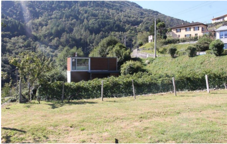
Umgebung / dintorno