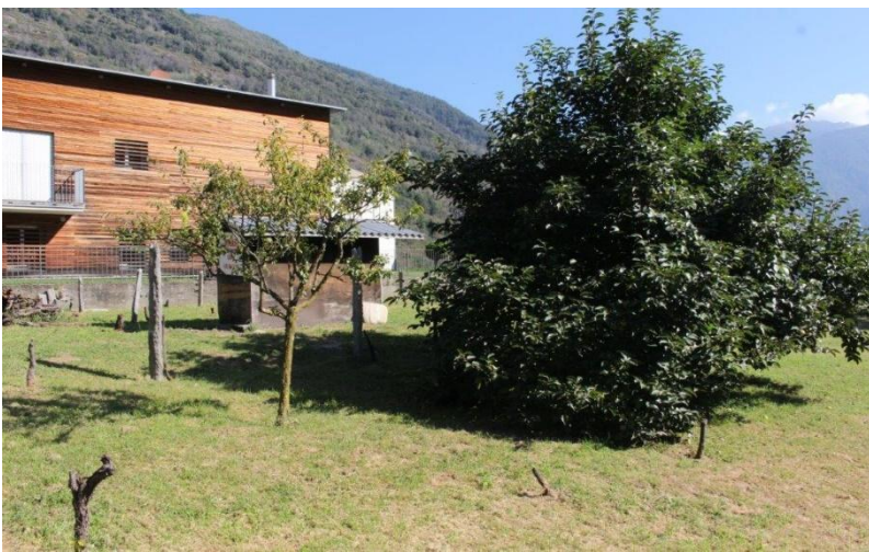
Bauland / terreno edificabile