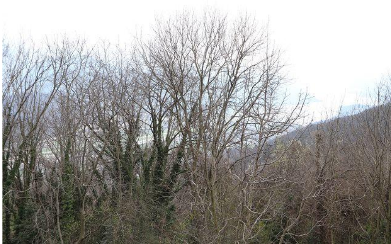
Blick nach Süden / vista sud