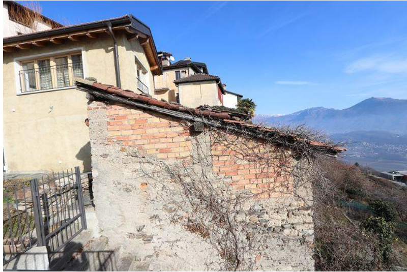
Gebäude / stabile