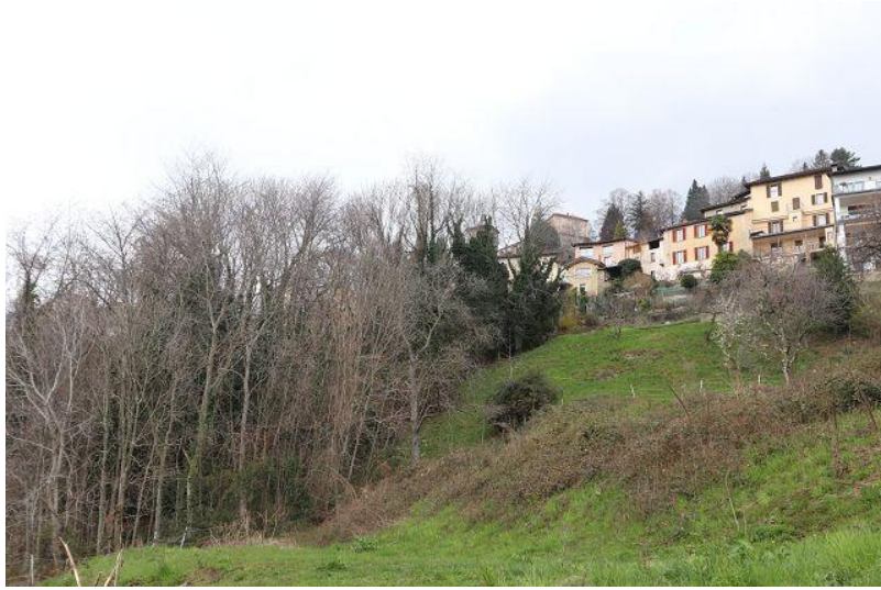
Blick zum Gebäude / vista verso stabile