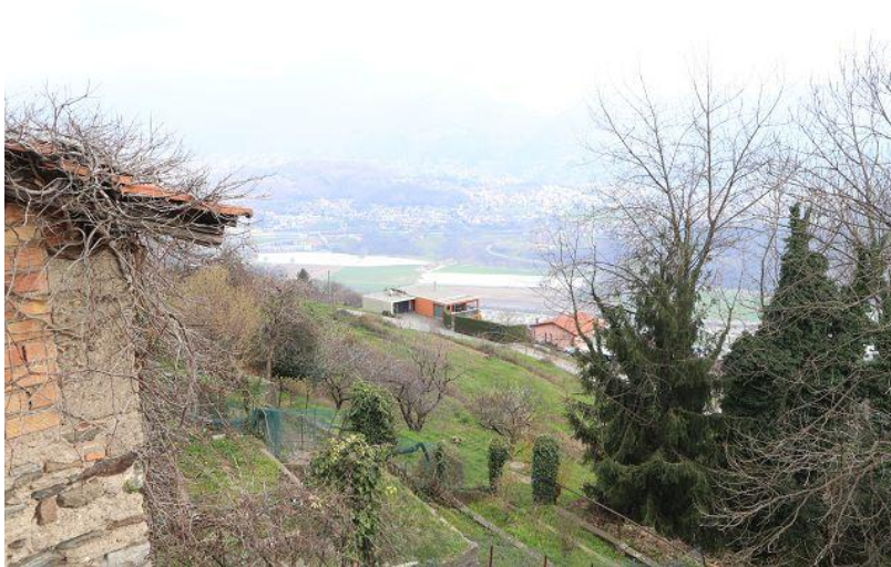
Blick nach Osten / vista est