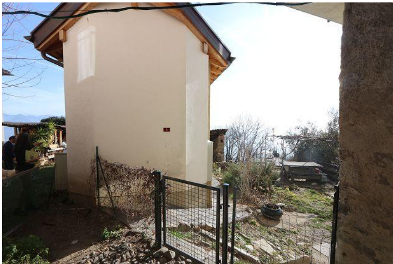
Zugang / accesso