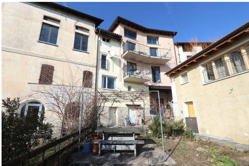
Blick nach Norden / vista nord