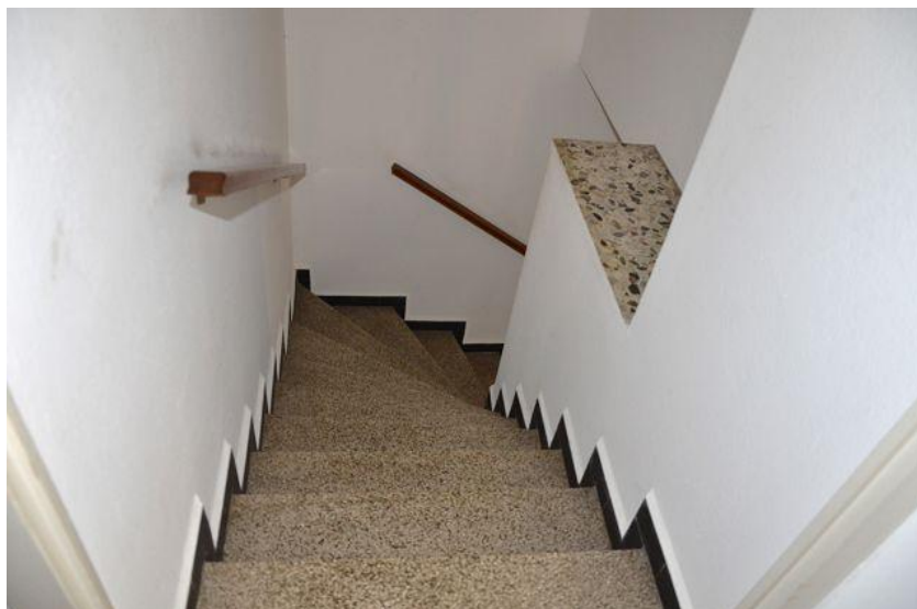
Treppenhaus / scala