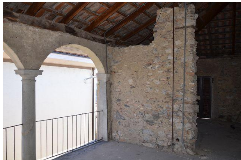
Küche / cucina Dachgeschoss / ultimo piano