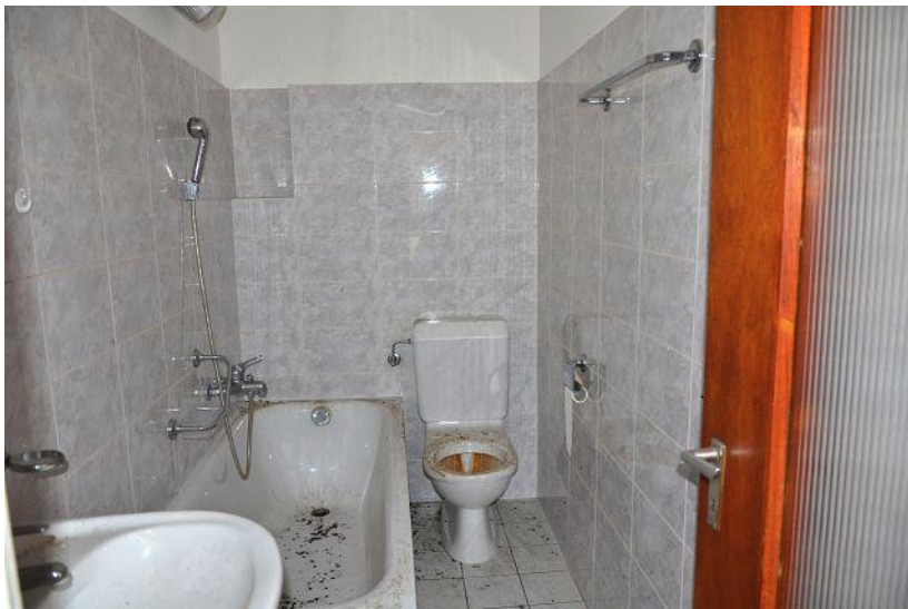
Bad / bagno