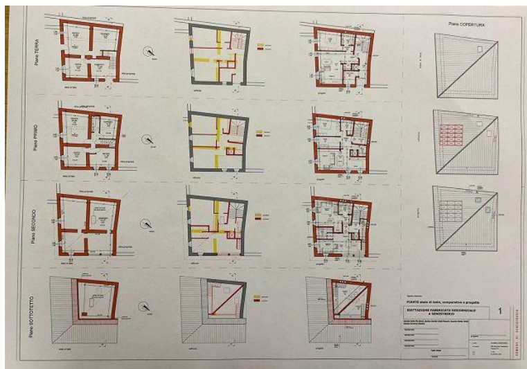
Projekt / progetto