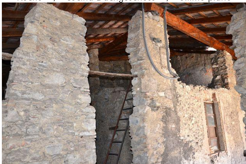
Dachgeschoss / ultimo piano