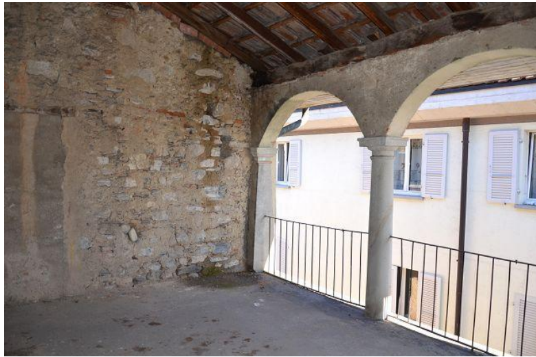
Dachgeschoss / ultimo piano