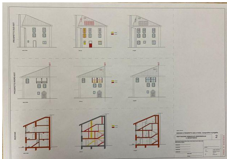
Projekt / progetto