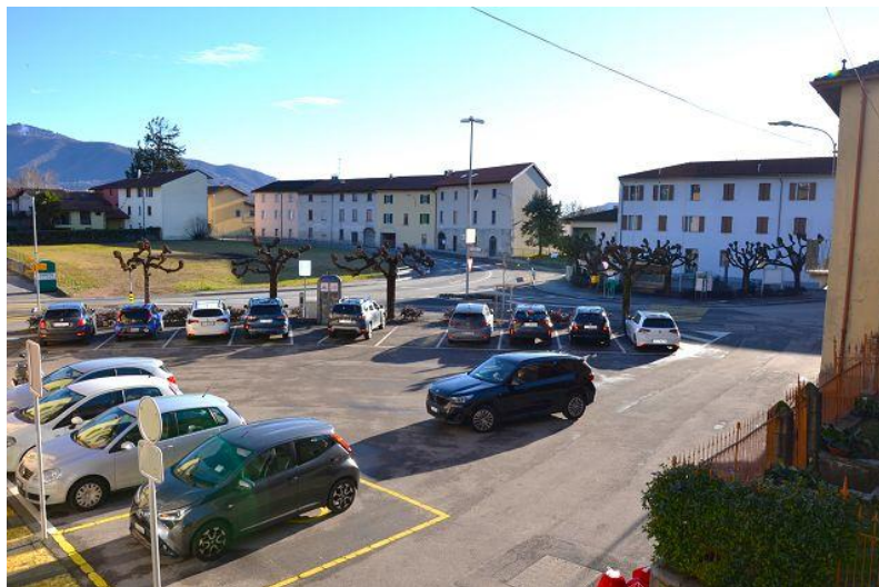
Blick auf Dorfparkplatz / vista sul parcheggio pubblico