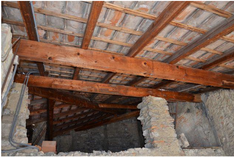
Dachuntersicht / solaio