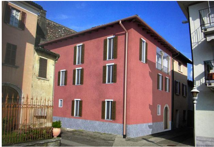
Terrasse / terrazza