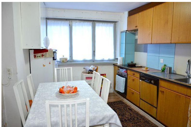
Essbereich – Küche / pranzo – cucina