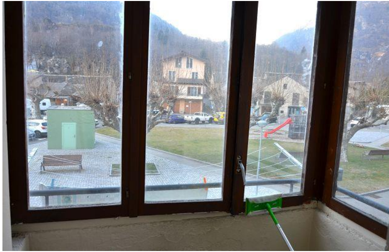
Verglaster Balkon / balcone coperto