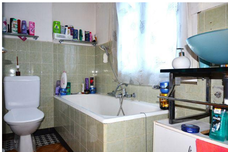
Bad mit Badewanne / bagno con vasca