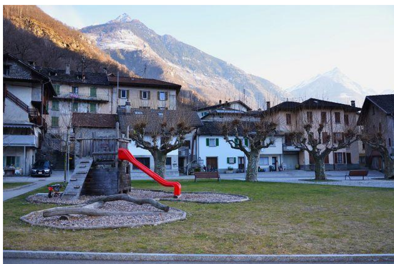
Umgebung / dintorni