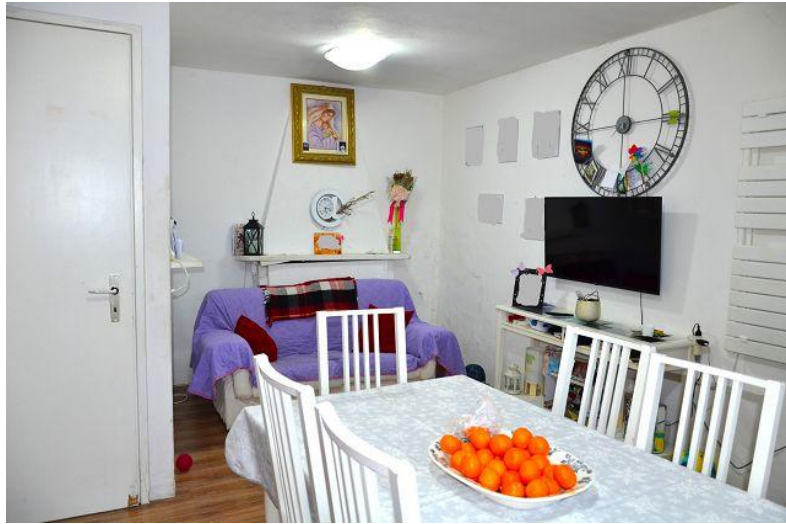
Wohn-, Essbereich / soggiorno – pranzo