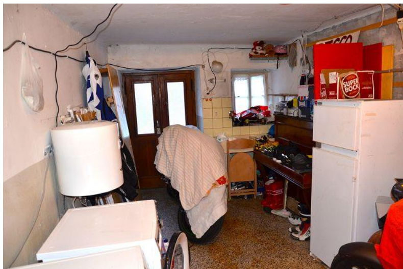
Waschküche – Keller / lavanderia – cantina