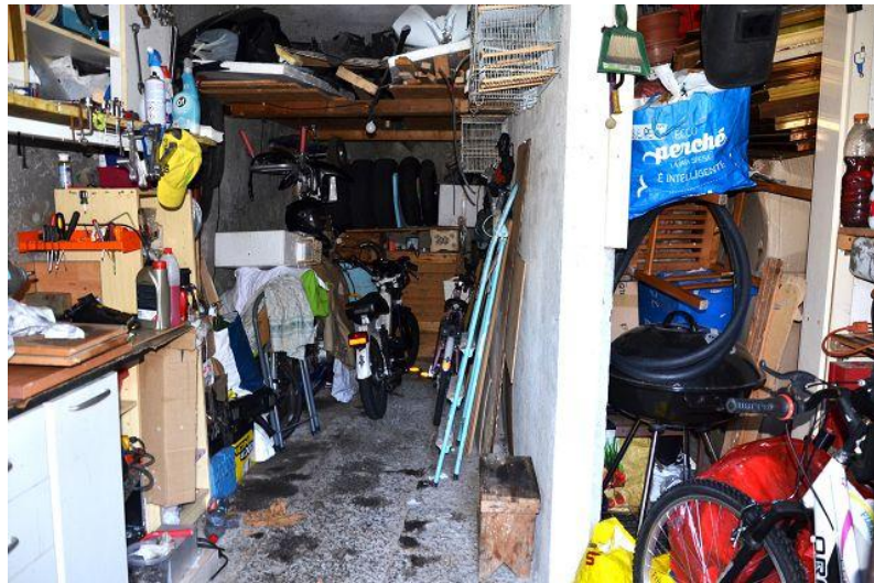
Garage / garage