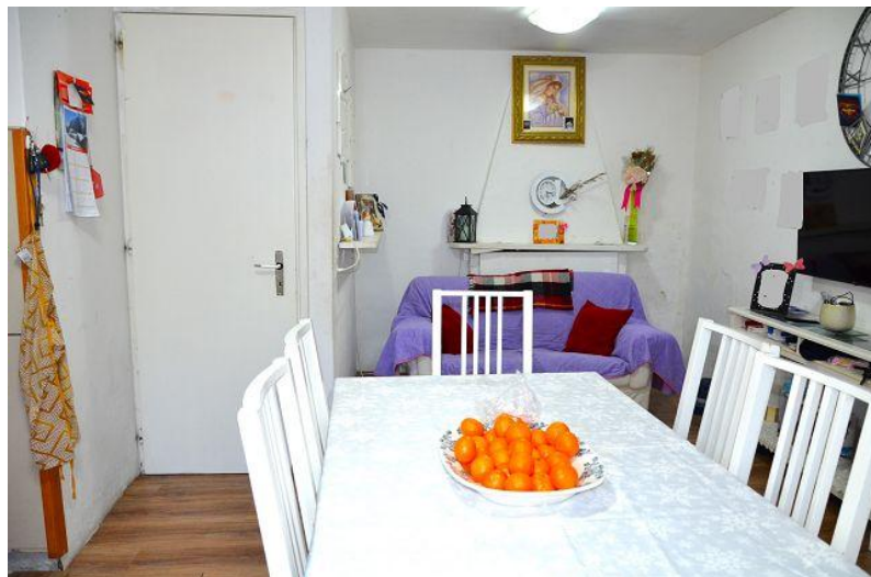
Wohn-, Essbereich / soggiorno – pranzo