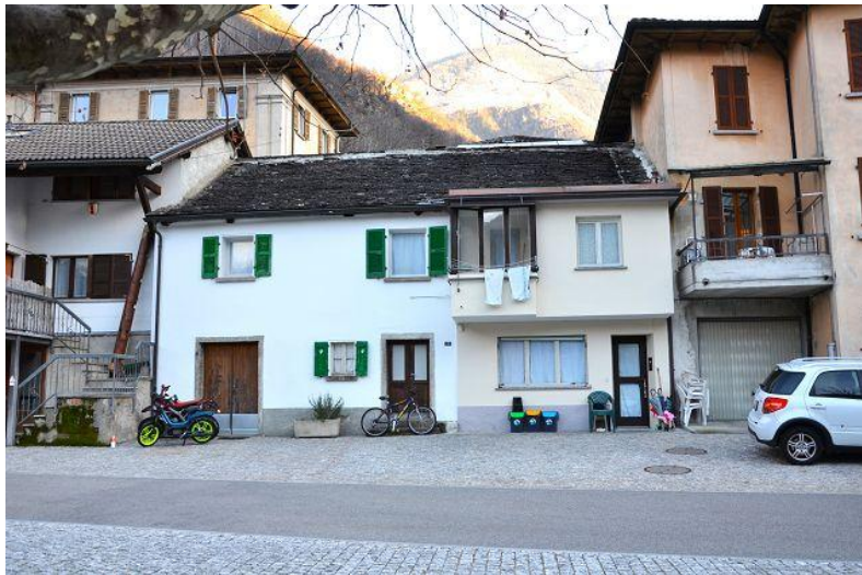
Haus / casa