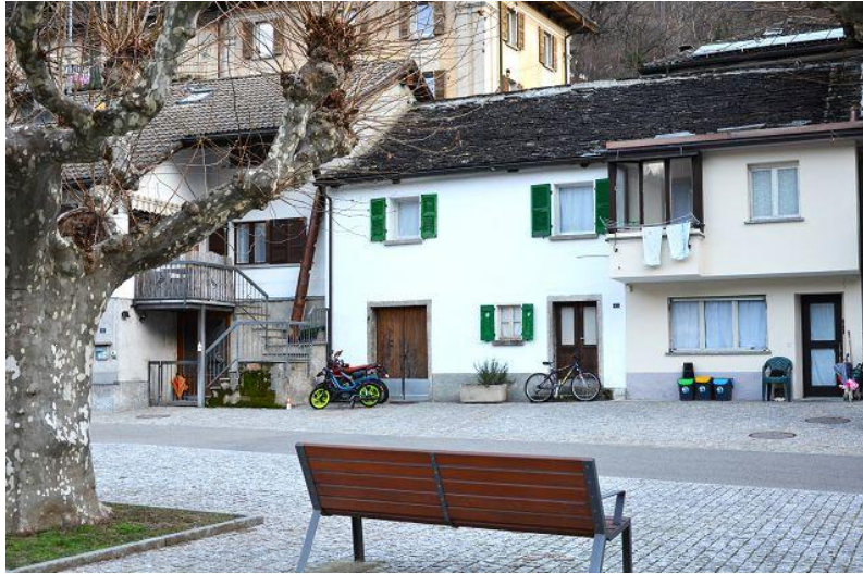
Haus / casa