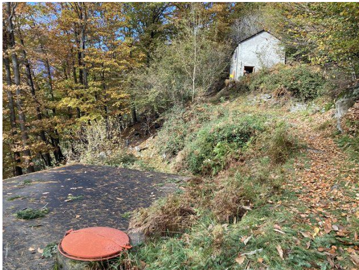
Blick zum Rustico / visto verso rustico