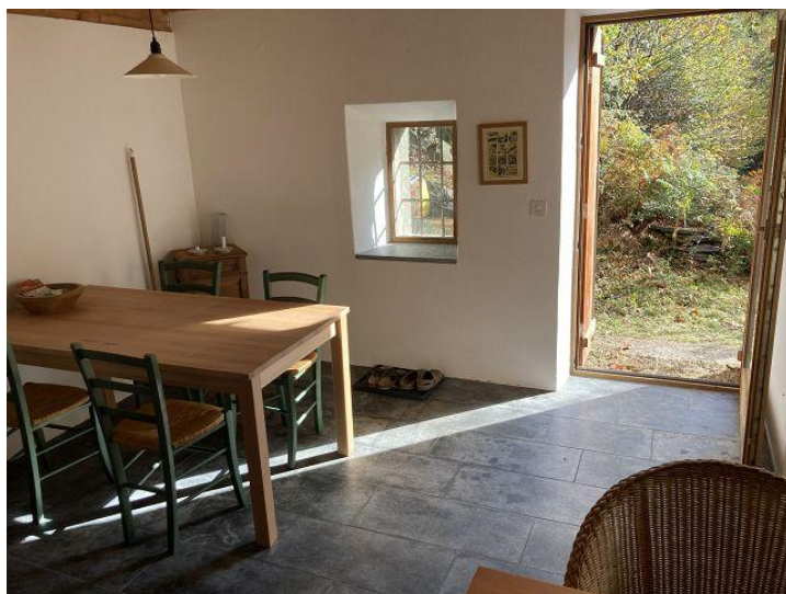
Essbereich / pranzo