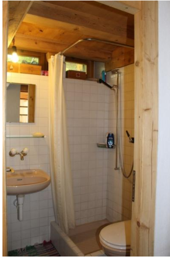
Dusche / doccia