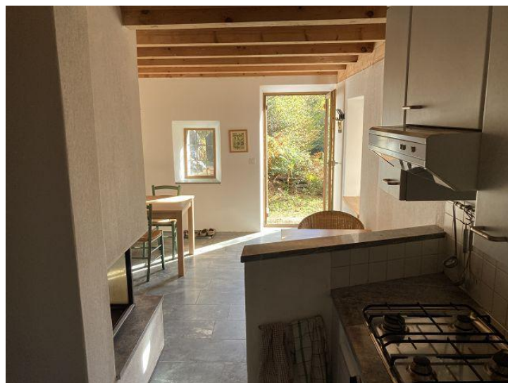
Küche / cucina