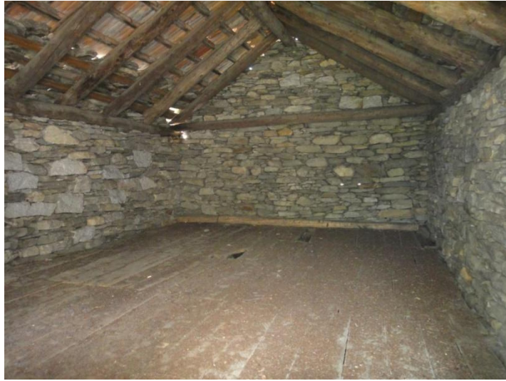
Innenraum / intorno