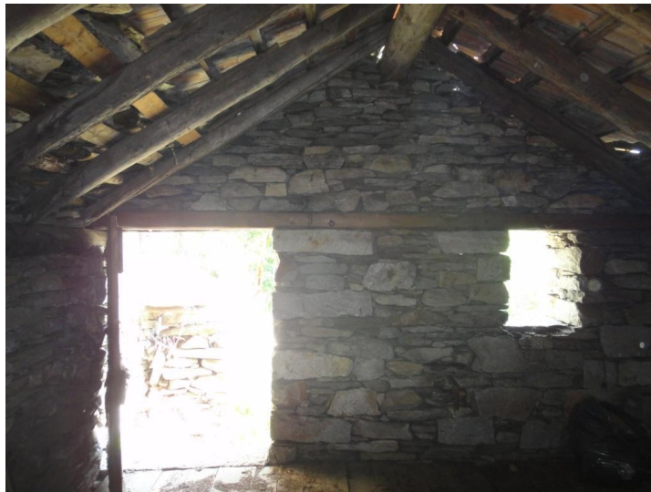
Innenraum / intorno