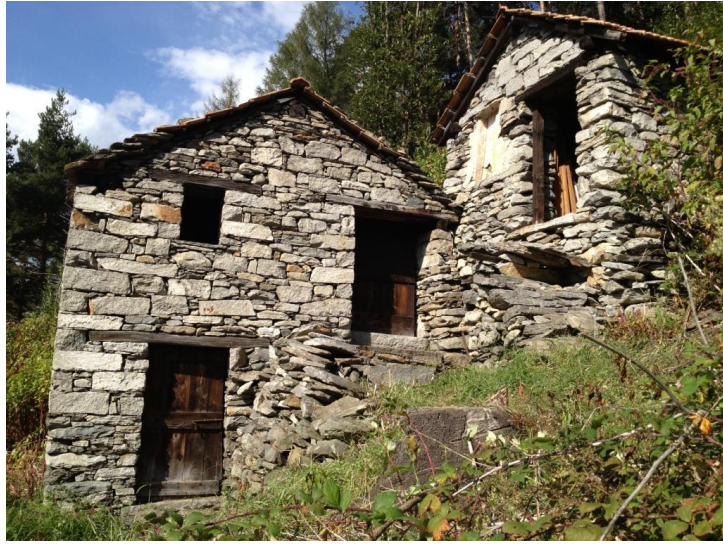
Zwei Rustici / due rustici