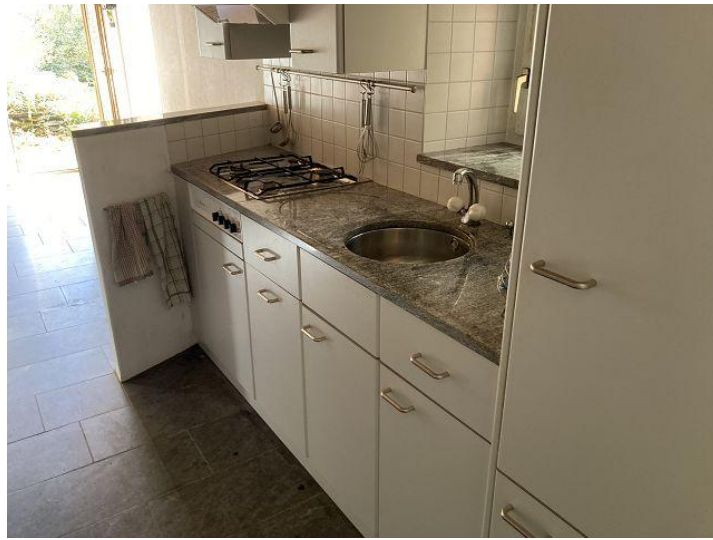
Küche / cucina