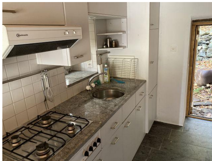
Küche / cucina