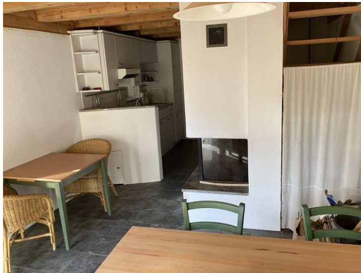
Wohn-Essbereich / soggiorno/pranzo