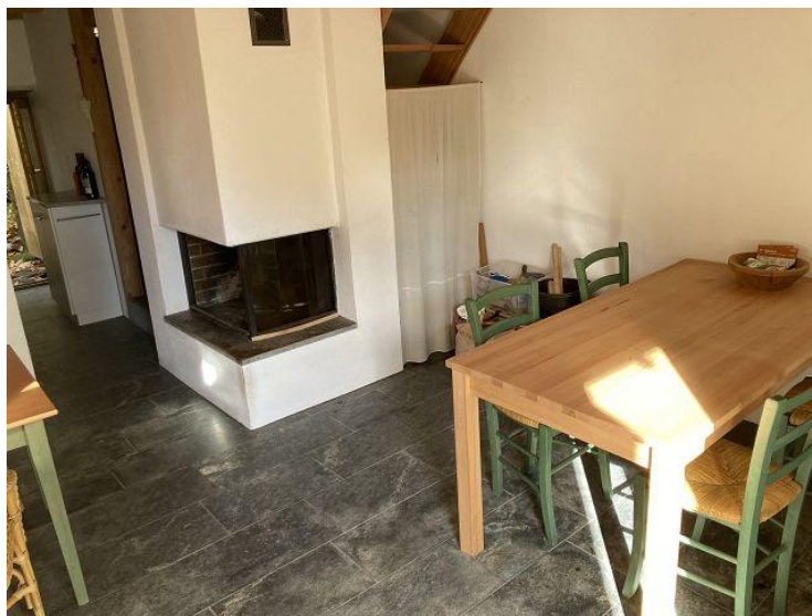
Essbereich / pranzo