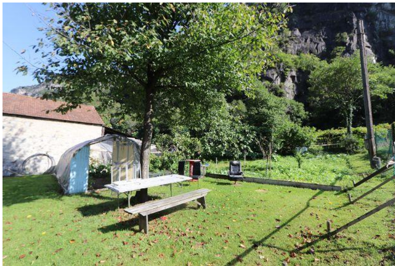
Garten / Bauland / giardino / terreno edificabile