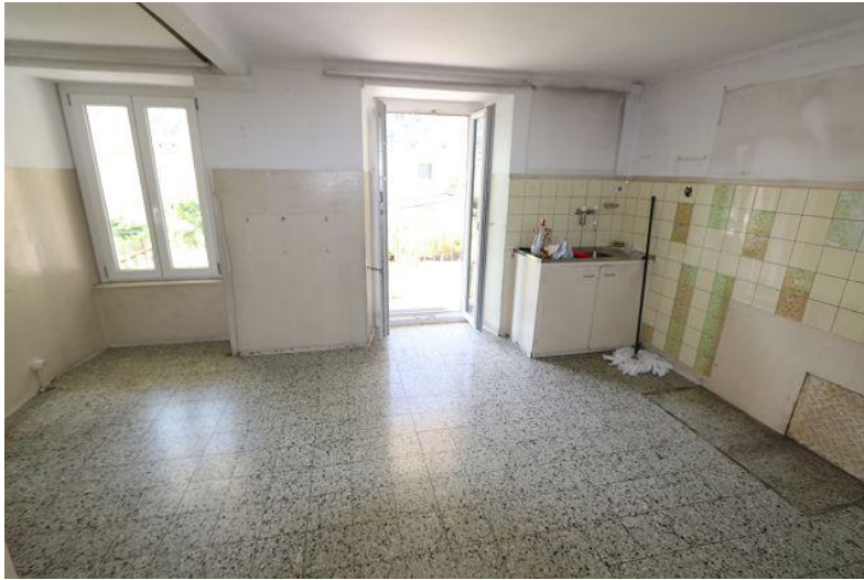
Wohnküche / cucina abitabile