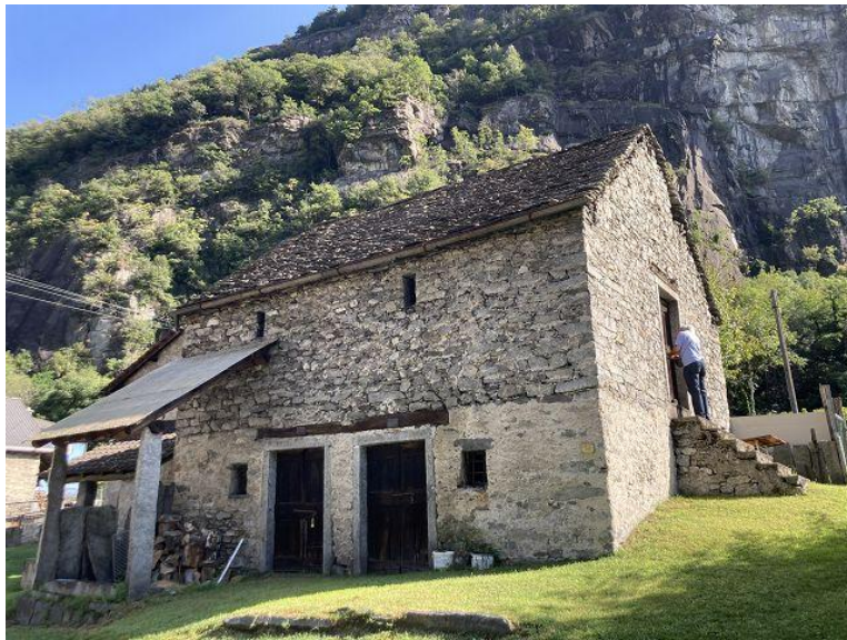
Innenbereich / interno