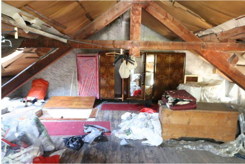
Estrich / solaio