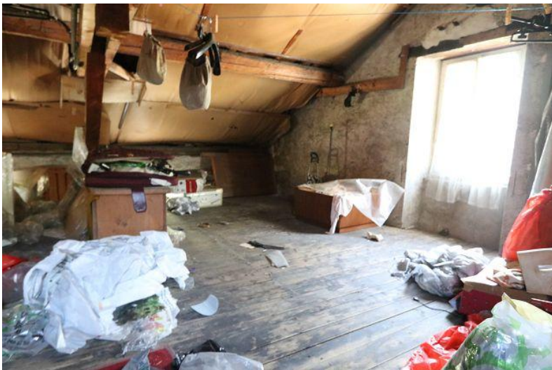
Estrich / solaio