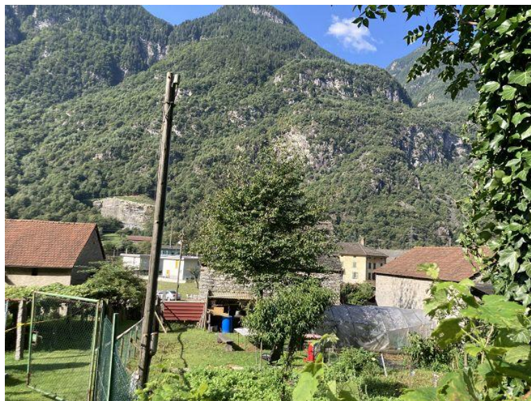
Garten / Bauland / giardino / terreno edificabile