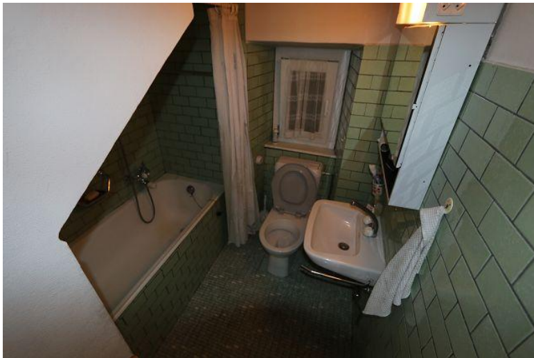
Bad / bagno