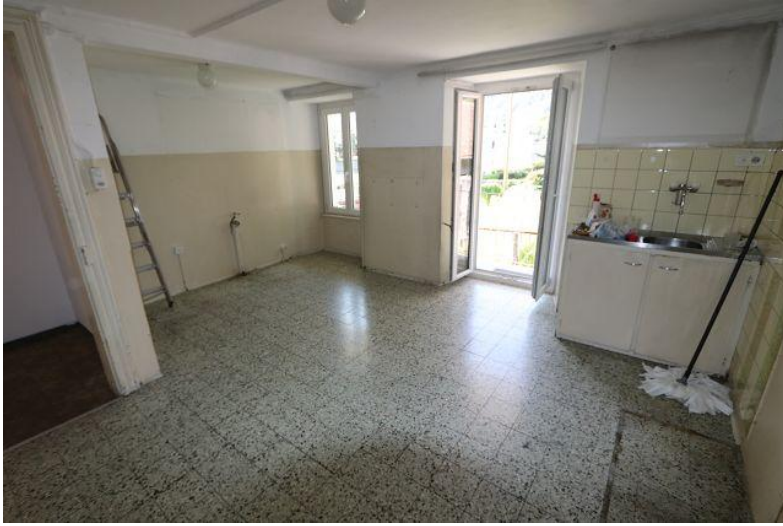
Wohnküche / cucina abitabile