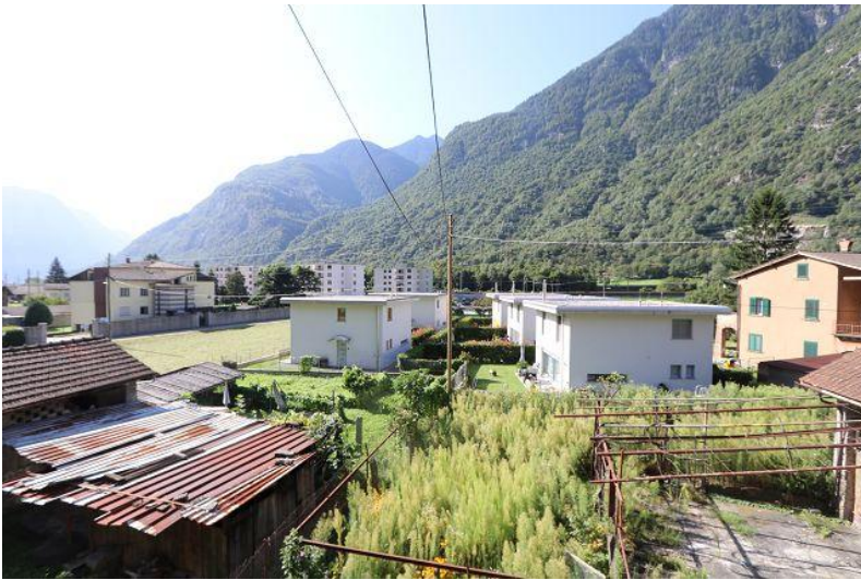
Garten / giardino