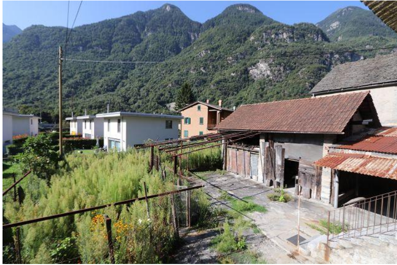
Nebengebäude / edifici