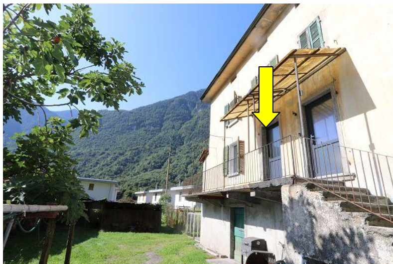
Südfassade mit Eingang / facciata sud con entrata