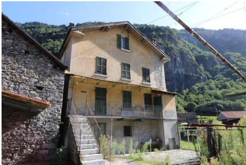
Westfassade/ facciata ovest