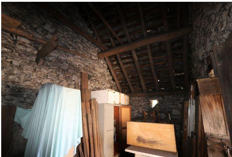
Innenbereich / interno