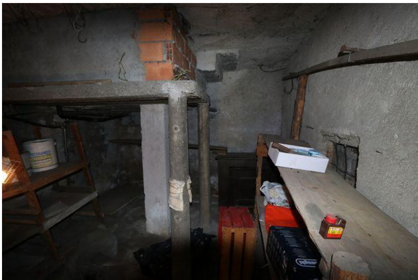
Keller / cantina