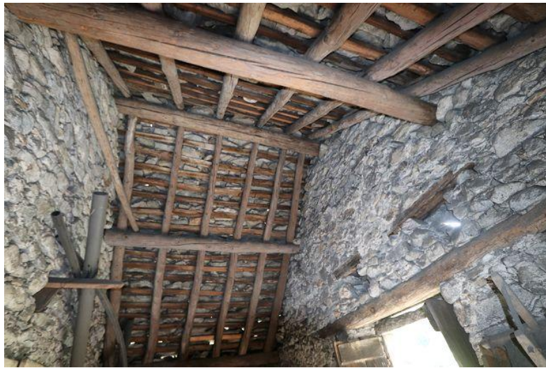
Dachkonstruktion / tetto