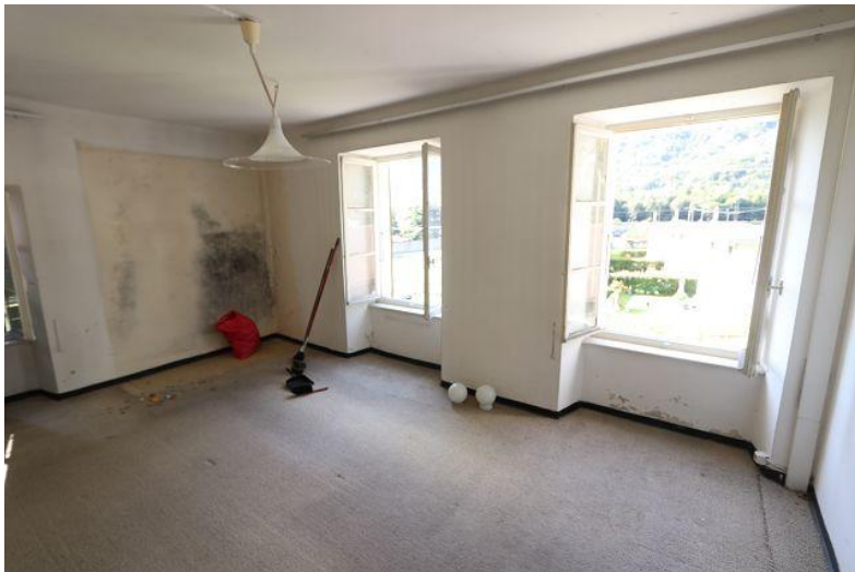
Wohnraum / soggiorno