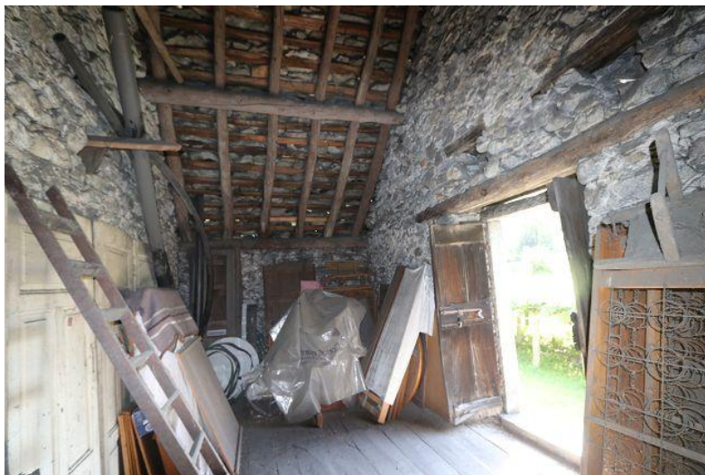
Innenbereich / interno