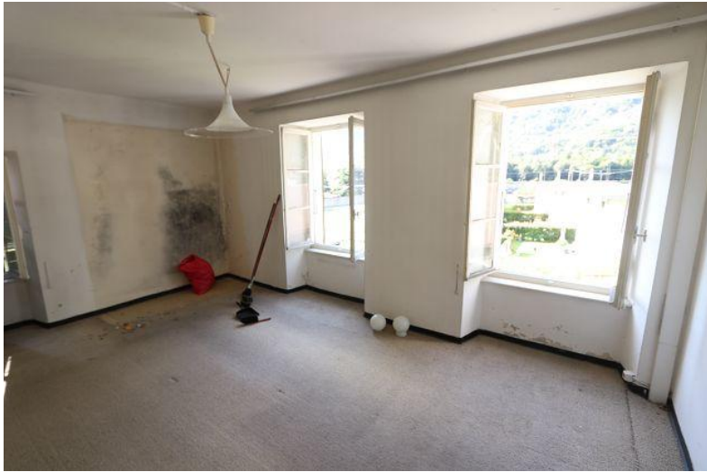
Wohnraum / soggiorno