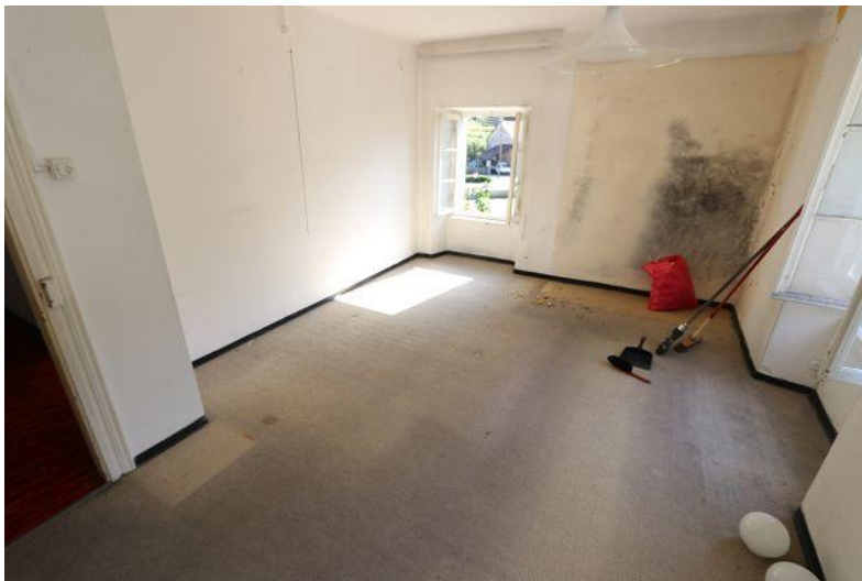
Wohnraum / soggiorno