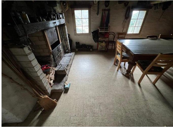
Wohnzimmer mit Kamin / soggiorno con camino