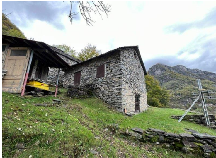
Seilbahnstation / funicolare