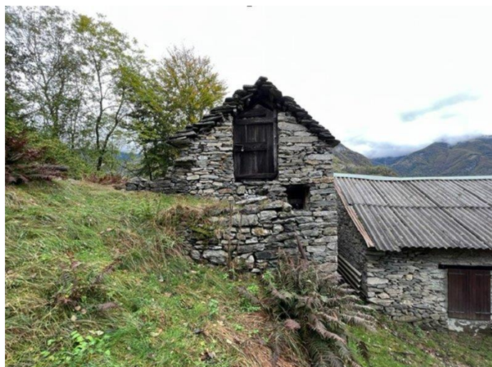
Nachbargebäude / stalla del vicino