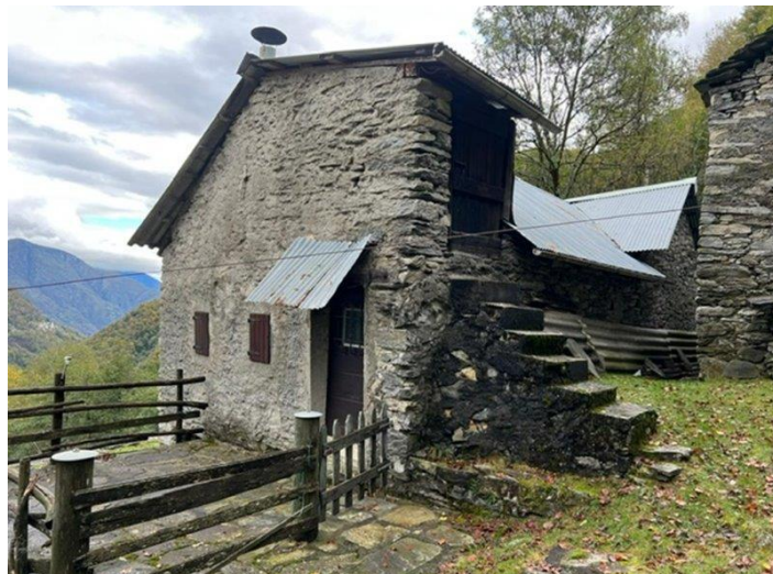
Hausansicht / vista casa