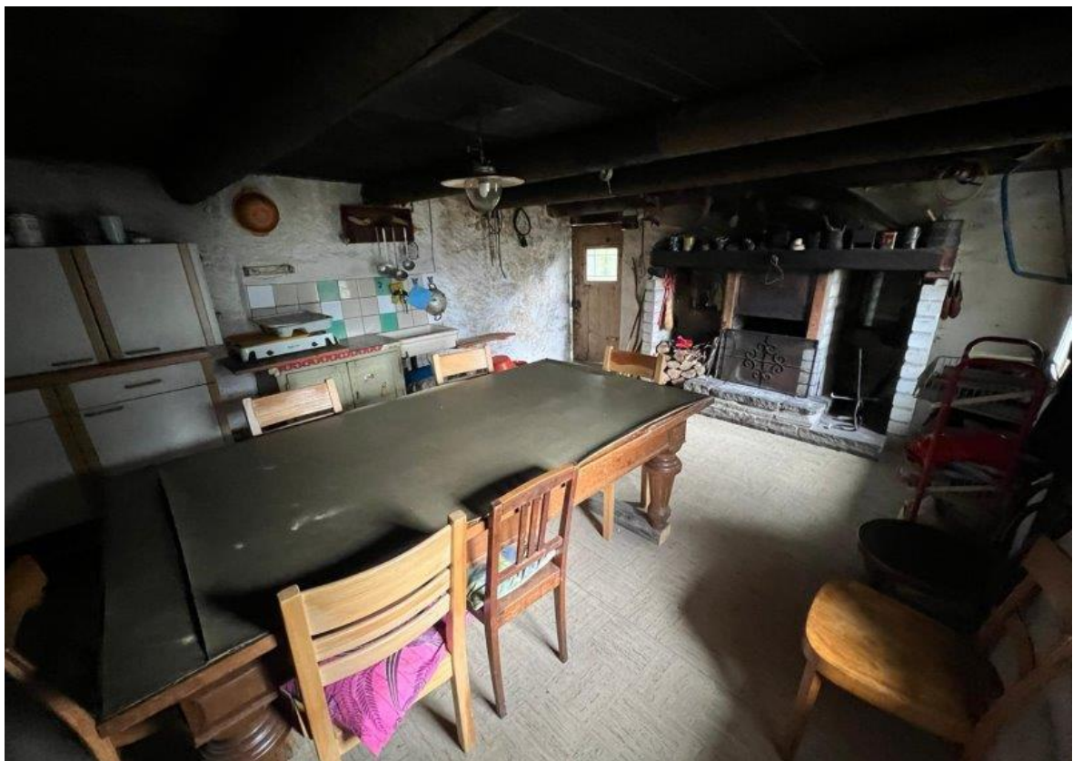
Wohnzimmer mit Küche / soggiorno con cucina