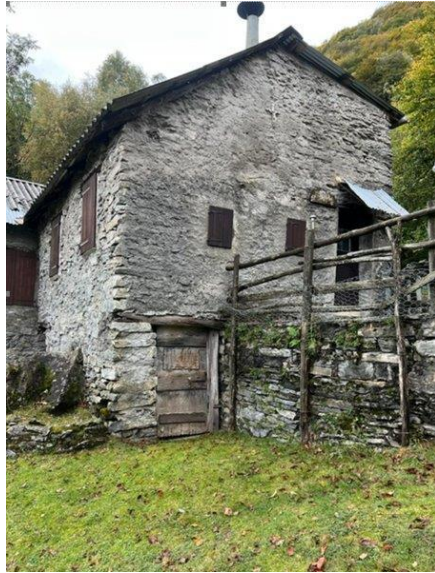
Haupteingang und Kellereingang / entrata casa e cantina