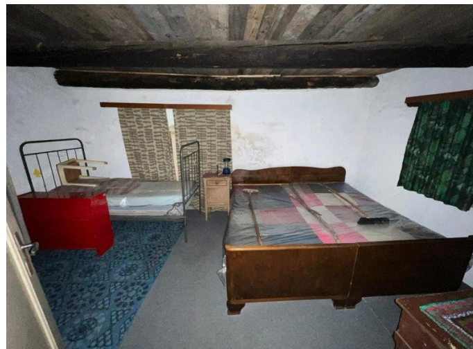
Schlafzimmer 1 / camera da letto 1