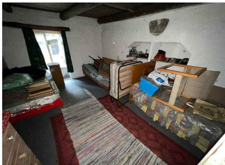
Schlafzimmer 2 / camera da letto 2