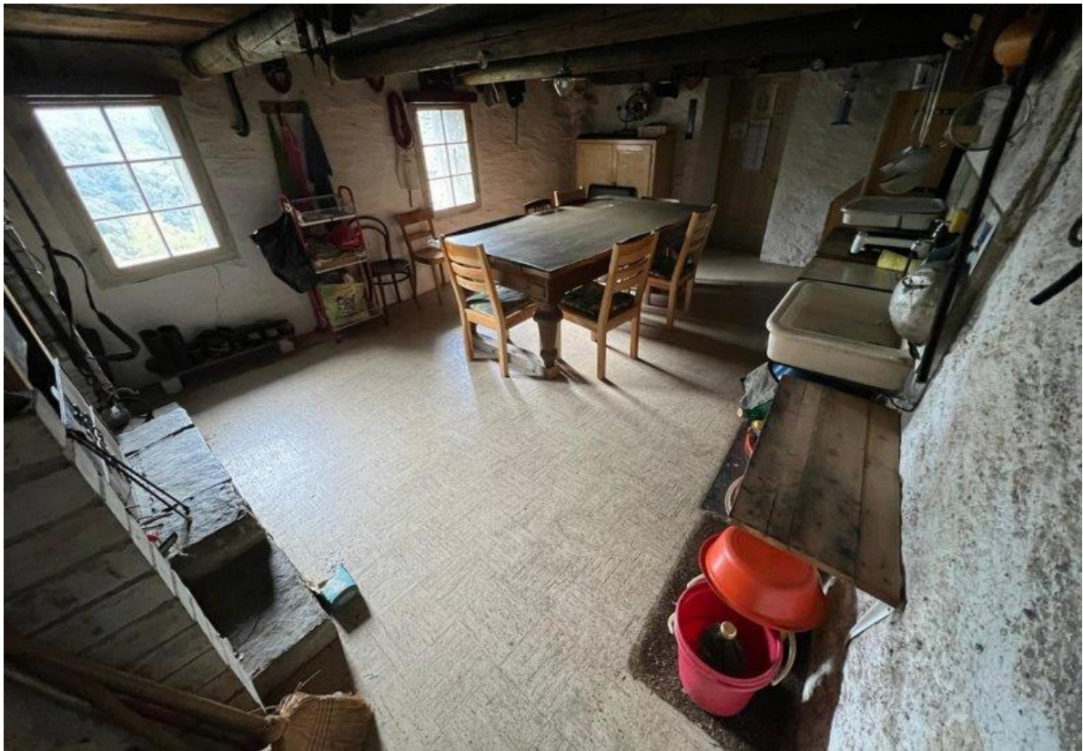
Wohnzimmer / soggiorno