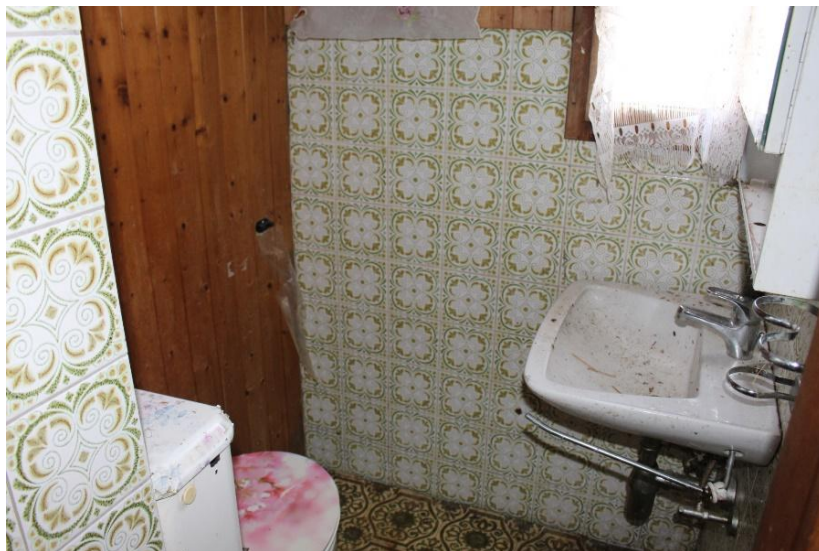
WC 1. Stock / WC 1. piano