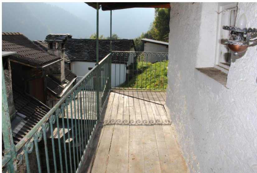
Balkon / balcone