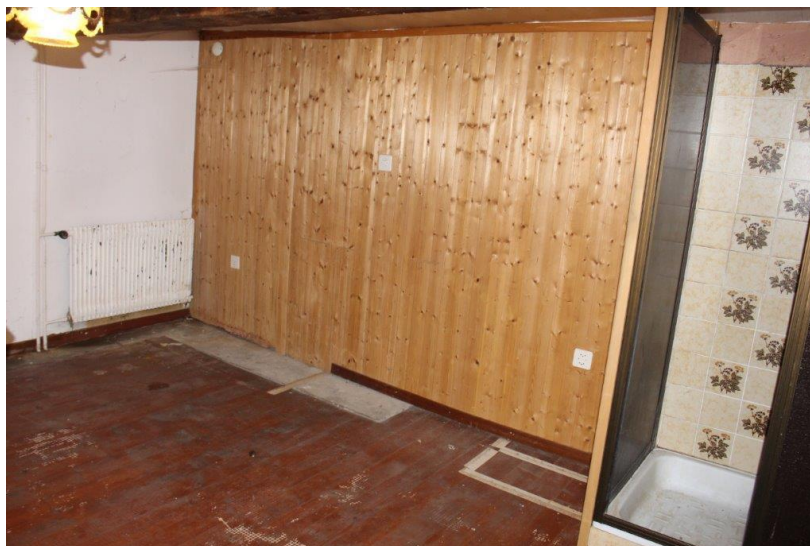
Zimmer mit Dusche /camera con doccia