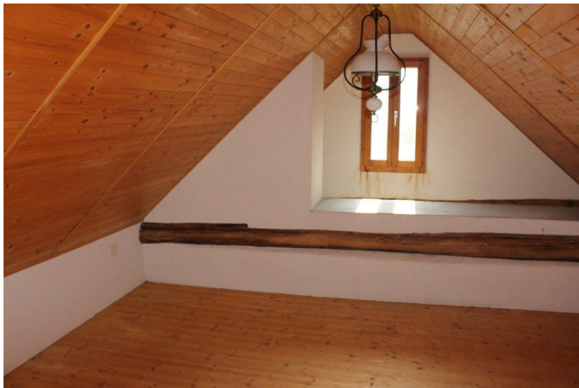
Dachzimmer / camera nel solaio