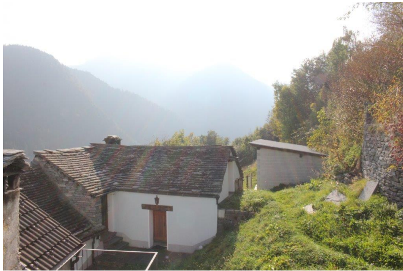
Aussicht / vista dintorno