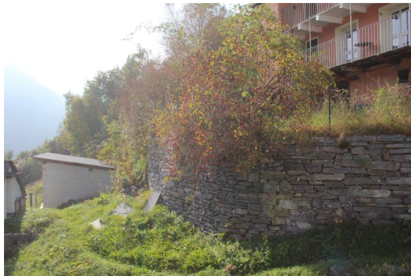
Aussicht / Vista dintorno