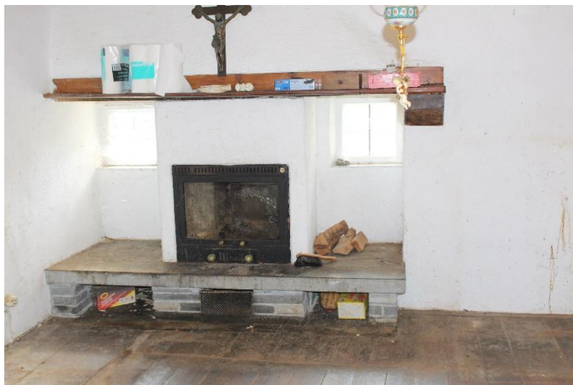
Wärmelufthof / camino aria calda