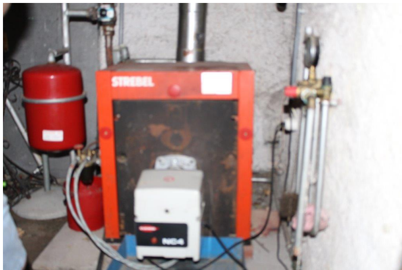
Heizung / riscaldamento