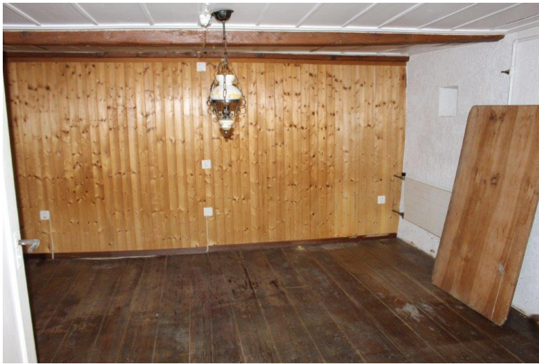
Schlafzimmer / camera da letto