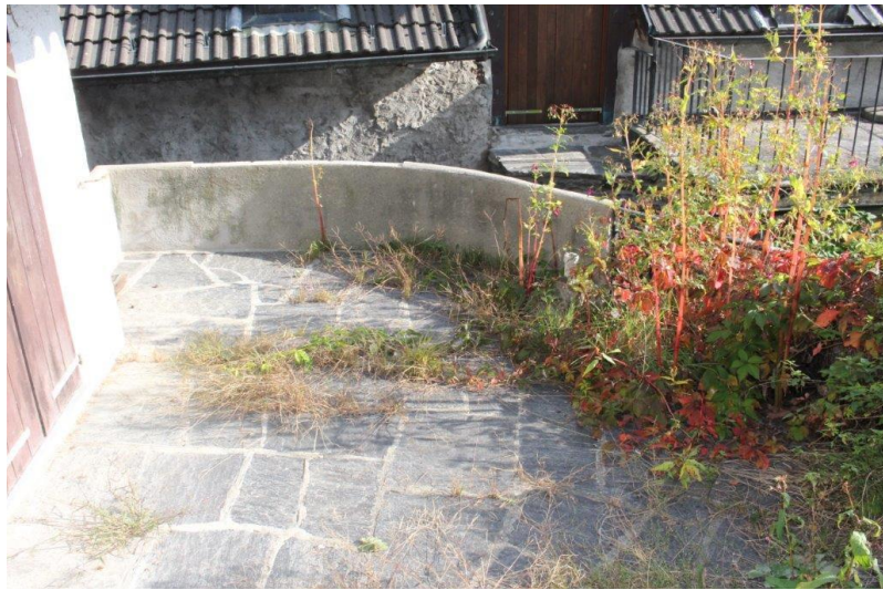
Terrasse / terrazza