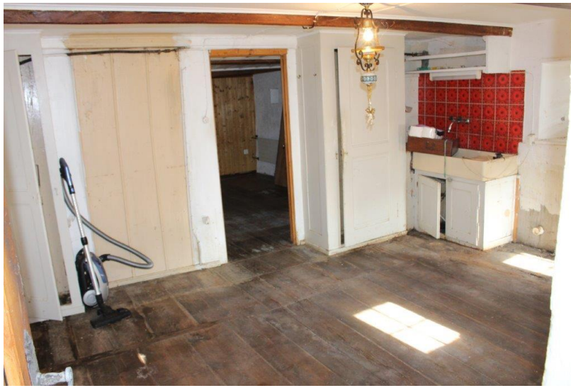
Wohnraum / soggiorno