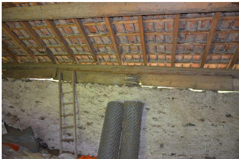
Dachraum / primo piano