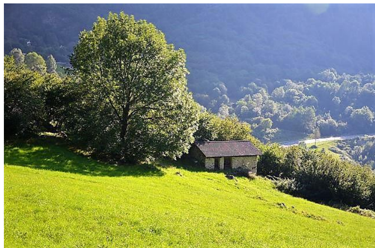
Umgebung / dintorno