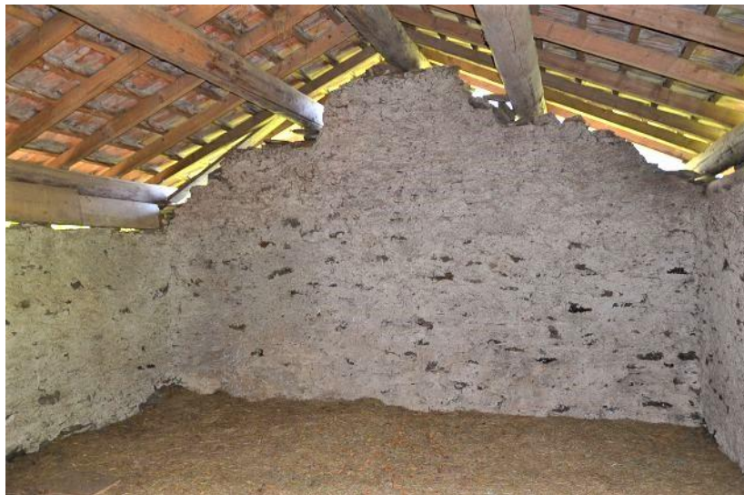
Dachraum / primo piano