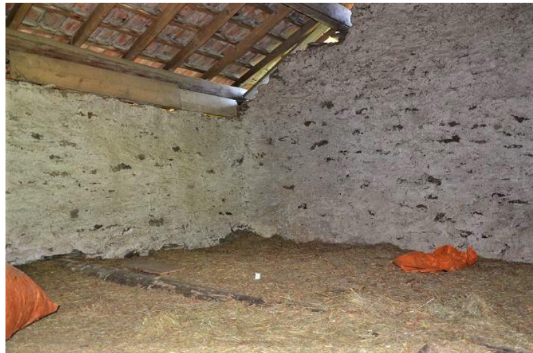
Dachraum / primo piano