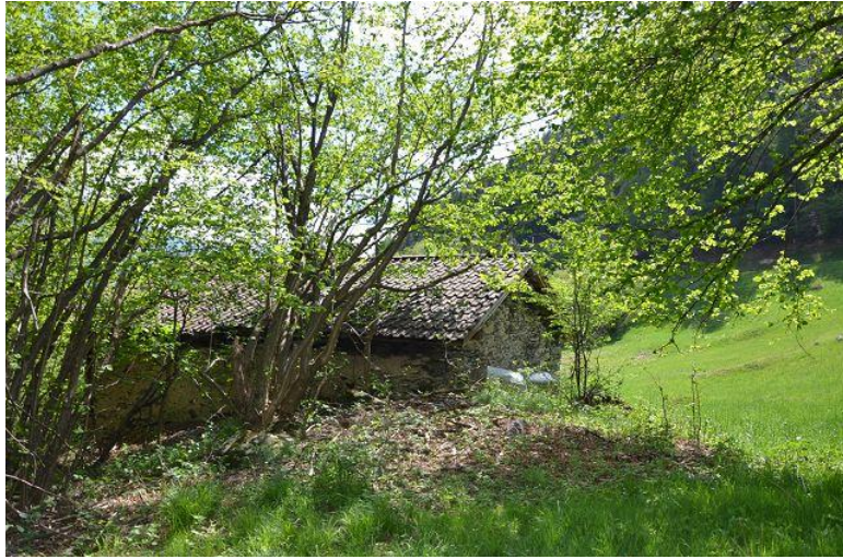
Umgebung / dintorno