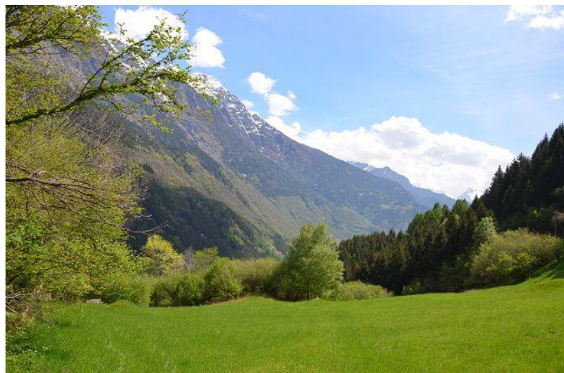
Ausblick / vista