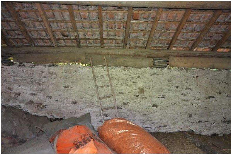
Dachraum / primo piano