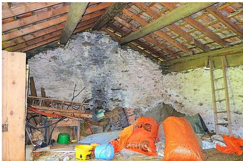
Dachraum / primo piano