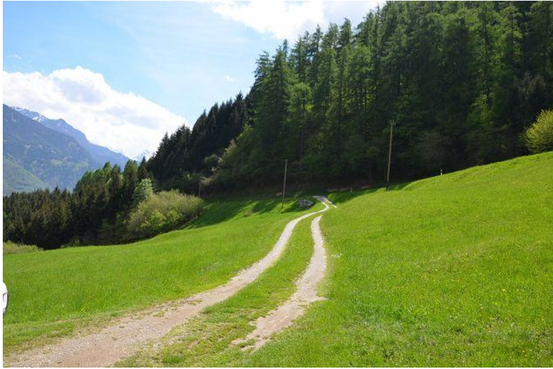
Zufahrt / accesso