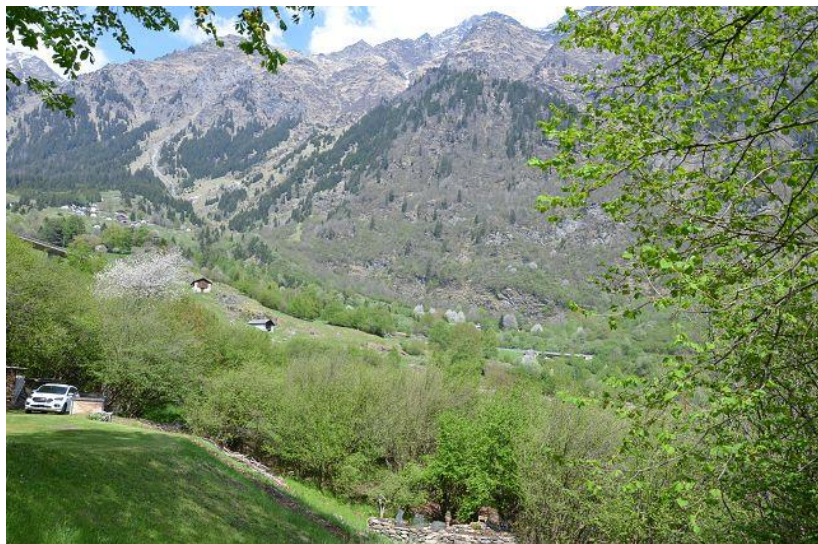
Ausblick / vista