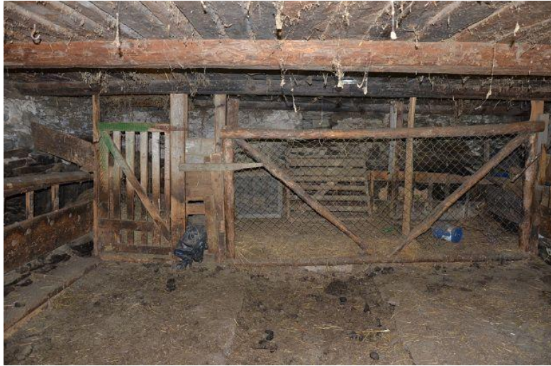
Innenraum Erdgeschoss / interno piano terra