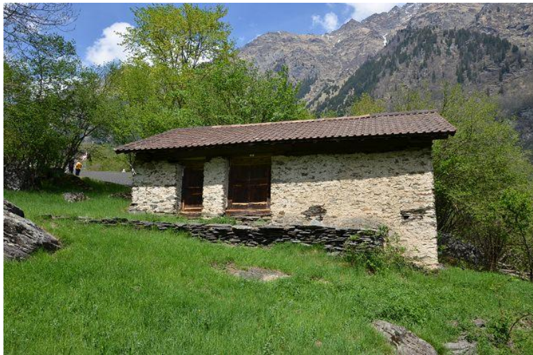
Umgebung / dintorno