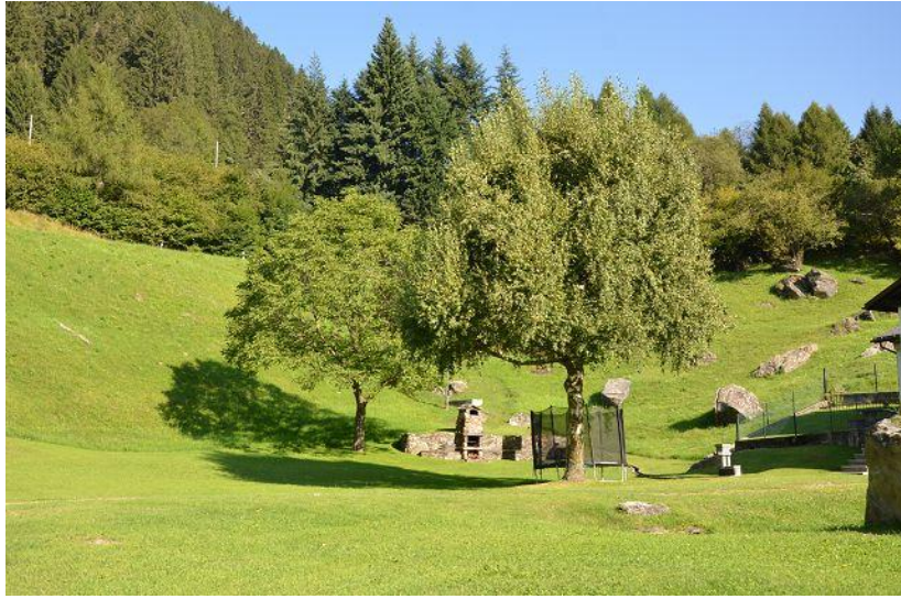
Ausblick / vista