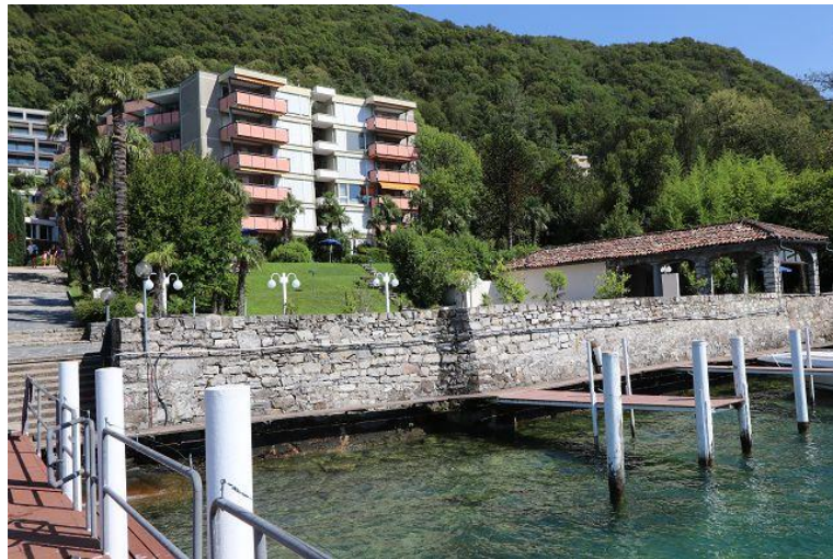
Residenza Lago di Lugano