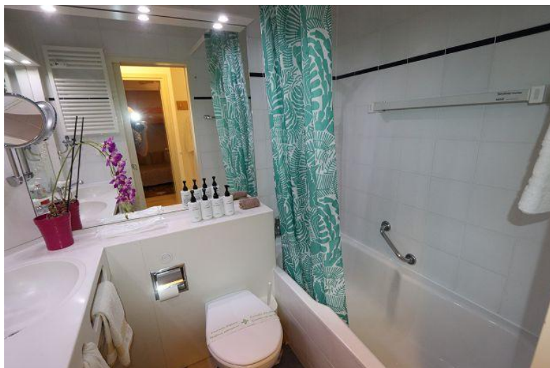
Dusche / doccia