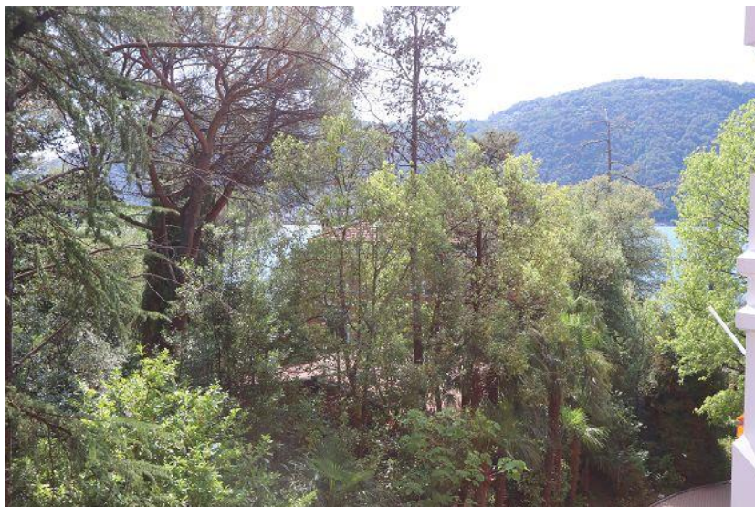
Aussicht / vista