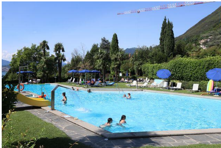
Schwimmbadalage / piscina