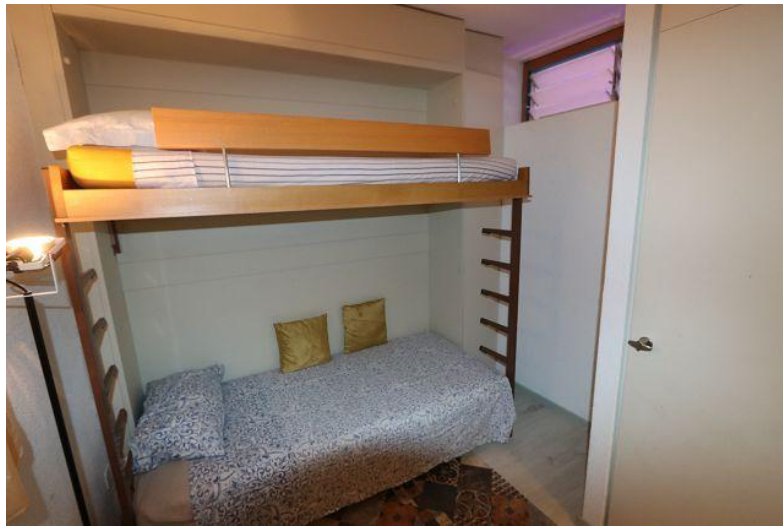
Zimmer / camera