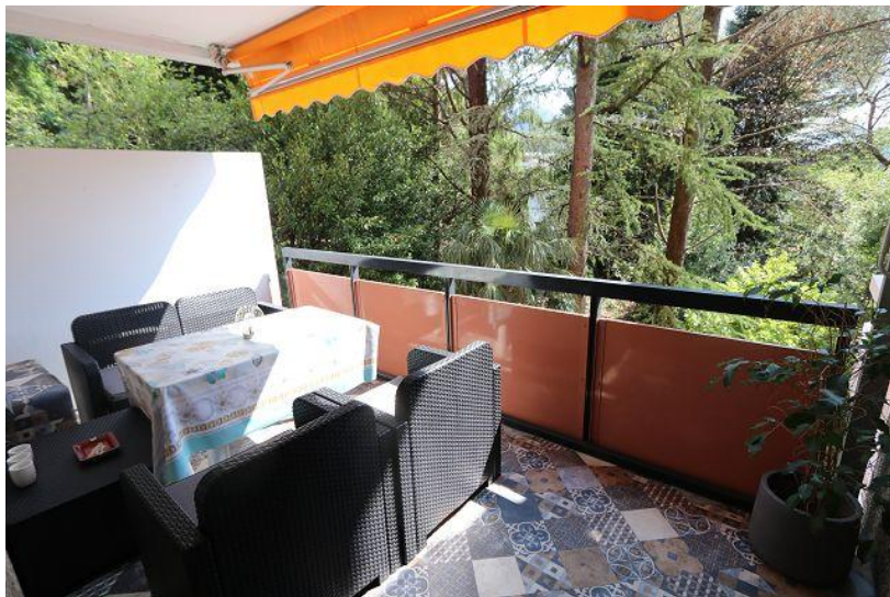
Balkon / balcone