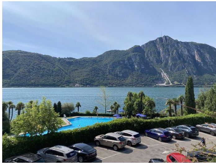
Blick auf Schwimmbad / vista versa piscina