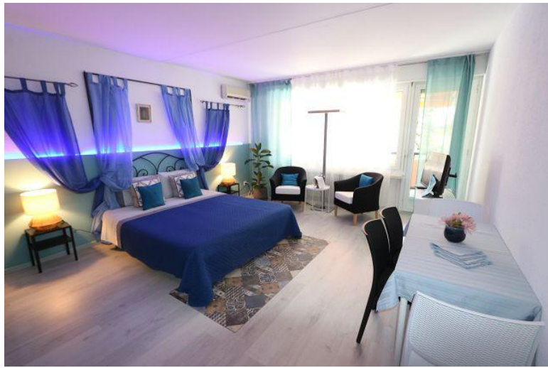
Wohnraum / soggiorno