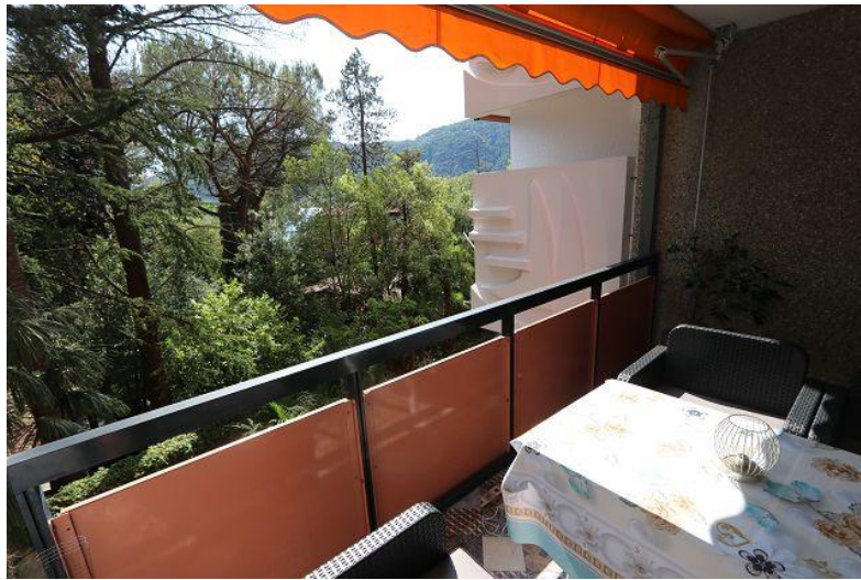
Balkon / balcone