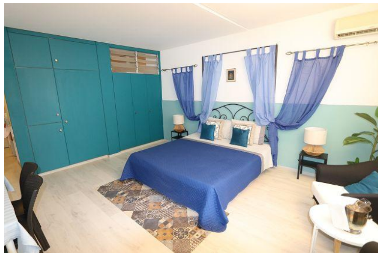
Wohnraum / soggiorno