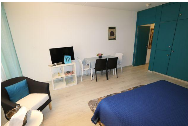
Wohnraum / soggiorno