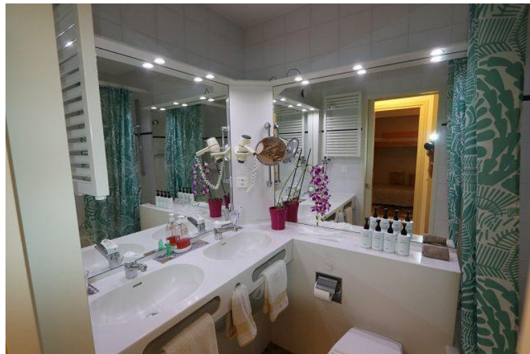
Dusche / doccia