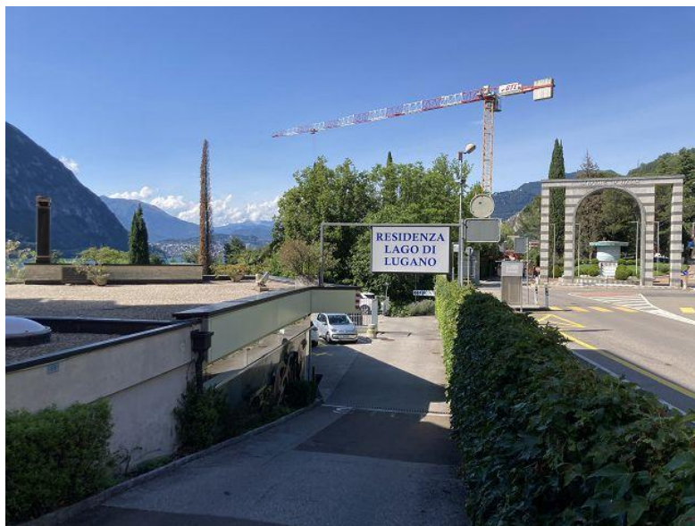
Zufahrt / accesso