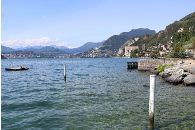
Blick nach Lugano / vista verso Lugano