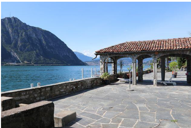
Seeterrasse / terrazza al lago