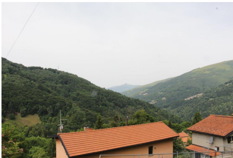
Aussicht / vista