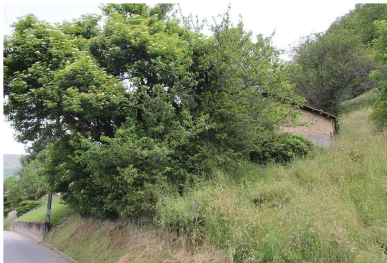
Grundstück / terreno