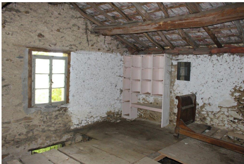
Innenbereich / interni