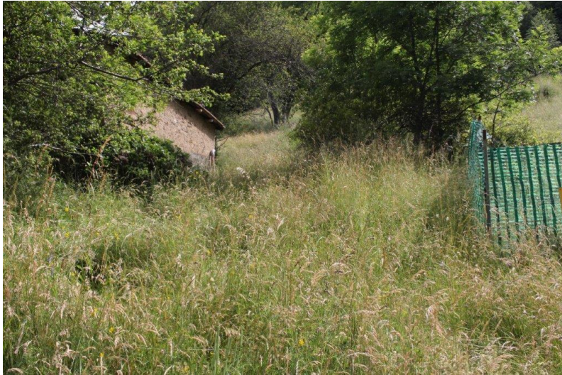
Grundstück / terreno