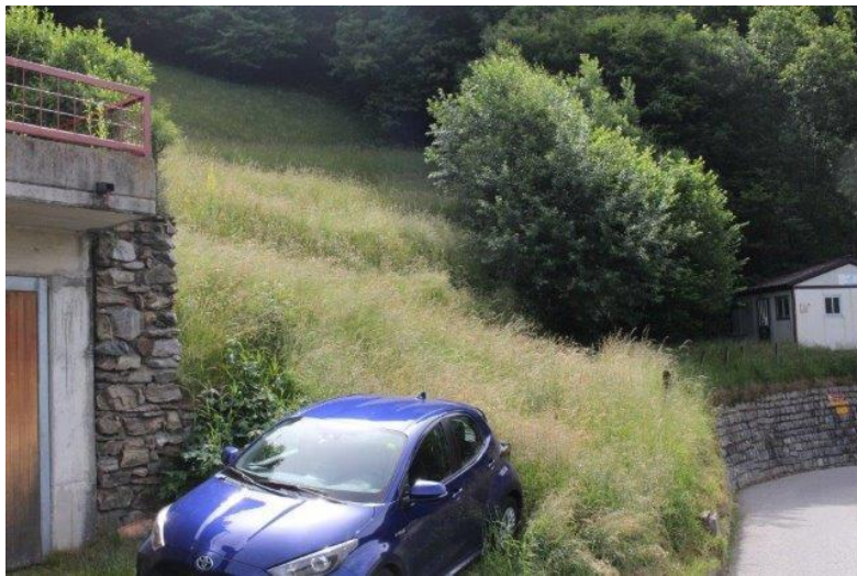
Parkplatz / posteggio