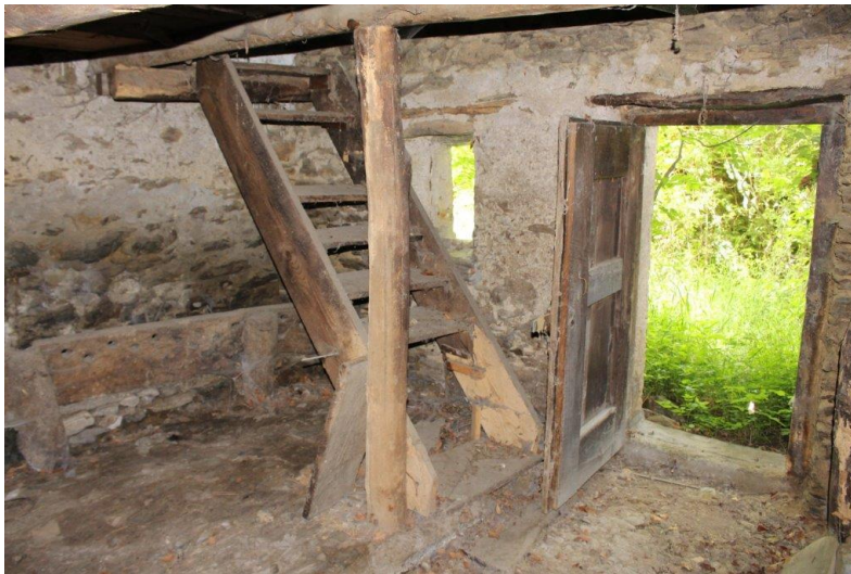
Innenbereich / interni