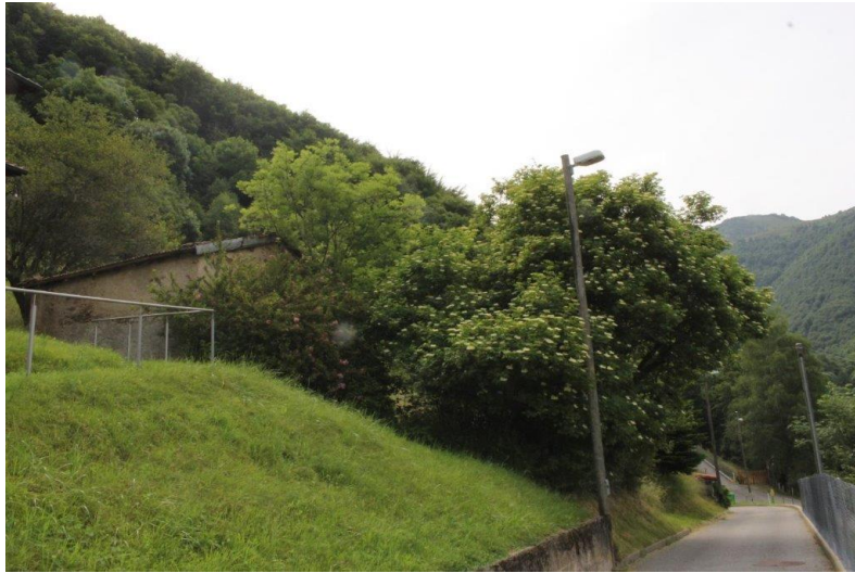
Grundstück / terreno