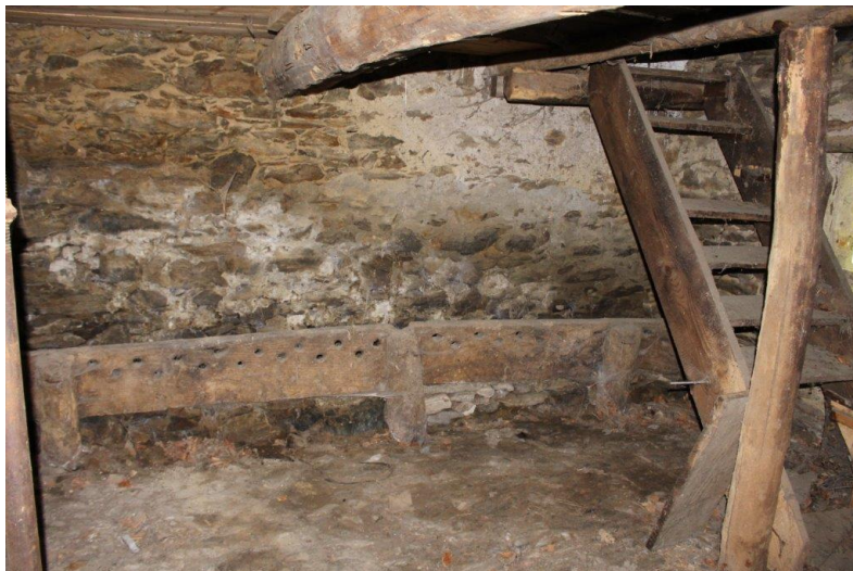
Innenbereich / interni