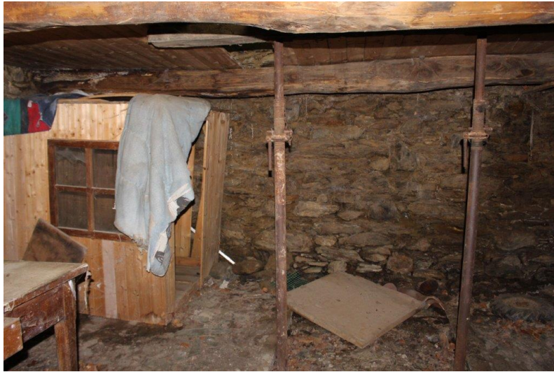
Innenbereich / interni