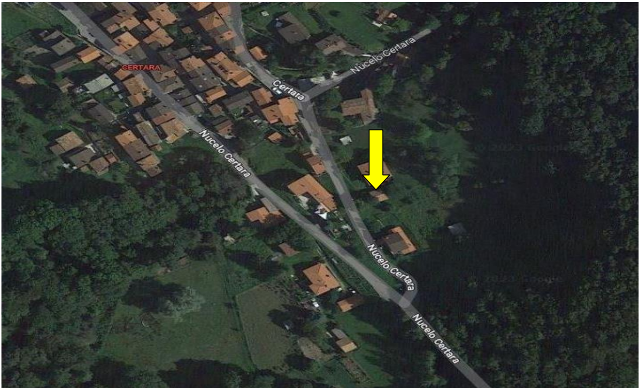
Lageplan / posizione