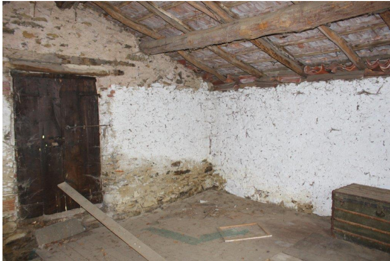
Innenbereich / interni