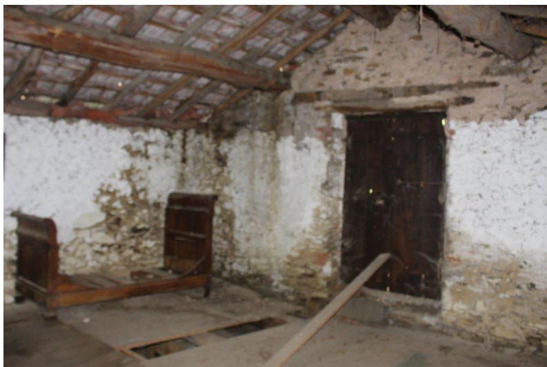
Innenbereich / interni