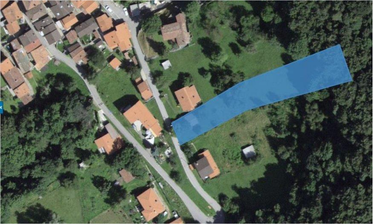
Parzelle / parcella