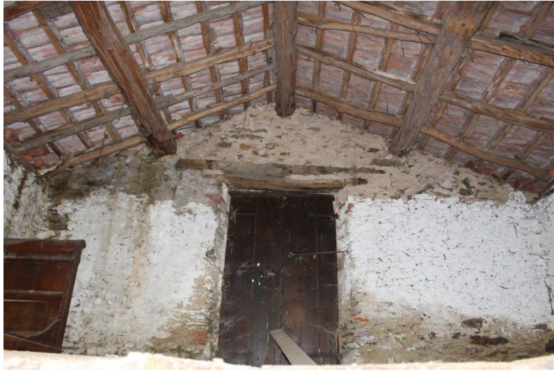
Dach / tetto