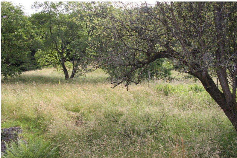
Grundstück / terreno