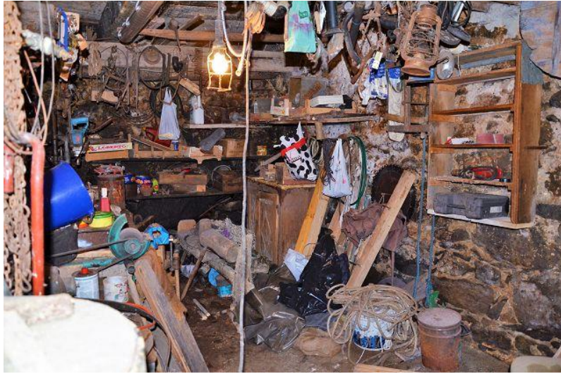
Keller / cantina