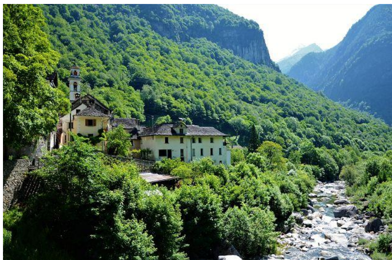
Umgebung / dintorni