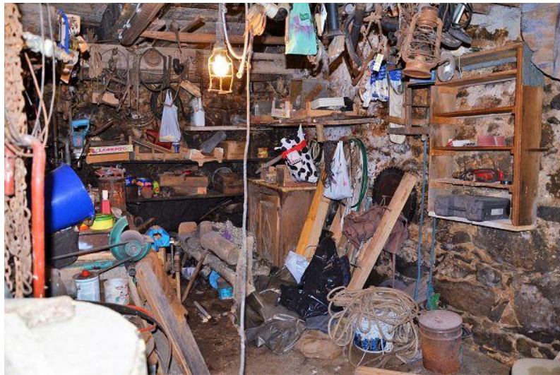
Keller / cantina