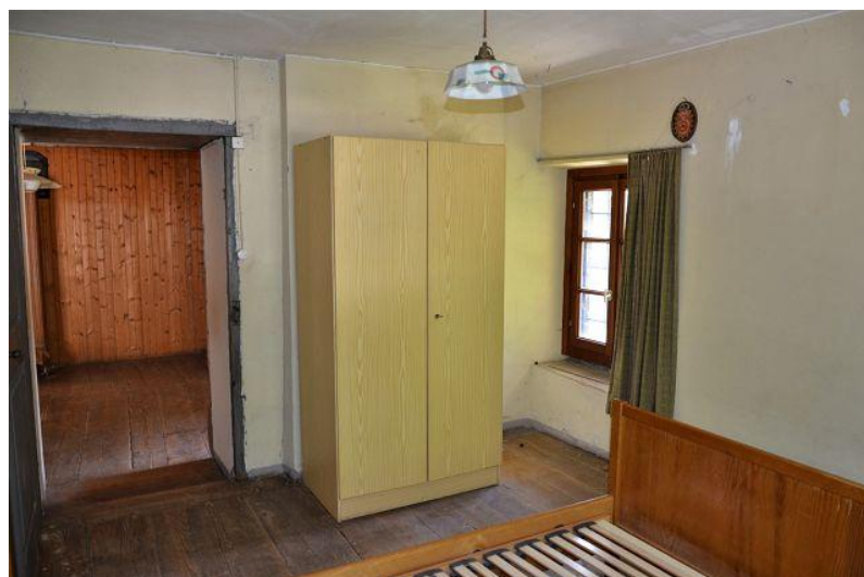
Zimmer 2. OG / camera P2