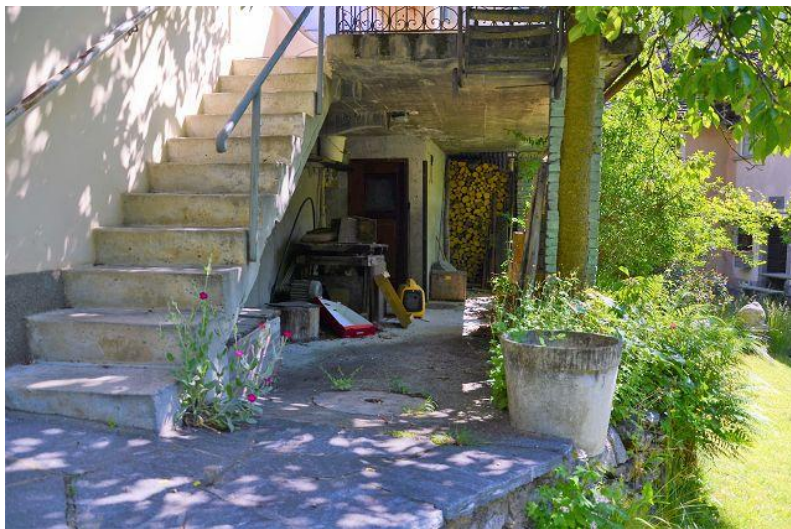
Eingang / ingresso