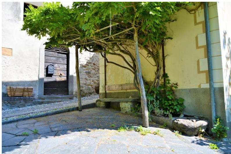
Pergola / pergola