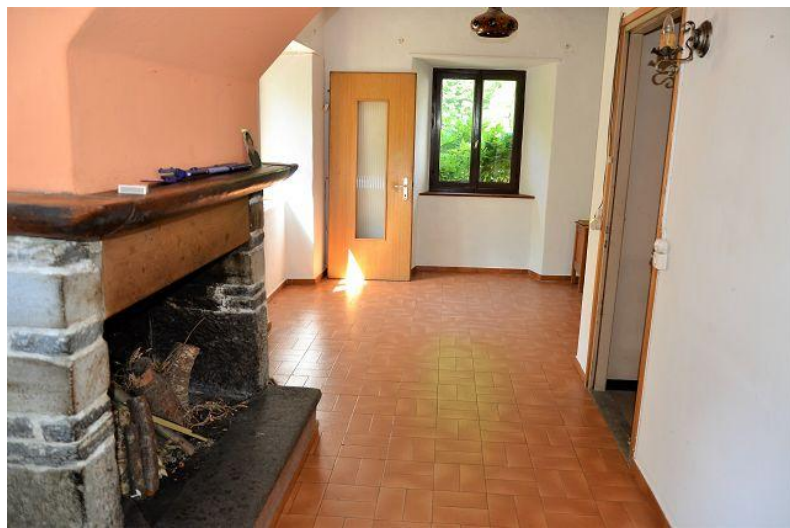
Wohnzimmer 1. OG / soggiorno PP