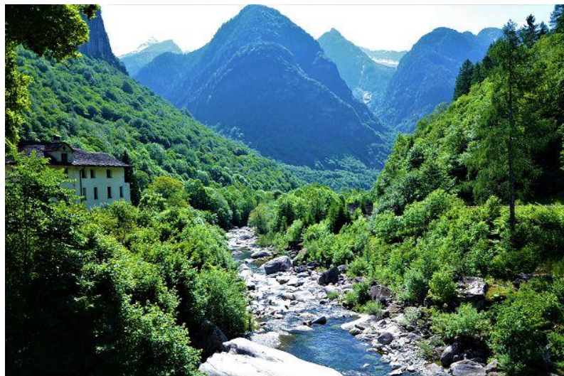
Aussicht / vista