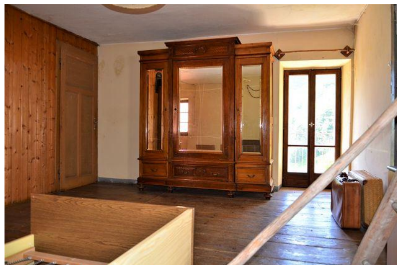
Zimmer 2. OG / camera P2