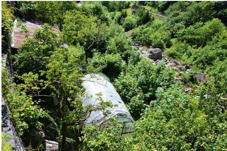
Garten neben dem Fluss / giardino vicino al fiume