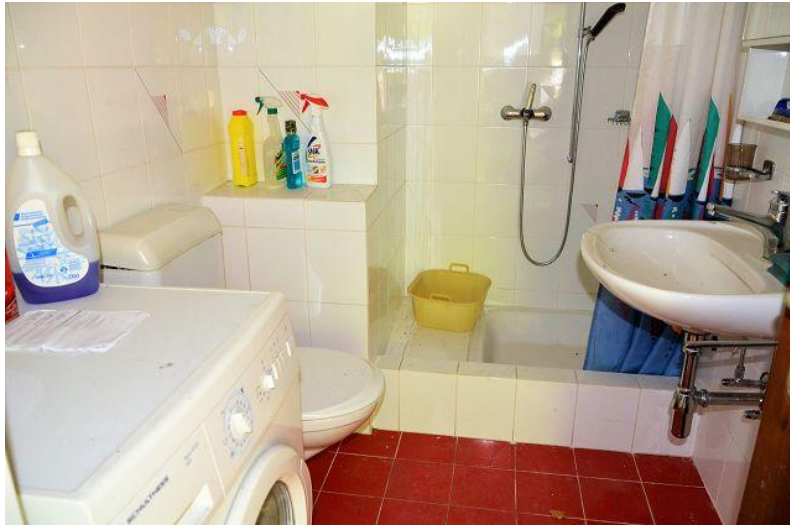
WC – Dusche EG / WC – doccia PT