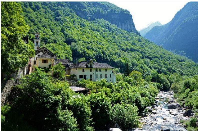
Umgebung / dintorni