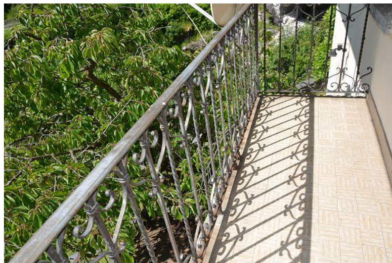
Balkon 2. OG / balcone 2P