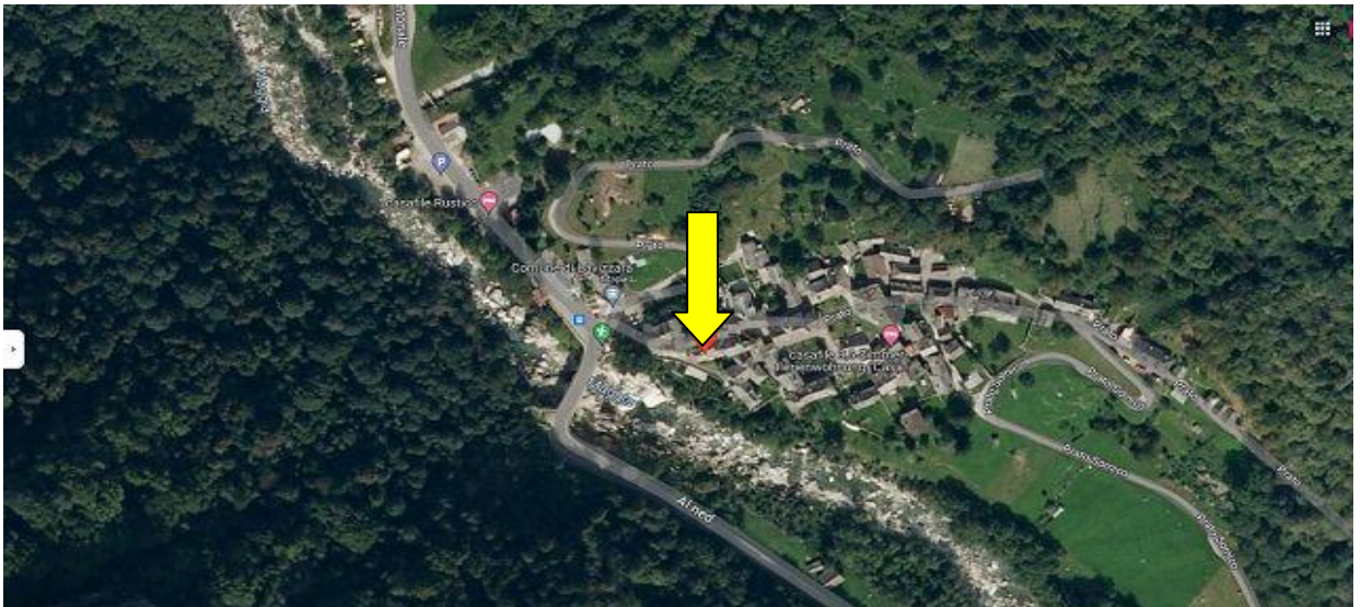
Lage / posizione