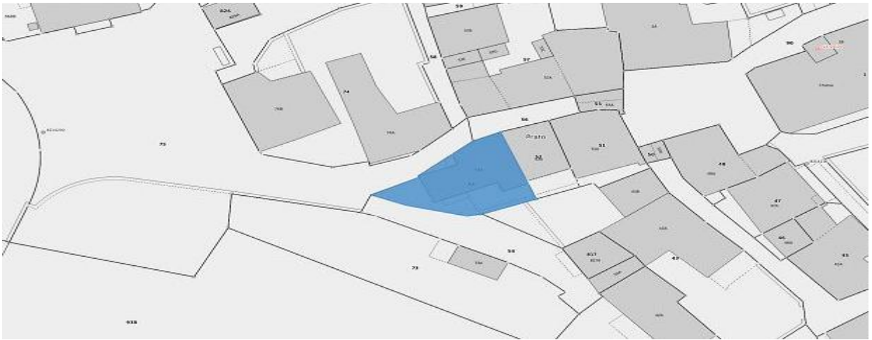
Parzelle / parcella