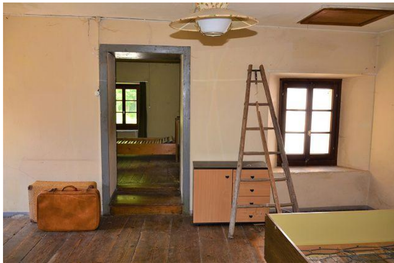
Zimmer 2. OG / camera P2