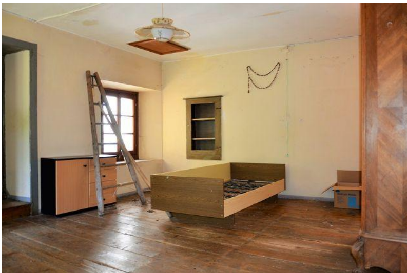
Zimmer 2. OG / camera P2