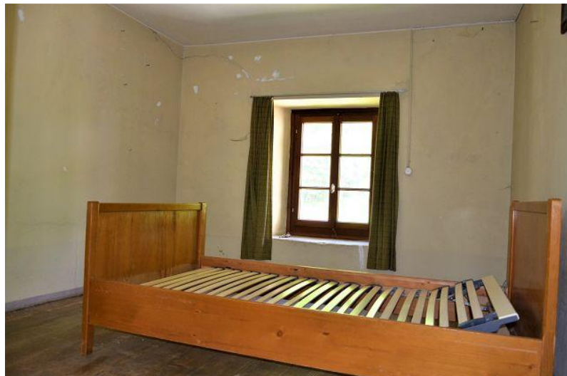
Zimmer 2. OG / camera P2