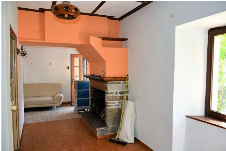
Wohnzimmer 1. OG / soggiorno PP