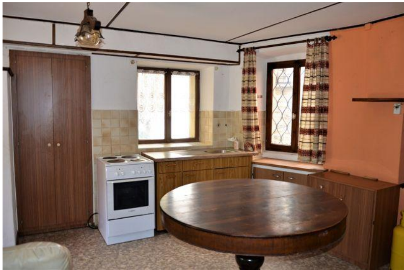
Küche / cucina