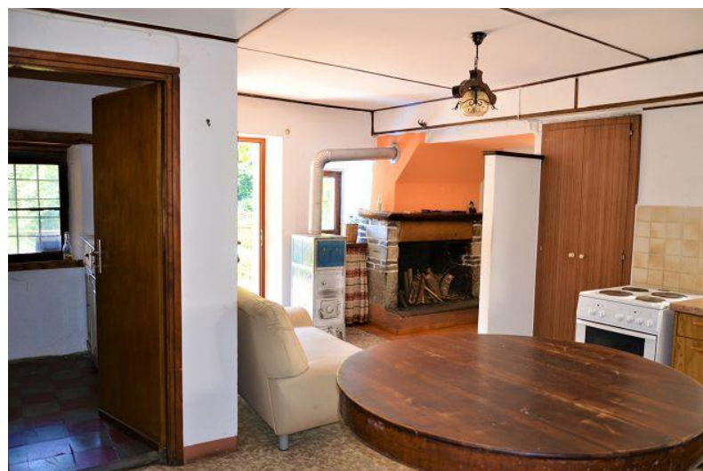
Wohnzimmer 1. OG / soggiorno PP