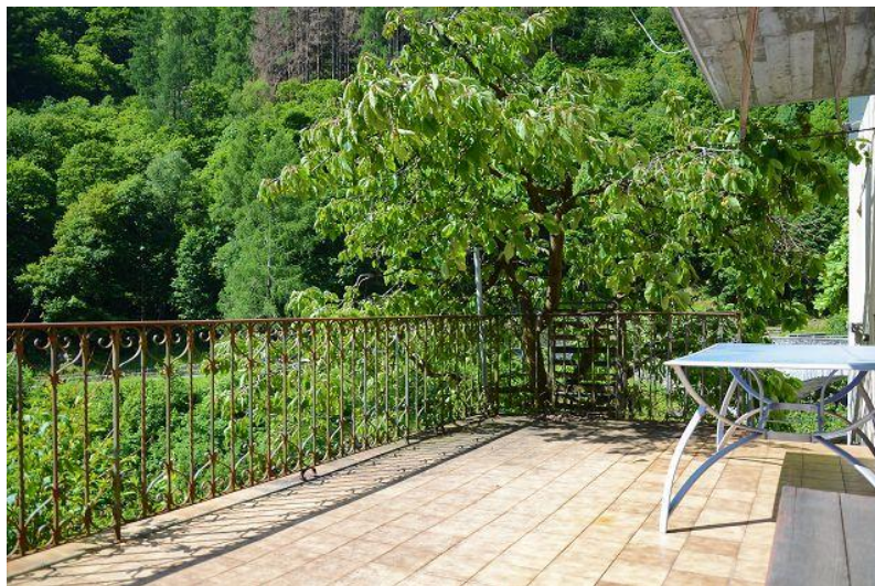
Terrasse / terrazza