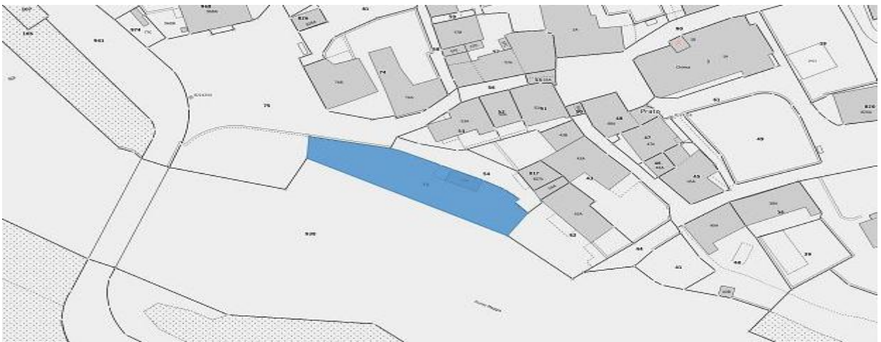
Parzelle / parcella