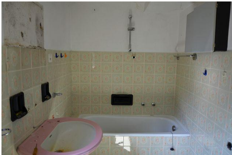
WC mit Badewanne EG / WC con vasca da bagno PT