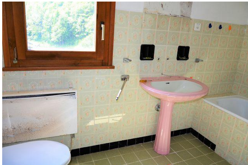
WC mit Badewanne EG / WC con vasca da bagno PT