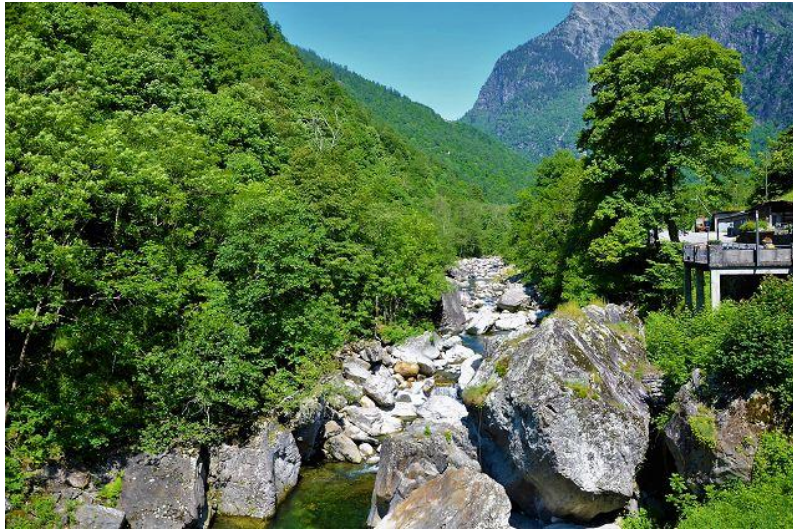
Aussicht / vista