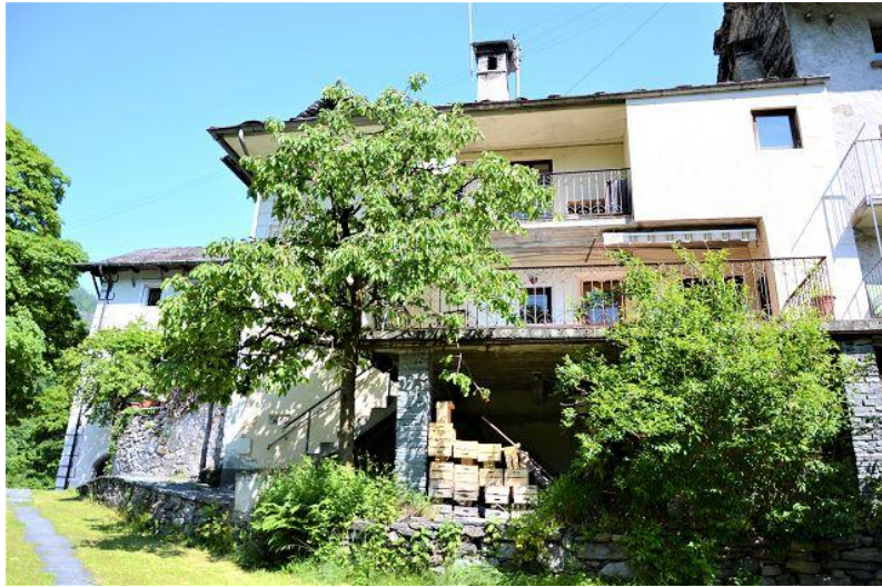
Haus / casa