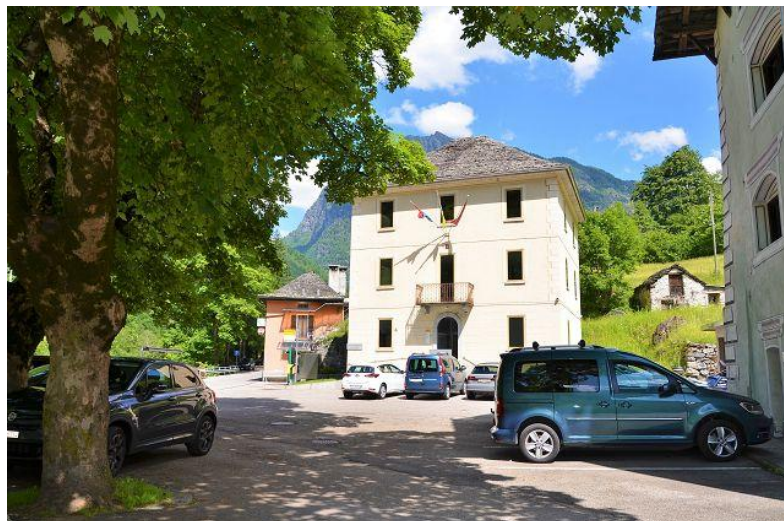
Parkplätze in der Nähe / parcheggi in vicinanza