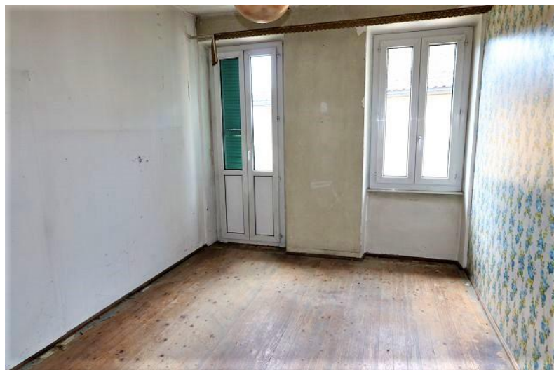
Zimmer 2. OG / camera P2