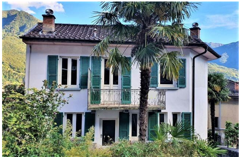
Haus / casa