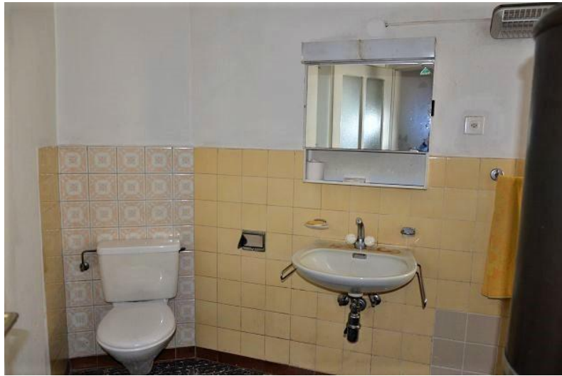
WC mit Badewanne 1. OG / WC con vasca da bagno 1. OG