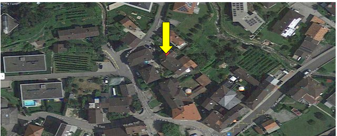
Lage / posizione