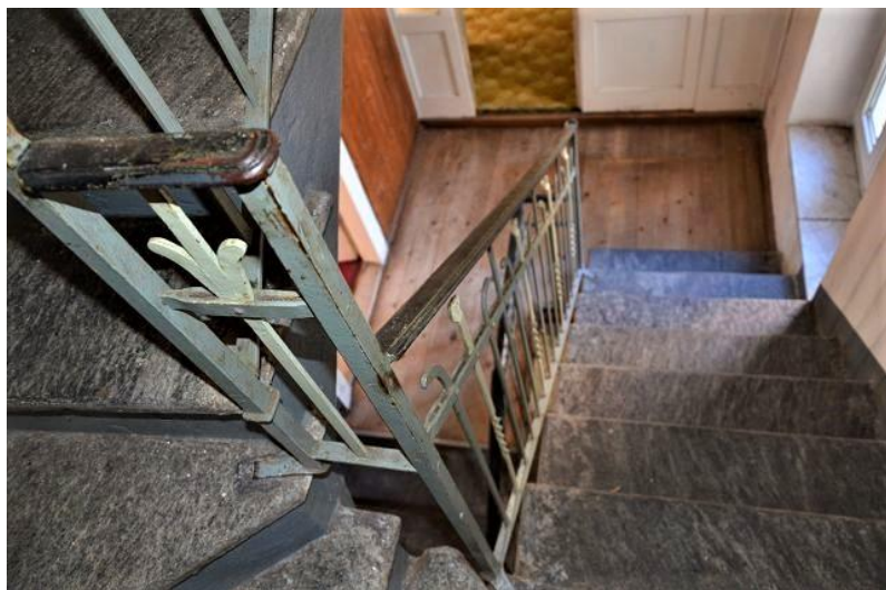
Innen Treppe / scala interna