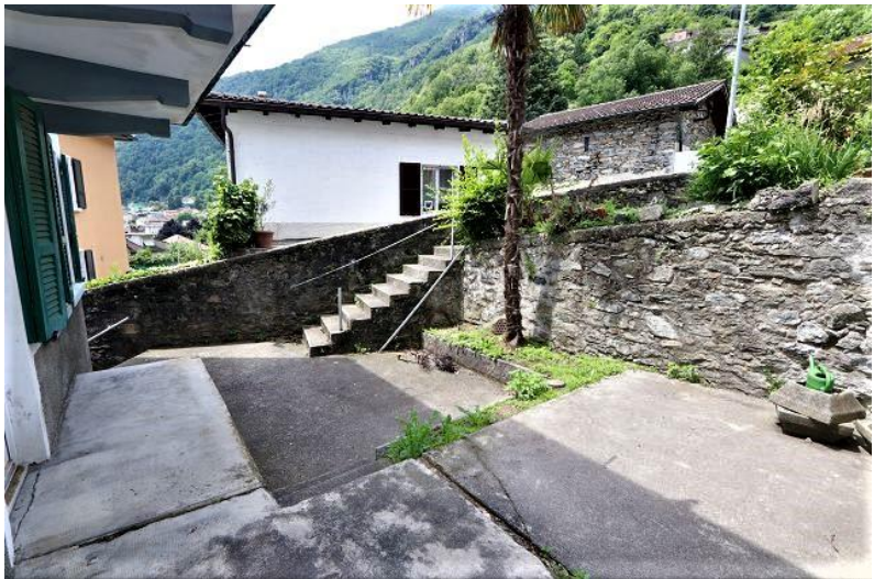
Terrasse / terrazza