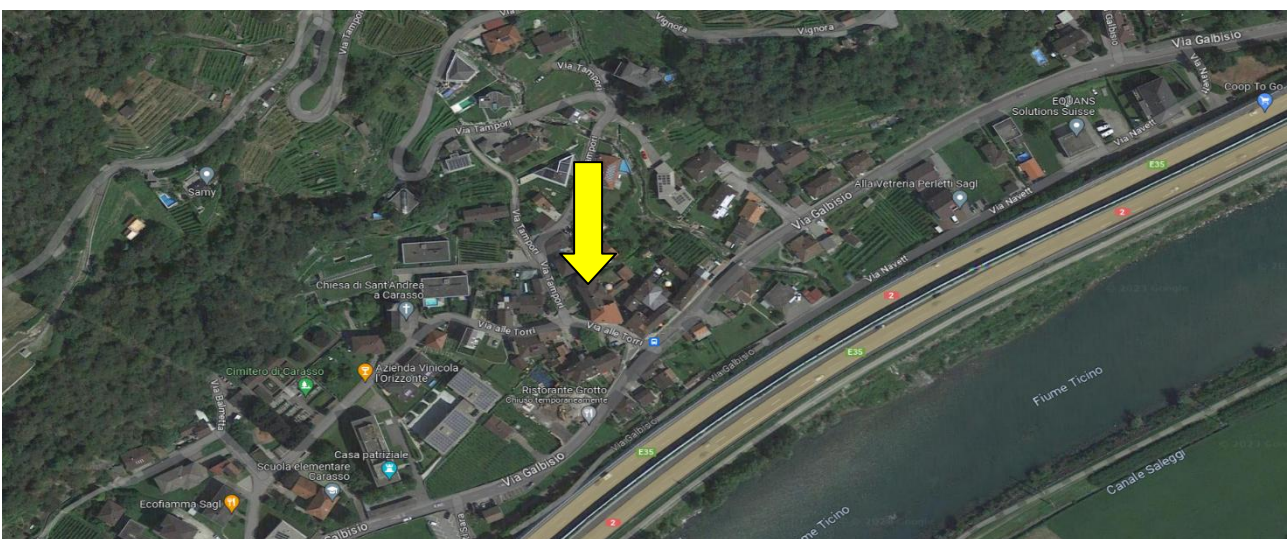
Lage / posizione