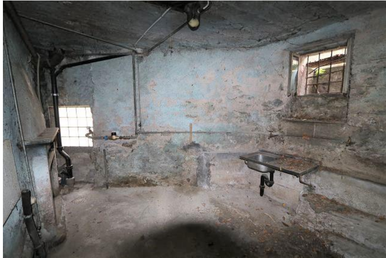
Waschküche / lavanderia