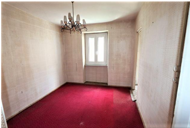
Zimmer 1. OG / camera P1