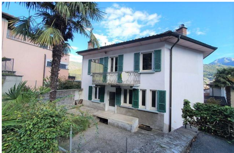
Haus / casa