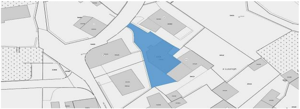
Parzelle / parcella