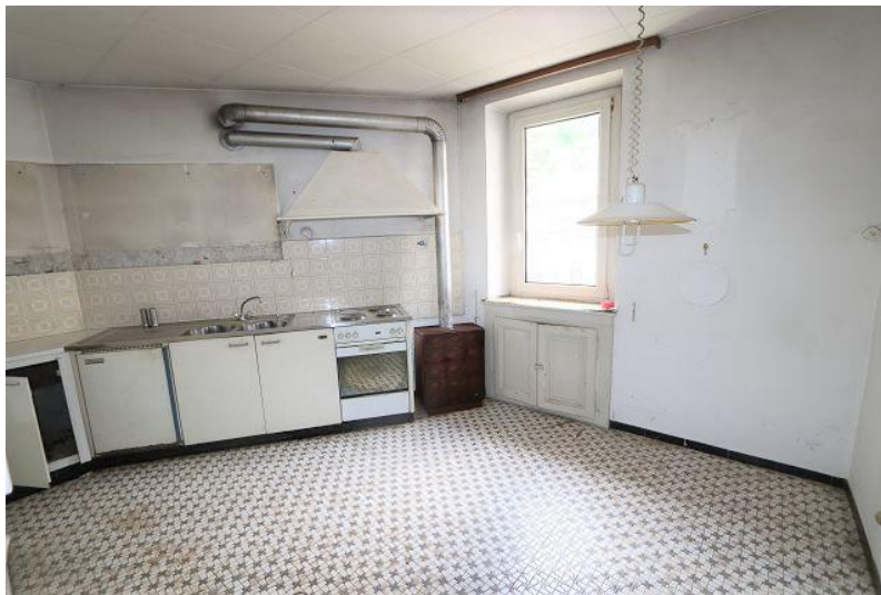
Küche 2. OG / cucina P2