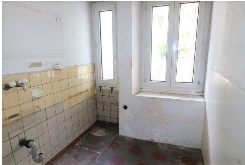
Küche 1. OG / cucina PP