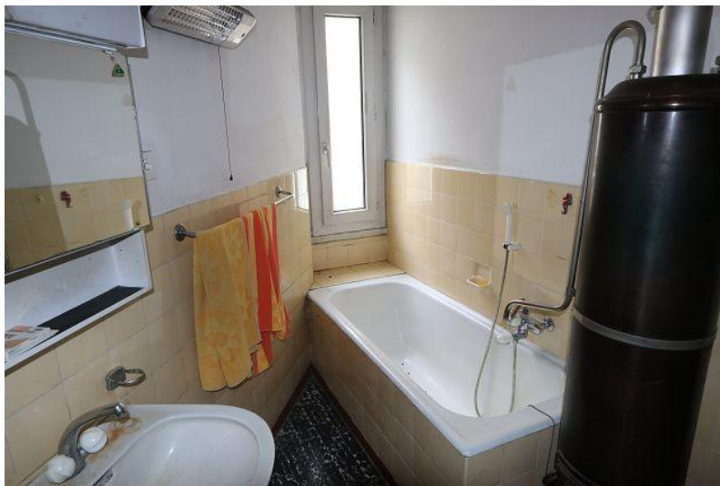
WC mit Badewanne 1. OG / WC con vasca da bagno 1. OG