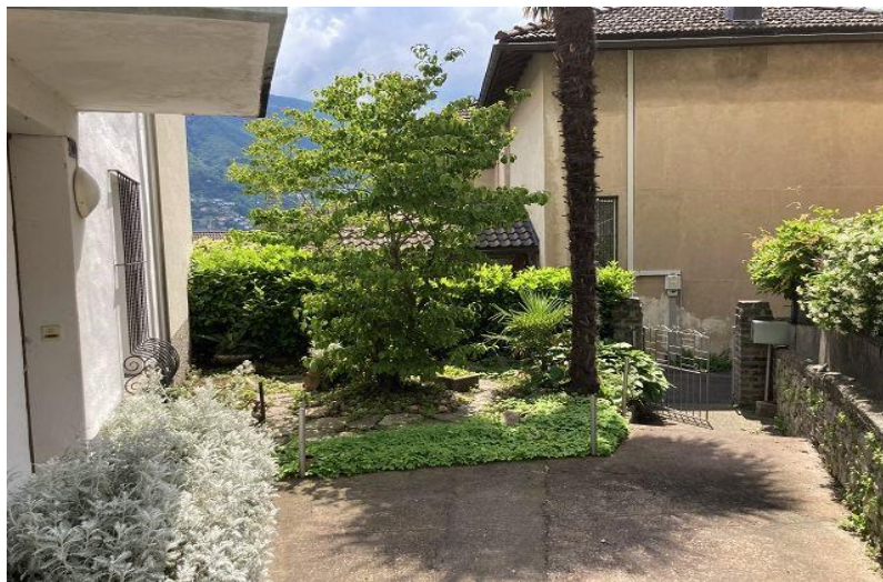
Garten / giardino