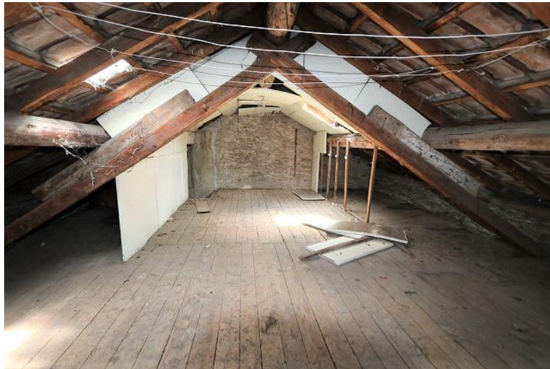
Dachgeschoss / mansardato