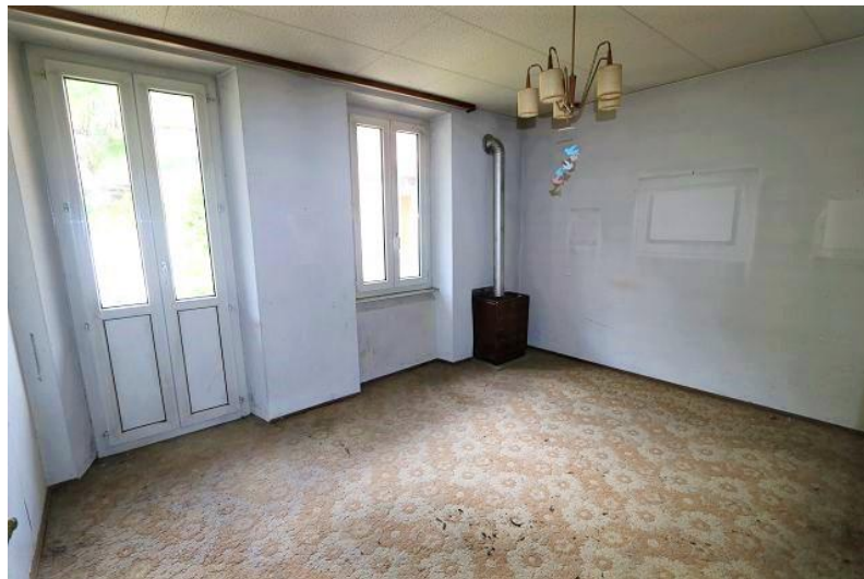
Zimmer 2. OG / camera P2