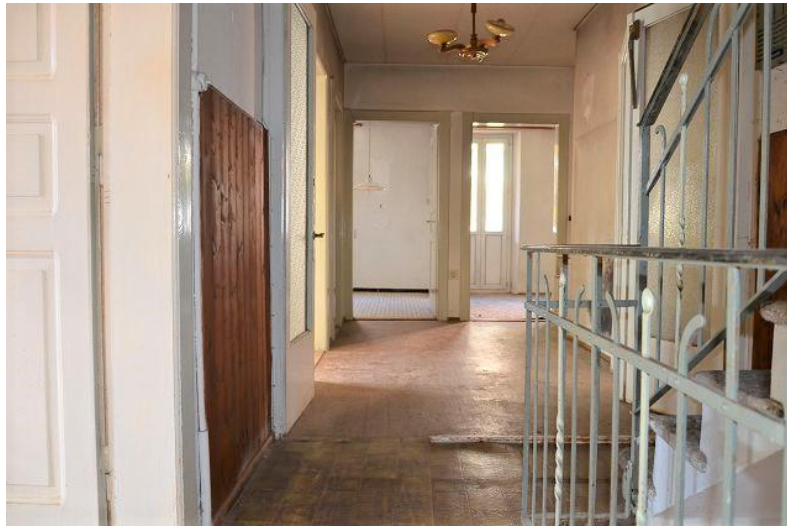
Gang / atrio