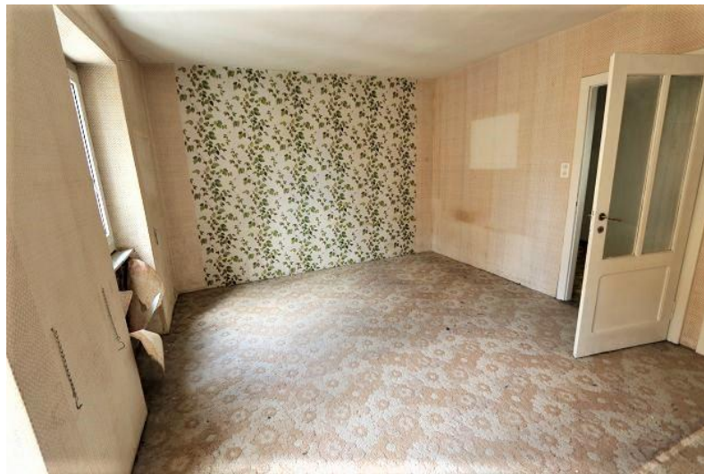
Zimmer 1. OG / camera P1