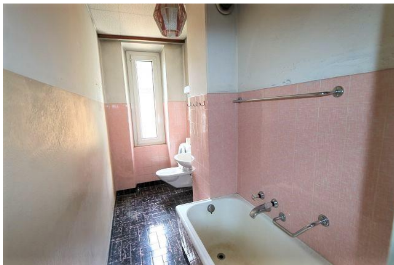
WC mit Badewanne 2. OG / WC con vasca da bagno 2. OG