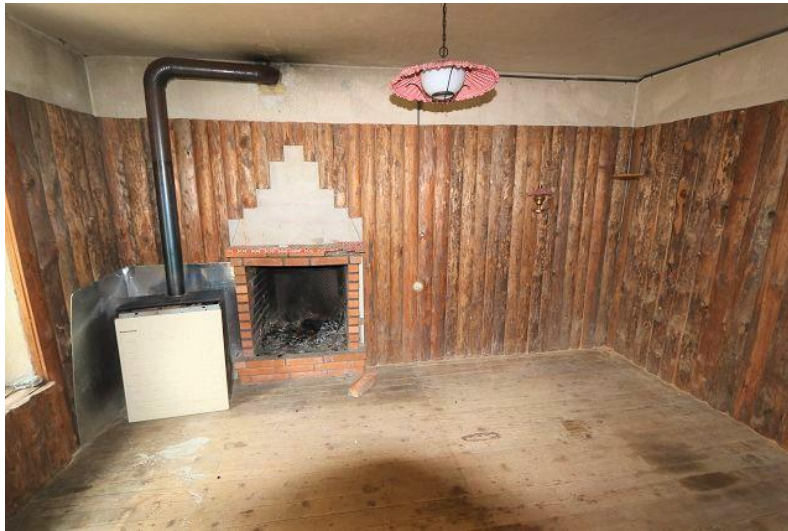
Wohnbereich EG / soggiorno PT