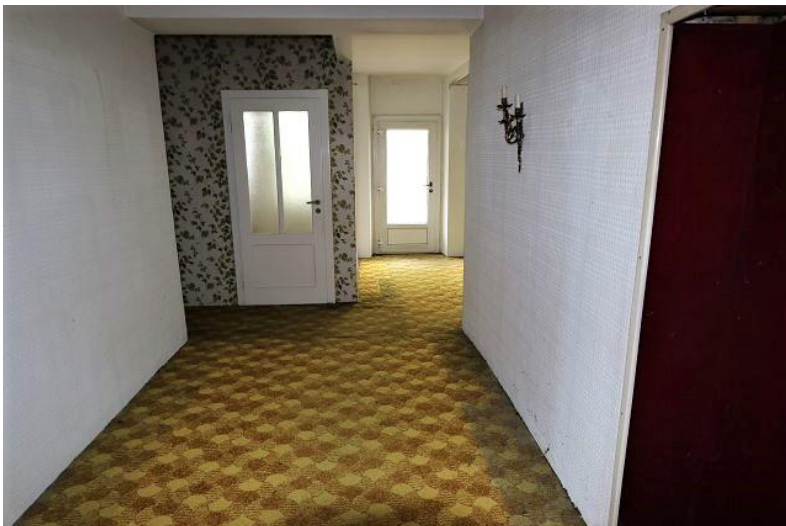
Gang / atrio