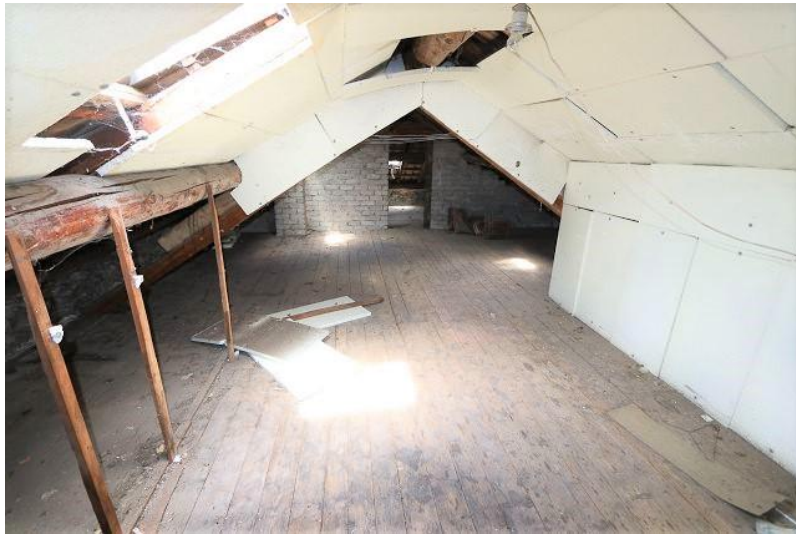
Dachgeschoss / mansardato