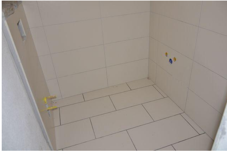
Bad / bagno