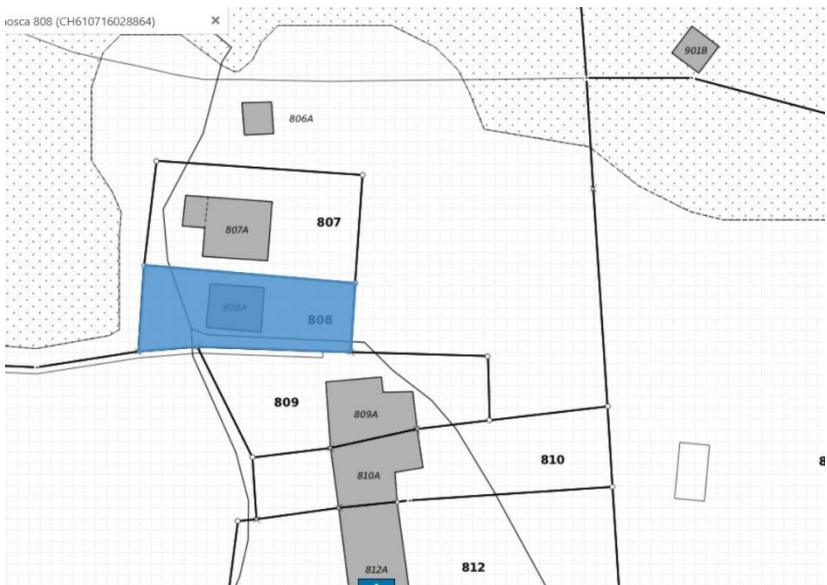
Grundstück / parcella