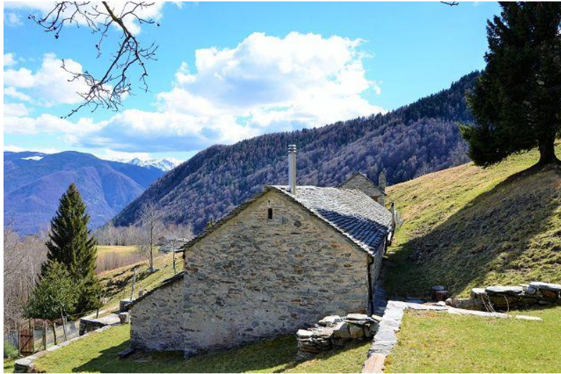
Umgebung / dintorni