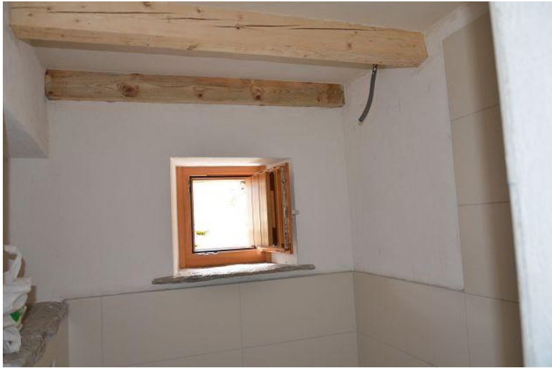
Vorzimmer / anticamera