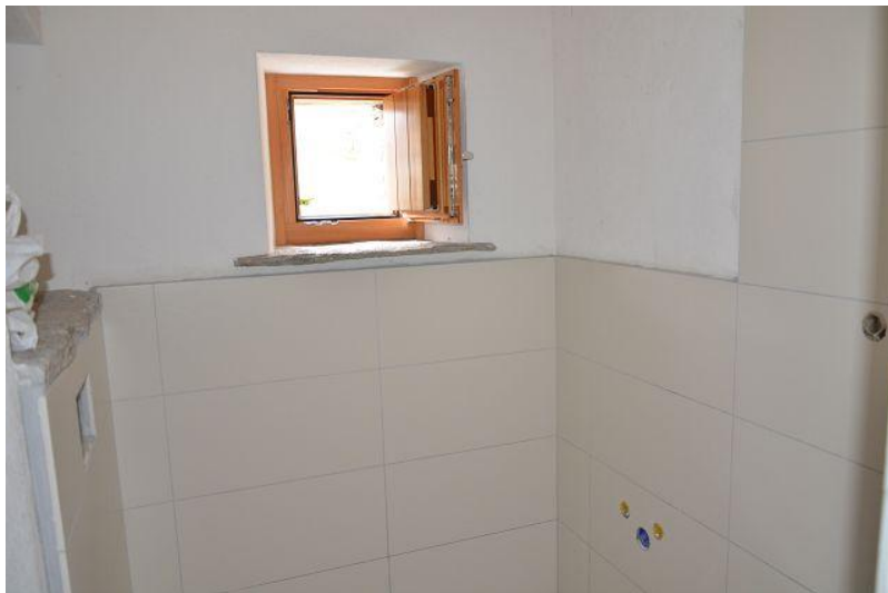
Bad / bagno