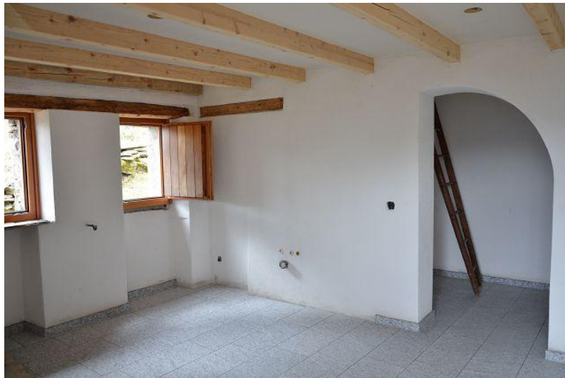
Wohnbereich / soggiorno