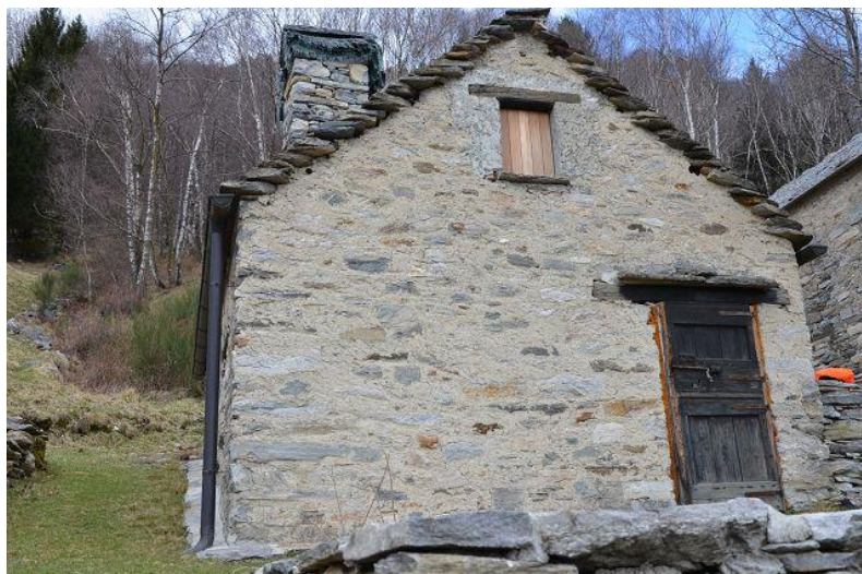
Rustico / rustico