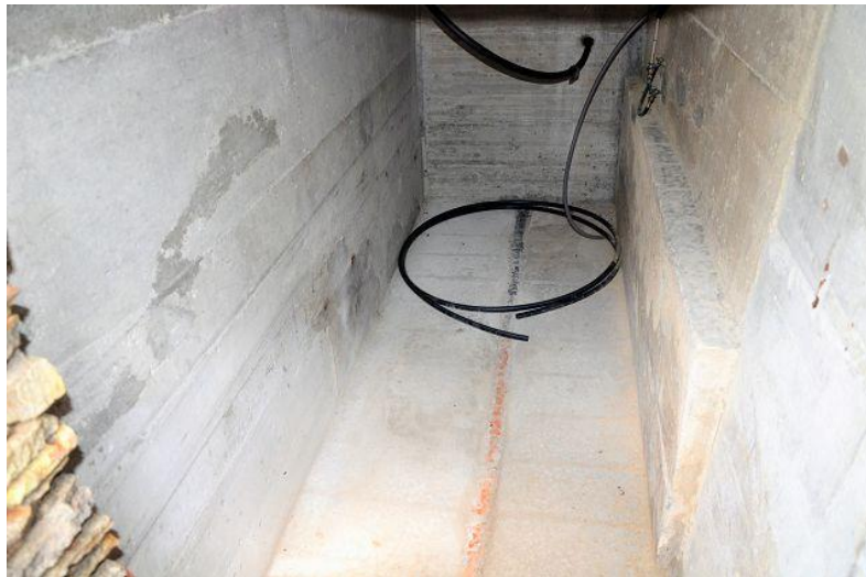
Keller / cantina