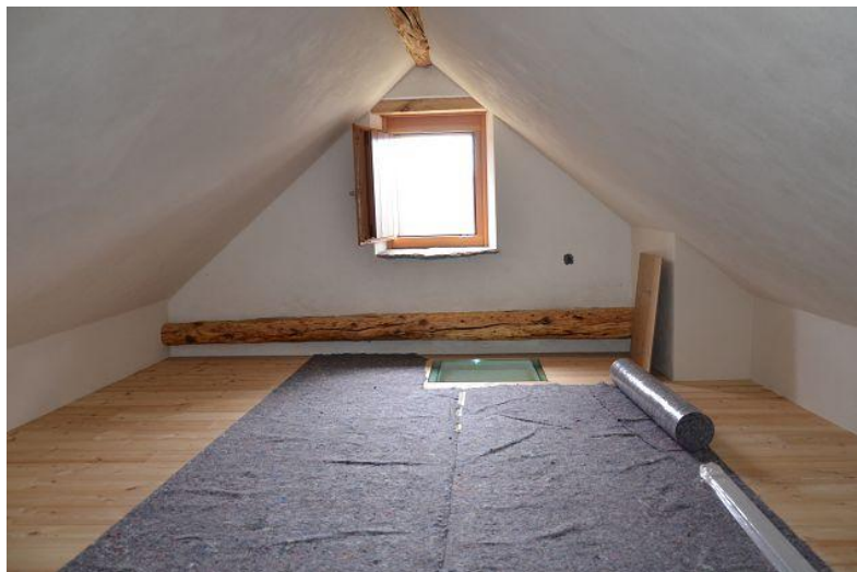
Dachgeschoss / mansarda