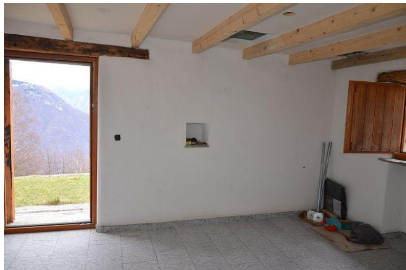
Wohnbereich / soggiorno