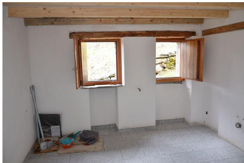
Wohnbereich – Küche / soggiorno – cucina