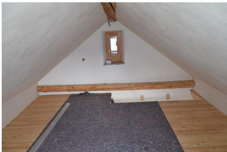
Dachgeschoss / mansarda