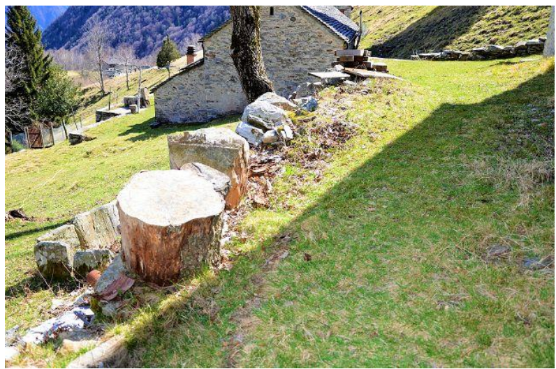
Garten / giardino