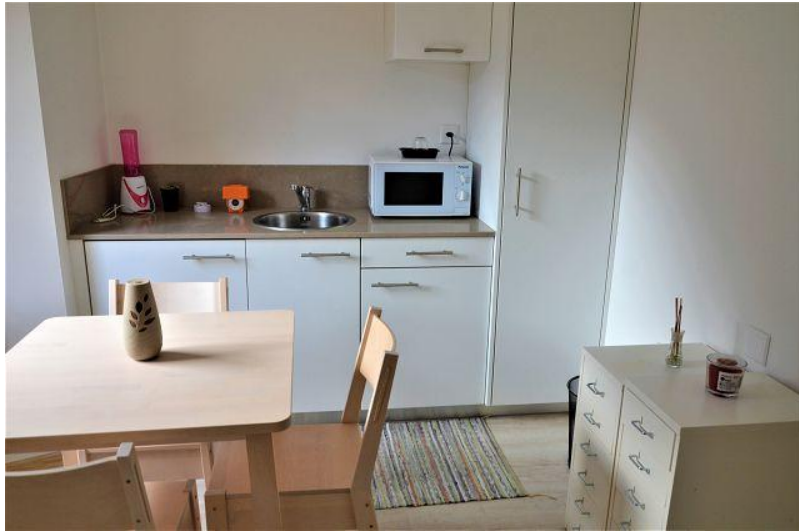
Essbereich – Küche / pranzo – cucina