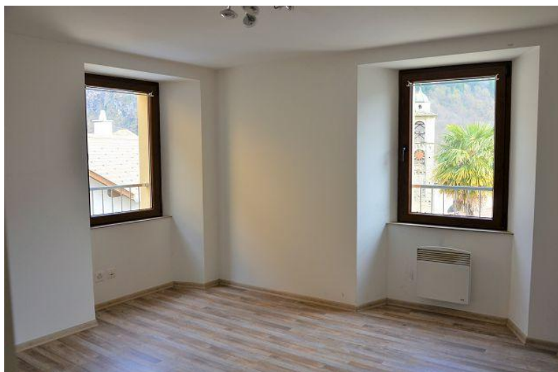
Zimmer 1. OG / camera PP