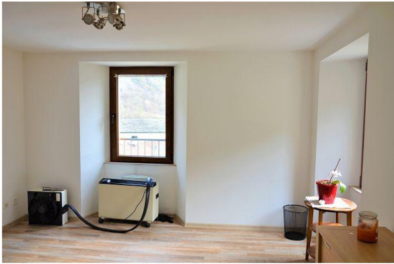
Wohnbereich / soggiorno