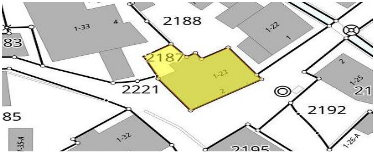
Grundstück / parcella