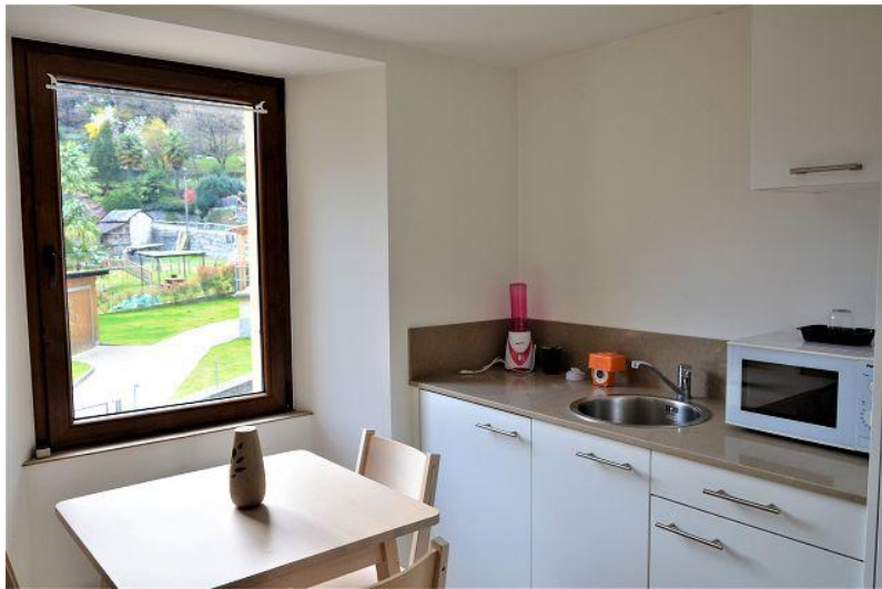
Essbereich – Küche / pranzo – cucina