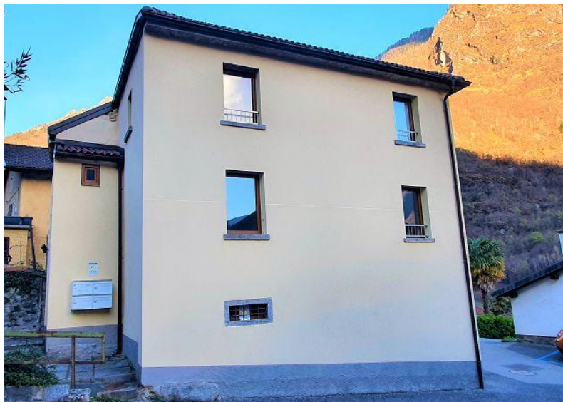
Haus / casa