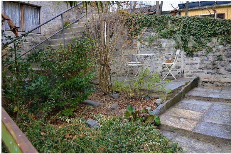
Garten - Terrasse / giardino – terrazza