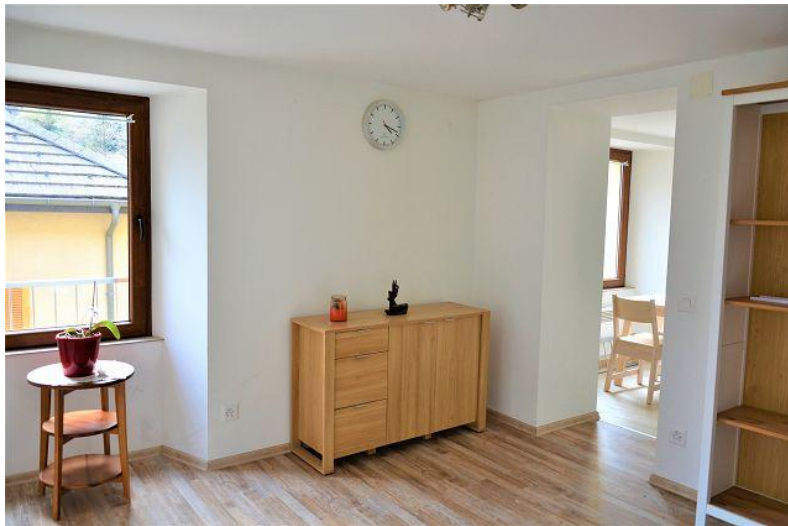
Wohnbereich / soggiorno