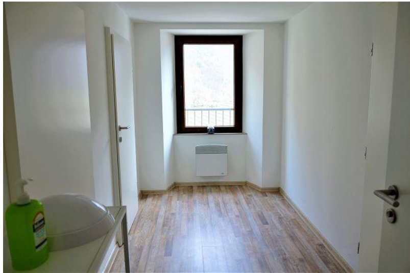
Gang 1. OG / corridoio PP