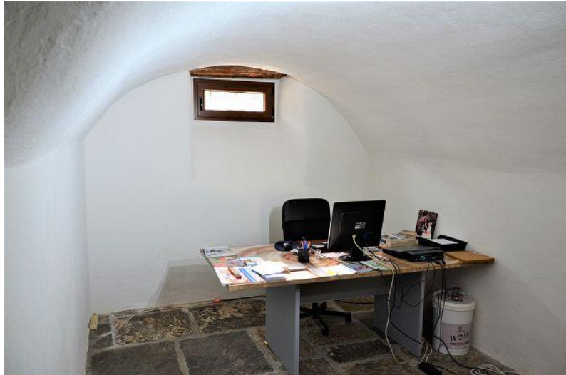
Zimmer EG / camera PT