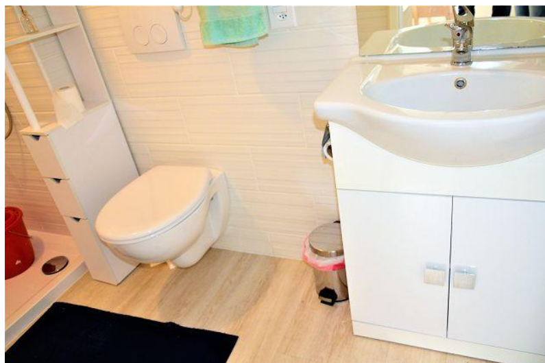
WC – Dusche 1. OG / WC – doccia PP