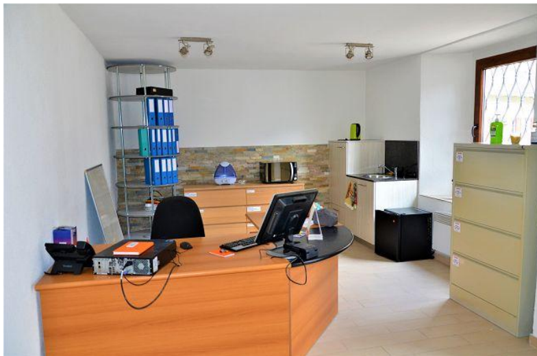
Zimmer EG / camera PT