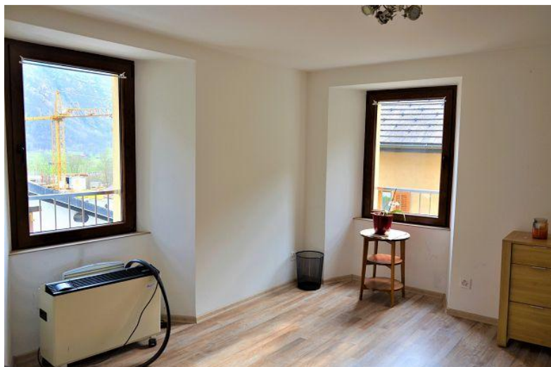
Wohnbereich / soggiorno