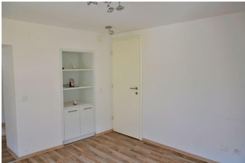
Zimmer 1. OG / camera PP