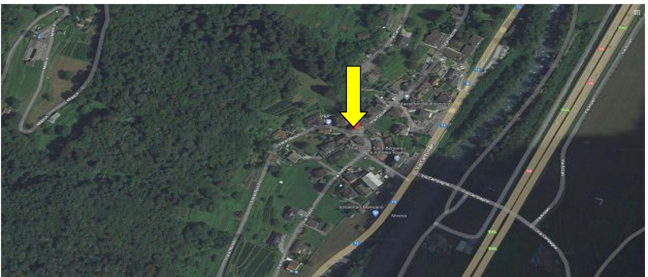
Lage / posizione