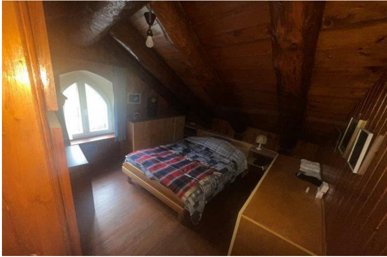
Zimmer 2. OG / camera P2