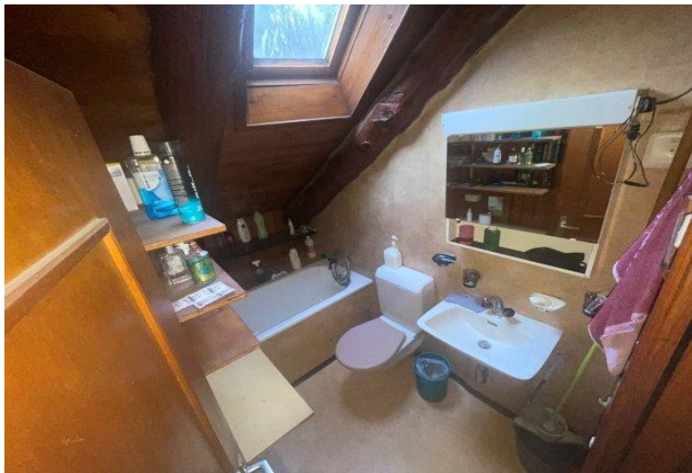
WC mit Badewanne 2. OG / WC con vasca da bagno P2