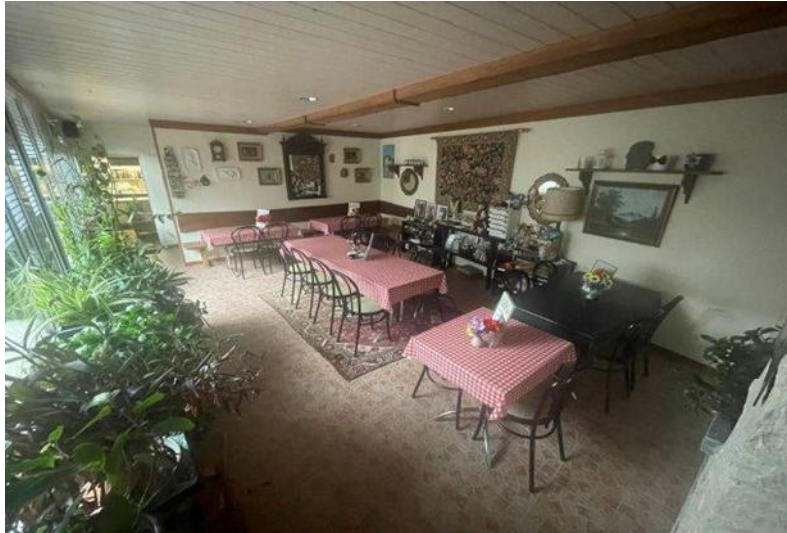
Essaal im EG / sala pranzo PT