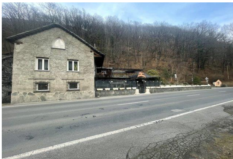
Gebäude / edificio