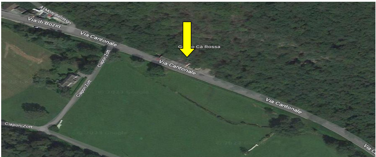
Lage / posizione