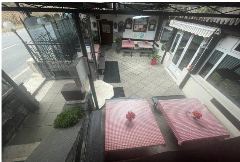
Terrasse / terrazza