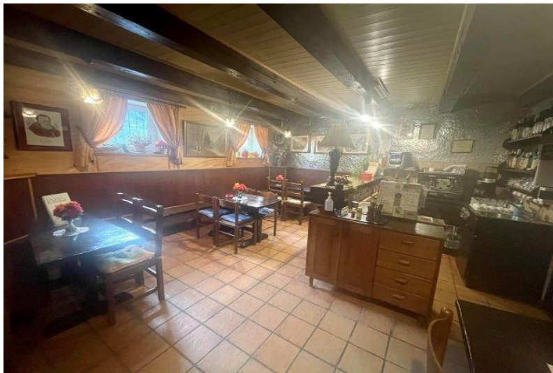
Bar EG / bar PT