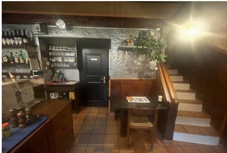
Bar EG / bar PT