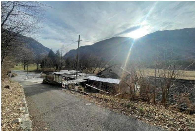
Gebäude und Aussicht / edificio con vista