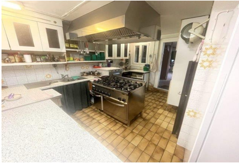
Küche EG / cucina PT