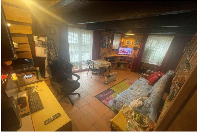
Wohnzimmer 1.OG / soggiorno PP