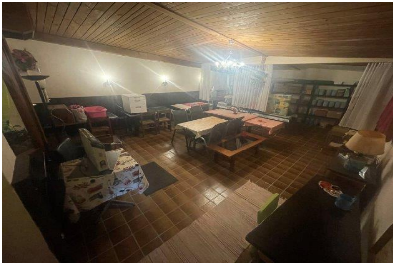
Zimmer EG / camera PT