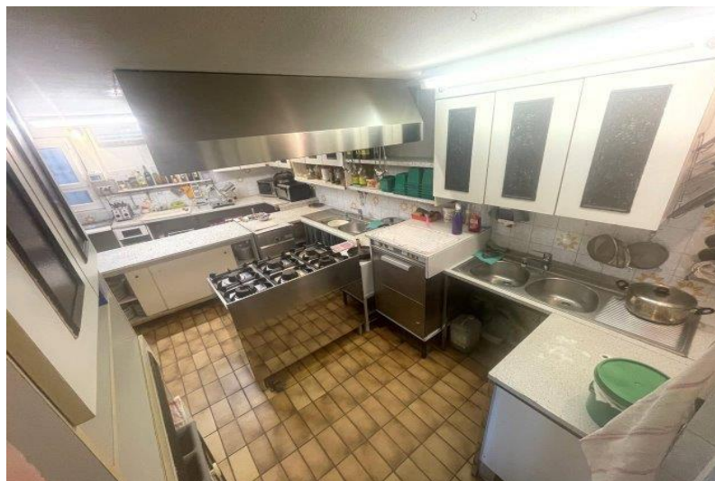
Küche EG / cucina PT