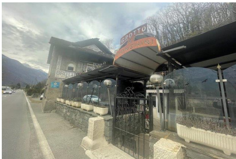
Gebäude / edificio