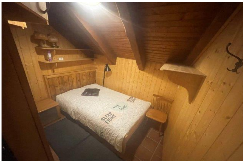
Zimmer 2. OG / camera P2