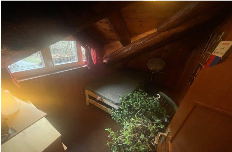
Zimmer 2. OG / camera P2