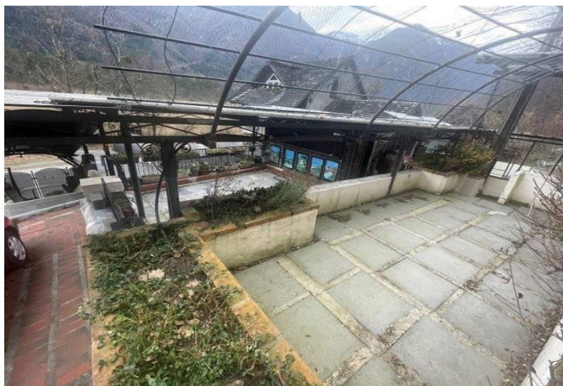
Terrasse / terrazza