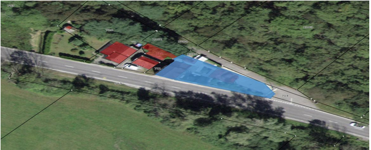
Grundstück / parcella