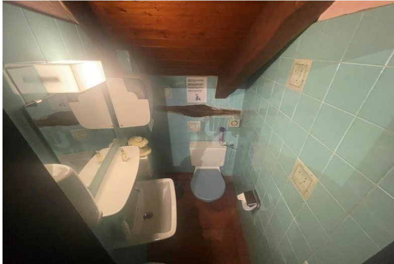
WC 1. OG / WC PP