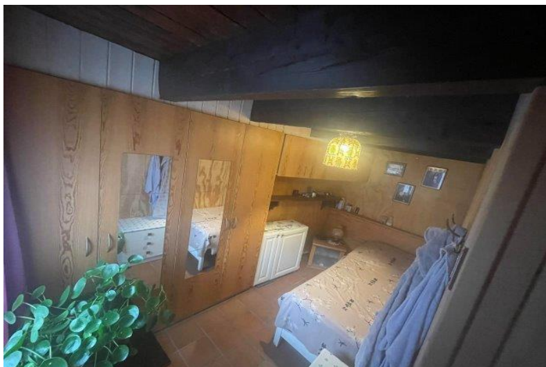
Zimmer 1. OG / camera PP