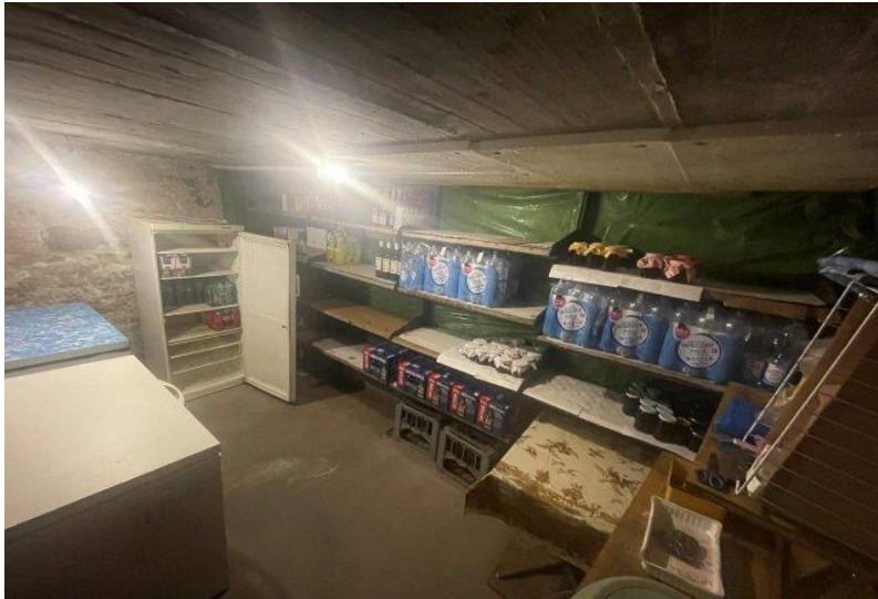
Keller / cantina