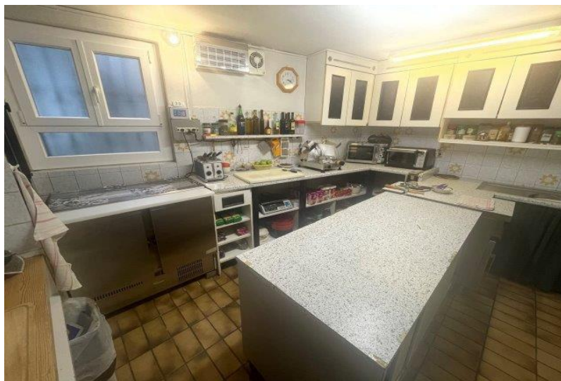
Küche EG / cucina PT