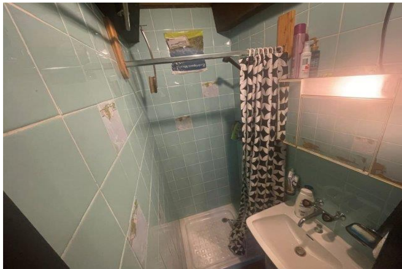
WC mit Dusche 1. OG / WC con doccia PP