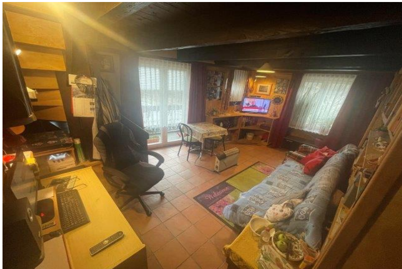
Wohnzimmer 1.OG / soggiorno PP