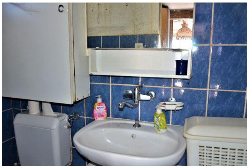
Bad / bagno