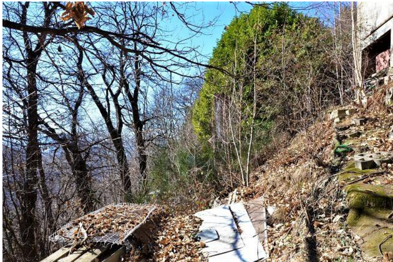
Grundstück / terreno