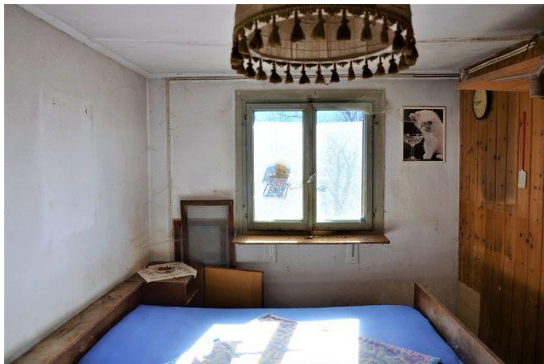
Zimmer 2. OG / camera P2