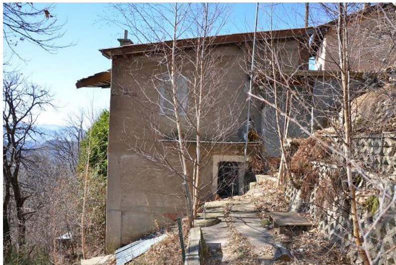
Haus / casa