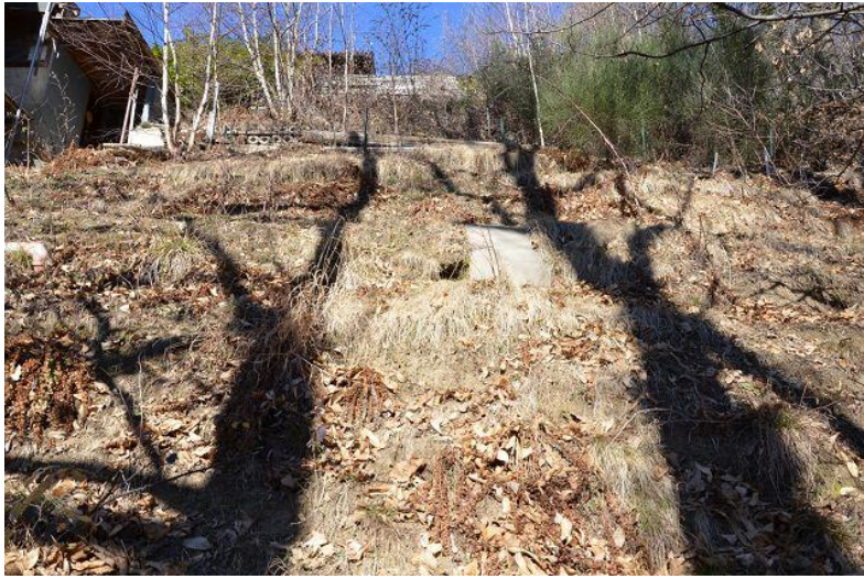
Grundstück / terreno