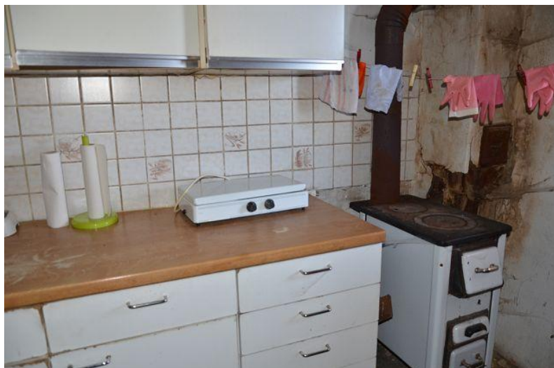
Küche / cucina