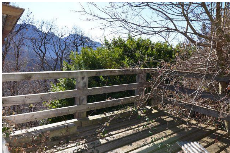
Terrasse / terrazza