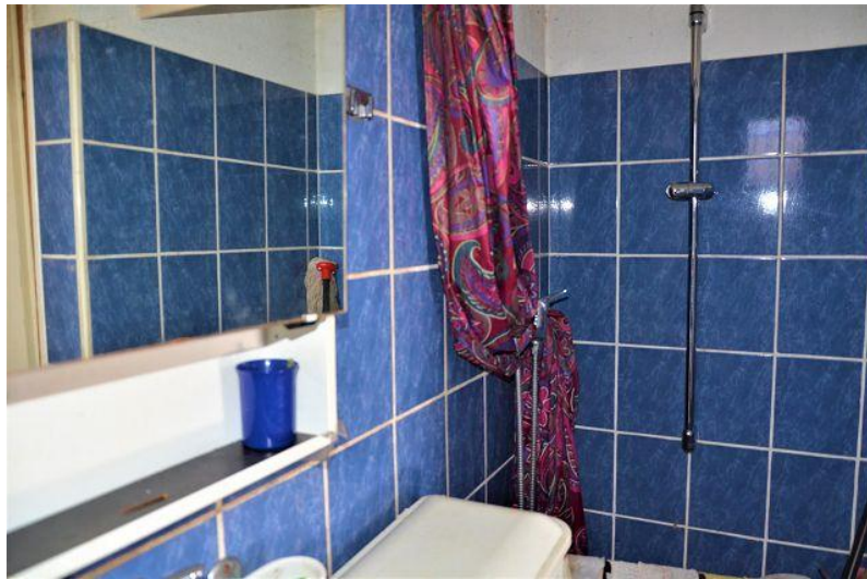
WC mit Dusche / WC con doccia