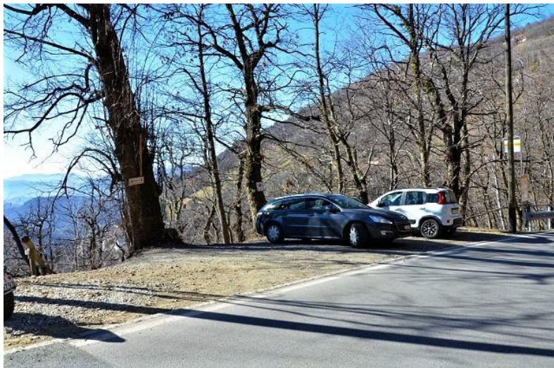
Parkplatz / parcheggio