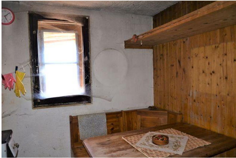
Essbereich / pranzo