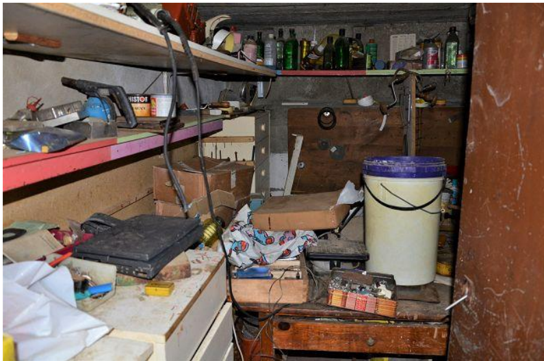
Keller / cantina