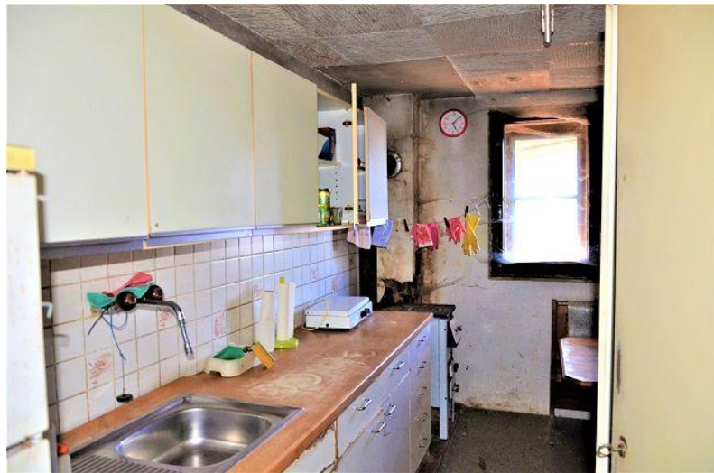
Küche – Essbereich / cucina – pranzo