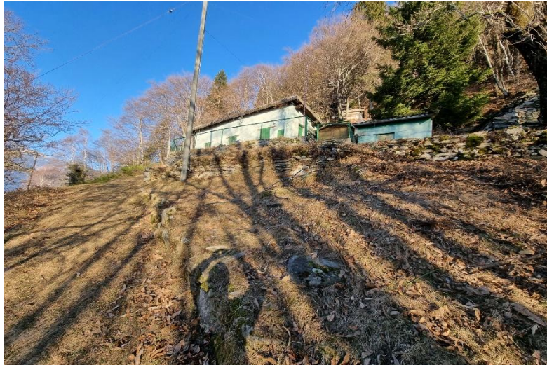
Rustico / Rustico