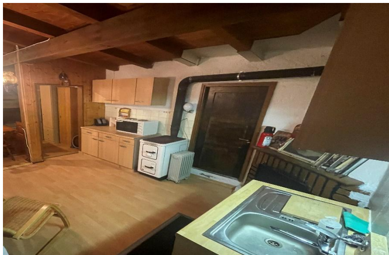
Küche / cucina