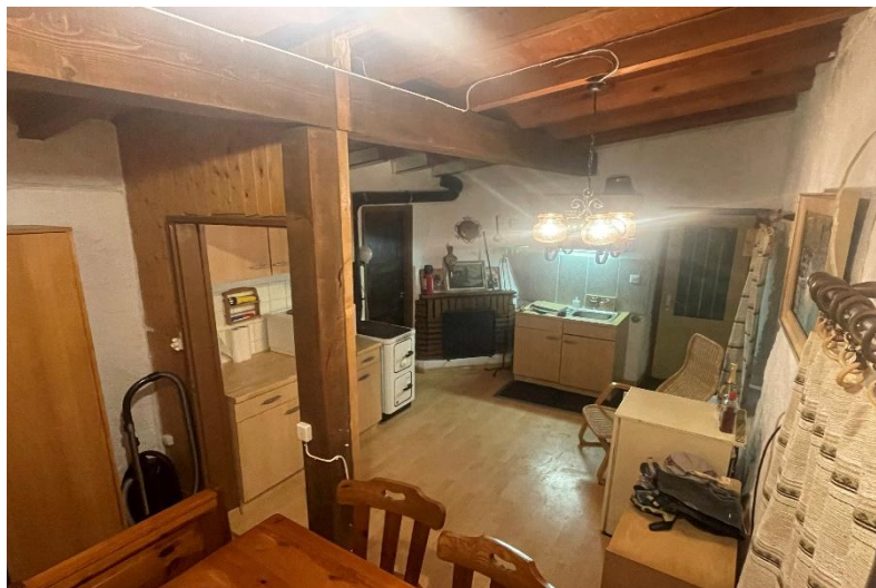
Erdgeschoss / piano terra