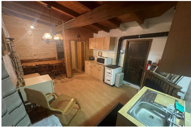
Wohnraum / il soggiorno