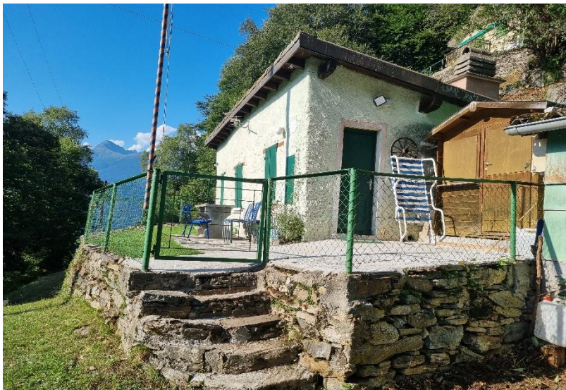
Rustico mit Terrasse / Rustico con terrazza