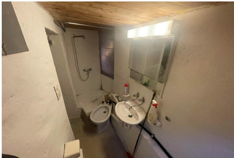
Toilette mit Dusche/ WC con doccia