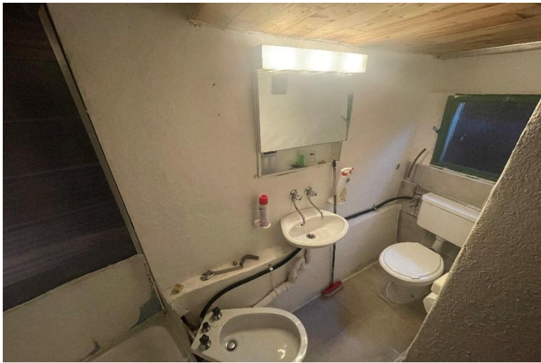
Toilette mit Dusche / WC con doccia