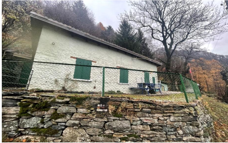
Terrasse / terrazza