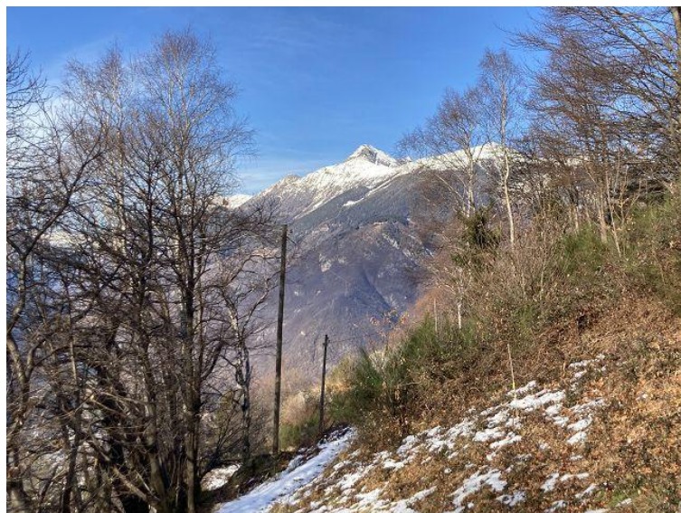
Blick nach Norden / Vista verso nord