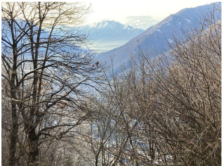
Blick zum Lago Maggiore / vista verso Lago Maggiore