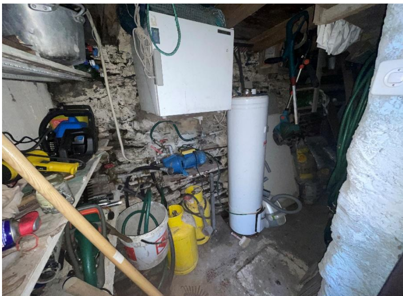
Keller / cantina