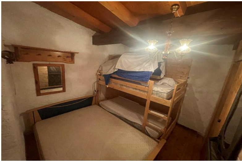
Schlafzimmer / La camera da letto