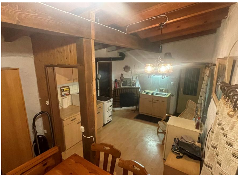
Blick auf das Wohnzimmer und die Küche / vista verso il soggiorno e cucina