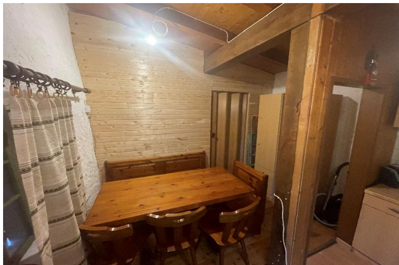
Essbereich / pranzo