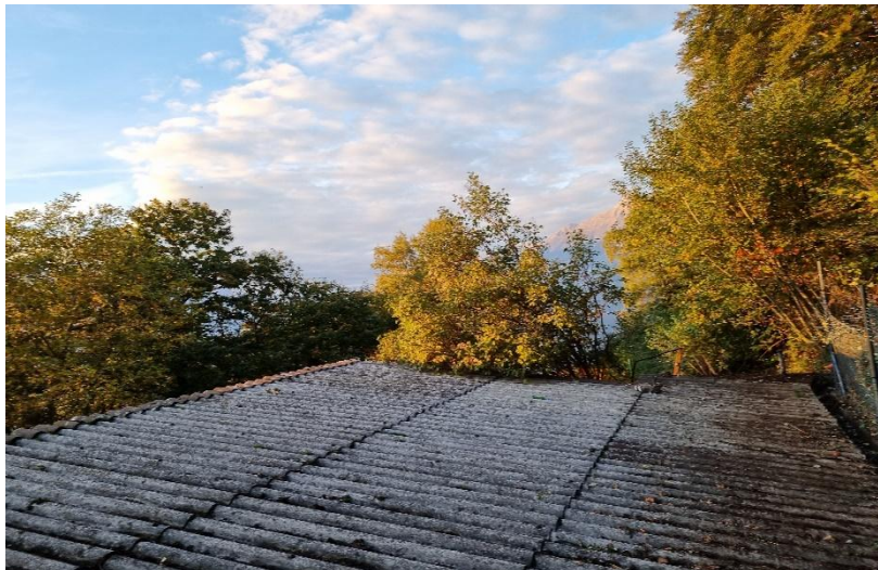
Blick vom Dach / La vista dal tetto