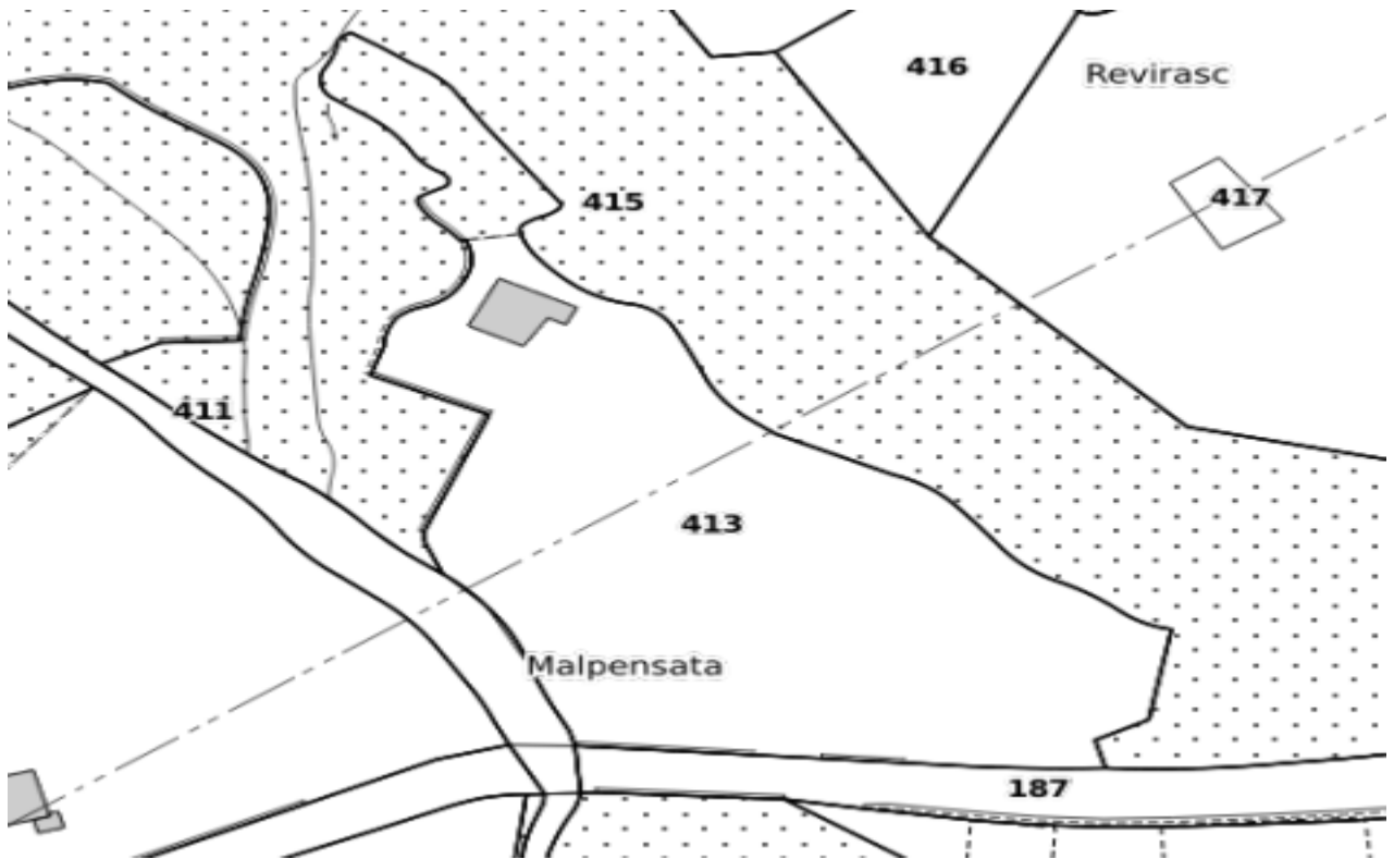
Grundstück / parcella