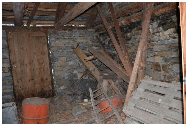
Innenbereich / interni