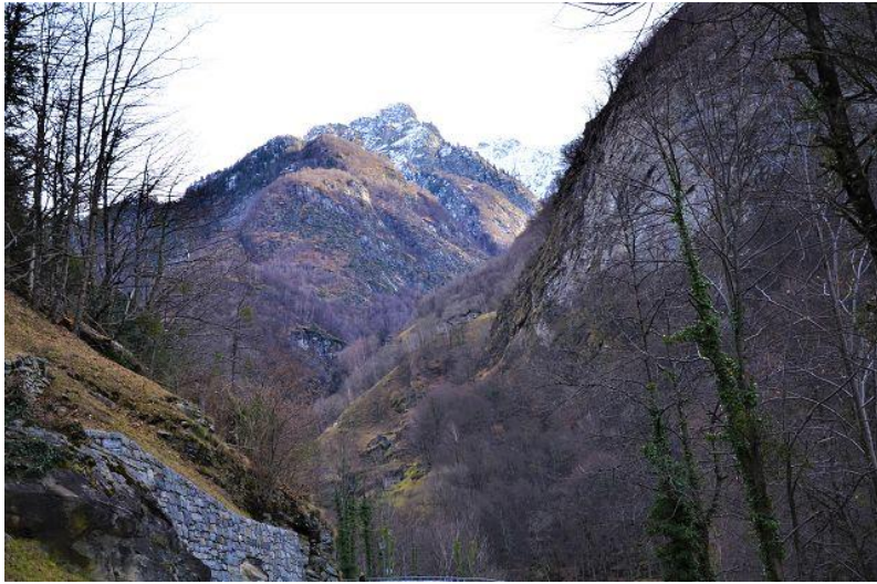
Aussicht / vista