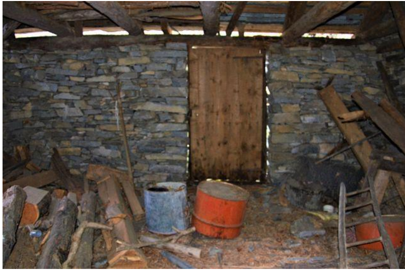
Innenbereich / interni