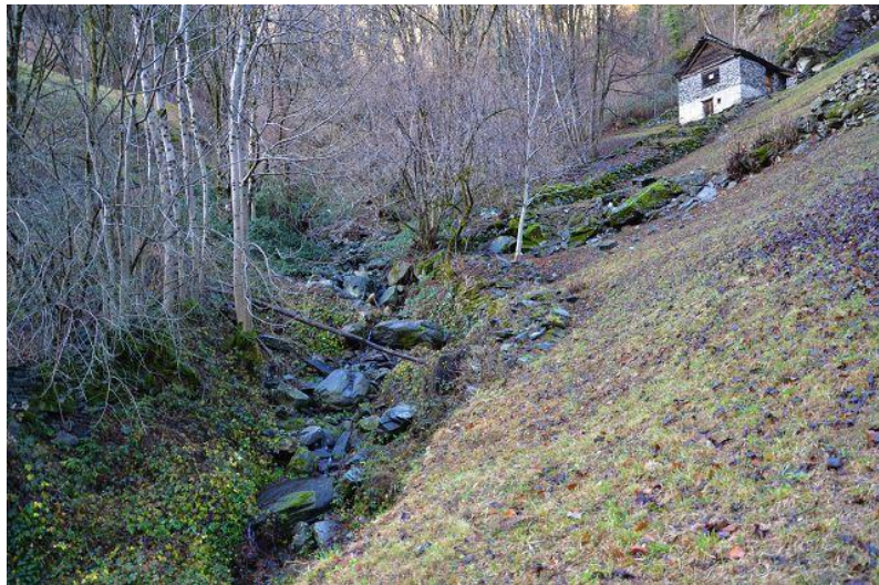
Grundstück und Rustico / terreno e rustico