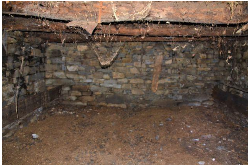
Innenbereich / interni