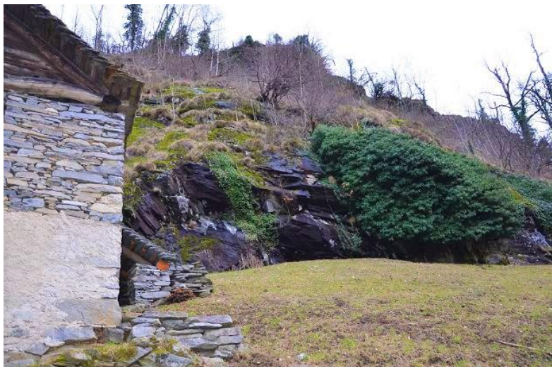
Grundstück und Rustico / terreno e rustico