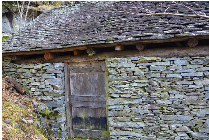
Rustico / rustico