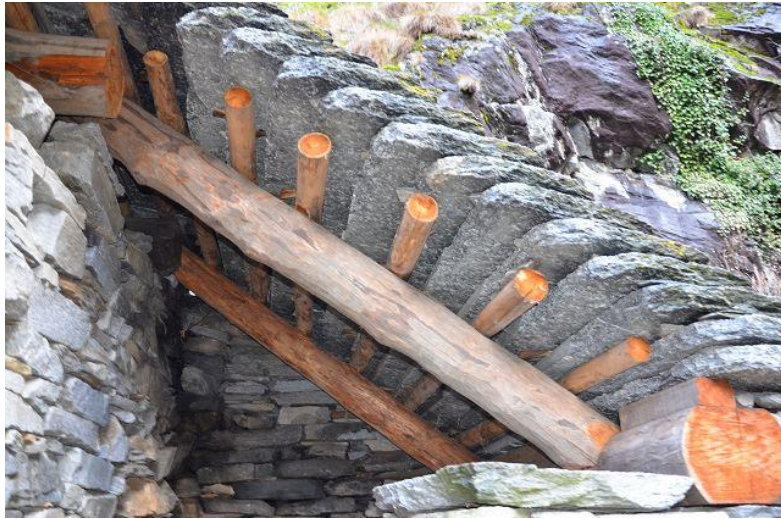
Dach / tetto