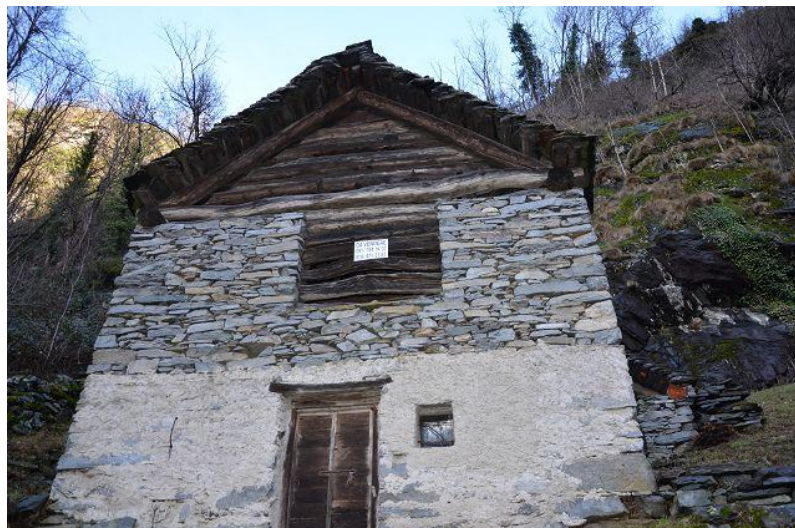
Rustico / rustico