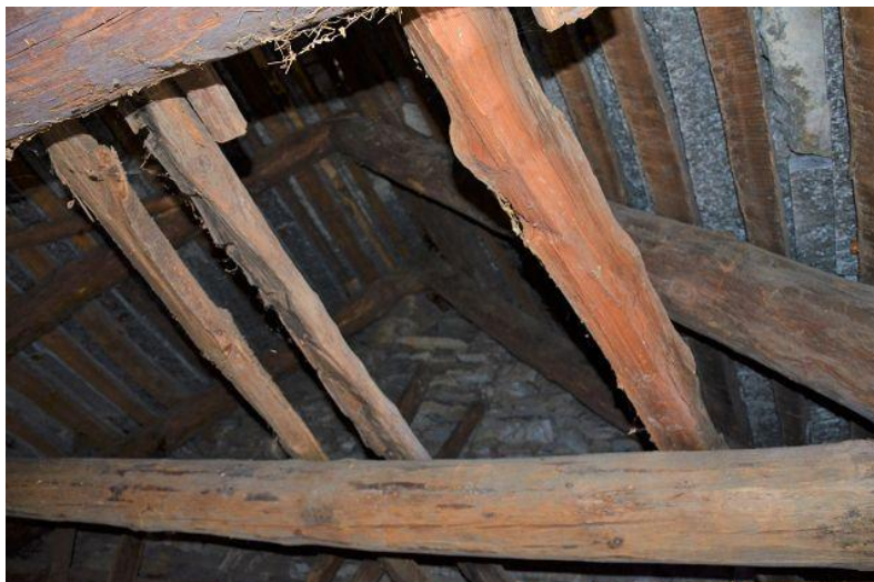
Dachgeschoss / solaio