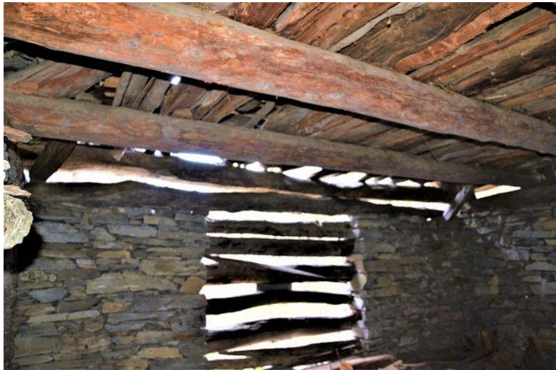
Dachgeschoss / solaio