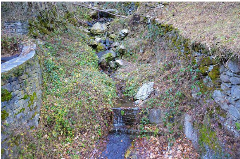
Bach nebenan / ruscello vicino