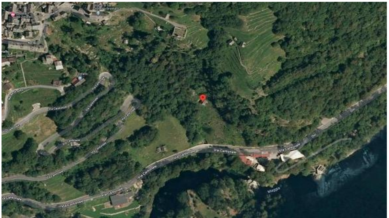
Lage / posizione