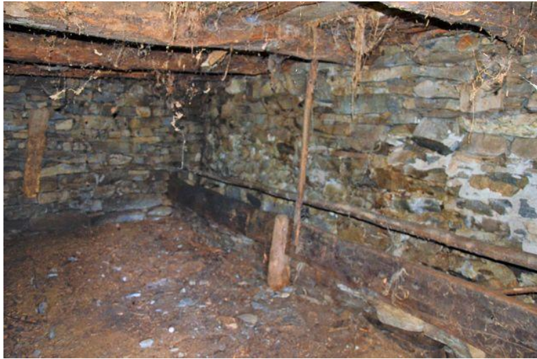
Innenbereich / interni