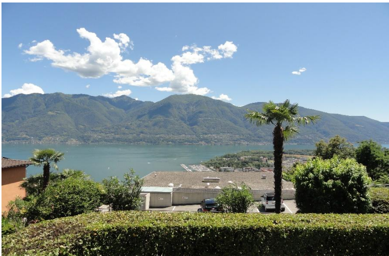
Aussicht / vista