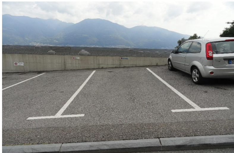
Parkplatz / parcheggio