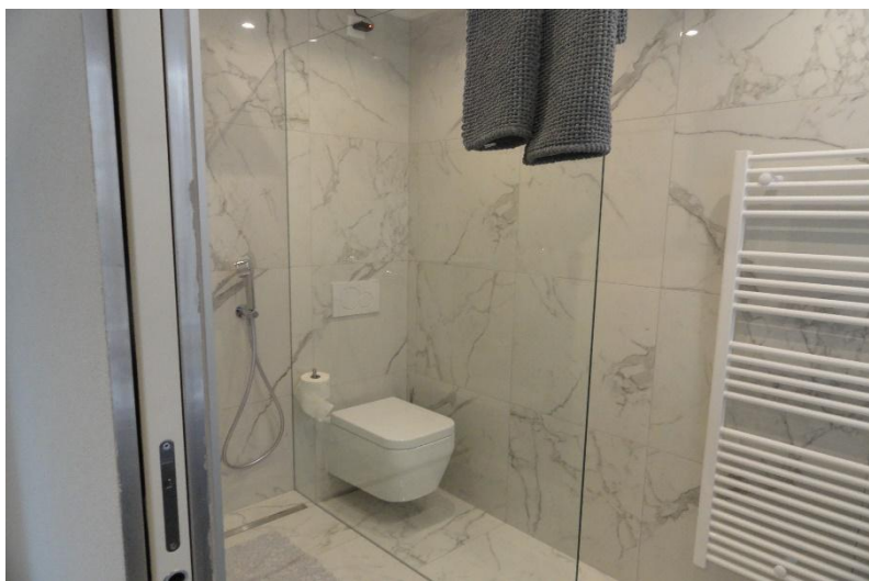
Bad- Dusche Schlafzimmer / bagno- doccia camera