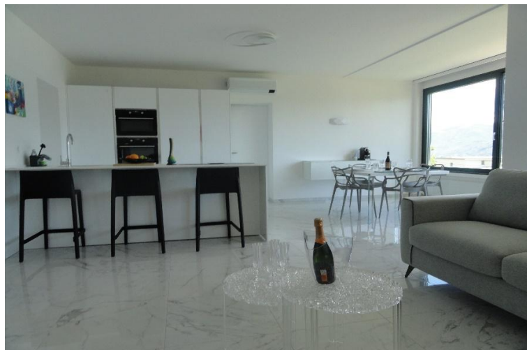
Wohn-, Essraum und Küche / soggiorno- pranzo e cucina