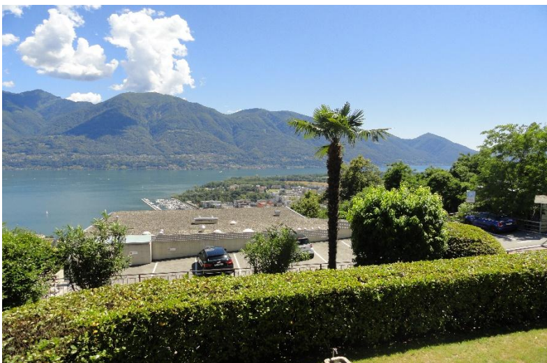
Aussicht / vista