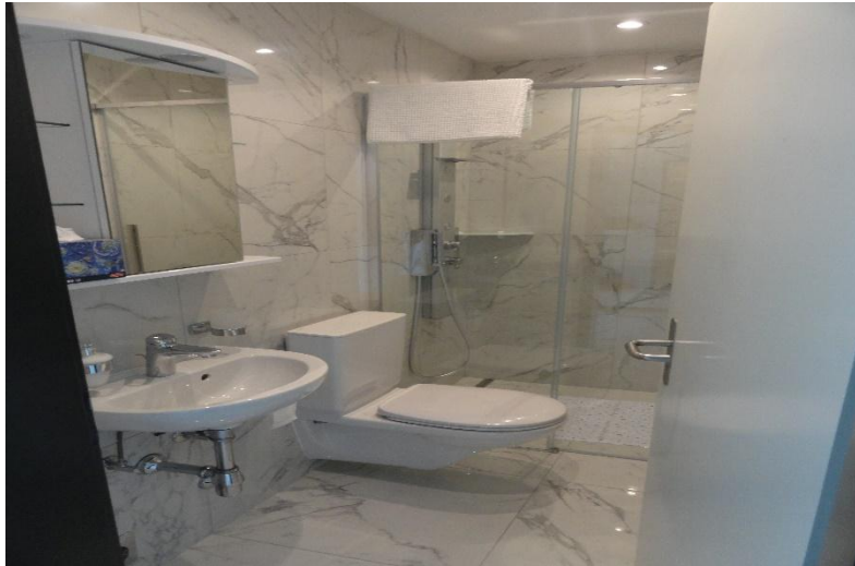
WC- Dusche / WC doccia