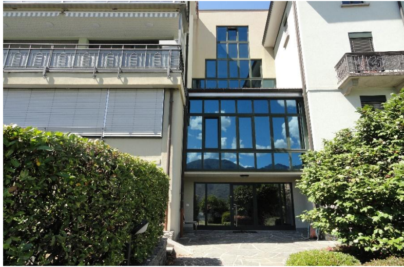
Eingang / entrata