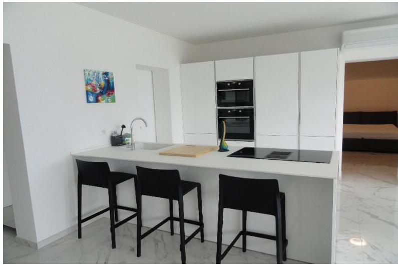
Küche / cucina