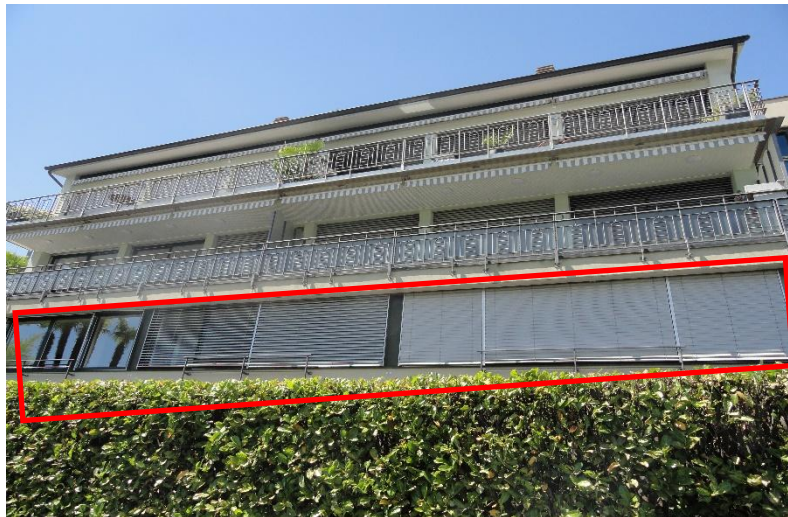
Wohnung / appartamento