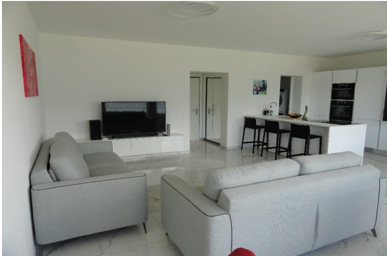
Wohn-, Essraum / soggiorno- pranzo