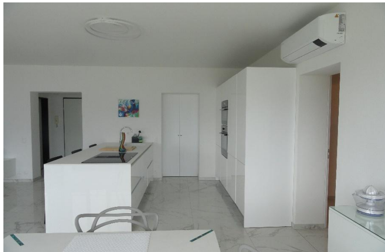
Küche / cucina