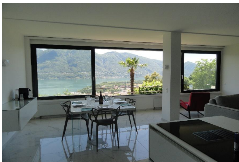
Essbereich / pranzo