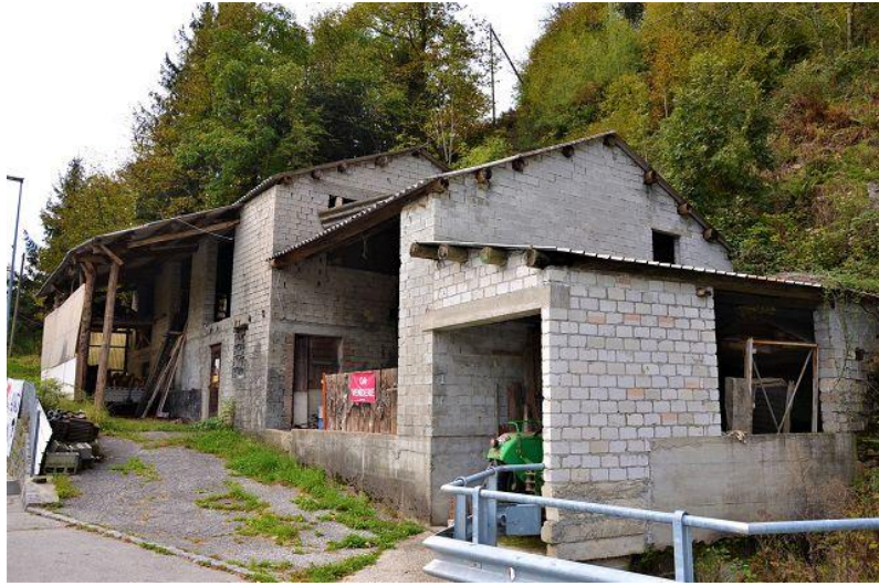
Stall / stalla