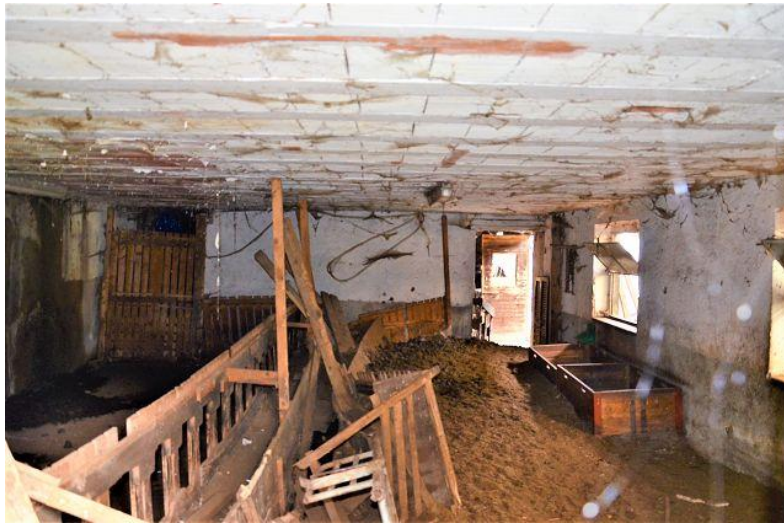
Innenraum Stall / interni stalla