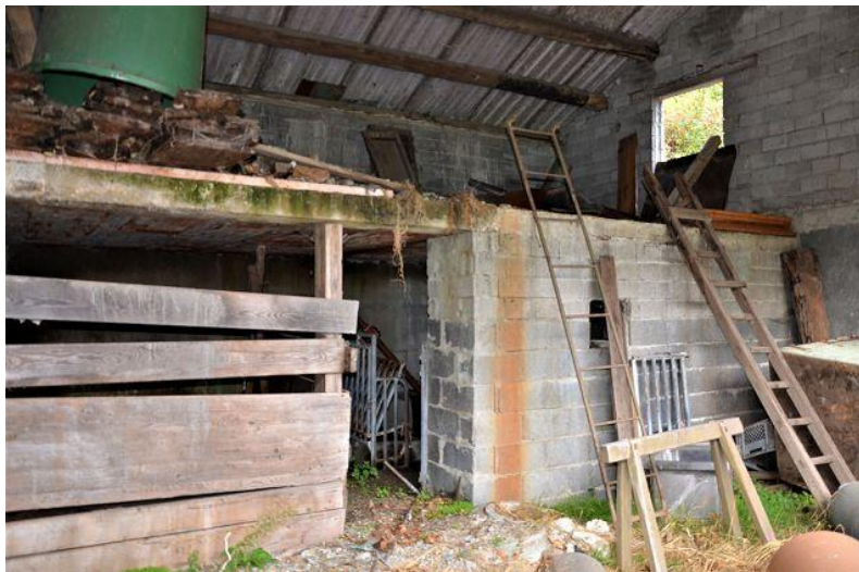
Innenraum Stall / interni stalla