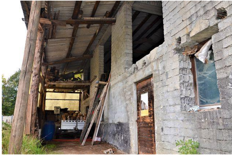
Stall / stalla