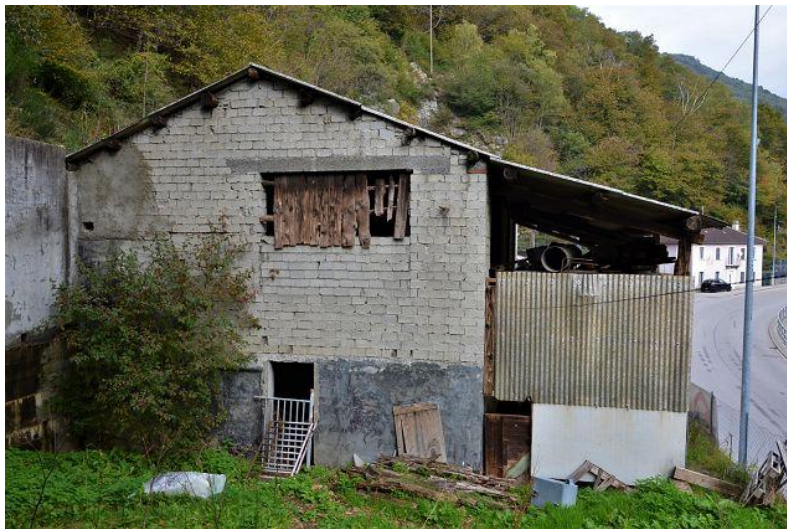
Stall / stalla