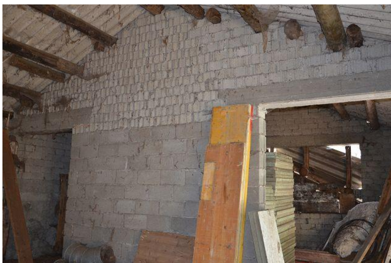
Innenraum Stall / interni stalla