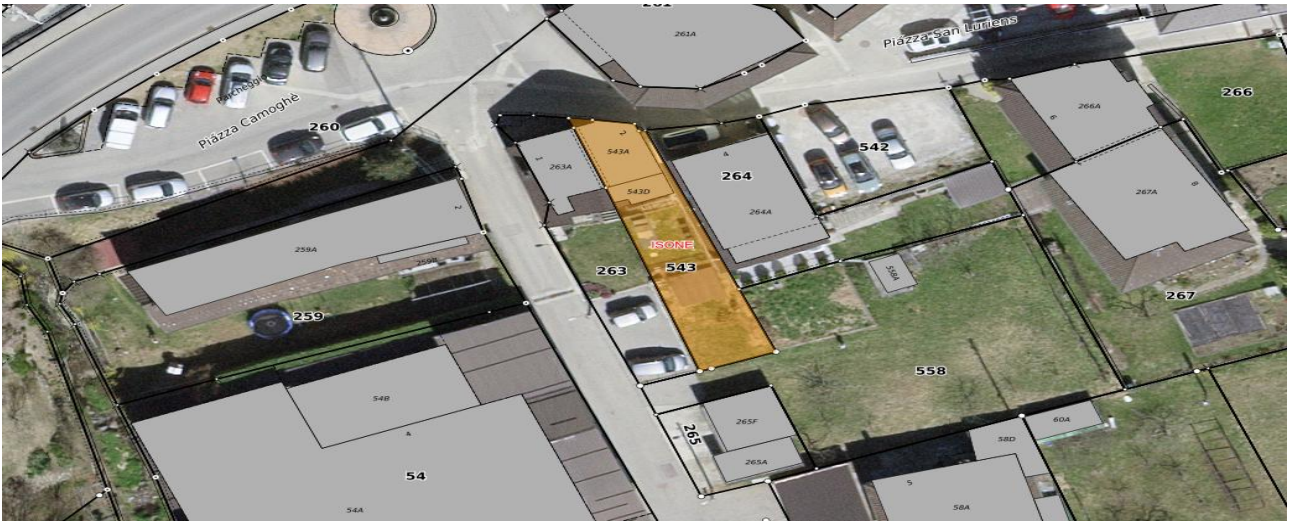
Grundstück / parcella