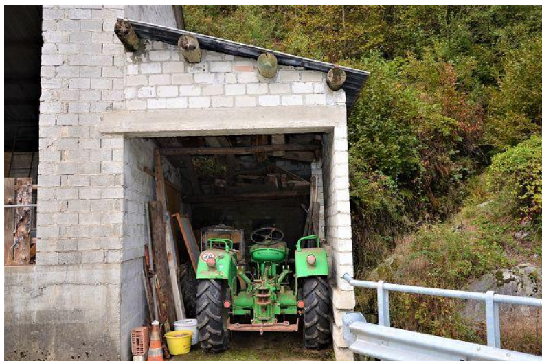
Stall / stalla