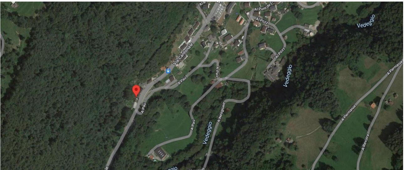
Lage / posizione