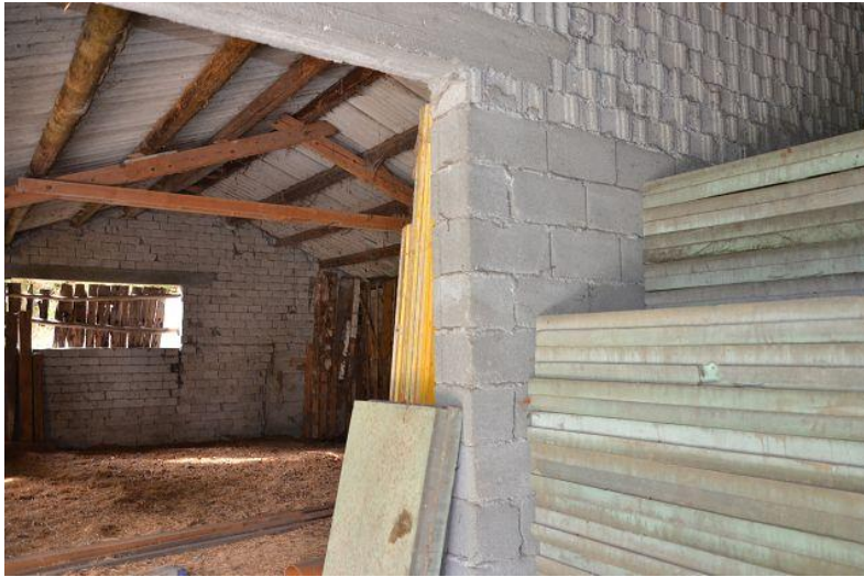
Innenraum Stall / interni stalla