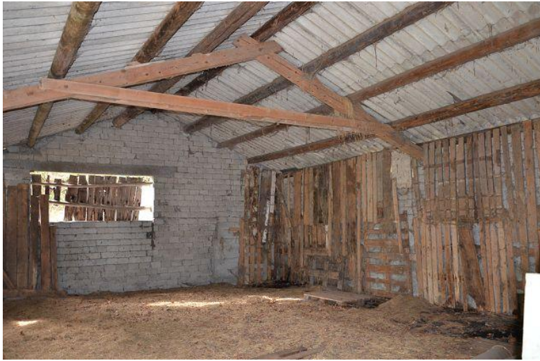
Innenraum Stall / interni stalla