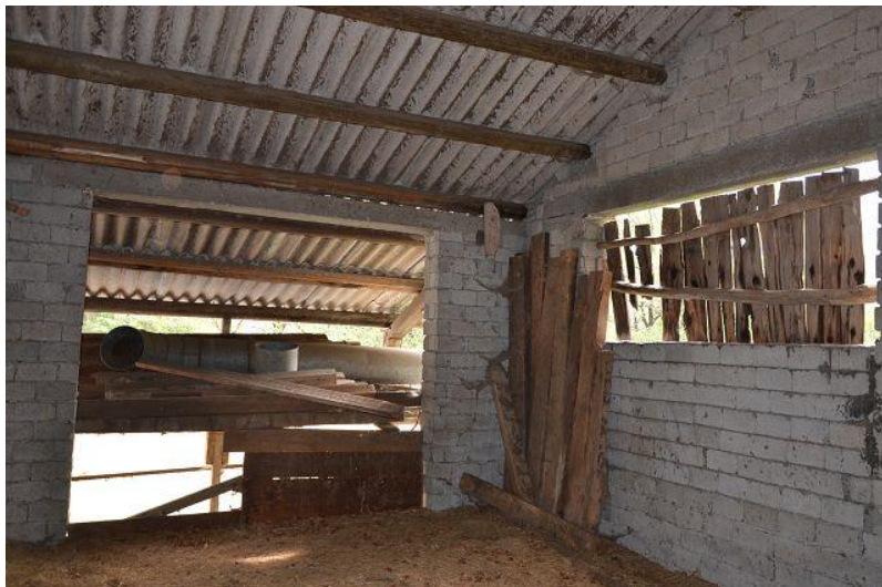
Innenraum Stall / interni stalla