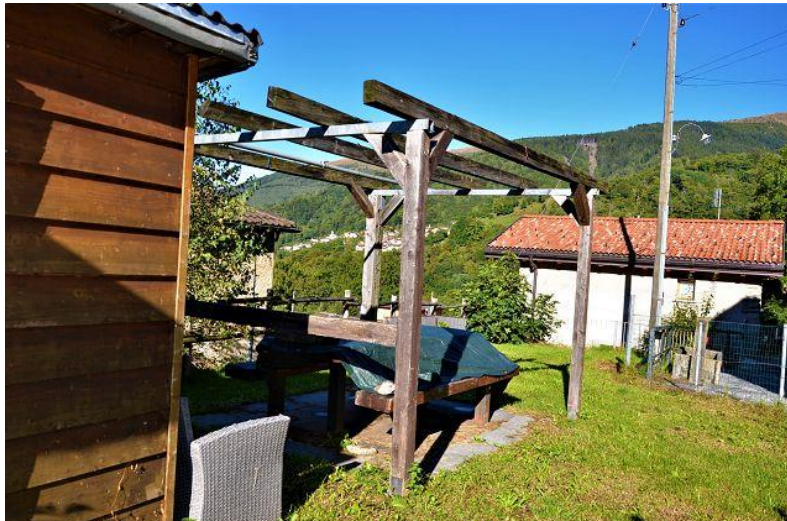
Garten und Pergola / giardino e pergola