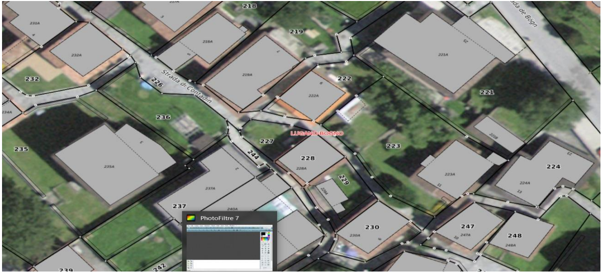
Parzellen 228 und 236