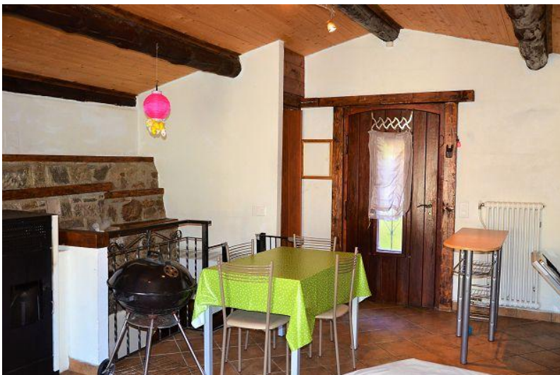
Essraum / sala pranzo