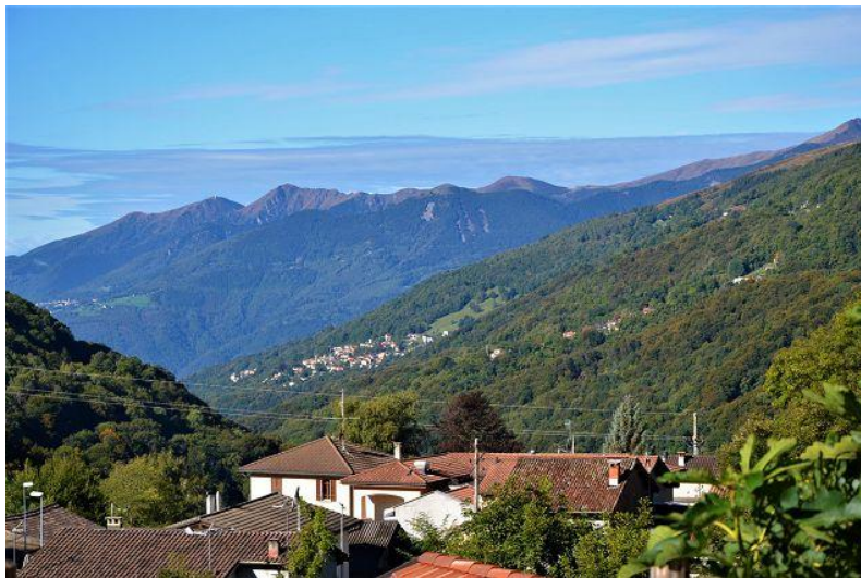
Aussicht / vista