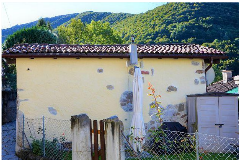
Haus / casa