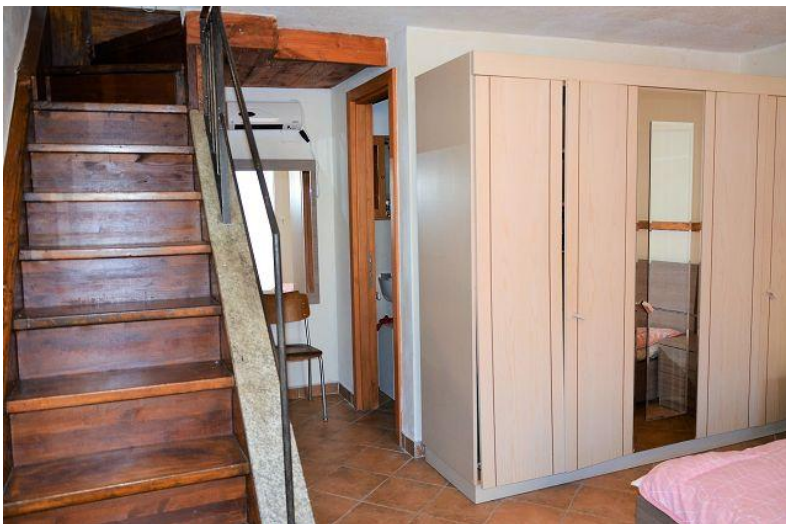
Zimmer / camera