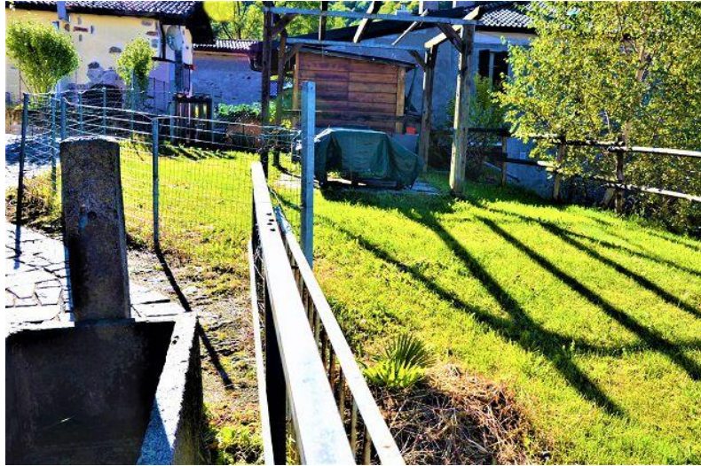
Garten / giardino