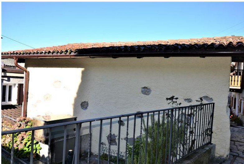
Haus / casa