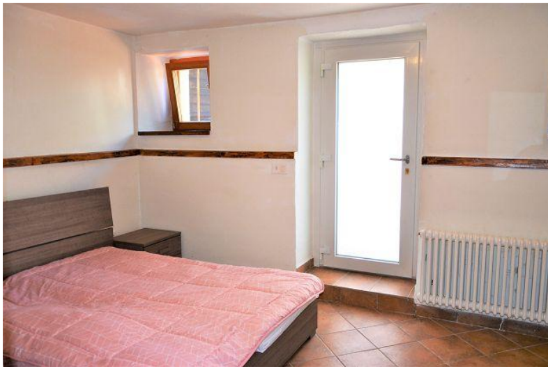
Zimmer / camera