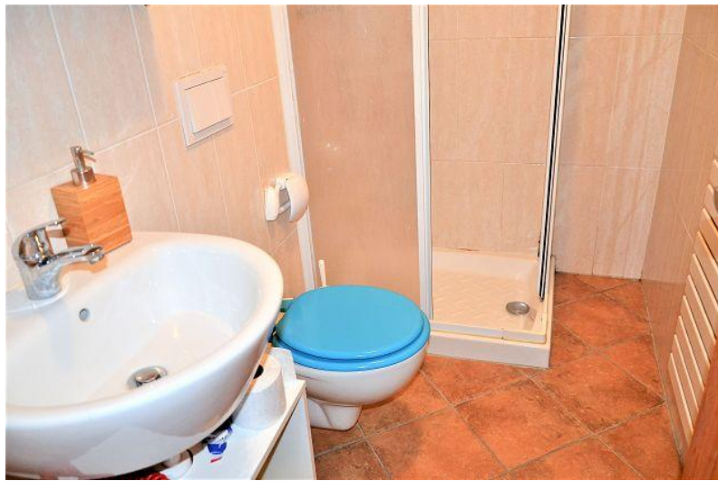
WC- Dusche / WC- doccia