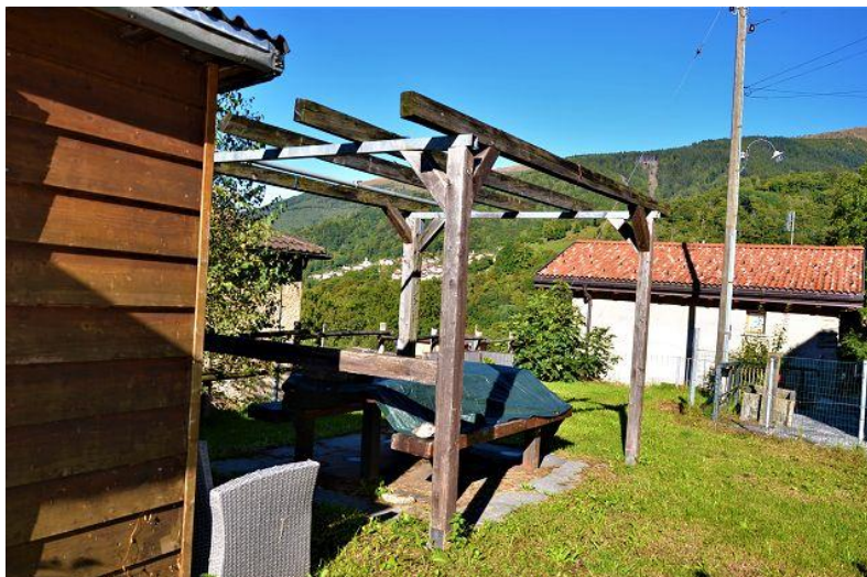
Garten und Pergola / giardino e pergola