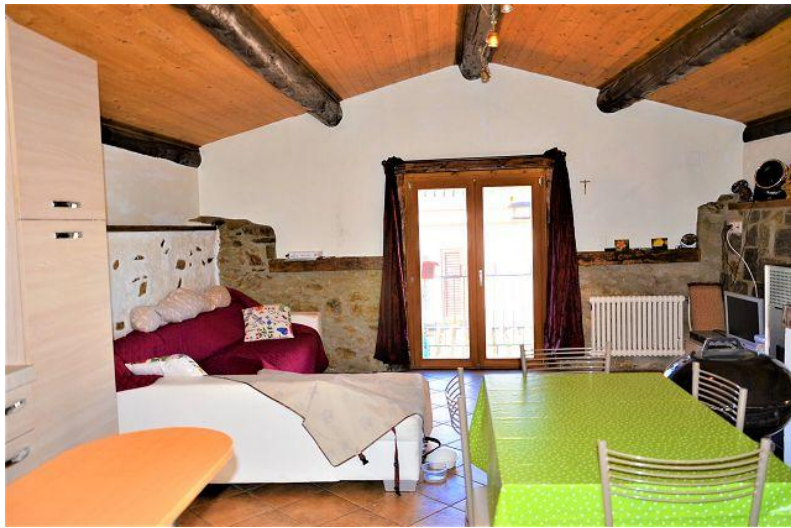
Wohn-, Essraum / soggiorno- pranzo