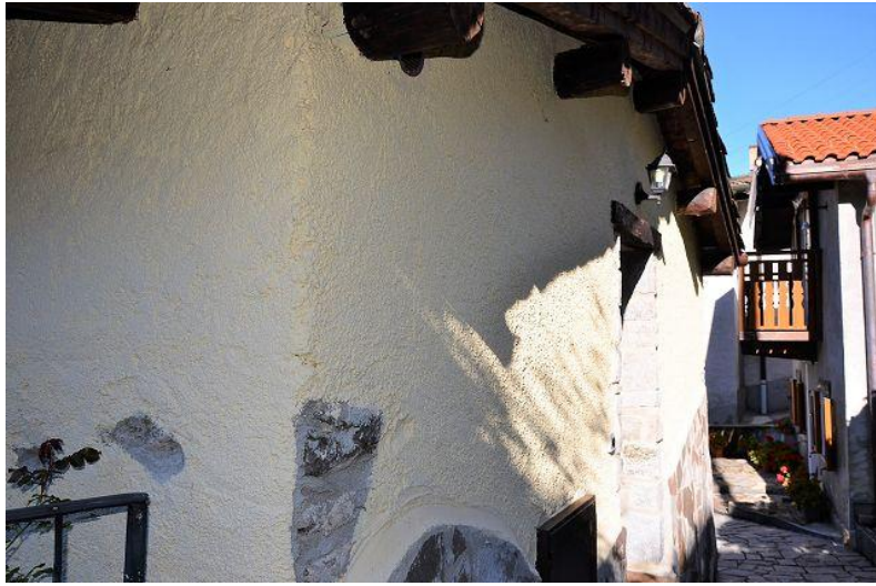
Haus / casa