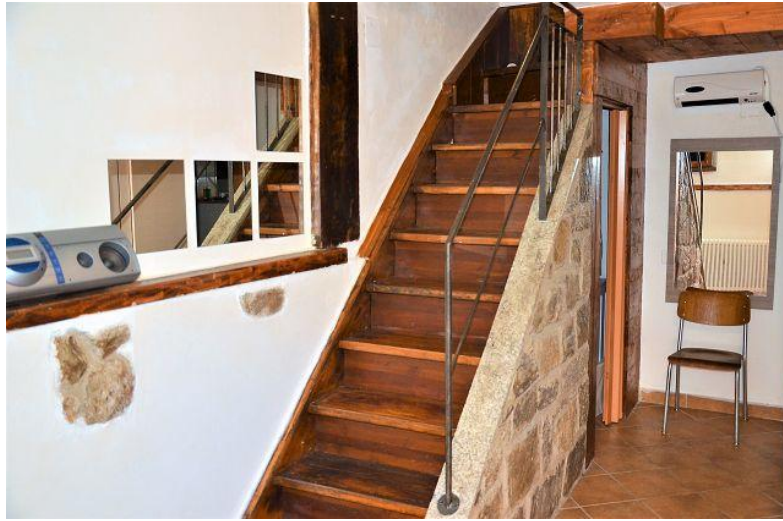
Interne Treppe / scala interna