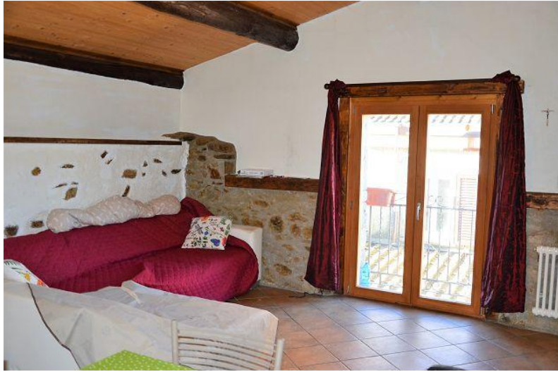
Wohnraum / soggiorno