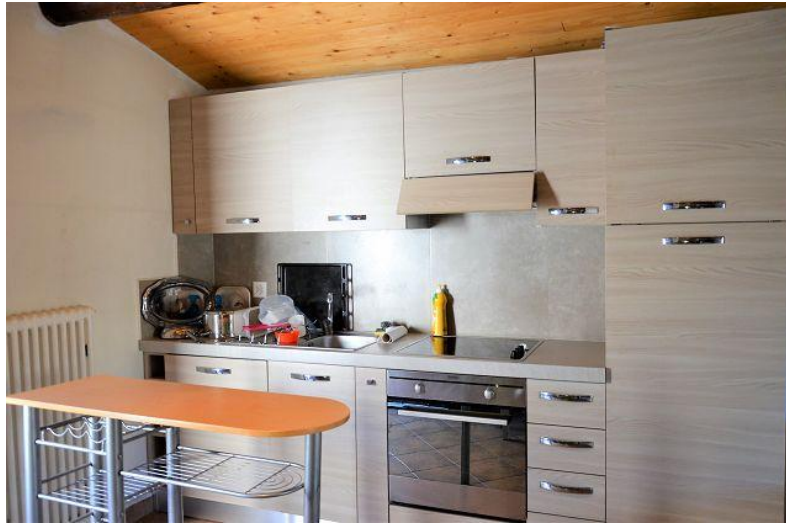
Küche / cucina