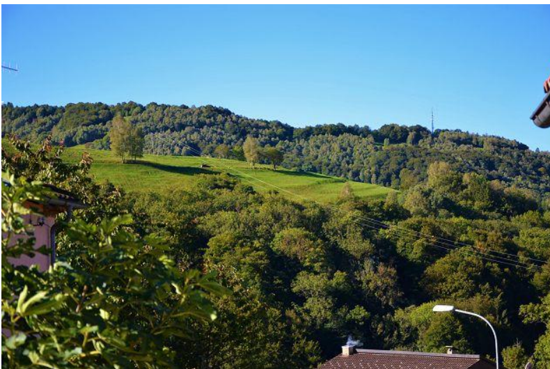
Aussicht / vista