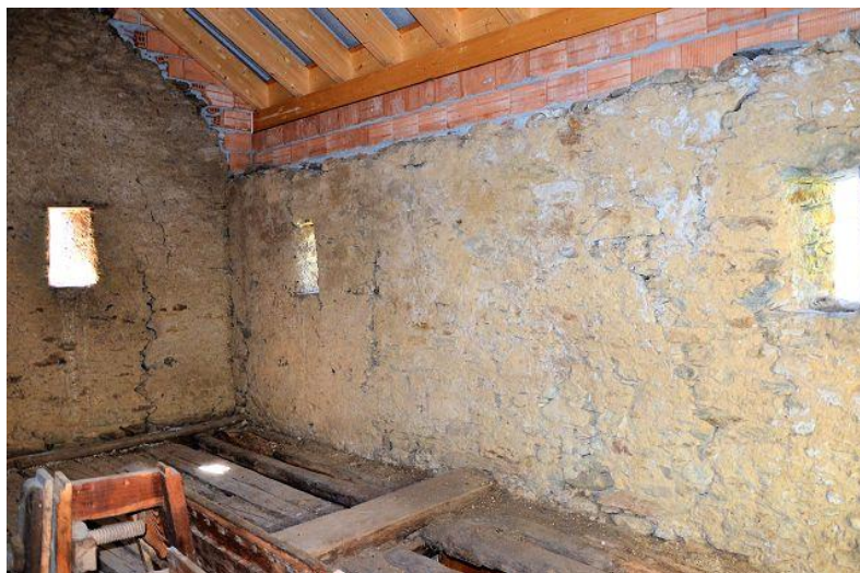
Innenraum oben / interni sopra