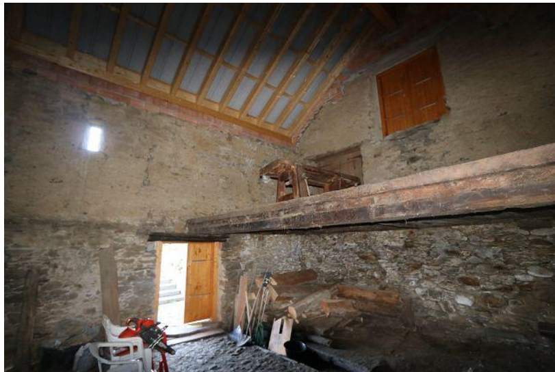
Innenraum unten / interno sotto