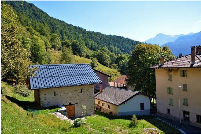
Umgebung / dintorno