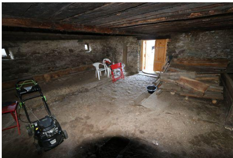
Innenraum unten / interno sotto