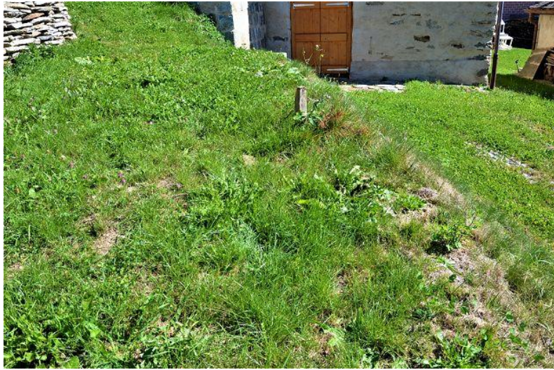
Wiese / prato