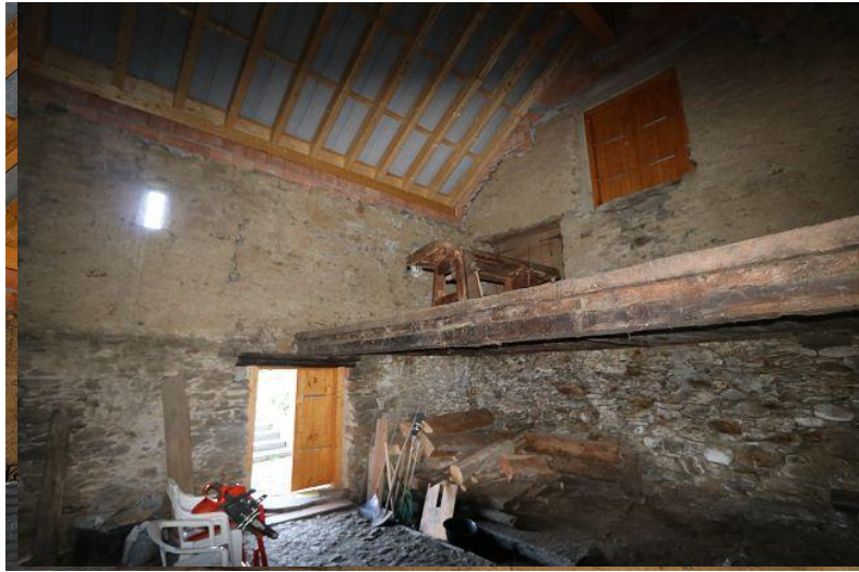
Innenraum oben / interni sopra