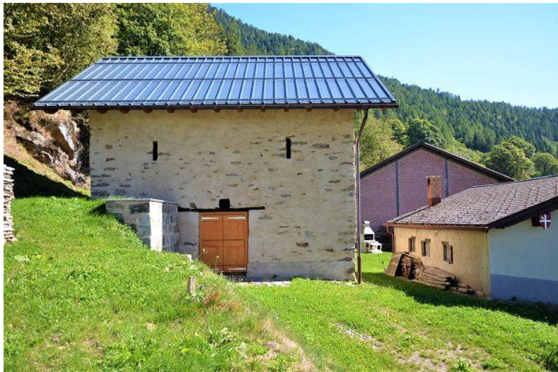
Rustico / rustico