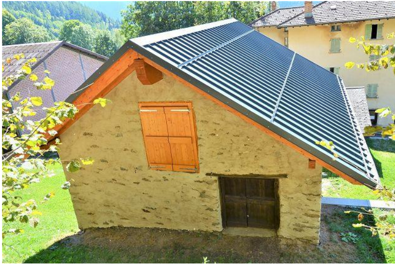
Rustico / rustico