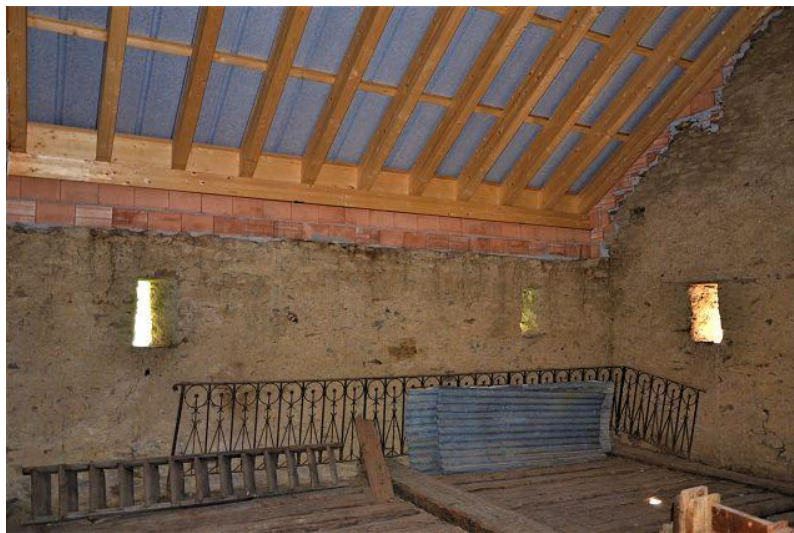
Innenraum oben / interni sopra