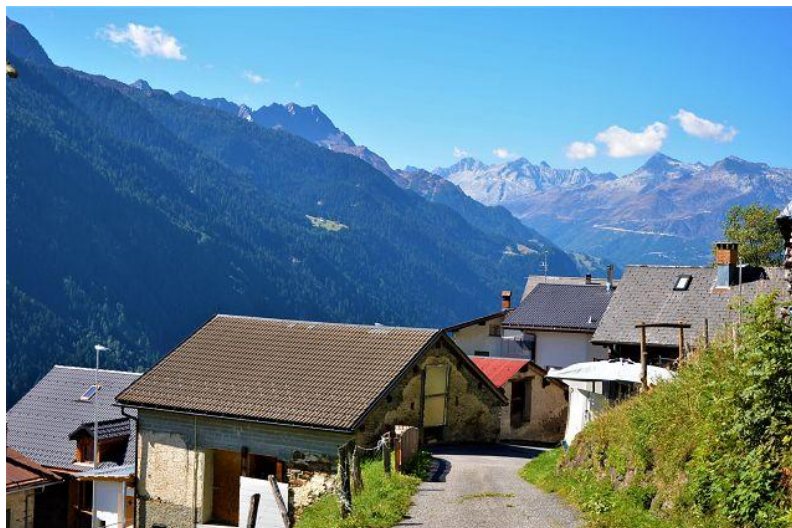
Umgebung Dorf / dintorno paese