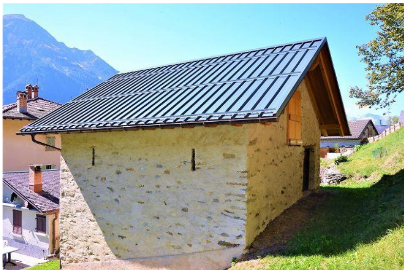
Rustico / rustico