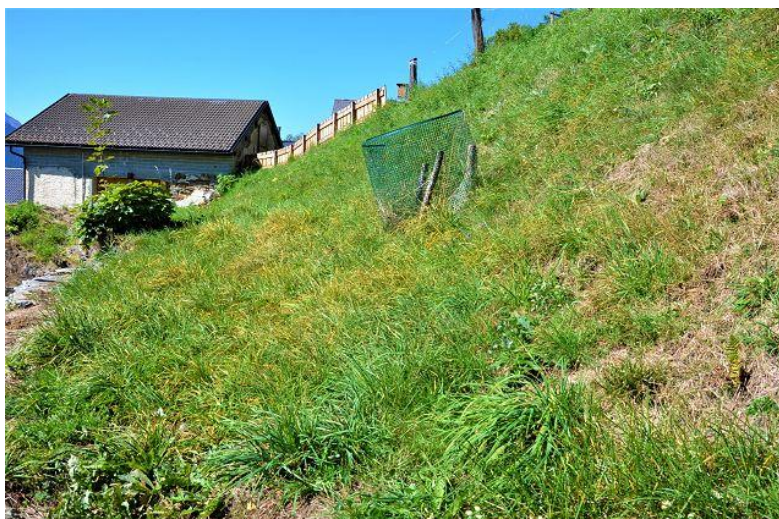
Wiese / prato