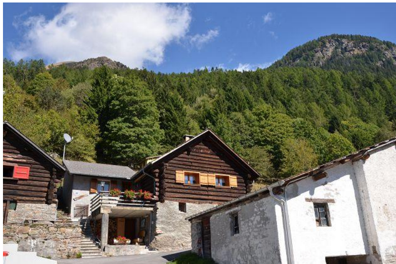
Umgebung Dorf / dintorno paese