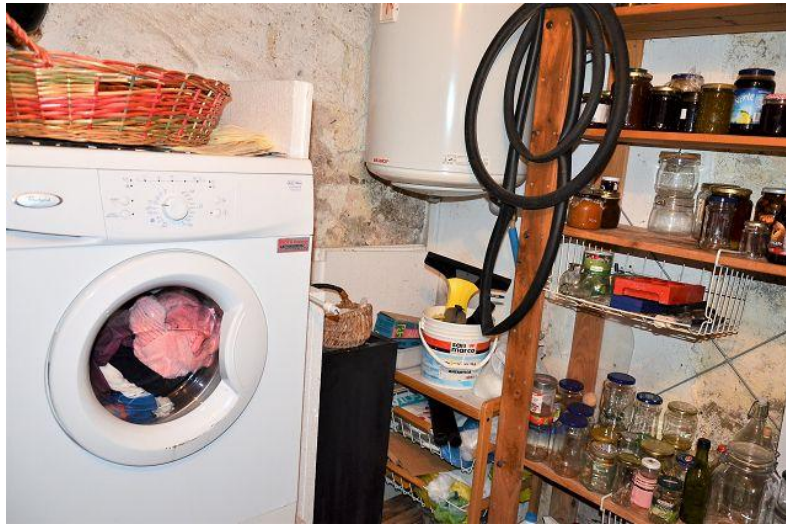
Technischerraum- Waschmaschine / locale tecnico- lavanderia