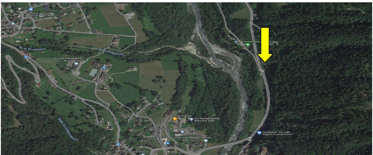
Position / posizione