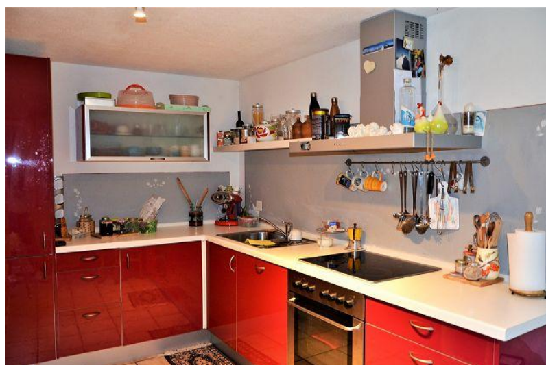
Küche / cucina