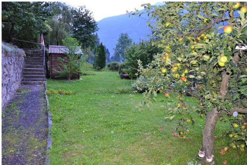
Zugang zum Haus mit Garten / accesso alla casa con giardino