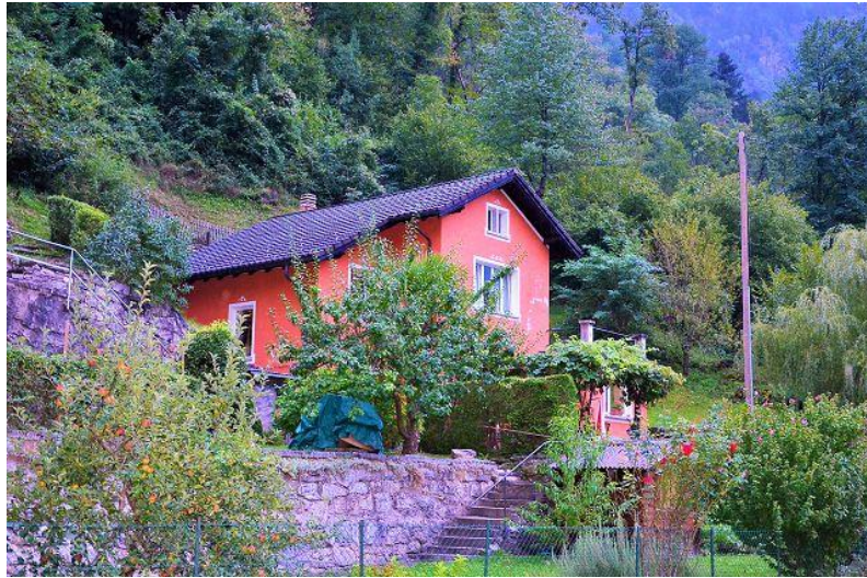
Haus mit Garten / casa con giardino