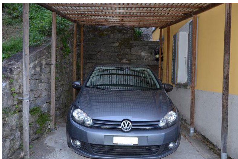
Gedeckter Parkplatz / parcheggio coperto