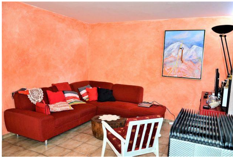
Wohnraum / soggiorno