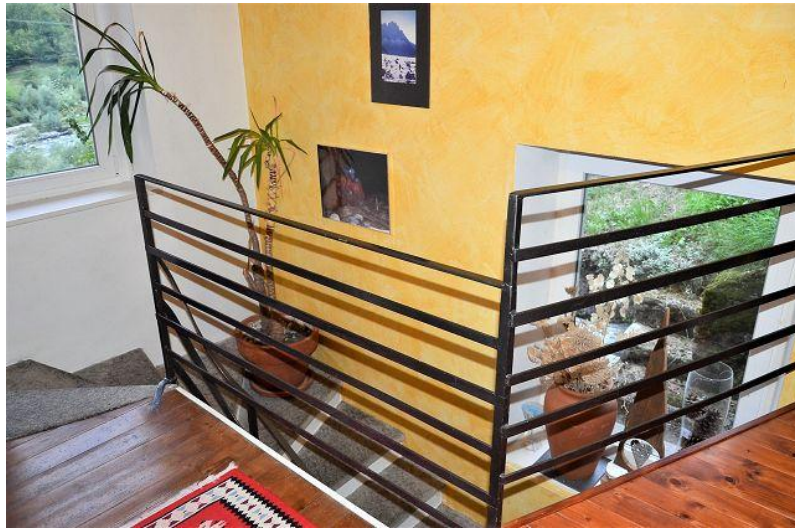
Interne Treppe / scala interna