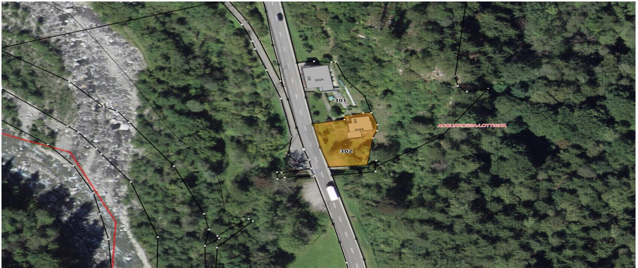
Grundstück / parcella