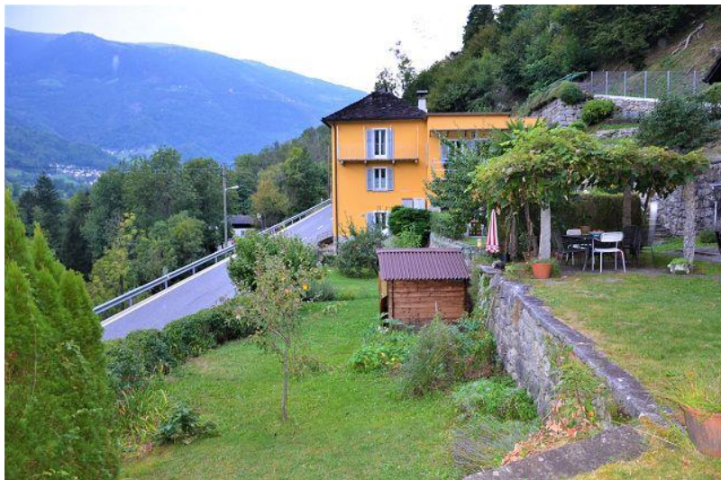
Garten und Pergola / giardino e pergola