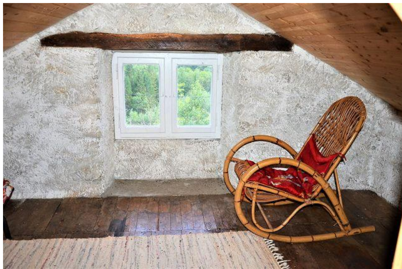
Dachgeschoss / mansarda