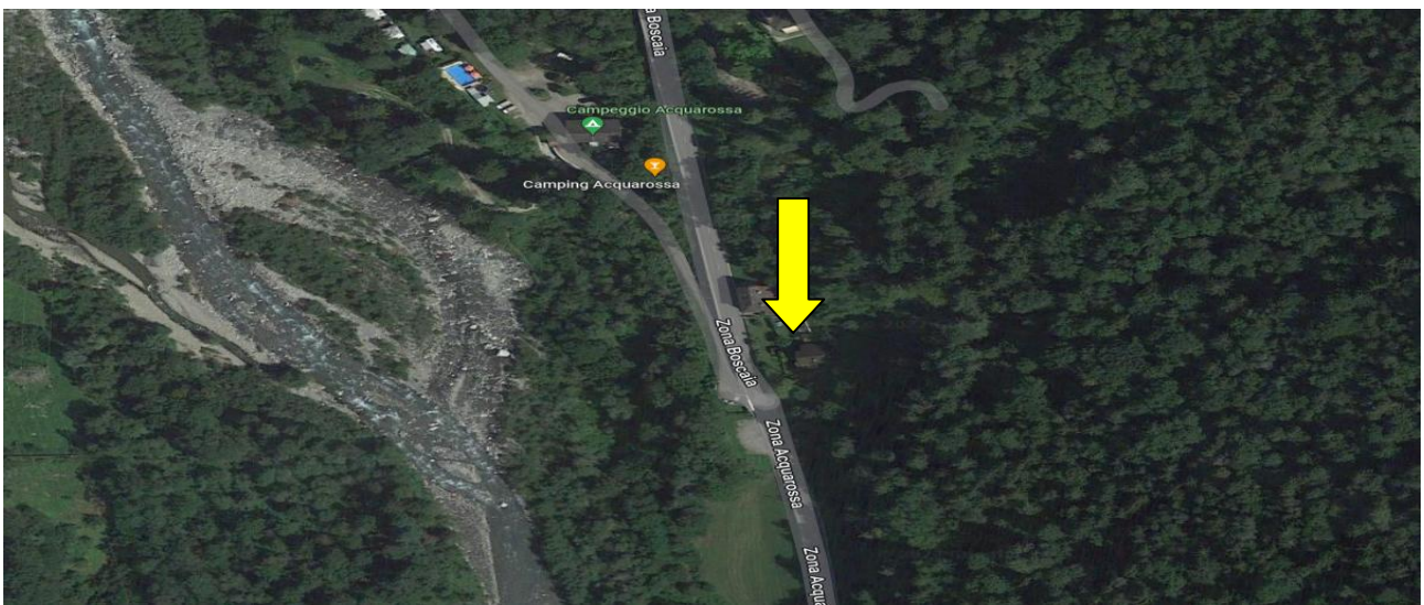
Position / posizione