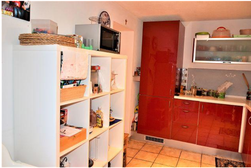
Küche / cucina