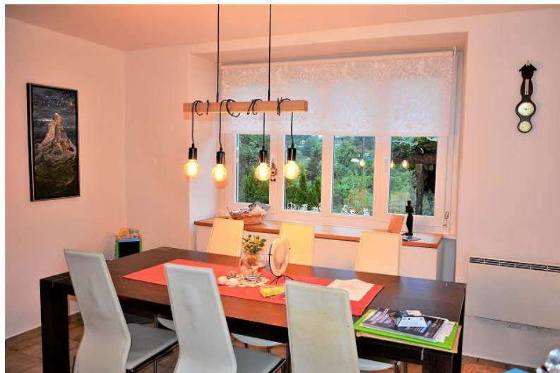
Essraum / sala pranzo