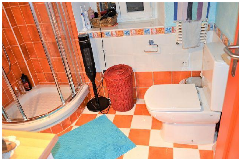
Dusche – WC / doccia - WC