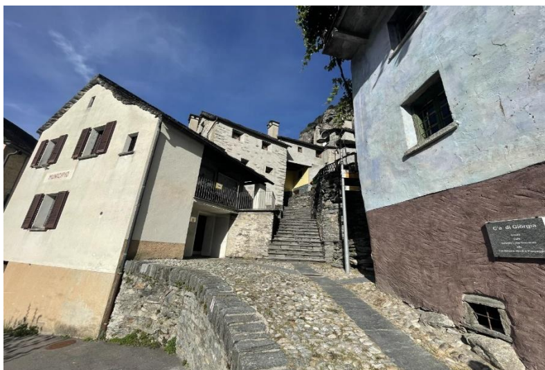
Weg zum Gebäude / sentiero dal rustico