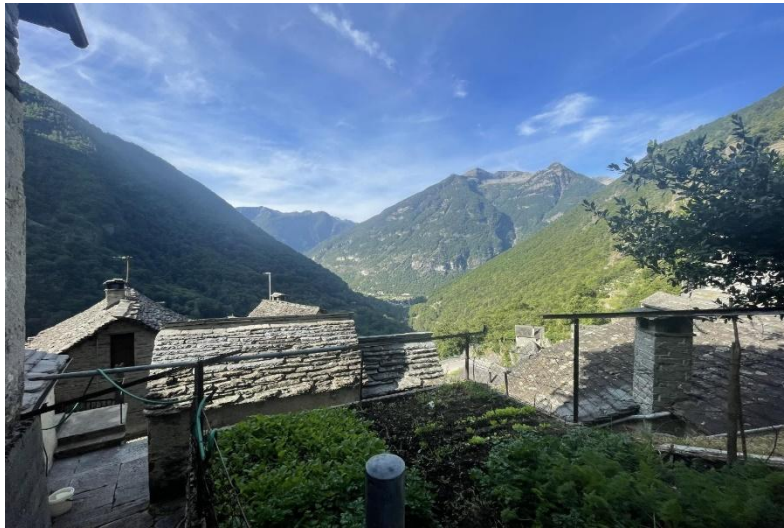
Aussicht und Umgebung / vista e dintorni