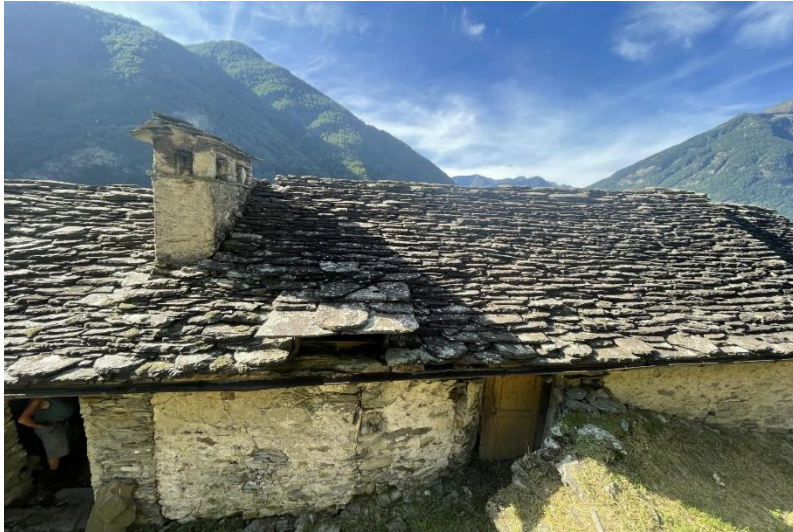
Dach des Rustico / tetto del rustico