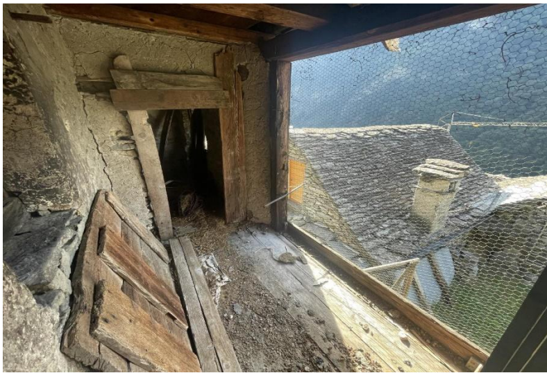
2. Obergeschoss / secondo piano