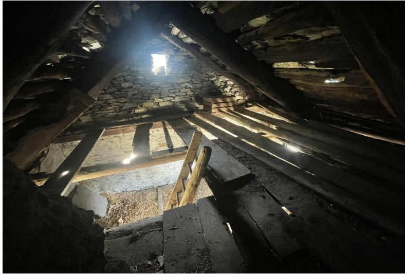
Dachgeschoss / soppalco