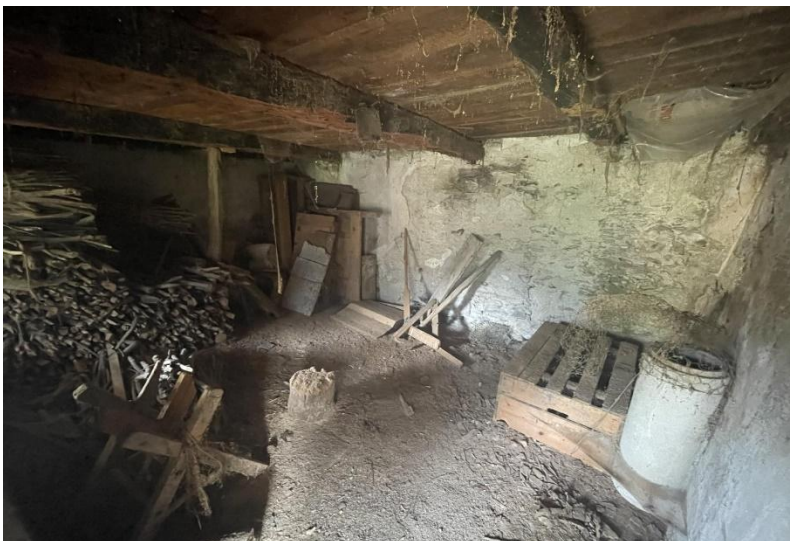
1. Obergeschoss / primo piano