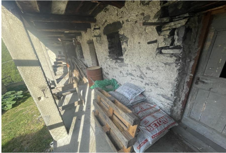
Erdgeschoss / piano terra