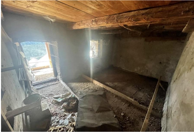
2. Obergeschoss / secondo piano