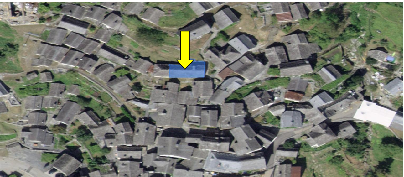
Lage / posizione