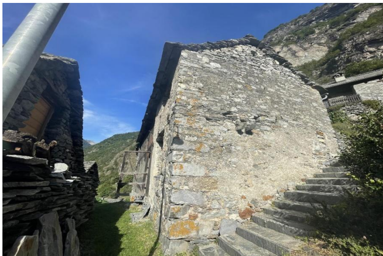
Rustico / rustico