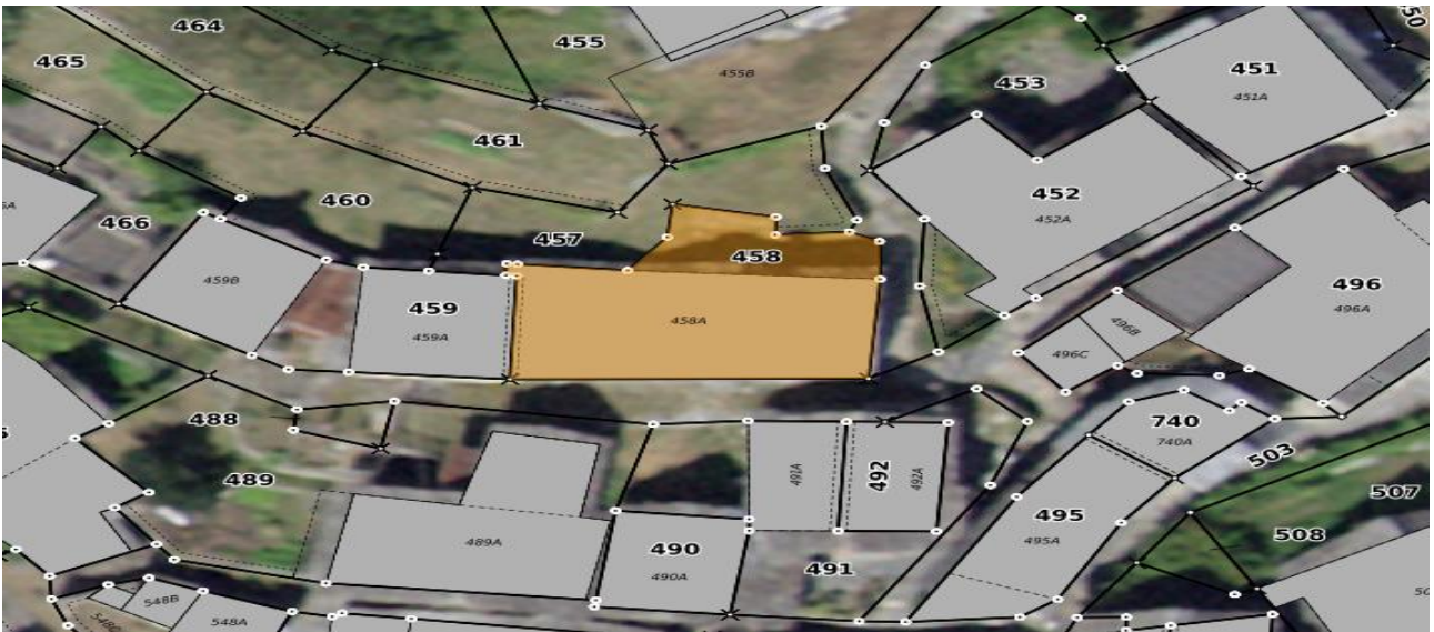
Grundstück / parcella