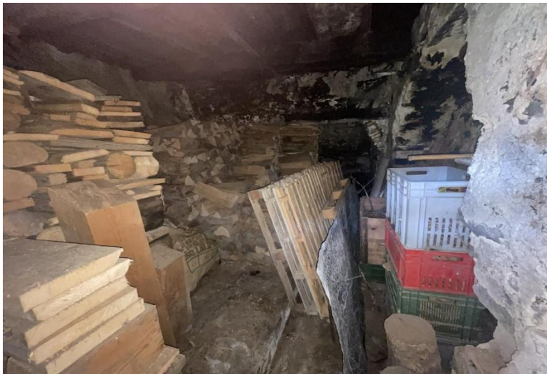
1. Obergeschoss / primo piano