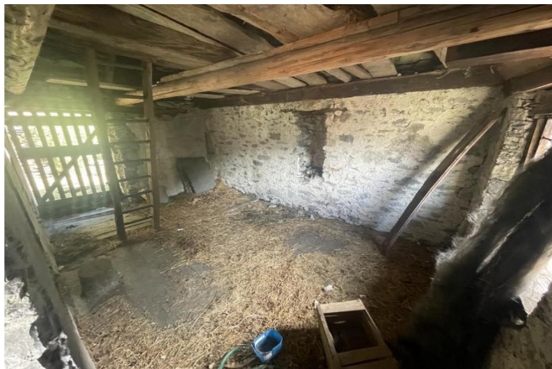
3. Obergeschoss / terzo piano