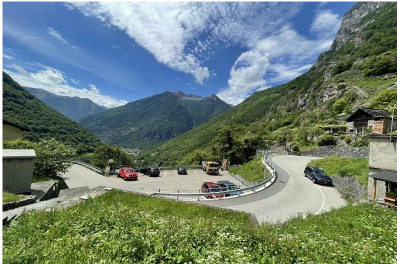
Oeffentliche Parkplätzen / parcheggi comunale