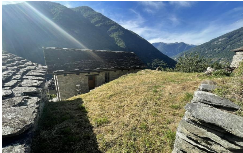
Rustico und Grundstück / rustico e terreno