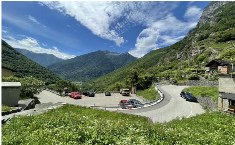
Parkplätze / parcheggi