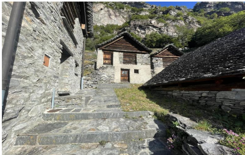
Rustico / rustico