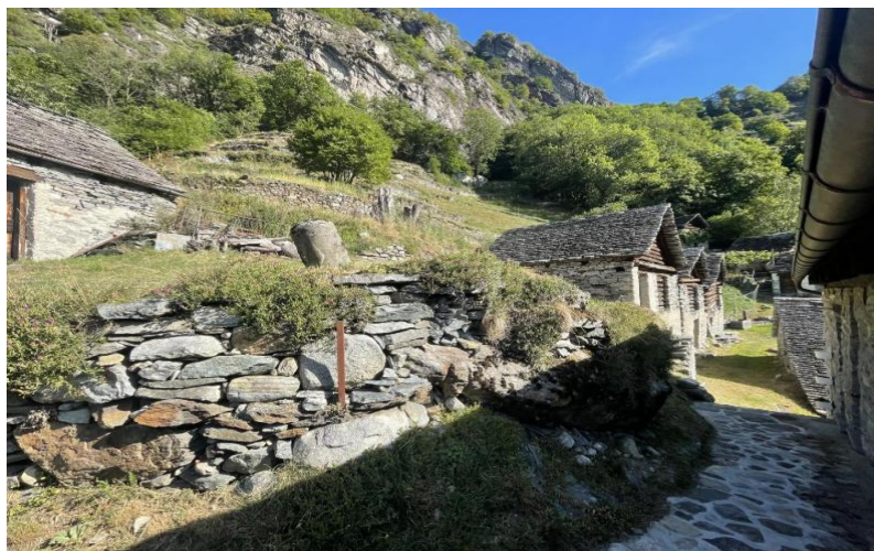
Rustico / rustico