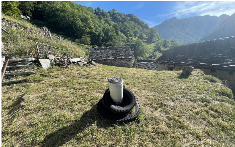
Grundstück / terreno