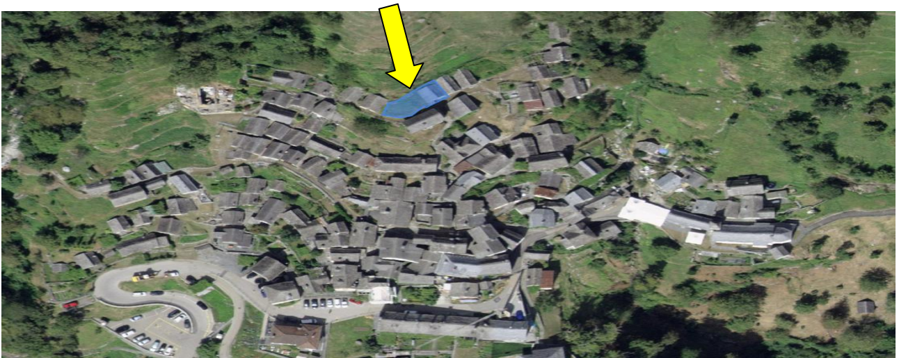
Position / posizione