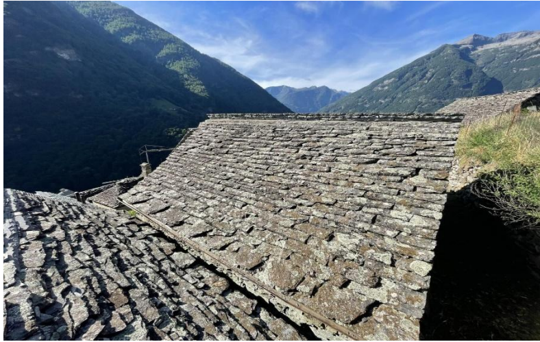
Dach des Rustico / tetto del rustico