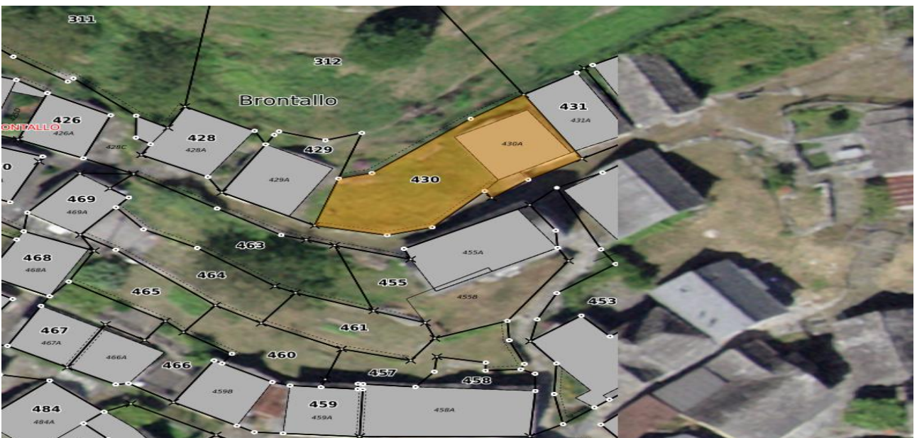
Grundstück / parcella