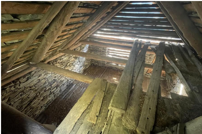
dritter Stock / terzo piano