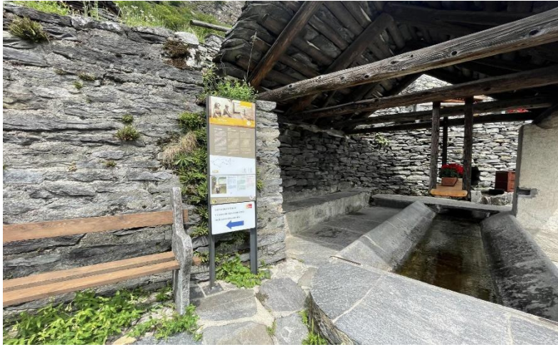
Umgebung / dintorni