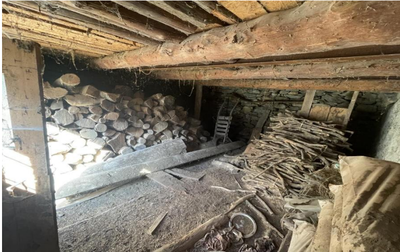
Erster Stock / primo piano