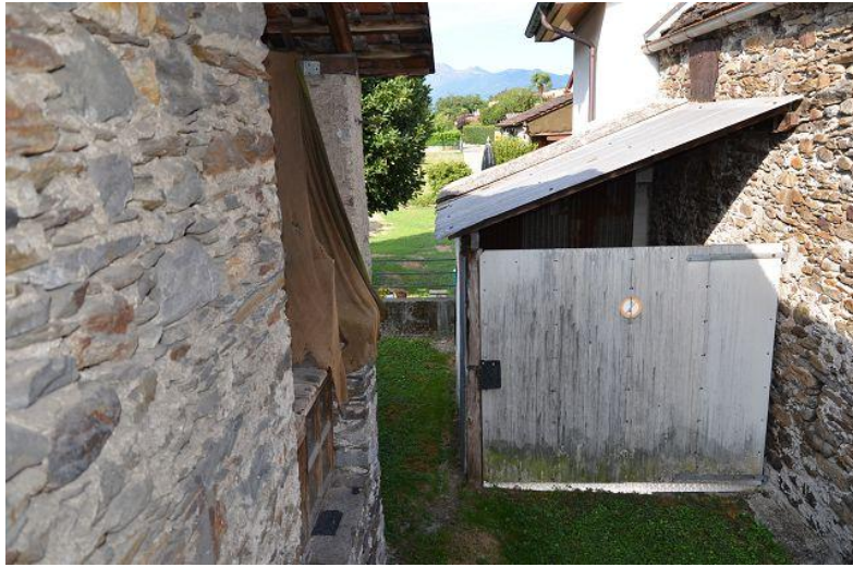
Seitenansicht Rustico / visto lato rustico