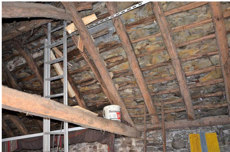
Innenräume Rustico / interni rustico