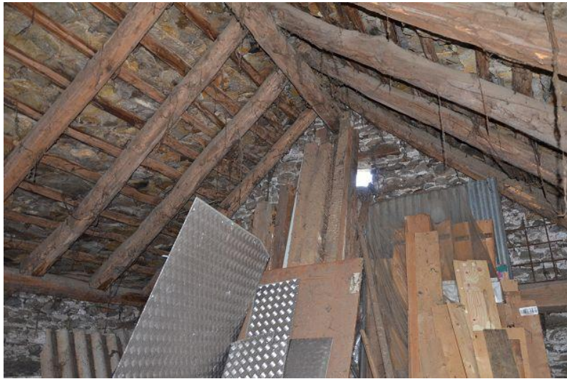
Innenräume 1. Stock / interni PP