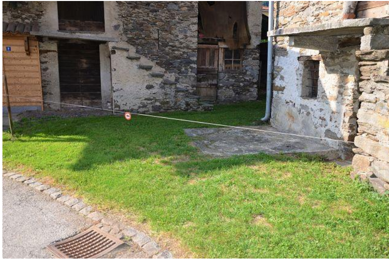
Grundstück neben dem Rustico / terreno vicino al rustico