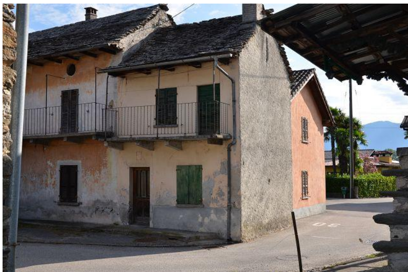
Umgebung / dintorni