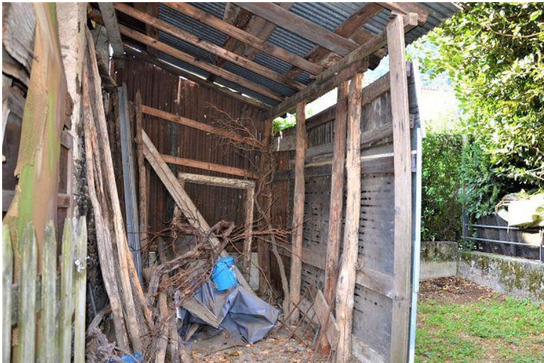
Seitenansicht Rustico / visto lato rustico