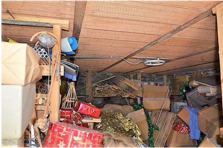
Innenräume EG / interni PT