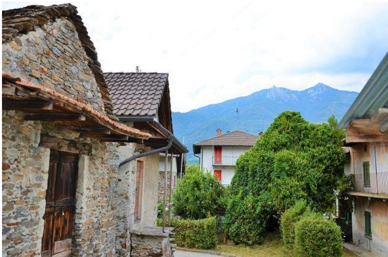
Aussicht / vista