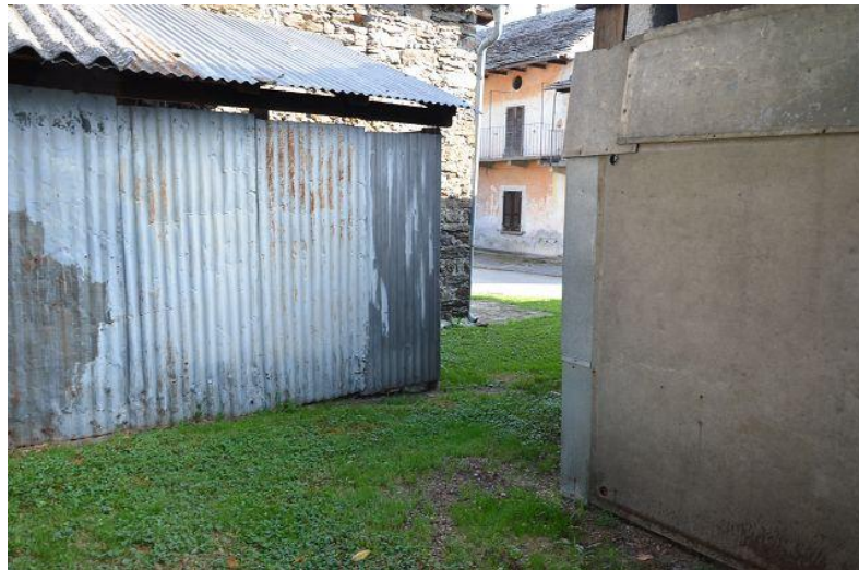
Grundstück neben dem Rustico / terreno vicino al rustico