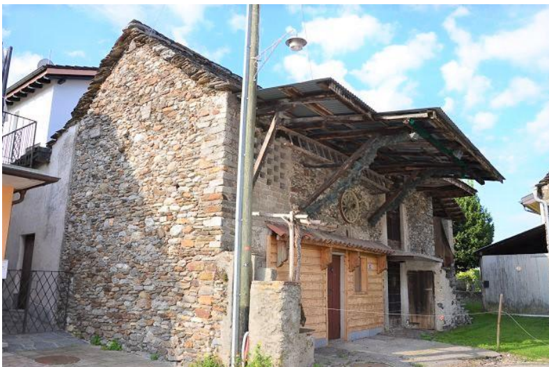
Rustico / rustico