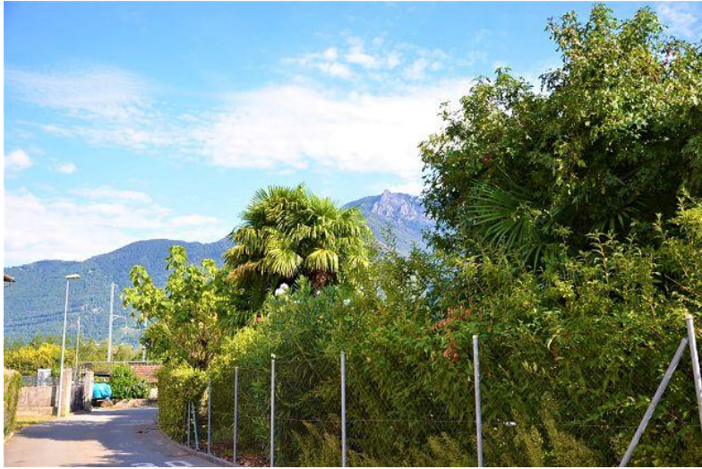
Aussicht / vista