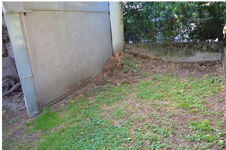
Grundstück neben dem Rustico / terreno vicino al rustico