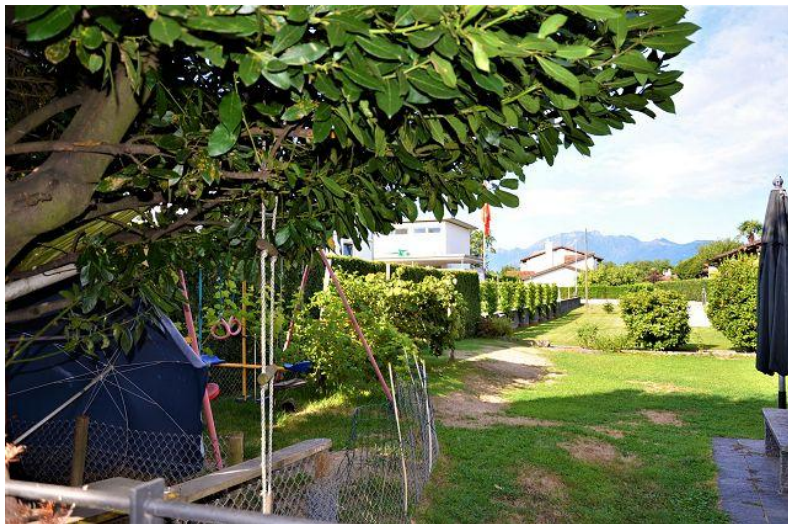
Umgebung / dintorni