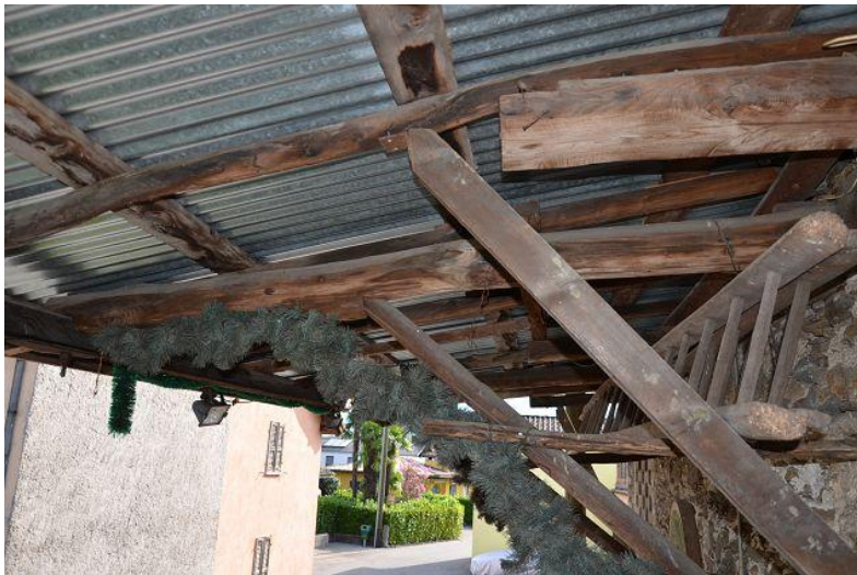
Seitenansicht Rustico / visto lato rustico