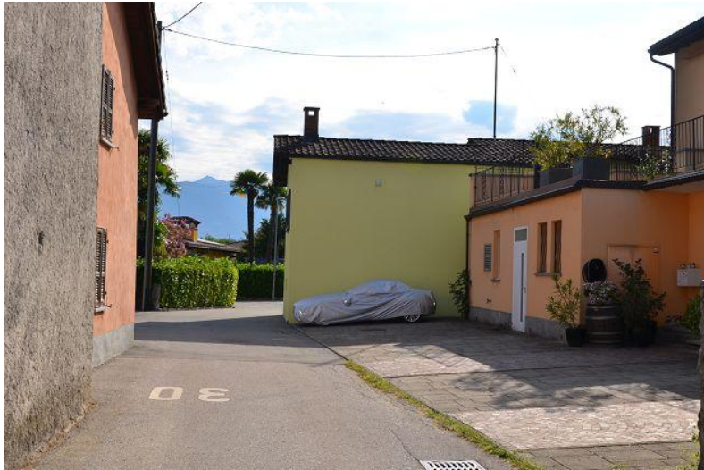
Umgebung / dintorni