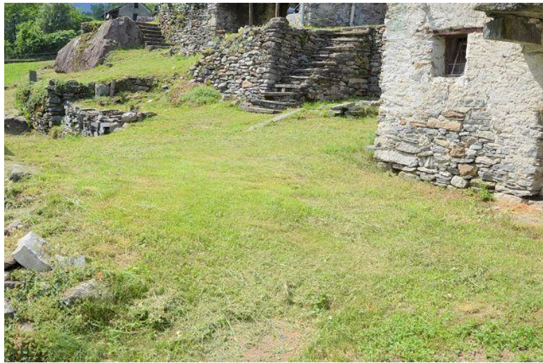
Garten / Giardino