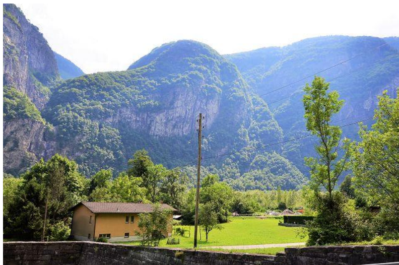
Aussicht / vista