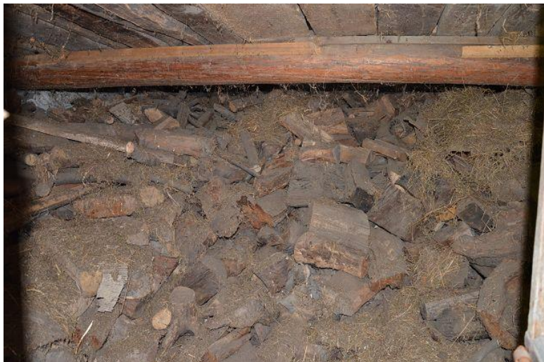
Innenraum / interno