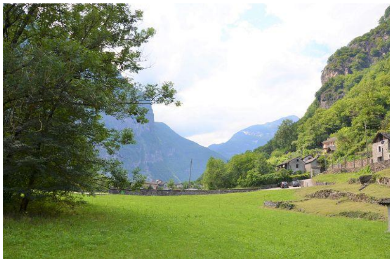
Ausblick / vista