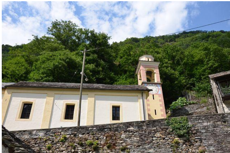
Kirche / chiesa