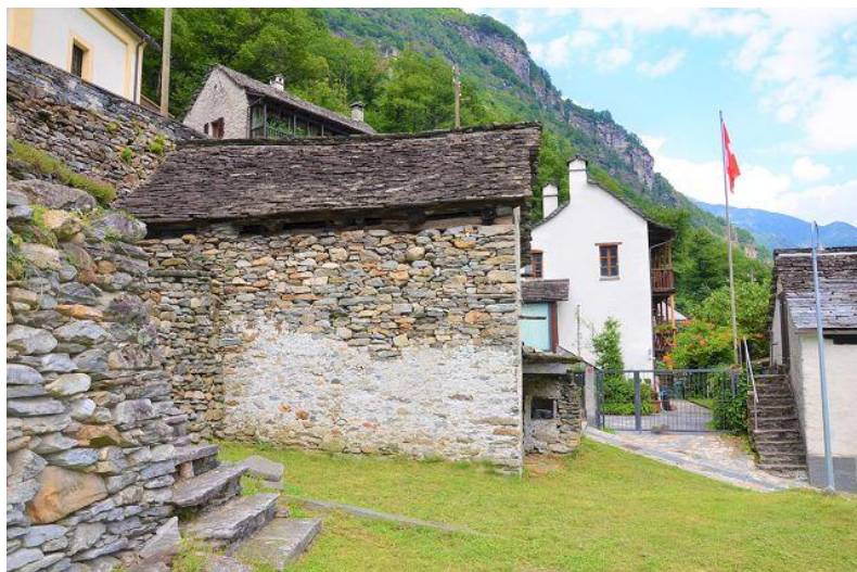
Rustico mit Garten / rustico con giardino