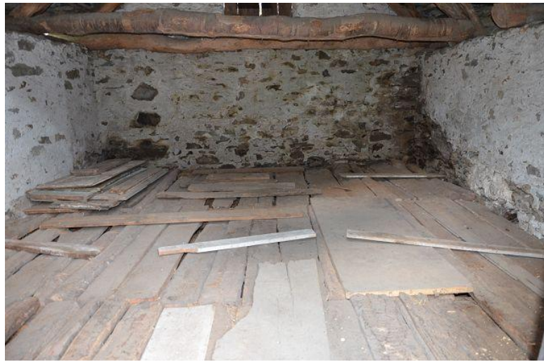
Innenraum / interno