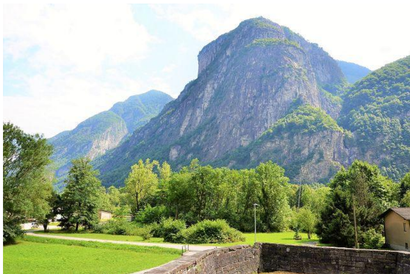
Ausblick / vista