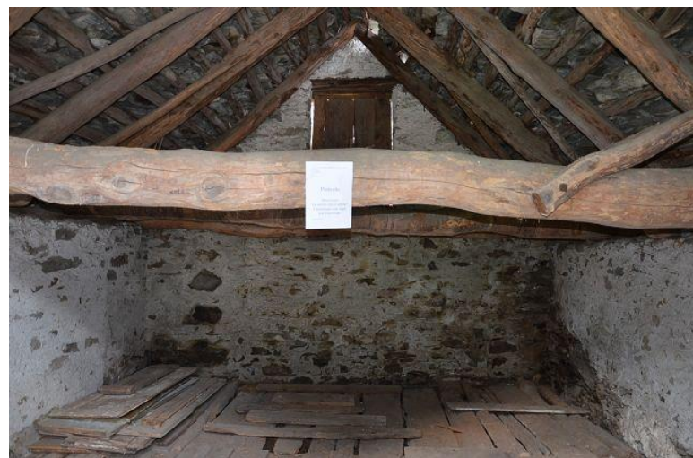
Innenraum / interno