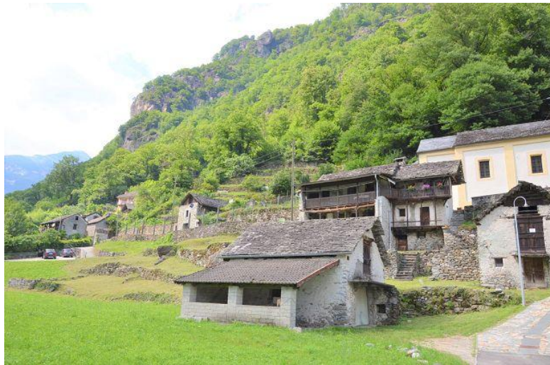
Aussicht / vista