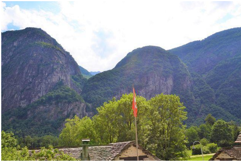
Ausblick / vista