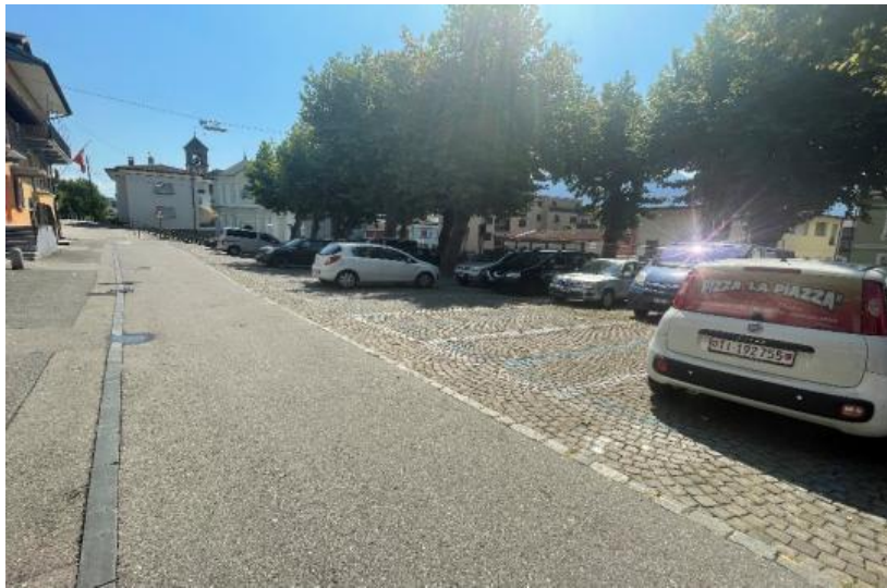
Städtische Parkhäuser / I parcheggi comunali