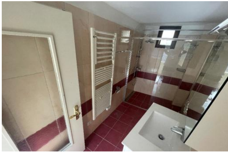
WC mit Dusche / WC con doccia