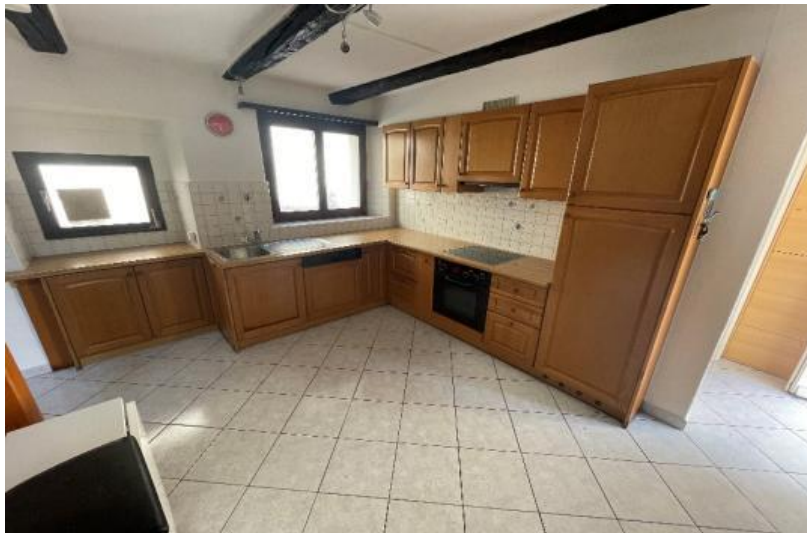
Die Küche / Sala da cucina