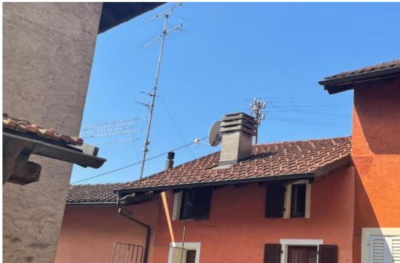
Dach des Gebäudes / Il tetto dell'edificio