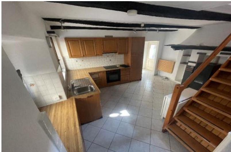
Die Küche / Sala da cucina