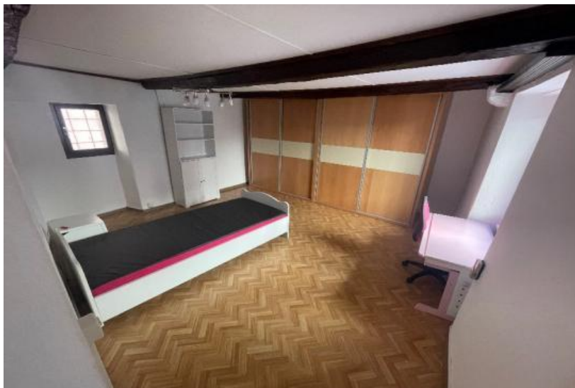
Schlafzimmer in der ersten Etage / La camera da letto