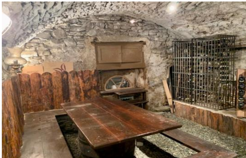
Der Weinkeller / La cantina dei vini