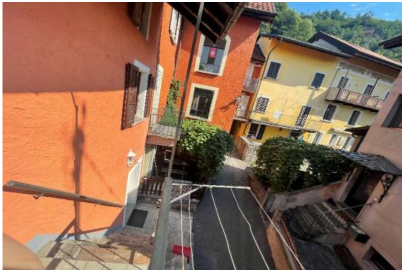
Der Blick auf den Nukleus / La vista del nucleo