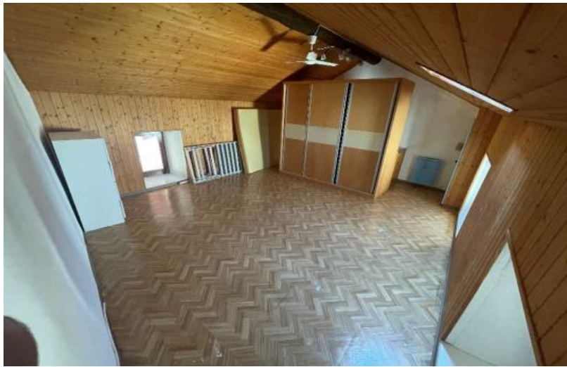
3. Stockwerk / 3° piano