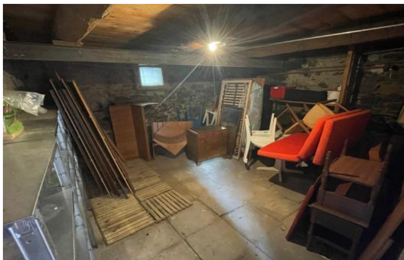
Kellerraum / Sala della cantina