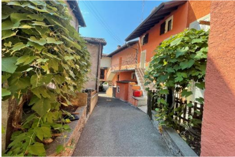
In der Nähe / Nelle vicinanze