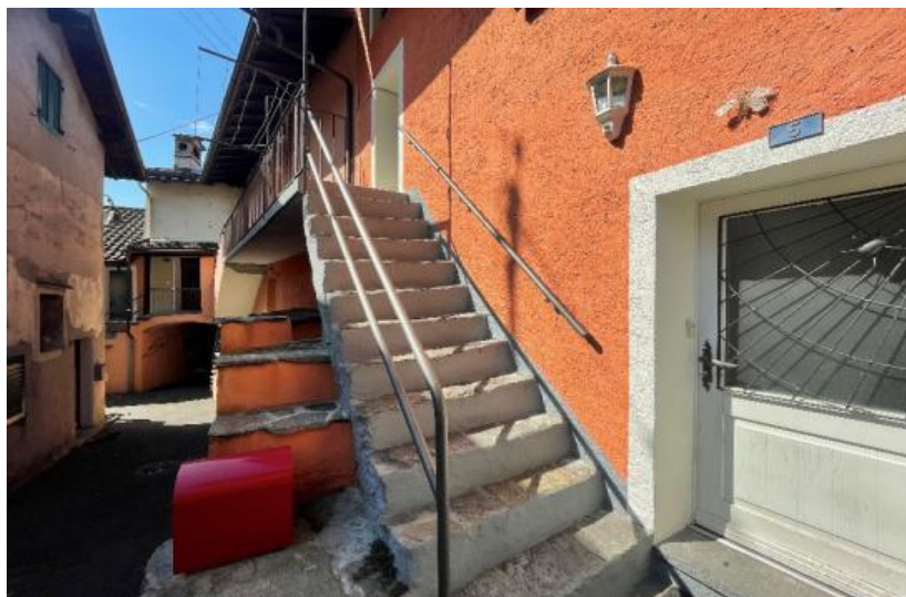
Die Treppe im zweiten Stock / La scala al secondo piano