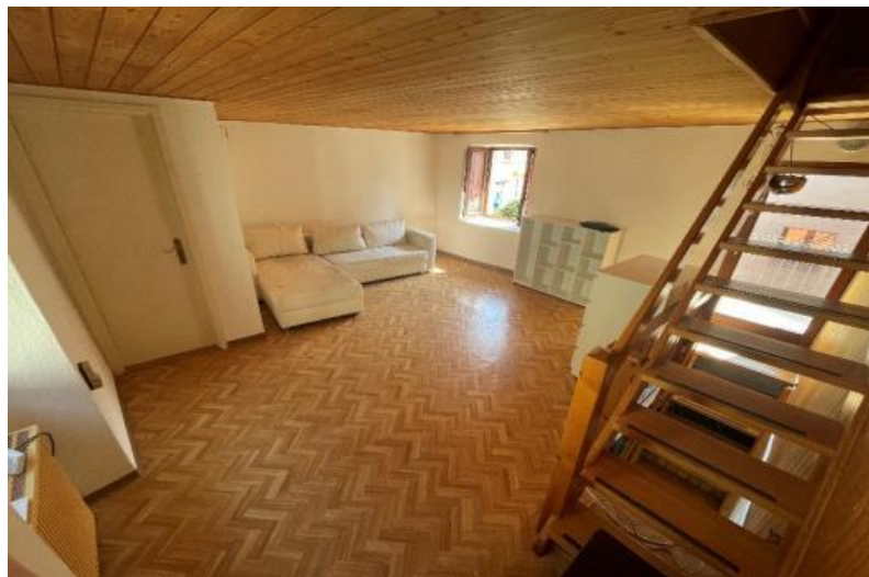
Innenraum OG / interno primo piano