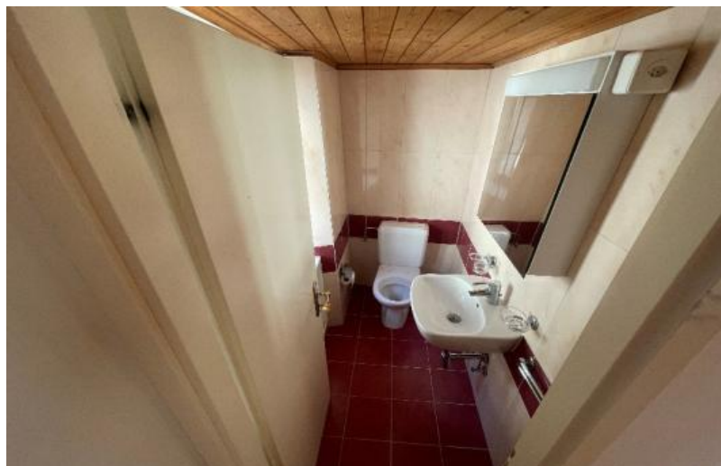
Innenraum OG / interno primo piano