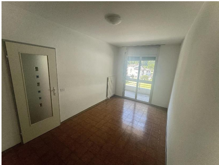
Essraum / sala pranzo