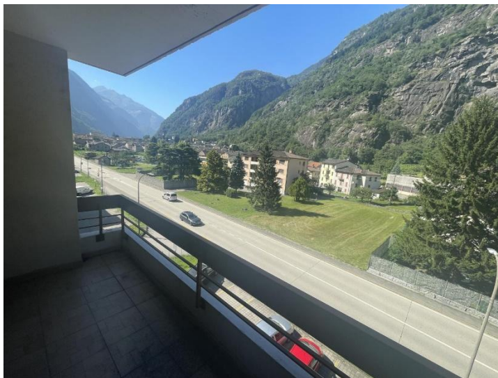
Balkon mit Bergaussicht / balcone con vista montagne