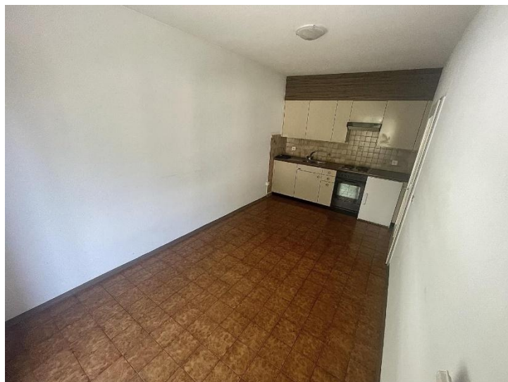
Küche - Essraum / cucina - sala pranzo