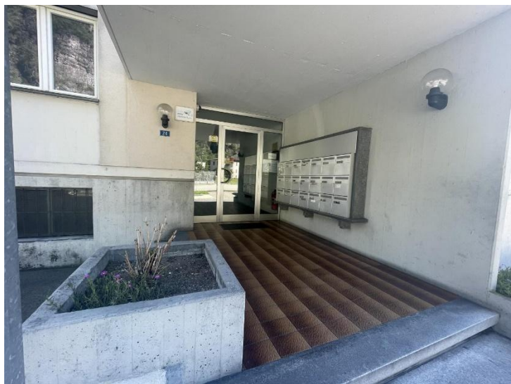
Haupteingang / entrada principale