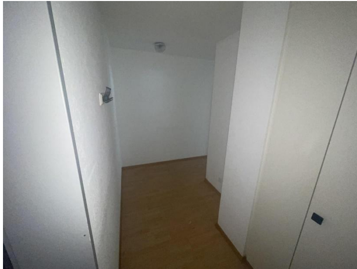
Gang / corridoio