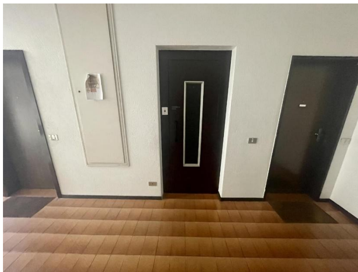
direkter Lift in den 4° Stock / ascensore diretto al 4° piano