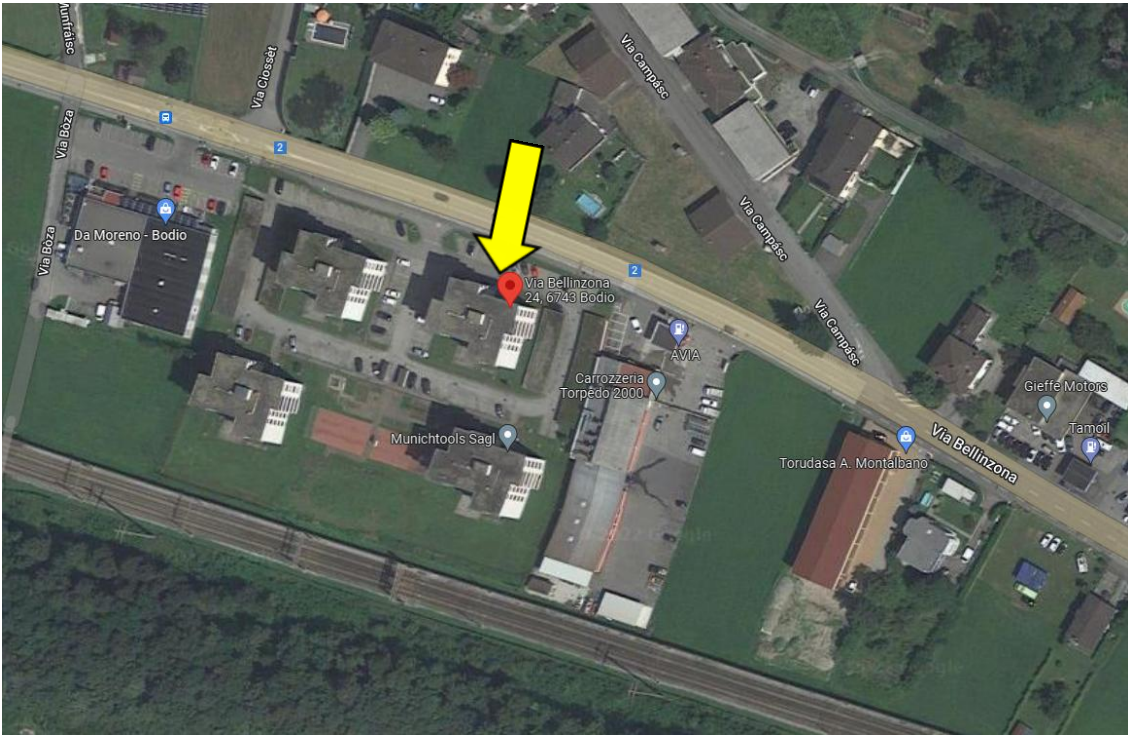
Position / posizione