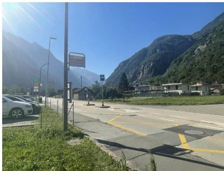
Aussicht und Bushaltestelle / vista e fermata del bus