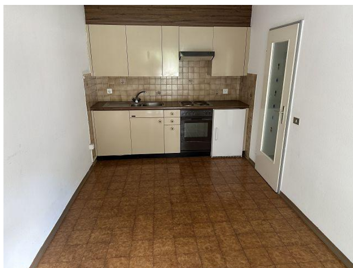
Küche - Essraum / cucina - sala pranzo