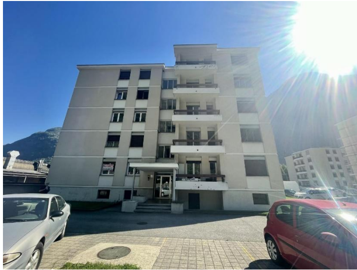
Wohnblock / condominio