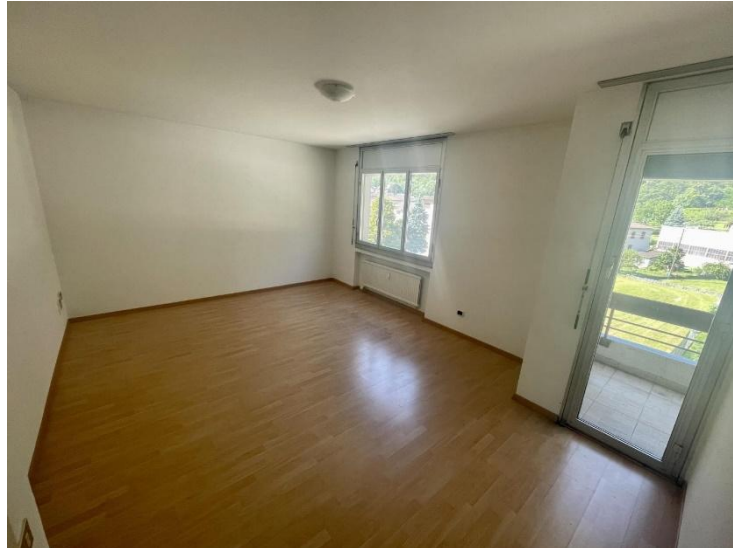
Wohnraum / soggiorno