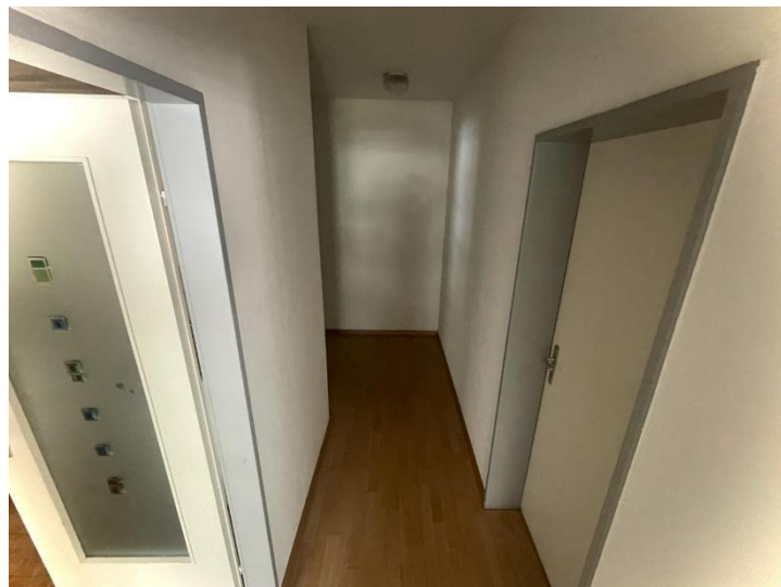
Gang / corridoio