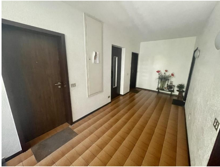
Treppenhaus 4° Stock / corridoio 4° piano