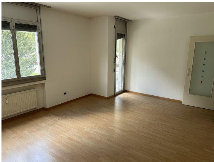
Essraum / sala pranzo