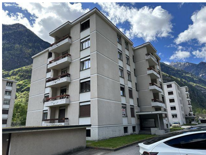
Haus / casa