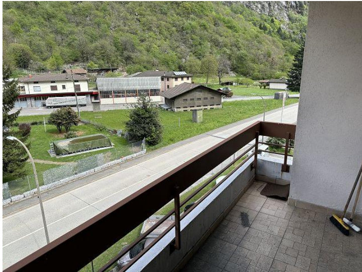
Gang / corridoio