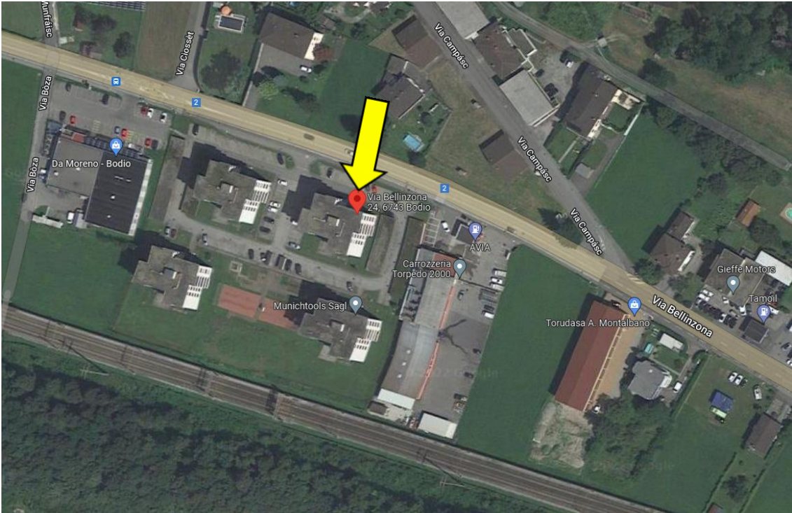
Position / posizione