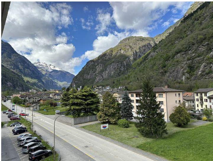
direkter Lift in den 4° Stock / ascensore diretto al 4° piano