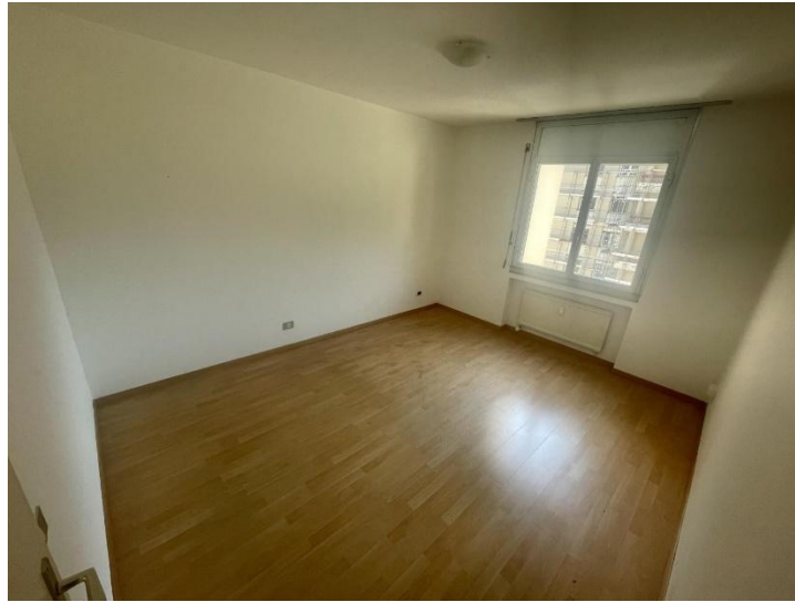
Schlafzimmer / camera