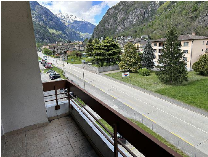
Balkon mit Bergaussicht / balcone con vista montagne