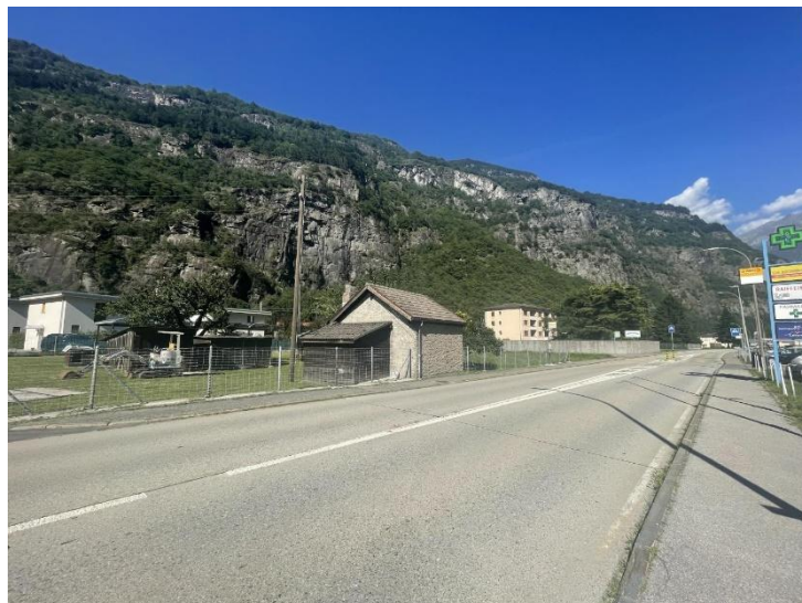
Umgebung / dintorni