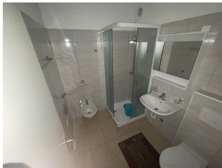
WC – Dusche / WC - doccia