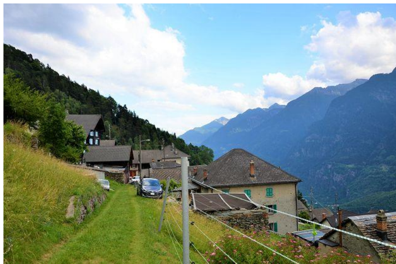
Zugang zum Grundstück / accesso al terreno