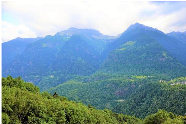
Aussicht / vista