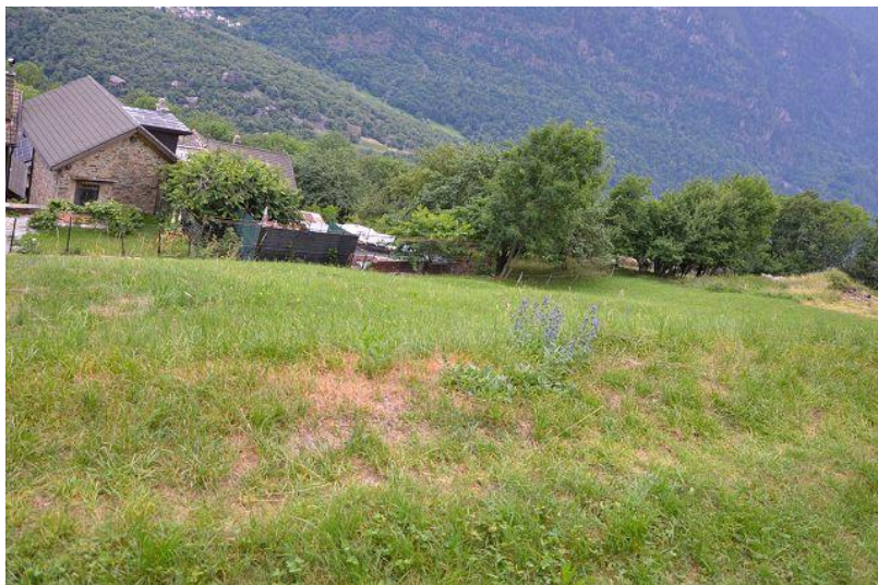
Grundstück / terreno