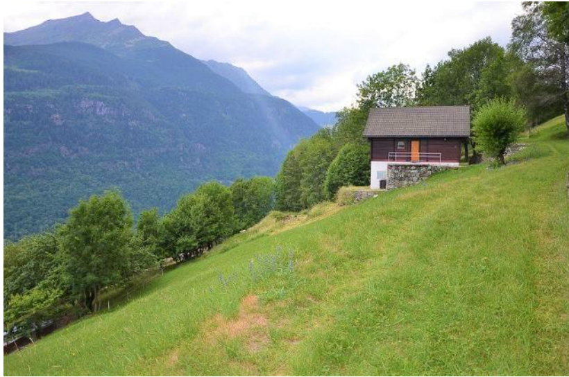
Grundstück / terreno