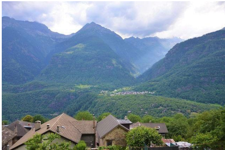
Dorfkern / nucleo