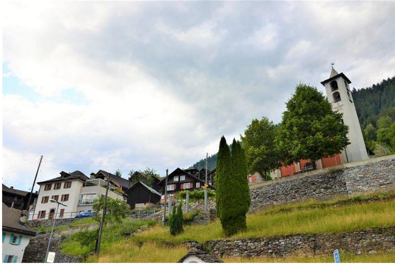
Dorfkern / nucleo